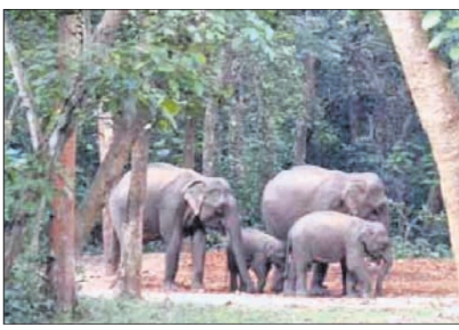
କୁଲଡ଼ିହାରେ ଥିବା ହାତୀ।

ହେଲା ଏହି ଅଭୟାରଣ୍ୟ ହାତୀ ଓ ଅନ୍ୟ ବନ୍ୟପ୍ରାଣୀଙ୍କ ପାଇଁ ଅସୁରକ୍ଷିତ ହୋଇପଡ଼ୁଥିବା ଅଭିଯୋଗ ହେଉଛି। କେତେବେଳେ ଜଙ୍ଗଲରେ ଖାଦ୍ୟଭାବ ତ ଆଉ କେତେବେଳେ ଜଙ୍ଗଲ ନିଆଁ ଦାଉ ଯାକୁଛି। ଫଳରେ ପ୍ରତିକୂଳ ପ୍ରଭାବ ହେବୁ ଜଙ୍ଗଲୀ ଜନ୍ତୁଙ୍କ ପାଇଁ ସଂକଟ ସୃଷ୍ଟି ହେଉଛି। ଯାହାର ପରିଣାମ ସ୍ୱରୂପ ବନ୍ୟଜନ୍ତୁ ଜନସଂପତ୍ତିମୁହାଁ ହେଉଛନ୍ତି। ଏପରି କି ୨୦୧୭ ପରଠାରୁ ଅଭୟାରଣ୍ୟରେ କେତେ ହାତୀ ଅଛନ୍ତି, ତାହା ବନ ବିଭାଗକୁ ଜଣା ନ ଥିବାବେଳେ ମୃତ୍ୟୁ ସଂଖ୍ୟା ବଢ଼ିଚାଲିବା ପ୍ରାଣୀପ୍ରେମୀଙ୍କୁ ବ୍ୟଥା କରୁଛି। ପୃଷ୍ଠା-୪