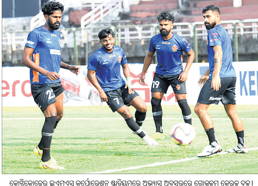
କୋଡ଼ିକୋଡ଼େର ଇଏମ୍‌ଏସ୍ କର୍ପୋରେଶନ ଷ୍ଟାଡ଼ିୟମରେ ଅଭ୍ୟାସ ସମୟରେ ଗୋକୁଳମ୍ କେରଳ ଦଳ।