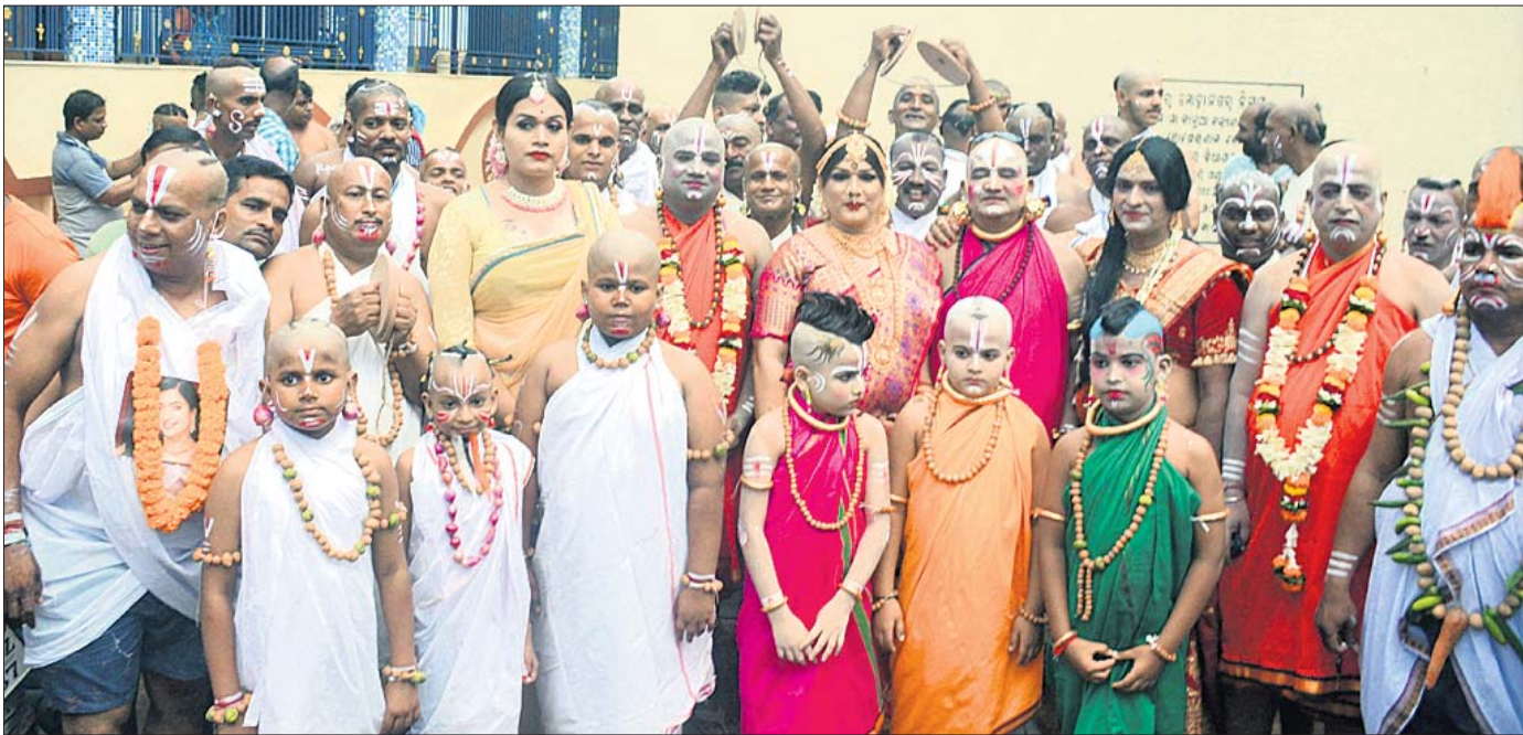
ବ୍ରହ୍ମପୁର ଠାକୁରାଣୀ ଯାତ୍ରା ଅବସରରେ ଶୁକ୍ରବାର ବିକିପୁର ଅଞ୍ଚଳରେ ଲଣ୍ଡା ବେଶଧାରୀମାନେ।

ସରକାର ଏବେ ସମସ୍ତ ଘରୋଇ ସ୍ୱାସ୍ଥ୍ୟ ପ୍ରତିଷ୍ଠାନରେ ପ୍ରସବକ୍ରମ ଅସ୍ତ୍ରୋପଚାର ଅତିରିକ୍ତ କର୍ମୀଙ୍କୁ ଯୋଗଦେଇ ଏହି ପ୍ରସଙ୍ଗରେ ଶିକ୍ଷା ପ୍ରଦାନ କରିବା ପାଇଁ ଯତ୍ନ କରିବା ପରେ ଫର୍ମାଟ-ସିରେ ସ୍ୱାସ୍ଥ୍ୟ ଓ ପରିବାର କଲ୍ୟାଣ ନିର୍ଦ୍ଦେଶାଳକଙ୍କ ପକ୍ଷରୁ ସମସ୍ତ ଜିଲ୍ଲା ମୁଖ୍ୟ ଚିକିତ୍ସା ଅଧିକାରୀ ଓ ସହରାଞ୍ଚଳର ଜନସ୍ୱାସ୍ଥ୍ୟ ଅଧିକାରୀଙ୍କୁ ନିର୍ଦ୍ଦେଶ ଦିଆଯାଇଛି। ଆସନ୍ତା ମେ ୧୯ରୁ ଏହି ଅତିରିକ୍ତ କର୍ମୀଙ୍କୁ କୁହାଯାଇଛି। ପୂର୍ବରୁ ସମସ୍ତ ସରକାରୀ ହସ୍ପିଟାଲ ପାଇଁ ଏହି ଅତିରିକ୍ତ କର୍ମୀଙ୍କୁ ନିଯୁକ୍ତ କରାଯାଇଛି। ଏବେ ଏହି ଅତିରିକ୍ତ ଘରୋଇ ହସ୍ପିଟାଲକୁ ସମ୍ପର୍କିତ କରାଯାଇଛି। ମିଳିତ ଭାବେ କୃତ୍ୟ ଅନୁଯାୟୀ ଅସ୍ତ୍ରୋପଚାରକ୍ରମ ପ୍ରସବ ସଂଖ୍ୟା କ୍ରମାଗତ ଭାବେ ବୃଦ୍ଧିପାଇଛି। ଜାତୀୟ ପରିବାର ସ୍ୱାସ୍ଥ୍ୟ