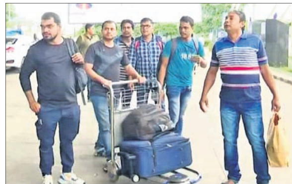
ଭୁବନେଶ୍ୱର ବିମାନବନ୍ଦରରେ ସୁଦାନରୁ ଫେରିଥିବା ୬ ଓଡ଼ିଆ।

ଭୁବନେଶ୍ୱର, ୨୮୪ (ବୁଧବୋ) ସୁଦାନରେ ମିଲିଟାରି ଓ ପାରିବାହୀ ମଧ୍ୟରେ ହିଂସା ଲାଗିରହିଥିବାବେଳେ ସେଠାରେ ପ୍ରାୟ ୧୫ ଓଡ଼ିଆଙ୍କ ସମେତ ୩,୨୦୦ ଭାରତୀୟ ଫସି ରହିଥିଲେ। ଭାରତ ସରକାରଙ୍କ ଅପରେଶନ କାବେରୀ ତଥା ରାଜ୍ୟ ସରକାରଙ୍କ ଉଦ୍ୟମ କ୍ରମେ ଜର୍ମାନୀକୁ ୬ଜଣ ଓଡ଼ିଆ ଫେରିଛନ୍ତି। ଶୁକ୍ରବାର ଭୁବନେଶ୍ୱର ବିମାନ ବନ୍ଦରରେ ପହଞ୍ଚିବା ପରେ ସୁଦାନରେ ଲାଗି ରହିଥିବା ହିଂସାର ଛାଡ଼ିଥାନ୍ତା ଅନୁଭୂତି ବଖାଣିବା ସହ ସେମାନେ ଏକ ନୂଆ ଜୀବନ ପାଇଥିବା କହିଛନ୍ତି। ଭୋକ ଉପାସରେ ୯ ଦିନ ତାହା ଯାଇଥିବା ବୋମା ଓ ବୁଲି ଶବ୍ଦ ବହୁଳ ମୂଳରେ ଲୁଟପାଟ୍ ଏମିତି ଭୟଙ୍କର ଅନୁଭୂତି ନେଇ ଫେରିଛନ୍ତି।