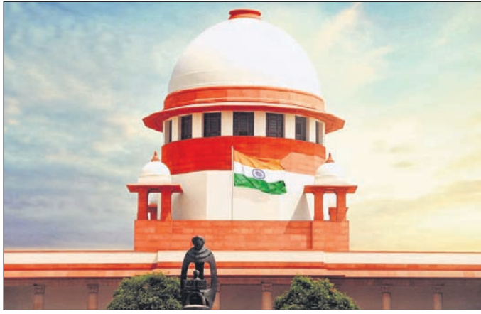
ଅକ୍ଟୋବର ୨୧ ରାଜ୍ୟ ଦେବାବେଳେ ଧର୍ମ ନାମରେ ଆମେ କେଉଁଠି ପହଞ୍ଚିଲୁ ବୋଲି ସୁପ୍ରିମକୋର୍ଟ ପ୍ରଶ୍ନ କରିବା ସହ ଧର୍ମ ବାସ୍ତବରେ ଏବେ ଦୁଃଖପ