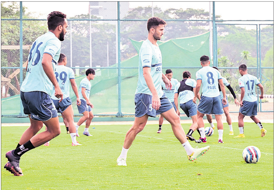
ଓଡ଼ିଶା ଏଏଫ୍ସି ଦଳର ଅଭ୍ୟାସ।