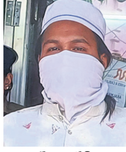
ମୌଲାନା କୈଫି ଖାନ୍