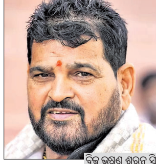
ଦାବିରେ କୁସ୍ତିଯୋଦ୍ଧାମାନେ ଗତ ଦିବାରଠାରୁ ଦିଲ୍ଲୀର ଯନ୍ତ୍ରମନ୍ତ୍ରଣରେ