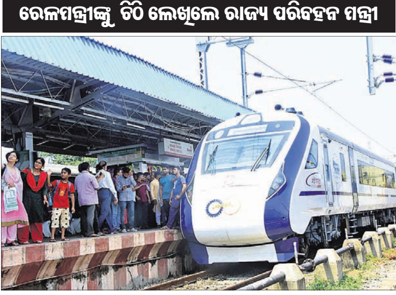
ରେଳମନ୍ତ୍ରୀଙ୍କୁ ଚିଠି ଲେଖିଲେ ରାଜ୍ୟ ପରିବହନ ମନ୍ତ୍ରୀ ପୁରୀ-ହାଡ଼ଡ଼ା, ପୁରୀ-ଭାରତକୋଳା, ଭୁବନେଶ୍ୱର-ହାଇଦ୍ରାବାଦ ମଧ୍ୟରେ ଚଳାତଳ ପାଇଁ ଦାବି