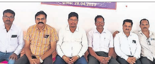
ବୈଠକରେ ଉପସ୍ଥିତ ସଂପର୍କୀୟ କର୍ମଚାରୀମାନେ।

ଅନୁଗୋଳ ଲିମିଟେଡ୍ ଆଠମାଇଲ ବୁକ୍ ପଞ୍ଚାୟତରେ ଏମ୍ପାନେଲିଂ ସମ୍ପର୍କରେ ଲୋକାୟୁକ୍ତଙ୍କ ଦ୍ୱାରା ତଦନ୍ତ କରାଯାଇଛି।