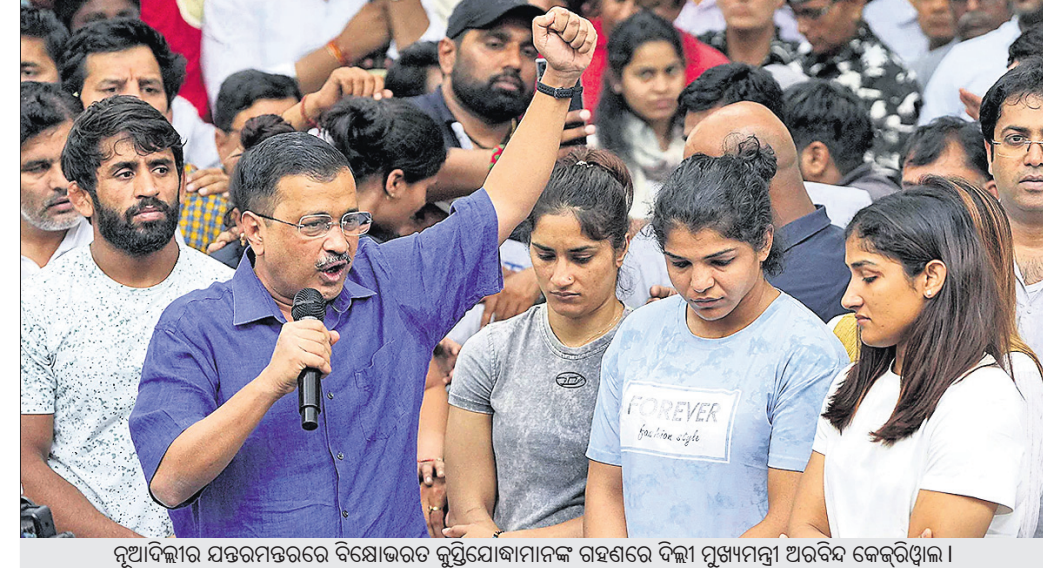
ନୂଆଦିଲ୍ଲୀର ଯତନଗରରେ ବିଷୋଭରେ କୁସ୍ତିଯୋଦ୍ଧାମାନଙ୍କ ରହଣିରେ ଦିଲ୍ଲୀ ମୁଖ୍ୟମନ୍ତ୍ରୀ ଅରବିନ୍ଦ କେଜ୍‌ରିୱାଲ।