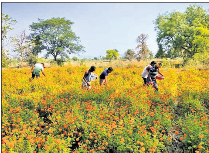
ବିକଳପୁରରେ ହୋଇଥିବା ଗେଣ୍ଡୁ ଫୁଲ ଚାଷ।

ଭୁବନେଶ୍ୱର ଜିଲ୍ଲା ବାମନହାରାଜପୁର ବ୍ଲକ ଅନ୍ତର୍ଗତ କମିଳା ପଞ୍ଚାୟତ ବିକଳପୁର ଗ୍ରାମର ଦୁଇ ଯୁବ ଚାଷୀ ଗେଣ୍ଡୁ ଫୁଲ ଚାଷ କରି ନିଜର ସ୍ୱତନ୍ତ୍ର ପରିଚୟ ସୃଷ୍ଟି କରିପାରିଛନ୍ତି। ପ୍ରାୟ ୪ ଏକର ଚାଷ ଜମିରେ ଗେଣ୍ଡୁ ଫୁଲ ଚାଷ କରି ନିଜେ ରୋଜଗାରୀ ହେବା ସହିତ ଗ୍ରାମର କେତେଜଣ ଦେବଦାସ ଯୁବକଙ୍କୁ କାମ ଯୋଗାଇ ଦେଇ ପାରିଛନ୍ତି।