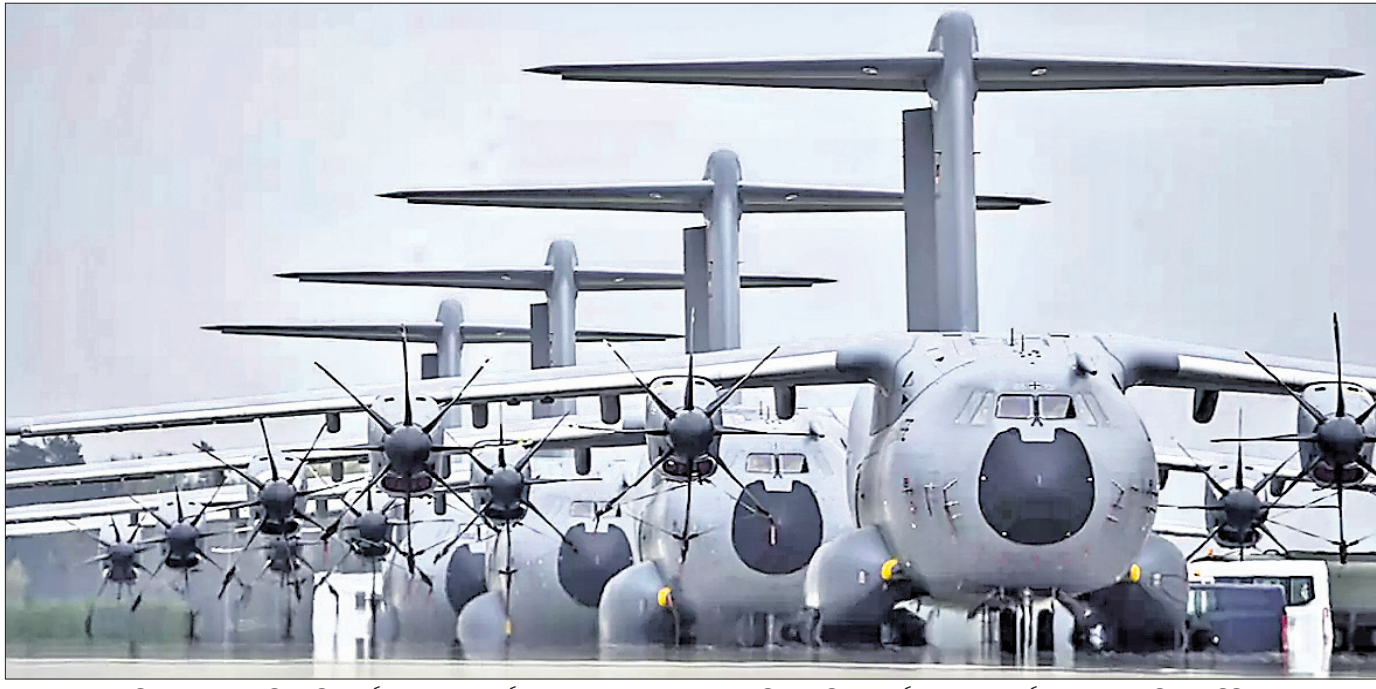
ମିଶନ ସୁଦ୍ଧାରେ ନିୟୋଜିତ କର୍ମୀମାନଙ୍କୁ ଏୟାରଫୋର୍ସ ୪ ଏୟାରବସ୍ ୪୪୦୦ଏମ୍ ପରିବହନ ବିମାନ କର୍ମୀମାନଙ୍କୁ ବାୟୁସେନା ଘାଟିରେ ରହିଛି।

ଅଷ୍ଟିନ୍, ୨୯: ଆମେରିକାର ପେନ୍ସିଲଭାନିଆ ରାଜ୍ୟରେ ଘଟିଥିବା ଏକ ଘଟଣାରେ ପଡ଼ୋଶୀଙ୍କ ଗୁଳିମାଡ଼ରେ ପରିବାରର ୫ ଜଣଙ୍କ ମୃତ୍ୟୁ ଘଟିଛି।