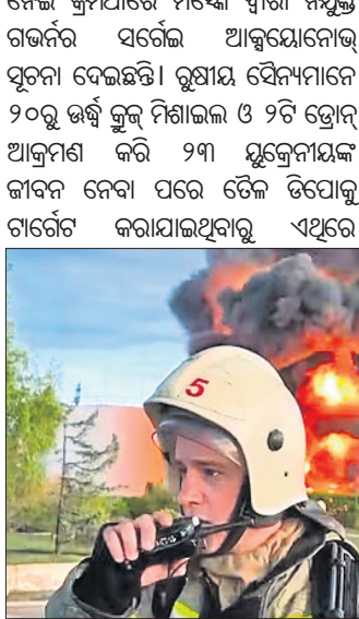
ଡ୍ରୋନ୍ ଆକ୍ରମଣରେ ଡେଲ ଡିପୋ ଜଳୁଥିବାବେଳେ ଜଣେ ଅଗ୍ନିଶମ କର୍ମଚାରୀ ଖୁବ୍ ଚକିତରେ କଥା ହେଉଛନ୍ତି।

ନେଇ କ୍ରିମିଆରେ ମସ୍କୋ ଦ୍ୱାରା ନିୟନ୍ତ୍ରଣ ରଖିବା ପାଇଁ ଆକ୍ରମଣରେ ଉପକ୍ରମ କରାଯାଇଛି।