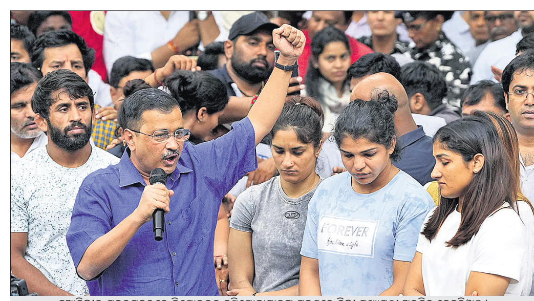
ନୂଆଦିଲ୍ଲୀର ଯତ୍ନରତନରେ ବିଷୋଭରତ କୁସ୍ତିଯୋଦ୍ଧାମାନଙ୍କ ରହଣିରେ ଦିଲ୍ଲୀ ମୁଖ୍ୟମନ୍ତ୍ରୀ ଅରବିନ୍ଦ କେଜ୍‌ରିୱାଲ୍।