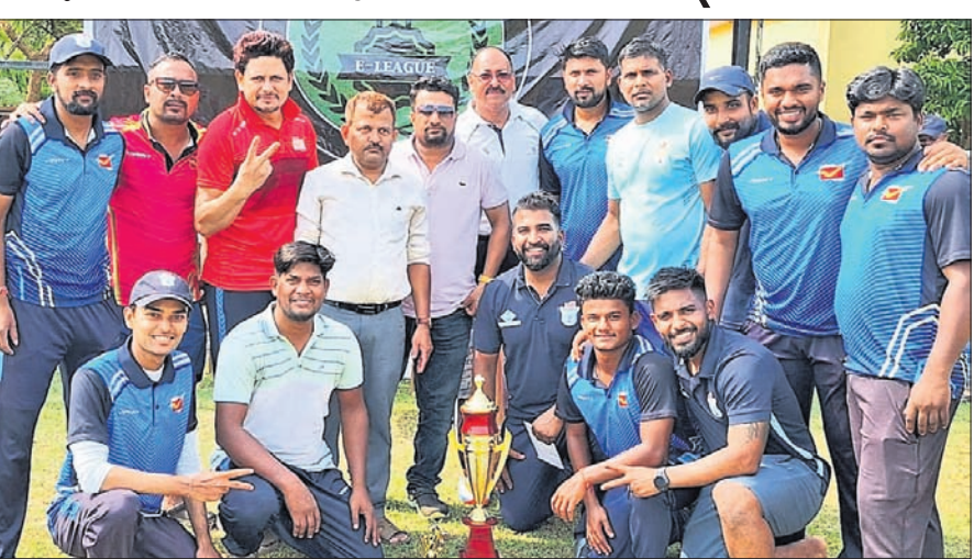
ଅତିଥିକ ସହିତ ଚାମ୍ପିୟନ ଦଳର ଖେଳାଳି।