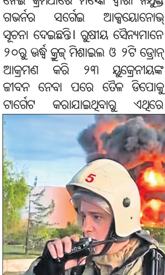
ଡ୍ରୋନ୍ ଆକ୍ରମଣରେ ଡେଲ ଡିପୋ ଜଳୁଥିବାବେଳେ ଜଣେ ଅଗ୍ନିଶମ କର୍ମଚାରୀ ଖୁବ୍ ଚକିତରେ କଥା ହେଉଛନ୍ତି।

ନେଇ କ୍ରିମିଆରେ ମସ୍କୋ ଦ୍ୱାରା ନିର୍ମୂଳ ଗଭର୍ନର ସର୍ଗେଇ ଆକ୍ଲୟୋନୋଭ୍ ୨୦୧୪ରେ ରୁଷିଆ କ୍ରିମିଆକୁ ସୂଚନା ଦେଇଛନ୍ତି। ରୁଷିଆ ସୈନ୍ୟମାନେ ୨୦୧୪ ଉର୍ଦ୍ଧ୍ୱ କ୍ରିମିଆକୁ ନିୟନ୍ତ୍ରଣ କରିବା ପାଇଁ ଡ୍ରୋନ୍ ଆକ୍ରମଣ କରି ୨୩ ଯୁକ୍ରେନ୍‌ଆଇଙ୍କ ଜୀବନ ନେବା ପରେ ଡେଲ ଡିପୋକୁ ଗର୍ଭେଷ୍ଟ କରାଯାଇଥିବାରୁ ଏଥିରେ