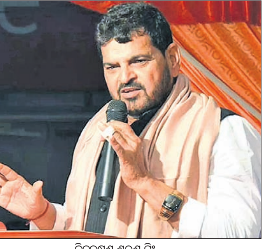
ତ୍ରିଭୁକ୍ଷଣ ଶରଣ ସିଂ