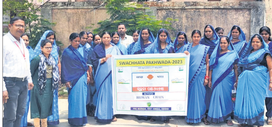
କାର୍ଯ୍ୟକ୍ରମରେ ସାମ୍ଲ୍ୟ ବିଭାଗ ଅଧିକାରୀ, ଆଶାକର୍ମାଙ୍କ ସମେତ ଅନ୍ୟମାନେ।

କରଣ, ୨୯୪(ଡି.ଏ.ଏ.) ପରିସରରେ ଅନୁଷ୍ଠିତ ସ୍ଵଚ୍ଛତା ଦେହୁରୀ ଯୋଗଦେଇ ବ୍ୟକ୍ତିଗତ ପକ୍ଷ ଅବସରରେ ଆୟୋଜିତ ପରିଷ୍କାର ପରିଚ୍ଛା, ହାତଧୁଆ ପଦ୍ଧତି ଓ ଏହାର ଆବଶ୍ୟକତା ପଦ୍ଧତି ଓ ଏହାର ଆବଶ୍ୟକତା ଯୋଗଦେଇଥିବା ଅତିଥିମାନେ ସମ୍ପର୍କରେ ସଚେତନ କରାଇଥିଲେ।