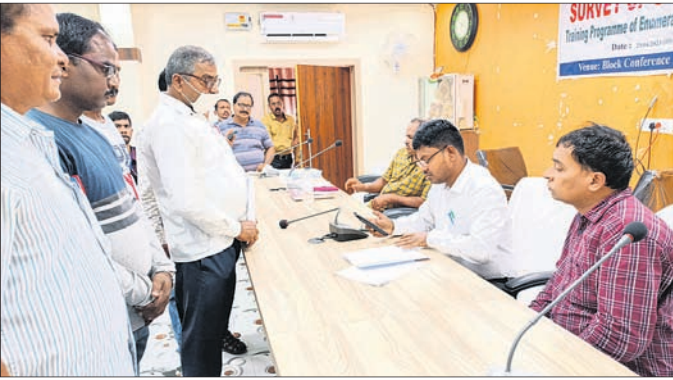
ଶିକ୍ଷକମାନେ ତହସିଲଦାରଙ୍କୁ ଅଭିଯୋଗପତ୍ର ପ୍ରଦାନ କରୁଛନ୍ତି ।

ନୂଆଗାଁ, ୨୯୪(ଡି.ଏନ୍.ଏ.) ରାଜ୍ୟରେ ସାମାଜିକ ଆର୍ଥିକ ପଛୁଆବର୍ଗ ଜାତି ସଭେ କରାଯିବା ପାଇଁ ସରକାରଙ୍କ ନିର୍ଦ୍ଦେଶ ରହିଛି । ତେଣୁ ଏହି ସଭେ କାର୍ଯ୍ୟ କରିବା ପାଇଁ ନୂଆଗାଁ ବିଡ଼ିଓ ପ୍ରାଥମିକ ଶିକ୍ଷକମାନଙ୍କୁ ଚିଠି ମାଧ୍ୟମରେ ଜଣାଇଥିଲେ । ତେବେ ଶିକ୍ଷକମାନେ ଏହି କାର୍ଯ୍ୟ କରିବେ ନାହିଁ ଏବଂ ବିଡ଼ିଓଙ୍କ ନିର୍ଦ୍ଦେଶକୁ ବିରୋଧ କରି ଶନିବାର ଏକ