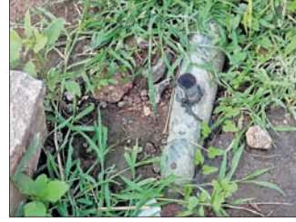
ନୟାଗଡ଼ ଅର୍ଥସ, ୨୯୪

ନୟାଗଡ଼ ବ୍ଲକ ଜେମାଦେଇପୁରପାଟଣା ପଞ୍ଚାୟତ ରାଜପାଟଣା ଗାଁର ୬୯ ନଂ. ଖାତରେ ପାନୀୟଜଳ ସଙ୍କଟ ଦେଖା ଦେଇଛି । ରାଜପାଟଣା ଲାଠିପଡ଼ା ଗ୍ରାମ୍ୟ ଉନ୍ନୟନ ଉପାୟକ କମିଟିର ପ୍ରକଳ୍ପର ପାଇପ କମାୟାଇ ରାସ୍ତା ପାର୍ଶ୍ୱରେ ପଡ଼ି ରହିଥିଲା । କଞ୍ଚିତ ରାସ୍ତା ନିର୍ମାଣ ପାଇଁ ରାଜପାଟଣା ପାନୀୟ ଜଳ ପ୍ରକଳ୍ପର ପାଇପ କମାୟାଇ ମଧ୍ୟ ଏହାକୁ ମରାମତିକରାଯାଇ ନ ଥିଲା । ଏନେଇ ଖବର ପ୍ରକାଶନ ପରେ ମରାମତି ହୋଇଛି । ତେବେ କାମ ପୂର୍ଣ୍ଣ ହୋଇ ନ ଥିବାରୁ ଗାଁକୁ ପାଣି ଆସି ପାରୁ ନାହିଁ ବୋଲି ଗ୍ରାମବାସୀ କହିଛନ୍ତି ।