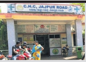
■ ୭ ବର୍ଷ ହେଲା ମିଳୁଛି କେବଳ ପ୍ରତିଷ୍ଠିତ

ସହ ଲୋକସଂଖ୍ୟା ବେସରକାରୀ ଭାବେ ଦେଖି ଲକ୍ଷ୍ୟ ଚଳାଣି। ହେଲେ ସ୍ୱାସ୍ଥ୍ୟସେବା କ୍ଷେତ୍ରରେ ଭିତ୍ତିଭୂମି ସାଜିବା ଆବଶ୍ୟକ ବିଶେଷଜ୍ଞ ଡାକ୍ତର ଅଭାବ ସହରବାସୀଙ୍କୁ ବ୍ୟଥା କରୁଛି। ଏହାର ସୁଯୋଗରେ କଟକ, ଭୁବନେଶ୍ୱର, ଯାଜପୁର ଓ ଯାଜପୁରରୋଡ଼ର ବିଭିନ୍ନ ସରକାରୀ ଡାକ୍ତରଖାନାରେ କାର୍ଯ୍ୟରେ ଡାକ୍ତରମାନଙ୍କ ବ୍ୟବସାୟିକ ପେଶୁରୀ ପାଇଁ ଲକ୍ଷ୍ୟ ବ୍ୟାସନଗର। ସହରରେ ଥିବା ୨୦ରୁ ଊର୍ଦ୍ଧ୍ୱ ଗେଡିଏନ ଷ୍ଟୋର ସମେତ ବିଭିନ୍ନ କ୍ଲିନିକରେ ଏହି ଡାକ୍ତରମାନେ ସ୍ୱାସ୍ଥ୍ୟସେବାକୁ ବ୍ୟବସାୟିକ କରିଛନ୍ତି। ଆର୍ଥିକ ସ୍ୱଚ୍ଛତାରେ ଲୋକମାନେ ୩୦ରୁ ୫୦୦ ଟଙ୍କା ପର୍ଯ୍ୟନ୍ତ ଡାକ୍ତର ଫି ବେଳ ସ୍ୱାସ୍ଥ୍ୟସେବା ପାଇଥିବାବେଳେ ଗରିବ ନିରାହ ଲୋକ ଏଥିରେ ପେଷି ହେଉଥିବା ମତପ୍ରକାଶ ପାଇଛି।