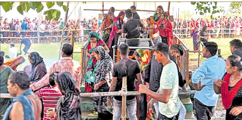
କୁଳକଣ୍ଠିତ ଶନିଶ୍ୱର ମନ୍ଦିରରେ ଜଳଦାନ ଲାଗି ଭକ୍ତମାନେ ଧାଡ଼ିରେ ଠିଆ ହୋଇଛନ୍ତି।