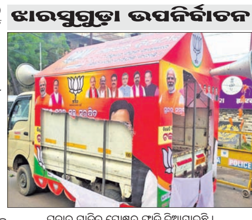
ପ୍ରଚାର ଗାଡ଼ିରୁ ପୋଷ୍ଟର ଫାଟି ଦିଆଯାଇଛି।

ସମ୍ବଲପୁର, ୨୯ (ଭୁବନେଶ୍ୱର) ଝାରସୁଗୁଡ଼ା ଉପନିର୍ବାଚନ ପାଇଁ ଏବେ ୩ ପ୍ରମୁଖ ରାଜନୈତିକ ଦଳ ଭାଜପା, ବିଜେଡି, କଂଗ୍ରେସ ପ୍ରଚାର ମଜଦାଳୀଙ୍କୁ ଓହ୍ଲାଇଛନ୍ତି।