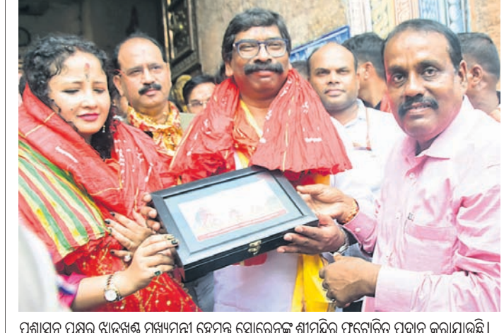
ପ୍ରଶାସନ ପକ୍ଷରୁ ଖାଡ଼ଖଣ୍ଡ ମୁଖ୍ୟମନ୍ତ୍ରୀ ହେମନ୍ତ ସୋରେଙ୍କୁ ଶ୍ରୀମନ୍ଦିର ଫଟୋଟିପ୍ତ ପ୍ରଦାନ କରାଯାଇଛି ।

ସେ ଆହୁରି କହିଛନ୍ତି, ଜନସାଧାରଣଙ୍କ ସୁବିଧା ପାଇଁ ମୋବାଇଲ ନେତୃତ୍ୱ ଦିଆଯାଇଥିଲା । ସାମାଜିକ ଗଣମାଧ୍ୟମ ଫେସ୍‌ବୁକ୍, ସ୍ୱାସ୍ଥ୍ୟ, ରୁଜ୍ଜିତ, ଲକ୍ଷ୍ମୀଗ୍ରାମ, ସ୍ୱାସ୍ଥ୍ୟ, ଭଲ ପ୍ଲାନେଟରେ ହିଂସା ସମ୍ବନ୍ଧୀୟ ପ୍ରଚାର ଉପରେ ରୋକ ଲଗାଯାଇଛି । ଏହାକୁ ନିୟନ୍ତ୍ରଣ କରିବା ପାଇଁ ସ୍ୱତନ୍ତ୍ର ଟିମ୍ ଗଠନ କରାଯାଇଛି । ଗୋଲ ଫ୍ରି ନମ୍ବର ସହ ପୋଲିସ୍ ଅଧିକାରୀଙ୍କ ନମ୍ବର ସର୍ବସାଧାରଣ କରାଯାଇଛି । ଏହା ସହ ସାମାଜିକ ଗଣମାଧ୍ୟମରେ ଅପପ୍ରଚାର ନେଇ ରୁଜ୍ଜିତ ଗ୍ରୁପ୍ ଆଡମିନିଷ୍ଟ୍ରେଟର ସହ ୧୬ଜଣଙ୍କୁ ଥାନାକୁ ଆଣି ବ୍ୟକ୍ତିଗତ ଜମାଦତ୍ତରେ ଛାଡ଼ି ଦିଆଯାଇଛି । ଏଭଳି ଅପପ୍ରଚାର କଲେ ଆଗକୁ କଡ଼ା କାର୍ଯ୍ୟାନୁଷ୍ଠାନ ଗ୍ରହଣ କରାଯିବ । ପୋଲିସ୍