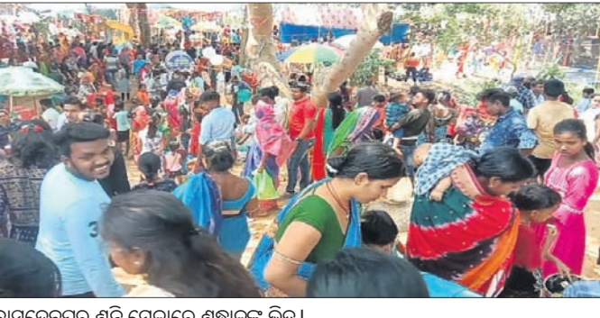
ବାସୁଦେବପୁର ଶନି ମେଳାରେ ଶ୍ରଦ୍ଧାଳୁଙ୍କ ଭିଡ଼।

ଶନିଓଷା ଅବସରରେ ଶନିବାର ଧର୍ମଶାଳା ରୁକ୍ ବିଭିନ୍ନ ସ୍ଥାନରେ ଶନିଶ୍ୱର ମେଳା ଅନୁଷ୍ଠିତ ହୋଇଯାଇଛି। ରୁକ୍ ଦେଓଡ଼ା ପଞ୍ଚାୟତ ବାସୁଦେବପୁରଠାରେ ଶନିଶ୍ୱରଙ୍କ ମହାଯଜ୍ଞ ଅନୁଷ୍ଠିତ ହୋଇଛି। ପ୍ରାତଃପୂର୍ଣ୍ଣ ଶନିମହାଦେବ ମନ୍ଦିରରେ ଶନିଦେବଙ୍କ ଯଥାରୀତି ପୂଜାର୍ଚ୍ଚନା କରାଯିବା ସହ ହୋମଯଜ୍ଞ କରାଯାଇଥିଲା। ଶନିମହାଦେବଙ୍କ ନିକଟରେ ଜଳାଭିଷେକ ପାଇଁ ହଜାରହଜାର ସଂଖ୍ୟାରେ ଶ୍ରଦ୍ଧାଳୁଙ୍କ ଭିଡ଼ ଜମିଥିଲା। ଭକ୍ତ ନିକଟସ୍ଥ କେନ୍ଦ୍ରୀୟନଦୀରୁ ଜଳ ଆଣି ଶନିଦେବଙ୍କ ନିକଟରେ ଜଳାଭିଷେକ କରିଥିଲେ। ଭକ୍ତଙ୍କ ଶୁଣ୍ଠିକିତ ଦର୍ଶନ ପାଇଁ ମନ୍ଦିର କମିଟି ଓ ପୋଲିସ୍