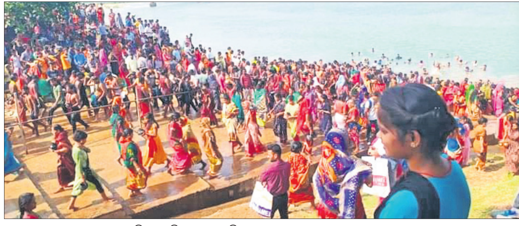
ଶ୍ରଦ୍ଧାଳୁମାନେ ନଦୀରୁ ଜଳ ନେଇ ଶନିଶ୍ୱରଙ୍କ ନିକଟକୁ ଯାଇଛନ୍ତି।

ଚକ୍ଷୁଖୋଜି/ବାଲିତହସ୍ତପୁର, ୨୯/୪ (ଡି.ଏନ.ଏ.) ବଡ଼ଚଣା ରୁକ୍ ଅନ୍ତର୍ଗତ ସାଉଁଡିଆ ଚାଲୁ-ବାଲିକୁଦା ଗ୍ରାମର କେନ୍ଦ୍ରୀୟ ନଦୀକୂଳରେ ଥିବା ଶନିମନ୍ଦିରରେ ଶନିବାର ହଜାରହଜାର ଶ୍ରଦ୍ଧାଳୁ ଜଳାଭିଷେକ କରିଛନ୍ତି। ଶନିଶ୍ୱର ଓଷା ଅବସରରେ ବହୁ ସଂଖ୍ୟାରେ ମହିଳା ଓ ପୁରୁଷ କେନ୍ଦ୍ରୀୟ ନଦୀରୁ ଜଳ ଆଣି ଜଳାଭିଷେକ କରିଥିଲେ। ଏଥିପାଇଁ ଭୋର ୩ଟାରୁ ପୂର୍ବାହ୍ନ ୧୨ଟା ପର୍ଯ୍ୟନ୍ତ