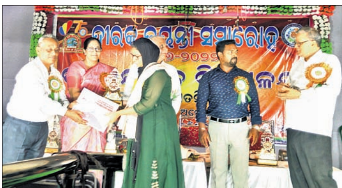
ଜଣେ କୃତୀ ଛାତ୍ରଙ୍କୁ ଅତିଥି ସମର୍ପିତ କରୁଛନ୍ତି।