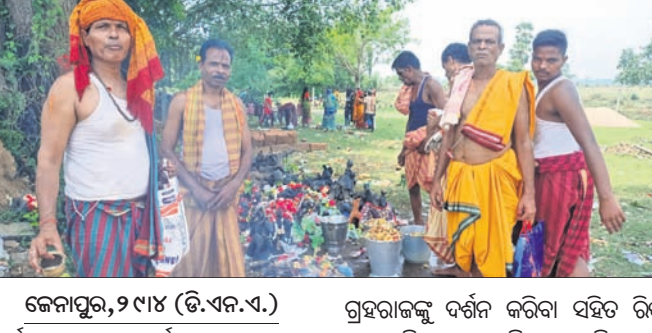
ଜେନାପୁର, ୨୯/୪ (ଡି.ଏନ.ଏ.)

ଗ୍ରହରାଜକୁ ଦର୍ଶନ କରିବା ସହିତ ବିଷ୍ଣୁ ଧର୍ମଶାଳା ରୁକ୍ ଅନ୍ତର୍ଗତ ଜେନାପୁର ଓ କବାଟ ବନ୍ଧ ଅଞ୍ଚଳରେ ଥିବା ଚାରଗୋଠା, ମାନସିକ ପୁରଣ ନିମନ୍ତେ ପିଲାଠାରୁ ଗୋଡ଼ିପିଆ, ବୁଦାଦେଇପୁର, ଦଶସନା ଓ ବ୍ରହ୍ମପୁର ଆଦି ବିଭିନ୍ନ ସ୍ଥାନରେ ଜଳାଭିଷେକ କରିଥିଲେ। ଭଜନ କାର୍ତ୍ତନ ଶନିବାର ଗ୍ରହରାଜ ଶନିଦେବଙ୍କ ପୂଜା ପାଳିତ ହୋଇଯାଇଛି। ଭକ୍ତମାନେ