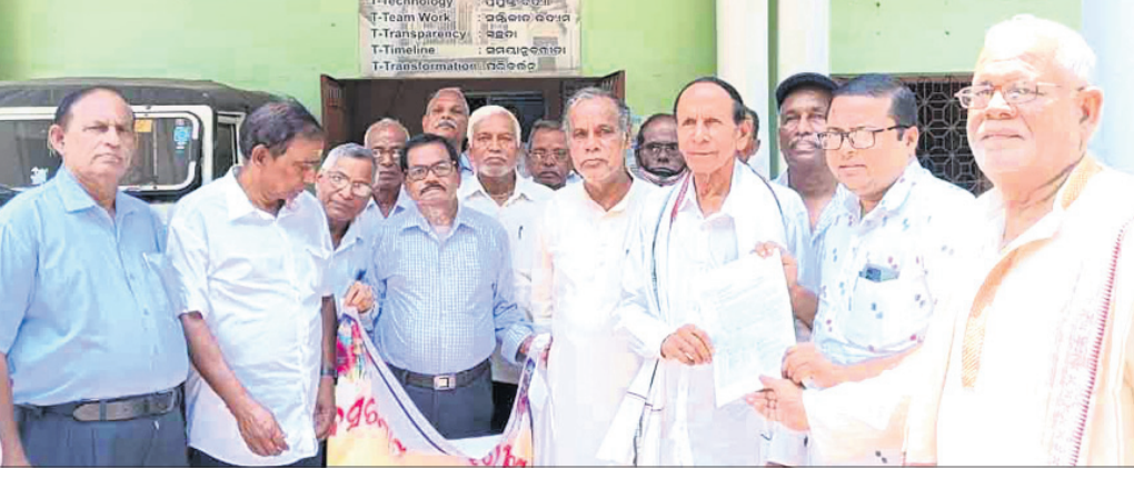
ବ୍ଲକ କାର୍ଯ୍ୟାଳୟ ସମ୍ମୁଖରେ ଅବସରପ୍ରାପ୍ତ କର୍ମଚାରୀ ସଂଘର କର୍ମକର୍ତ୍ତାମାନେ ବିକ୍ଷୋଭ କରୁଛନ୍ତି।

କୁଜଙ୍ଗ, ୨୯/୪(ଡି.ଏନ.ଏ.): କୁଜଙ୍ଗ ବ୍ଲକ ଅବସରପ୍ରାପ୍ତ କର୍ମଚାରୀ ସଂଘ ପକ୍ଷରୁ ଶନିବାର ୧୩ ଦଫା ଦାବି ନେଇ ବ୍ଲକ କାର୍ଯ୍ୟାଳୟ ସମ୍ମୁଖରେ ଶନିବାର ବିକ୍ଷୋଭ ପ୍ରଦର୍ଶନ କରାଯାଇଛି।