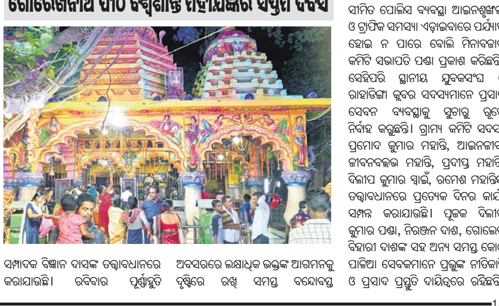
ଗୋରେଖନାଥ ପୀଠ ବିଶ୍ୱଶାନ୍ତି ମହାଯଜ୍ଞର ସପ୍ତମ ଦିବସ

ରଘୁନାଥପୁର ବ୍ଲକ କେବଳେକୋହିତ ପ୍ରସିଦ୍ଧ ବିଭୂତିକ୍ଷେତ୍ର ପ୍ରଭୁ ଗୋରେଖନାଥ ପୀଠ ବିଶ୍ୱଶାନ୍ତି ମହାଯଜ୍ଞର ସପ୍ତମ ଦିବସ ସମ୍ପର୍କ ହୋଇଛି।