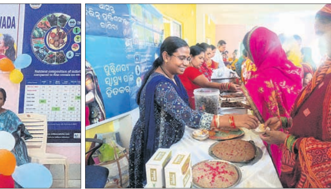
ମାଣ୍ଡିଆରେ ପ୍ରସ୍ତୁତ ଖାଦ୍ୟ ଖୁଲ୍ ।

ସରକାର ୨୦୧୭ରୁ ରାଜ୍ୟରେ ମିଳିତ ମିଶନ ଆରମ୍ଭ କରିଥିବାବେଳେ ୨୦୨୩କୁ ଆନ୍ତର୍ଜାତୀୟ ମିଳିତ ଦିବସ ଭାବେ ଘୋଷଣା କରିଛନ୍ତି । ମାଣ୍ଡିଆ ହେଉଛି ମହିଳାମାନଙ୍କଠାରେ ଦେଖାଯାଉଥିବା ଅପସ୍ତୁଷ୍ଟି ଦୂର କରିବା ପାଇଁ ଉପଯୁକ୍ତ ବିଭିନ୍ନ ପଦକ୍ଷେପ ନେଉଛନ୍ତି । ଅପସ୍ତୁଷ୍ଟି ଦୂର କରିବାରେ ମାଣ୍ଡିଆର ଭୂମିକା ରହିଛି ।