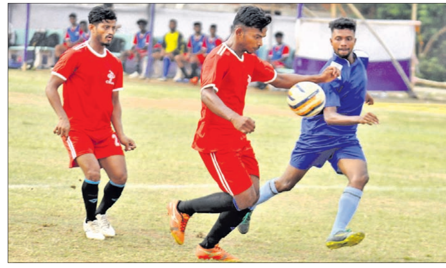
କଟକ ଓ ଦେବଗଡ଼ ମଧ୍ୟରେ ଅନୁଷ୍ଠିତ ମ୍ୟାଚ।