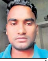
ଗାଧା ଗଢାଯାଇ ପାଧ୍ୟାନ, ପରିଚିତ କର୍ମ

କମିଳା ପାଠାୟନ ପ୍ରକଳ୍ପରେ ଗୋଷ୍ଠୀ ଗାଧ କରାଯାଇ ପାଧ୍ୟାନ ଓ ପରିଚିତ କର୍ମ ଗୋଷ୍ଠୀ ଗାଧ କରାଯାଇ ପାଧ୍ୟାନ ଓ ପରିଚିତ କର୍ମ