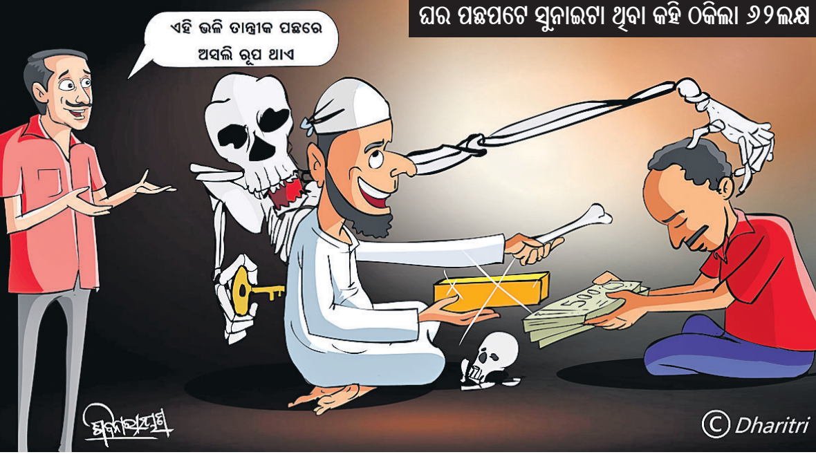
ଘର ପଛପଟେ ସୁନାଜଗା ଥିବା କହି ୦କିଲା ୬୨ଲକ୍ଷ