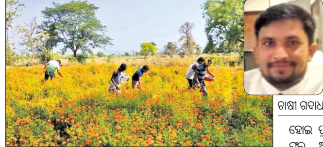
ବିଳାସପୁରରେ ହୋଇଥିବା ଗୋଷ୍ଠୀ ଗାଧ

ସୁବର୍ଣ୍ଣପୁର ଜିଲ୍ଲା ବାମନହାରାଜପୁର ବ୍ଲକ ଅନ୍ତର୍ଗତ କମିଳା ପଞ୍ଚାୟତ ବିଳାସପୁର ଗ୍ରାମରେ ଗୋଷ୍ଠୀ ଗାଧ ଗଢାଯାଇ ପାଧ୍ୟାନ ଓ ପରିଚିତ କର୍ମ