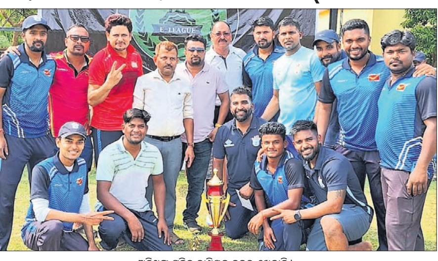
ଅତିଥିକ ସହିତ ଚାମ୍ପିୟନ ଦଳର ଖେଳାଳି।