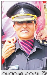
ସୁଦାନରେ ସେନା ଅଫିସର

ସୁଦାନରେ ସୈନ୍ୟବାହିନୀ ଓ ବିରୋଧୀ ଅର୍ଦ୍ଧସାମରିକ ବାହିନୀ ମଧ୍ୟରେ ସଂଘର୍ଷ ଅନିବାର୍ୟ ନାହିଁ।