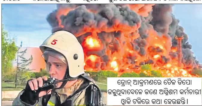
ଡ୍ରୋନ୍ ଆକ୍ରମଣରେ ଡେଇଁ ଡିପୋ ଜଳୁଥିବାବେଳେ ଜଣେ ଅଗ୍ନିଶମ କର୍ମଚାରୀ ଖୁବ୍ ଚକିତ ହୋଇଛନ୍ତି।

ନେଇ କ୍ରିମିଆରେ ମସ୍କୋ ଦ୍ୱାରା ନିର୍ମୂଳ ଗଢ଼ାଯାଇଥିବା ଡ୍ରୋନ୍ ଆକ୍ରମଣରେ ଜଳିଗଲା।