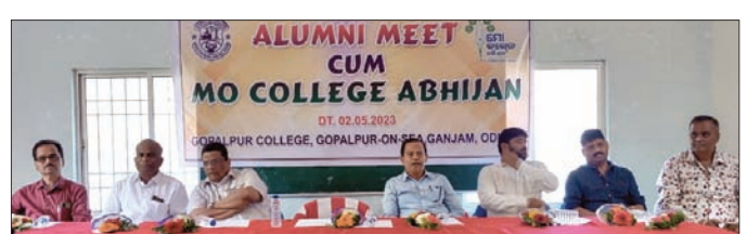
ପୁରାତନ ଛାତ୍ରସଂଘ ବନ୍ଧୁମିଳନରେ ଯୋଗ ଦେଇଥିବା ଅତିଥି ।