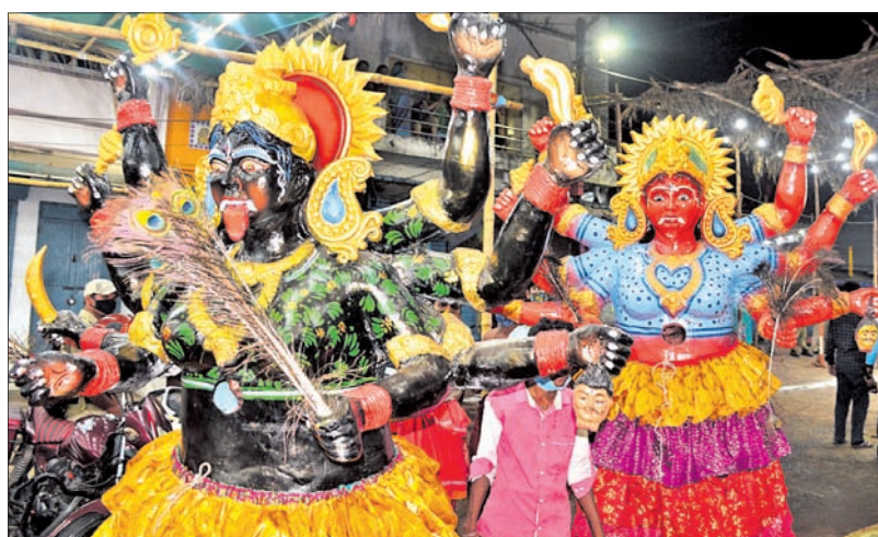
ମା' ଯିବା ସମୟରେ ପ୍ରଭା ନାଚ ।