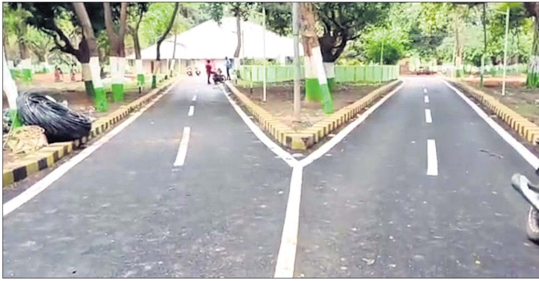
ରାଇଜଙ୍ଗପୁର ମୁନିସିପାଲିଟି ଅଞ୍ଚଳରେ ରାସ୍ତା କାମ ହେଉଛି।

ରାଷ୍ଟ୍ରପତି ଟ୍ରେଡିଂ ପାର୍ଟି ୩ ଦିନିଆ ମୟୂରଭଞ୍ଜ ଗସ୍ତ ନେଇ ସମଗ୍ର ଜିଲ୍ଲା ଚଳଚଞ୍ଚଳ ହୋଇପଡ଼ିଛି। ଦିନକ ପରେ ରାଷ୍ଟ୍ରପତି ଜନ୍ମପାଟିରେ ପାଦ ଆସିବେ। ଏହି ଗସ୍ତ କାର୍ଯ୍ୟକ୍ରମକୁ ସଫଳ କରିବା ଲାଗି ଶାନ୍ତିପୁର ଗାଁ ପାହାଡ଼ପୁରଠାରୁ ଆରମ୍ଭ କରି ରାଇଜଙ୍ଗପୁରସ୍ଥିତ ବାସଭବନ, ଶିମିଳିପାଳ ଅଭୟାରଣ୍ୟ ଓ ବାରିପଦା ସହରରେ କୋରଦାର ପ୍ରସ୍ତୁତି ଜାରି ରହିଛି।