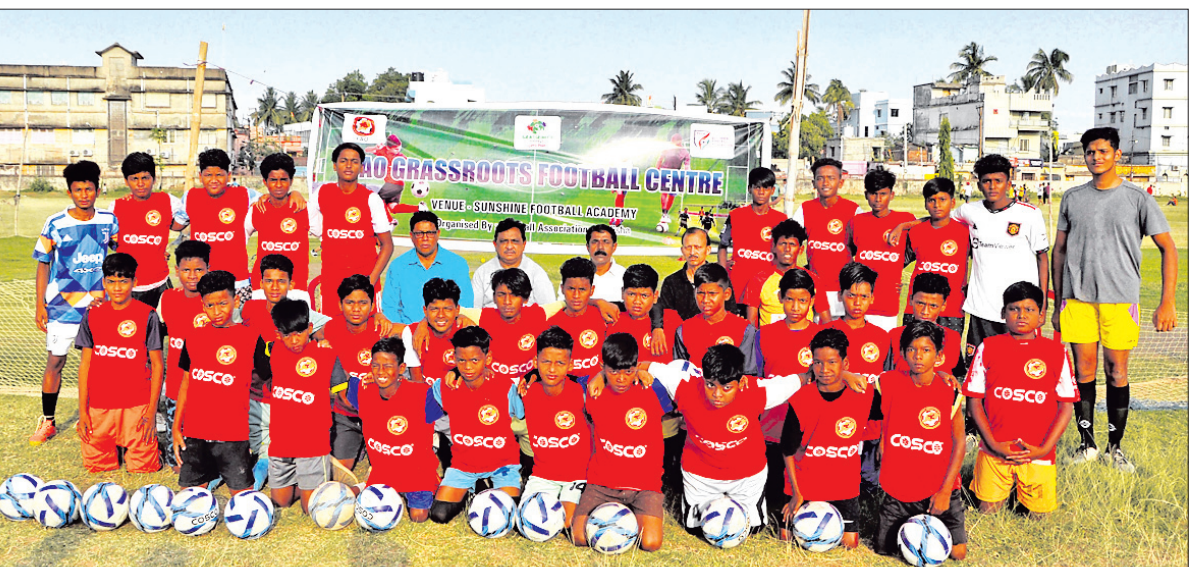
ସନ୍ଧ୍ୟାକାଳୀନ ପୁରୁଷ ଏକାଡେମୀର ଉଦ୍‌ଘାଟନ।