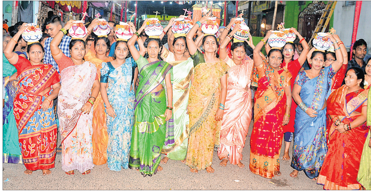
ଘଟ ମୁଣ୍ଡାଇଥିବା ମାନସିକଧାରା ମହିଳା ।