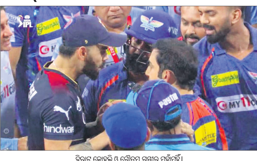
ବିରାଟ କୋହଲି ଓ ଗୋଟିଏ ଗମ୍ଭୀର ମୁହାଁମୁହିଁ।

ଲକ୍ଷ୍ନୌ, ୨୫ (ପି.ଟି.) ଭାରତୀୟ ଷ୍ଟାର ବ୍ୟାଟର ବିରାଟ କୋହଲି ଓ ପୂର୍ବତନ ଓପନିଙ୍ଗ ବ୍ୟାଟର ଗୋଟିଏ ଗମ୍ଭୀରଙ୍କ ମଧ୍ୟରେ ଖେଳି ଏକ ନୂଆ ରୂପ ନେଇଛି। ଆଇପିଏଲ ମ୍ୟାଚ୍ ସମୟରେ ଉଭୟ ଖେଳାଳିଙ୍କ କଳିଆ ପଦାରେ ପଡ଼ିଛି। ମ୍ୟାଚ୍ ପରେ ଉଭୟଙ୍କ ମଧ୍ୟରେ ଯୁକ୍ତିତର୍କ ହୋଇଥିବା ବେଳେ ମ୍ୟାଚ୍ ଫିର ୧୦୦ ପ୍ରତିଶତ କଟାଯାଇଛି। ସୋମବାର ରୟାଲ ଟ୍ୟାଲେଣ୍ଟ୍ସ ବାଙ୍ଗାଲୋର(ଆର୍ଭିବି) ଓ ଲକ୍ଷ୍ନୌ ସୁପର କ୍ୟାଟ୍ସ ମଧ୍ୟରେ ଅନୁଷ୍ଠିତ ଲେଖାଏଁ ମ୍ୟାଚ୍ରେ ୧୮ ରନ୍ରେ ଲିଡି ନେଇଥିଲା ବିରାଟ କୋହଲିଙ୍କ ଦଳ। ଏହାପରେ ଉଭୟ ଖେଳାଳି ପରସ୍ପର ସହିତ ଯୁକ୍ତିତର୍କ କରିଥିଲେ। ଏଭଳି ଅଶୋଭନୀୟ ଆଚରଣ ପାଇଁ ମଙ୍ଗଳବାର ବିସିଆଇ ପକ୍ଷରୁ ଉଭୟ ଖେଳାଳିଙ୍କୁ ଦଣ୍ଡିତ କରାଯାଇଛି। ଉଭୟଙ୍କ ମ୍ୟାଚ୍ ଫିର ୧୦୦ ପ୍ରତିଶତ ଅର୍ଥ ଫାଇନ୍ ଆକାରରେ କାଟି ଦିଆଯାଇଛି। ଆଇପିଏଲର ଧାରା ୨.୨୧ ଆଧାରରେ ଉଭୟ ଖେଳାଳିଙ୍କ ବୟାନ ଗ୍ରାହା ଭାବନାକୁ ଆଘାତ ପହଞ୍ଚାଇଛି। ମ୍ୟାଚ୍ ସମାପ୍ତ ହେବା