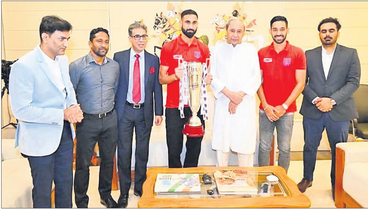
ସମ୍ପର୍କିତ ଓଏପ୍‌ସି ଖେଳାଳି ଓ କର୍ମକର୍ତ୍ତାଙ୍କ ଗହଣରେ ପୁଖ୍ୟମନ୍ତ୍ରୀ ନବୀନ ପଟ୍ଟନାୟକ।