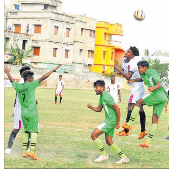
କେନ୍ଦ୍ରାପଡ଼ା ଓ କନ୍ୟାମାନ ମଧ୍ୟରେ ଅନୁଷ୍ଠିତ ମ୍ୟାଚର ସଂଘର୍ଷପୂର୍ଣ୍ଣ ପୁରୁଣା।