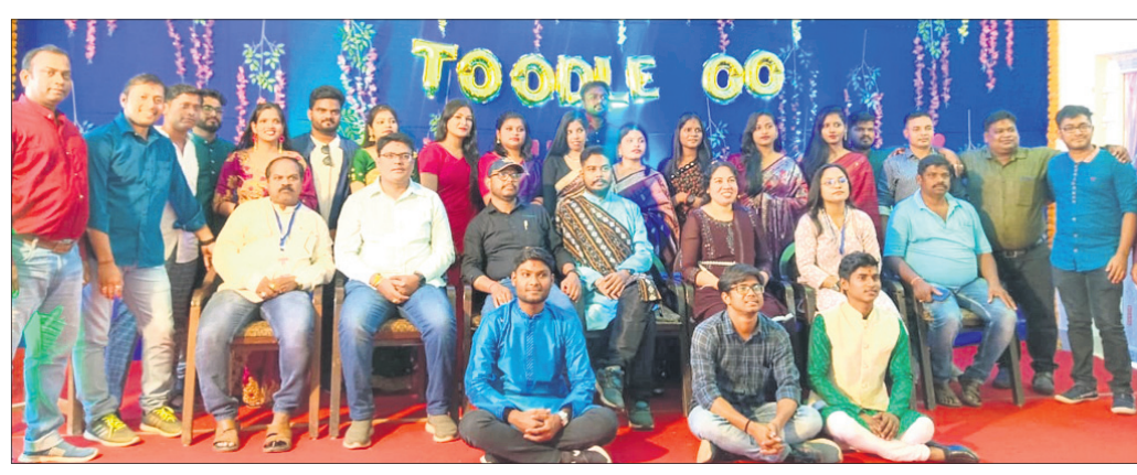
ସ୍ନାତକୋତ୍ତର ସାମ୍ବାଦିକତା ଓ ଗଣଯୋଗାଯୋଗ ବିଭାଗ ପକ୍ଷରୁ ବିଦ୍ୟାଳୟକାଳୀନ ସମାରୋହ ।