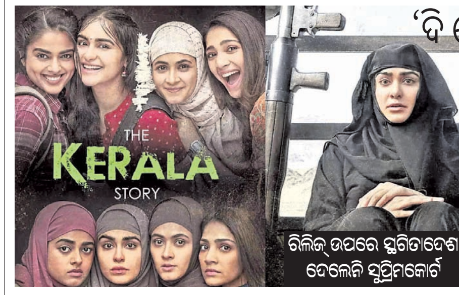
ରିଲିଜ୍ ଉପରେ ସୁପ୍ରିମକୋର୍ଟ ଦେଲେନି ସୁପ୍ରିମକୋର୍ଟ