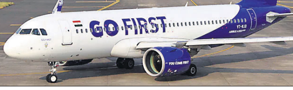
ଗୋ ଫାଷ୍ଟ ବିମାନ

ନୂଆଦିଲ୍ଲୀ, ୨୫: ଗୋ ଫାଷ୍ଟ ବିମାନ ଉଡ଼ାଣ ବନ୍ଦ ରଖିବାକୁ ନିଷ୍ପତ୍ତି ନେଇଛି। ଆମେରିକାର ଜାଣି ନିର୍ବାଣକାରୀ ସଂସ୍ଥା ପ୍ରାଫ୍ ଆଣ୍ଡ୍ ଫ୍ରେଜିଡେନ୍ଟ୍ ସେୟାର ଜର୍ଜିନ ନ ମିଳିବାରୁ ଉକ୍ତ ଏୟାରଲାଇନର ମାତ୍ର ୫୦ ପ୍ରତିଶତ ବିମାନ ଉଡ଼ାଣ ବନ୍ଦ ରଖିବାକୁ ନିଷ୍ପତ୍ତି ନେଇଛି। ଆମେରିକା ପରେ ବିଦେଶୀ ବିମାନ ତକାତକ ନିୟମକ ତିଳିସିଏ ଗୋ ଫାଷ୍ଟ୍ ନୋଟିସ ଦେଇଛି। ବିମାନ ବାତିଲ ପୂର୍ବରୁ ସୁଦ୍ଧା ଦେଇ ନ ଥିବାରୁ ଉକ୍ତ କମ୍ପାନୀକୁ ୨୪ ଘଣ୍ଟା ମଧ୍ୟରେ ଜବାବ ଦେବାକୁ ନିଷ୍ପତ୍ତି ନେଇଛି।