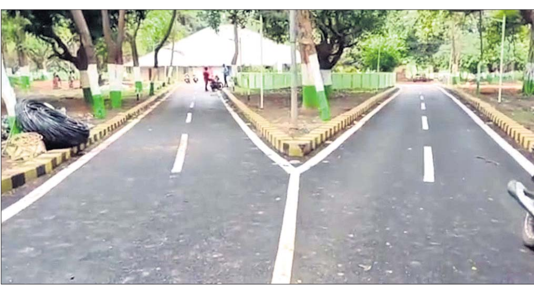
ରାଇରଜପୁର ମୁନିସିପାଲିଟି ଅଞ୍ଚଳରେ ରାସ୍ତା କାମ ହେଉଛି।

ରାଷ୍ଟ୍ରପତି ଡ୍ରୌପଦୀ ମୂର୍ମୁଙ୍କ ୩ ଦିନିଆ ମୟୂରଭଞ୍ଜ ଗସ୍ତ ନେଇ ସମଗ୍ର ଜିଲ୍ଲା ଚଳଚଞ୍ଚଳ ହୋଇପଡ଼ିଛି। ଦିନକ ପରେ ରାଷ୍ଟ୍ରପତି ଜନ୍ମପାତିରେ ପାଦ ଆସିବେ। ଏହି ଗସ୍ତ କାର୍ଯ୍ୟକ୍ରମକୁ ସଫଳ କରିବା ଲାଗି ଶାନ୍ତନୁ ଗାଁ ପାହାଡ଼ପୁରଠାରୁ ଆରମ୍ଭ କରି ରାଇରଜପୁରସ୍ଥିତ ବାସଭବନ, ଶିଳିପିପାଳ ଅଭୟାରଣ୍ୟ ଓ ବାରିପଦା ସହରରେ କୋରଦାର ପ୍ରସ୍ତୁତି ଜାରି ରହିଛି।