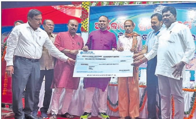
ଜଣେ ଶ୍ରମିକଙ୍କୁ ସମ୍ମାନ ପ୍ରଦାନ କରାଯାଇଛି ।

ନବରଙ୍ଗପୁରରେ ଜିଲା ଶ୍ରମ ବିଭାଗ ପକ୍ଷରୁ ଗାଁପଞ୍ଚାୟତ ସାଥୀ ଲାଭାଣୀ ମଣ୍ଡଳରେ ଜିଲ୍ଲାସ୍ତରୀୟ ଶ୍ରମିକ ଦିବସ ପାଳିତ ହୋଇଯାଇଛି । ଜିଲା ଯୋଜନା ବୋର୍ଡ ଅଧ୍ୟକ୍ଷ ତଥା ଡାକ୍ତରୀ ବିଧାୟକ ମନୋହର ରାୟ ଶ୍ରମ ଦିବସ ପାଳନ ସମୟରେ ବିଧାୟକ ସଭାରେ ପ୍ରଧାନ ଭାବେ ଶ୍ରମ ଦିବସ ପାଳନ କଲେ ।