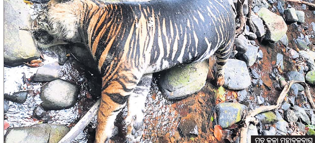
ମୃତ କଳା ମହାବଳବାର