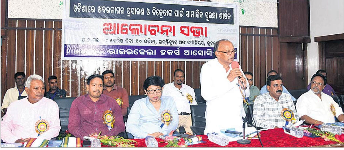
ଭୁବନେଶ୍ୱରସ୍ଥିତ ଇନ୍‌ଷ୍ଟିଚ୍ୟୁଟ ଅଫ ଇଣ୍ଟିନିୟର୍ସରେ ମଙ୍ଗଳବାର ରାଉରକେଲା ହର୍ବର୍ଥ ଆସୋସିଏଟସ୍ ପକ୍ଷରୁ ଆୟୋଜିତ 'ଓଡ଼ିଶାରେ ଖବରକାରୀଙ୍କ ପ୍ରସାରଣ ଓ ବିକ୍ରେତାଙ୍କ ପାଇଁ ସାମାଜିକ ସୁରକ୍ଷା' ଶୀର୍ଷକ ଆଲୋଚନା ସଭାରେ ଯୋଗଦେଇଥିବା ବିଭିନ୍ନ ଖବରକାରୀଙ୍କ ଅଧିକାରୀ ଏବଂ ଶ୍ରମିକ ନେତା ।