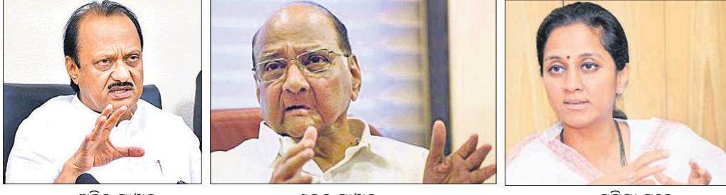
ଅଜିତ ପାଠ୍ୟର ଶରଦ ପାଠ୍ୟର ସୁପ୍ରିୟା ସୁଲେ

ଏହା ପରେ ତାଙ୍କ ଉତ୍ତରାଧିକାରୀ ଚୟନକୁ ନେଇ କ୍ଷମରତ ଆରମ୍ଭ ହୋଇଛି। ବରିଷ୍ଠ ଏନ୍‌ସିପି ନେତା ତଥା ପାଠ୍ୟର ଅଧ୍ୟକ୍ଷ ଅଜିତ ପାଠ୍ୟ ଏବଂ ଉପାଧ୍ୟକ୍ଷ ସୁଲେ ମଧ୍ୟରୁ ଜଣେ ଦଳର ନୂଆ ଅଧ୍ୟକ୍ଷ ହୋଇପାରନ୍ତି ବୋଲି ଚର୍ଚ୍ଚା ଚାଲି ଧରିଛି। ପାଠ୍ୟର ନିଜ ନିଷ୍ପତ୍ତି ନିଜ ବୟସ ଓ ସ୍ଵାସ୍ଥ୍ୟ ଦୃଷ୍ଟିରୁ ସେ ଏହି ପ୍ରତ୍ୟାହାର ନ କରିବା ଯାଏ ସଭାଗୁଳ ଛାଡ଼ିବେ ନାହିଁ ବୋଲି ଦଳର ବହୁ ନେତା ଓ କର୍ମୀ କହିଥିଲେ। ଏହାସତ୍ତ୍ଵେ ଅପରାହ୍ଣ ଜାତୀୟତାବାଦୀ କଂଗ୍ରେସ ପାର୍ଟି (ଏନ୍‌ସିପି) ପୁଖ୍ୟ ଶରଦ ପାଠ୍ୟର ଦଳର କର୍ମୀଙ୍କୁ କହିଥିଲେ। ଏହାସତ୍ତ୍ଵେ ଅପରାହ୍ଣ ଜାତୀୟତାବାଦୀ କଂଗ୍ରେସ ପାର୍ଟି (ଏନ୍‌ସିପି) ପୁଖ୍ୟ ଶରଦ ପାଠ୍ୟର ଦଳର କର୍ମୀଙ୍କୁ କହିଥିଲେ। ଏହାସତ୍ତ୍ଵେ ଅପରାହ୍ଣ ଜାତୀୟତାବାଦୀ କଂଗ୍ରେସ ପାର୍ଟି (ଏନ୍‌ସିପି) ପୁଖ୍ୟ ଶରଦ ପାଠ୍ୟର ଦଳର କର୍ମୀଙ୍କୁ କହିଥିଲେ।