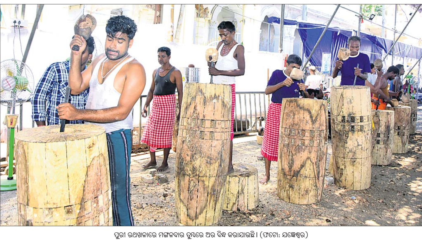
ପୁରୀ ରଥଖଳାରେ ମଙ୍ଗଳବାର ରୁପରେ ଅର ବିଷ କରାଯାଉଛି ।