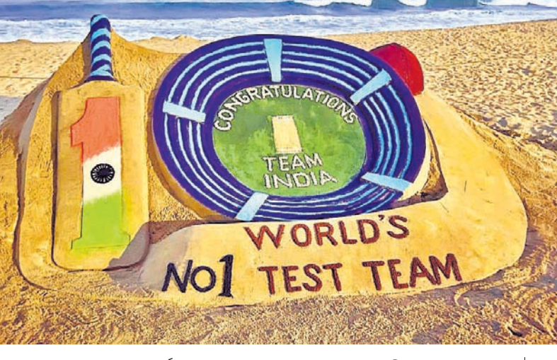
ପଦ୍ମଶ୍ରୀ ସୁବର୍ଣ୍ଣନ ପଟ୍ଟନାୟକ ମଙ୍ଗଳବାର ପୁରୀ ବେଳାଭୂମିରେ ବାଲୁକାକଳା ମାଧ୍ୟମରେ ଭାରତୀୟ କ୍ରିକେଟ୍ ଟିମ୍‌କୁ ଶୁଭେଚ୍ଛା ଜଣାଉଛନ୍ତି।