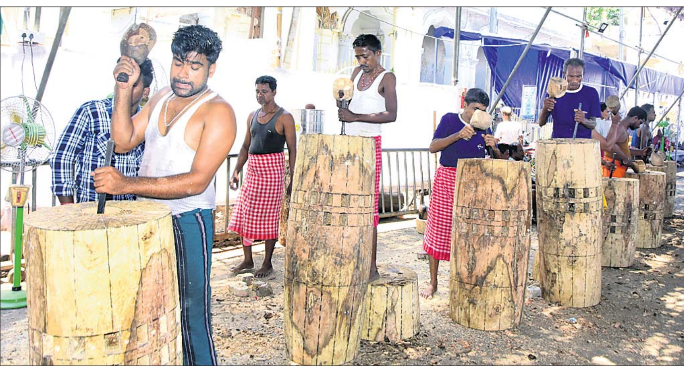
ପୁରୀ ରଥଖଳାରେ ମଙ୍ଗଳବାର ରୁସରେ ଅର ବିନ୍ଧ କରାଯାଇଛି ।