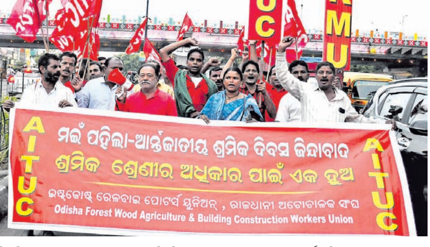
ଶ୍ରମିକ ଦିବସ ଅବସରରେ ସୋମବାର ଏଆଇଡିଏସ୍ ସଂଲଗ୍ନ ଇଷ୍ଟଫୋର୍ସ୍ଟ ରେଲୱେ ପୋର୍ଟର୍ସ୍ ଯୁନିୟନ୍ ଏବଂ ରାଜଧାନୀ ଅଗୋଚାଳକ ସଂଘ ପକ୍ଷରୁ ଶ୍ରମିକଙ୍କ ଅଧିକାର ଦାବିରେ ଭୁବନେଶ୍ଵରରେ ବାହାରିଥିବା ମିଳିତ ଶୋଭାଯାତ୍ରା।