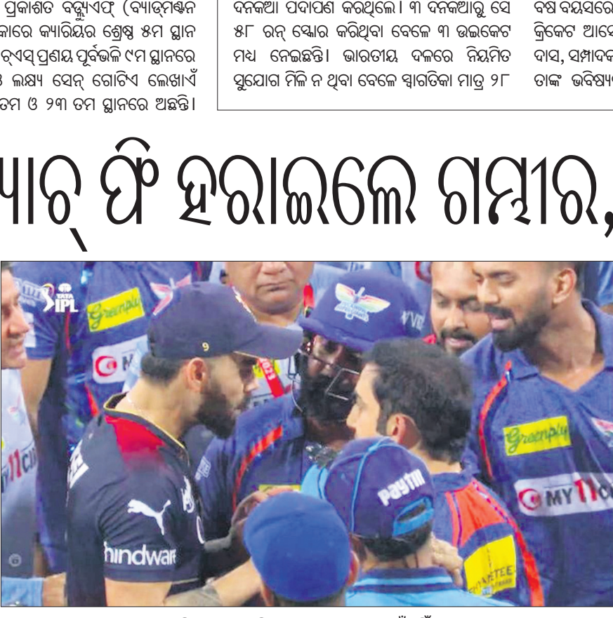
ବିରାଟ କୋହଲି ଓ ଚୌତମ ଗମ୍ଭୀର ମୁହାଁମୁହିଁ।

ଲକ୍ଷ୍ନୌ, ୨୫ (ପି.ଟି.) ଭାରତୀୟ ଷ୍ଟାର ବ୍ୟାଟର ବିରାଟ କୋହଲି ଓ ପୂର୍ବତନ ଓପନିଙ୍ଗ ବ୍ୟାଟର ଚୌତମ ଗମ୍ଭୀରଙ୍କ ମଧ୍ୟରେ ଝଗଡ଼ା ଏକ ନୂଆ ରୂପ ନେଇଛି। ଆଇପିଏଲ ମ୍ୟାଚ୍ ସମୟରେ ଉଭୟ ଖେଳାଳିଙ୍କ କଳିଆ ପଦାରେ ପଡ଼ିଛି। ମ୍ୟାଚ୍ ପରେ ଉଭୟଙ୍କ ମଧ୍ୟରେ ଯୁକ୍ତିତର୍କ ହୋଇଥିବା ବେଳେ ମ୍ୟାଚ୍ ଫିର ୧୦୦ ପ୍ରତିଶତ କଟାଯାଇଛି। ସୋମବାର ରୟାଲ ଟ୍ୟାଲେଣ୍ଟସ୍ ବାଙ୍ଗାଲୋର(ଆର୍ଭିବି) ଓ ଲକ୍ଷ୍ନୌ ସୁପର କ୍ୟାଣ୍ଟ୍ ମଧ୍ୟରେ ଅନୁଷ୍ଠିତ ଲେଖାଏ ମ୍ୟାଚ୍ରେ ୧୮ ରନ୍ରେ ଛିଟି ନେଇଥିଲା ବିରାଟ କୋହଲିଙ୍କ ଦଳ। ଏହାପରେ ଉଭୟ ଖେଳାଳି ପରସ୍ପର ସହିତ ଯୁକ୍ତିତର୍କ କରିଥିଲେ। ଏଭଳି ଅଶୋଭନୀୟ ଆଚରଣ ପାଇଁ ମଙ୍ଗଳବାର ବିଭିନ୍ନ ଆଇପିଏଲ ଉଭୟ ଖେଳାଳିଙ୍କୁ ଦଣ୍ଡିତ କରାଯାଇଛି। ଉଭୟଙ୍କ ମ୍ୟାଚ୍ ଫିର ୧୦୦ ପ୍ରତିଶତ ଅର୍ଥ ଫାଇନ୍ ଆକାରରେ କାଟି ଦିଆଯାଇଛି। ଆଇପିଏଲର ଧାରା ୨.୨୧ ଆଧୀନରେ ଉଭୟ ଖେଳାଳିଙ୍କ ବୟାନ କ୍ରୀଡ଼ା ଭାବନାକୁ ଆଘାତ ପହଞ୍ଚାଇଛି। ମ୍ୟାଚ୍ ସମାପ୍ତ ହେବା