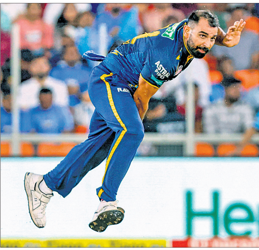
ଚେନ୍ନାଇ ଅଫ୍ ଦି ମ୍ୟାଚ୍ ମହମ୍ମଦ ଶାମି।