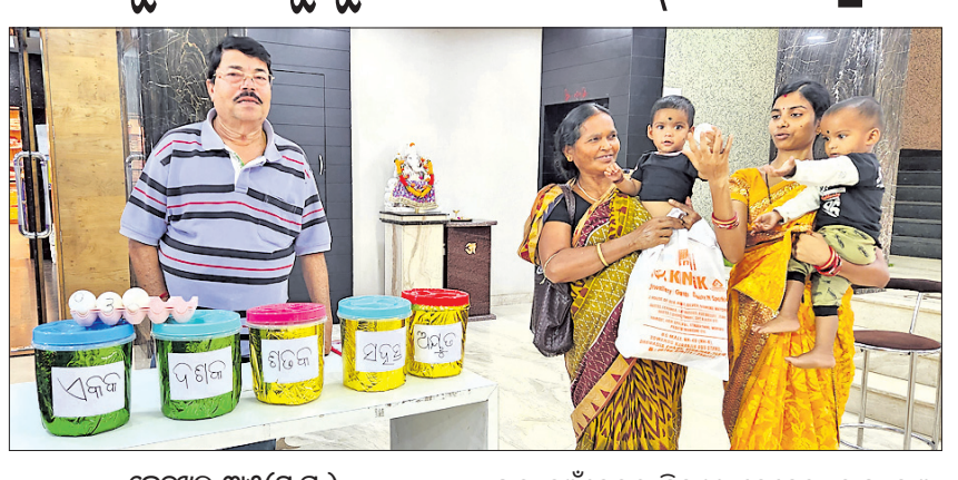
କେନ୍ଦୁଝର, ୩।୫ (ସ.ପ୍ର.)

କେନ୍ଦୁଝର ଜିଲାର ଅଗ୍ରଣୀ ଅଳଙ୍କାର ପ୍ରତିଷ୍ଠାନ କନକ କୁଳଧରରୁ ସୁନା କିଣି ଇ-ବାଇକ୍ ପାଇଲେ ଗ୍ରାହକ। ଏପରିକି ୨୦୨୩ ଏପ୍ରିଲ ଠାରୁ ଅଧିକ ଟୁଟାୟା ପର୍ଯ୍ୟନ୍ତ ସୁନା ଅଳଙ୍କାର କ୍ରୟ ଉପରେ ସ୍ୱତନ୍ତ୍ର ରିହାତି ବ୍ୟବସ୍ଥା କରାଯାଇଥିଲା। ଏଥିସହ ୫ ହଜାର ଟଙ୍କାରୁ ଅଧିକ ସୁନା କିଣିଲେ ମାଗଣା ଲଚେରା କୁପନ୍ ବ୍ୟବସ୍ଥା କରାଯାଇଥିଲା।