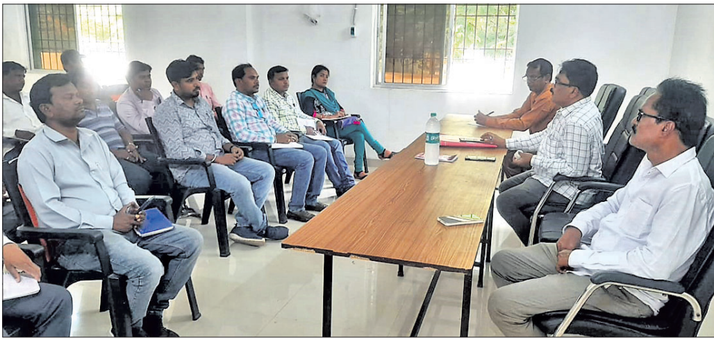
ଇ-ନାମ୍ କର୍ମଶାଳାରେ ଉପସ୍ଥିତ ଅଧିକାରୀ, ସଦସ୍ୟବୃନ୍ଦ।

କୃଷିଜାତ ପ୍ରବ୍ୟକ୍ତ ବହୁମାତ୍ରାରେ ଇ-ନାମ୍ (ଇ ନ୍ୟାମିଂ) ଏକ୍ସିକ୍ୟୁଟିଭ୍ ମାଡର୍ଣ୍ଣ ପ୍ଲାନିଂ ମାଧ୍ୟମରେ କ୍ରୟ, ବିକ୍ରୟ କରାଯିବା ଉଦ୍ଦେଶ୍ୟରେ ବୁଧବାର ବରଗଡ଼ ନିୟନ୍ତ୍ରିତ ବଜାର କମିଟି କୃଷକ ବଜାର ପରିସରରେ ରହିଥିବା ଇ-ନାମ୍ ସମ୍ପର୍କୀତ କାର୍ଯ୍ୟକ୍ରମ କାର୍ଯ୍ୟକ୍ରମ କରାଯାଇଛି।