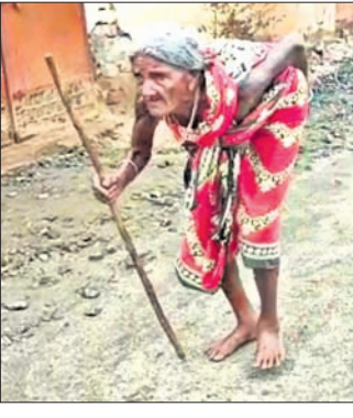
ବୃକ୍ଷା ଜଣକ ଭତ୍ତା ଟଙ୍କା ଉଠାଇବା ପାଇଁ ଯାଉଛନ୍ତି ।

୫୦୦ ଟଙ୍କା ଭତ୍ତା ପାଇଁ ୫ ଜିଲ୍ଲାମିତର ଚାଲିଲେ ବୃକ୍ଷା