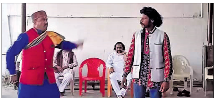
ଚାରକାସୁର ତୟନ ପାଇଁ କଳାକାର ଅଭିନୟ କରୁଛନ୍ତି।

ରାଉରକେଲା ଅର୍ପିସ୍, ୩୫: ଝିରପାଣି ଥାନା ଅଧୀନ ଚର୍ଚ୍ଚିଗେର ସମ୍ମୁଖରେ ଚୋରା ବାଲି ଚାଲିଗ ବେଳେ ଗା ଗ୍ରାହକରୁ ଅତିରିକ୍ତ ତହସିଲଦାର ପ୍ରିୟଦର୍ଶିନୀ ବଳ ଜବତ କରିଛନ୍ତି।