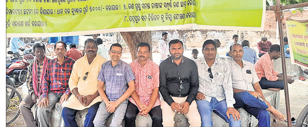
ଉପଜିଲାପାଳଙ୍କ କାର୍ଯ୍ୟାଳୟ ସମ୍ମୁଖରେ ଧାରଣାର ଚାଷୀ।

ବକେୟା ଫସଲ ବାମା ରାଶି ପ୍ରଦାନ ଦାବିରେ ବରଗଡ଼ ଜିଲା ରାଜ ବୋଷାସର କୃଷକ ସଂଗଠନ ପକ୍ଷରୁ ଉପଜିଲାପାଳଙ୍କ କାର୍ଯ୍ୟାଳୟ ସମ୍ମୁଖରେ ଦୀର୍ଘ ୧୮୫ଦିନ ହେଲା ଧାରଣାର କାରୀ ରହିଛି।