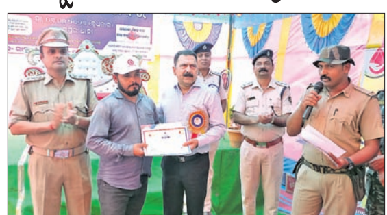
ରକ୍ତଦାନକୁ ଏସିଏ ମାନପତ୍ର ଦେଇ ସମର୍ଥନ କରୁଛନ୍ତି।

ରକ୍ତଦାନ ଶିବିର ପ୍ରସ୍ତୁତ ହୋଇପାରିଛି। ଶିବିରକୁ ପ୍ରସ୍ତୁତ କରିବା ପାଇଁ ରାମପୁର ଥାନାରେ ମେରା ରକ୍ତଦାନ ଶିବିର ଅନୁଷ୍ଠିତ ହୋଇପାରିଛି। ଶିବିରକୁ ପ୍ରସ୍ତୁତ କରିବା ପାଇଁ ରାମପୁର ଥାନାରେ ମେରା ରକ୍ତଦାନ ଶିବିର ଅନୁଷ୍ଠିତ ହୋଇପାରିଛି।