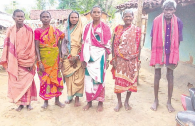
ଭତ୍ତା ପାଇବାକୁ ବଞ୍ଚିତ ବୃକ୍ଷାମାନେ ।

କରିବାରେ ସମ୍ମତ ହୋଇପାରୁ ନାହିଁ । ଫଳରେ ସେମାନେ ଘରେ ପଡ଼ି ରହିଛନ୍ତି । ପଞ୍ଚାୟତରୁ ପାଉଥିବା ବାଉଳ ଉପରେ ନିର୍ଭର କରି ଚଳୁଛନ୍ତି । ଦୀର୍ଘ ୫ ବର୍ଷ ହେବ ଭତ୍ତା ପାଇବା ପାଇଁ ଆବଶ୍ୟକ କାଗଜପତ୍ର ପ୍ରସ୍ତୁତ କରି ପଞ୍ଚାୟତ କାର୍ଯ୍ୟାଳୟରେ ଦେଇ ଆସୁଥିଲେ ମଧ୍ୟ ଅବ୍ୟାବଧି ସେମାନଙ୍କୁ ଭତ୍ତା ପ୍ରଦାନ କରାଯାଇନାହିଁ । ଏହାମଧ୍ୟରେ ପଞ୍ଚାୟତ ଓ ବ୍ଲକ କାର୍ଯ୍ୟାଳୟକୁ ବହୁବାର ଚାଲି ଚାଲି ନିୟତି ହେଲେ ଫଳରେ ବୃକ୍ଷା ବୃକ୍ଷମାନେ ବିଭିନ୍ନ ସମସ୍ୟା ଦେଇ ଗତି କରୁଛନ୍ତି । ଏନେଇ ଖପ୍ରାଖୋଲ ବିଏସଏସଓ କନିଷ୍ଠ ବିଭାଗକୁ ଯୋଗାଯୋଗ ପାଇଁ ଦେଖା କରାଯାଇଥିଲା । କିନ୍ତୁ ଯୋଗାଯୋଗ ସମ୍ଭବପରି ହୋଇ ନ ଥିବାରୁ ତାଙ୍କ ପ୍ରତିକ୍ରିୟା ମିଳି ପାରିନାହିଁ । ବ୍ଲକ ପ୍ରଶାସନ ଏଥିପ୍ରତି ସ୍ଵତନ୍ତ୍ର ଦୃଷ୍ଟି ଦେଇ ଯଥାଶୀଘ୍ର ଭତ୍ତା ପ୍ରଦାନର ବ୍ୟବସ୍ଥା କରିବାକୁ ସାଧାରଣରେ ଦାବି ହେଉଛି ।