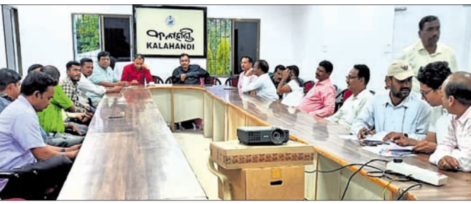
କନଫରେନ୍ସ ହଲରେ ଚାଲିଥିବା ପ୍ରସ୍ତୁତି ବୈଠକ।

କଳାହାଣ୍ଡି ଜିଲା ପ୍ରତ୍ୟୟ ତୃତୀୟ ପର୍ଯ୍ୟାୟରେ ୧୧୫ଟି ଉପାନ୍ତରୀୟ ୫-ଟି ହାଇସ୍କୁଲ ଉଦ୍ଘାଟନ ପାଇଁ ପ୍ରସ୍ତୁତି ରାଜିଛି। ମେ ୮ରେ ଭବାନୀପାଟଣା ପୋଲିସ ହାଇସ୍କୁଲ ପରିସରରେ ଏହାର ଶୁଭାରମ୍ଭ ହେବ। ଭର୍ଚୁଆଲ ମୋଡରେ ପୁଞ୍ଜୀମୟ ନବୀନ ପଢ଼ନାୟକ