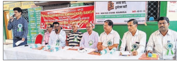
ସଚେତନତା ଶିବିରରେ ମହାସଭା ଅତିଥି