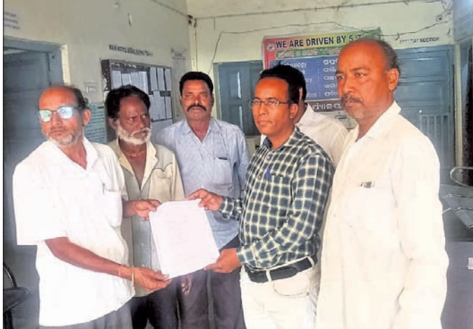
ତହସିଲଦାରଙ୍କୁ ଚାଷୀମାନେ ଦାବିପତ୍ର ପ୍ରଦାନ କରୁଛନ୍ତି।

ପ୍ରତ୍ୟେକ ବର୍ଷ ଧାନ ବିକ୍ରୀ ବେଳେ ଚାଷୀ ନାହିଁ ନ ଥିବା ସମସ୍ୟାର ସମ୍ମୁଖୀନ ହୋଇଥାଏ।