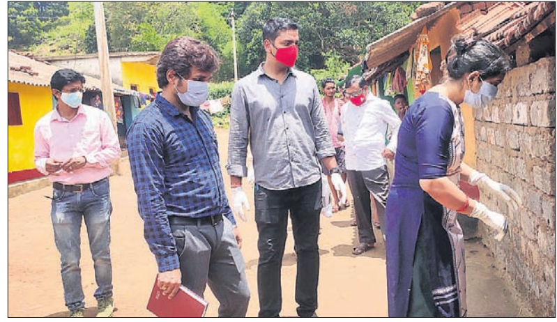
ସ୍ୱାସ୍ଥ୍ୟ ବିଭାଗ ଚିମ୍ତ୍ର ଗ୍ରାମବାସୀଙ୍କୁ ଘରେ ଘରେ ଔଷଧ ବଣ୍ଟନ କରୁଛନ୍ତି।