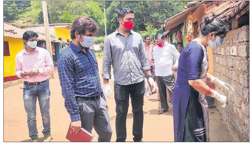
ସ୍ୱାସ୍ଥ୍ୟ ବିଭାଗ ଚିମ୍ପ ଗ୍ରାମବାସୀଙ୍କୁ ଘରେ ଘରେ ଔଷଧ ବଣ୍ଟନ କରୁଛନ୍ତି।