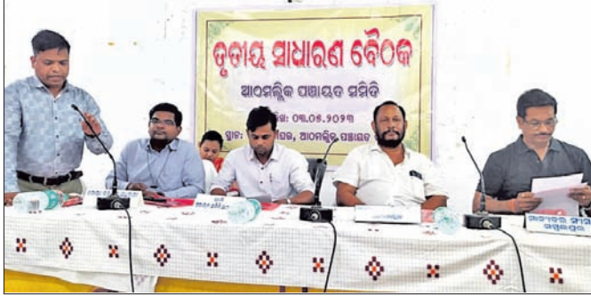
ପଞ୍ଚାୟତ ସମିତିର ବୃତ୍ତୀୟ ସାଧାରଣ ବୈଠକରେ ଉପସ୍ଥିତ ଜନପ୍ରତିନିଧି ଓ ଅଧିକାରୀ।