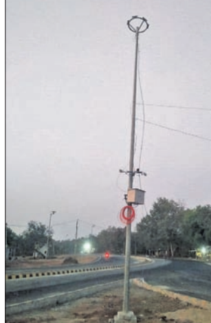
ସମ୍ପ୍ରଦାରଣ ହେବା ସହ ଛକରେ ବାରମ୍ବାର ବୁଦ୍ଧିଗଣ ଘରୁଛି। ଯାତ୍ରୀଙ୍କ ସୁବିଧା ପାଇଁ ଆଠମଲିକ ବିଧାୟକ ରମେଶ ଚନ୍ଦ୍ର

ଏନ୍ଏଚ୍ ୧୫୩(ବି)ର ସମ୍ପ୍ରଦାରଣ କାମ ଅନୁଗୋଳ ଜିଲ୍ଲା ଆଠମଲିକଠାରେ ଶେଷ ହୋଇଥିଲେ ହେଁ କିଆକଟା ଛକରେ ବିଦ୍ୟୁତ୍ ସଂଯୋଗ ହୋଇନାହିଁ। ଏ ନେଇ ଗ୍ଲାମାୟ ଅଞ୍ଚଳରେ ଅଧିକାରୀଙ୍କୁ ଦେଖାଦେଇଛି। ପ୍ରକାଶ ଯେ, ରାଜପଥ ସମ୍ପ୍ରଦାରଣ ପାଇଁ ଅନୁଗୋଳ ଜିଲ୍ଲା ଆଠମଲିକ ବ୍ଲକ୍ କିଆକଟା ଛକରେ ବିଦ୍ୟୁତ୍ ବିଚ୍ଛିନ୍ନ ପାଇଁ ଏନ୍ଏଚ୍ ଡିଭିଜନ ସମ୍ବଲପୁର ପକ୍ଷରୁ ୧୨ ଡିସେମ୍ବର ୨୦୨୨ରେ ନୟର ୩୫୩୦ରେ ଆଠମଲିକ ବିଦ୍ୟୁତ୍ ବିଭାଗକୁ ପତ୍ର ଲେଖାଯାଇଥିଲା। ହେଲେ ଛକ ସମ୍ପ୍ରଦାରଣ କାମ ଶେଷ ହେବାର ଦୀର୍ଘଦିନ ବି ଯାଇଥିଲେ ସୁଦ୍ଧା ଆଜି ପର୍ଯ୍ୟନ୍ତ ବିଦ୍ୟୁତ୍ ସଂଯୋଗ ହୋଇପାରିନାହିଁ। ଫଳରେ ସନ୍ଧ୍ୟା ହେଲେ ବୋକାଳୀମାନେ ନାହିଁ ନ ଥିବା ସମସ୍ୟାର