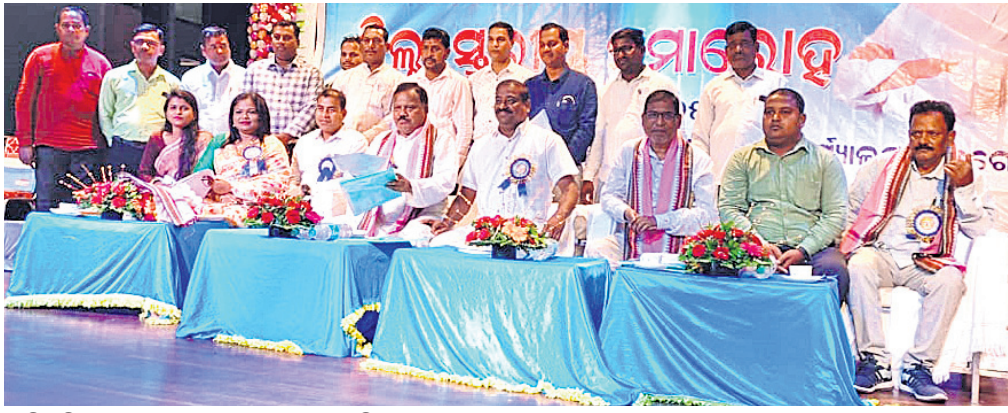
ଶ୍ରମିକ ଦିବସ ପାଳନ ଅବସରରେ ମହାସଭା ଅତିଥି ଓ ଅଧିକାରୀମାନେ।