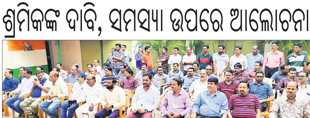
ନାଲକୋ ଶ୍ରମିକ କଂଗ୍ରେସ କାର୍ଯ୍ୟାଳୟରେ ଶ୍ରମିକ ଦିବସ ପାଳନ ଅବସରରେ ଉପସ୍ଥିତ କର୍ମଚାରୀମାନେ।

ଅନୁଗୋଳ ଜିଲ୍ଲା ଆଠମଲିକ ଅବକାରୀ ବିଭାଗ ପକ୍ଷରୁ ରୁଧିରା ଠାକୁରନାଥ ଥାନା ଅଞ୍ଚଳର ବିଭିନ୍ନ ଗ୍ରାମରେ ଚଢ଼ାଉ କରାଯାଇ ଚୋରା ଦେଖା ମହୁଲି ମଦ ଜବତ କରାଯାଇଛି। ଏଥିସହ ୬ ଜଣଙ୍କୁ ଗିରଫ କରିଛି। ବିଭାଗ ପକ୍ଷରୁ କୁହାଯାଇଛି, ଧର୍ତ୍ତାତୋପା ଗ୍ରାମର ଦୁଃଖିନ୍ଦ୍ର ଦେବୁରା, ଦାମଦାହାଳ ଗ୍ରାମର ପୁନି ପ୍ରଧାନ, ଖଡ଼କବାହାଳ ଗ୍ରାମର ପ୍ରଫୁଲ୍ଲ ବେହେରା, ବିକୁଳି ବେହେରା, ଯୋଡ଼ାବାଣ୍ଡୁ ଗ୍ରାମର ଗୌରମୋହନ ପ୍ରଧାନ ଏବଂ ଆରାମପୁର ଗ୍ରାମର ରସାବନ ପ୍ରଧାନଙ୍କ ଠାରୁ ଚୋରା ମଦ ଜବତ କରାଯାଇଛି। ଏମାନେ ଚୋରାରେ ମଦ ବିକ୍ରି କରୁଥିବା ଖବରପାଇ ଆଠମଲିକ ଅବକାରୀ ବିଭାଗ କର୍ମଚାରୀମାନେ ଚଢ଼ାଉ କରିଥିଲେ।