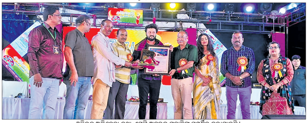
ଓଲିଉଡ଼ ଅଭିନେତା ତଥା ଏମ୍ପି ଅନୁଭବ ମହାନ୍ତିଙ୍କୁ ସମ୍ବର୍ଦ୍ଧିତ କରାଯାଇଛି।

ଦେଈନାଳ ଅଧିକ, ୩୫ କଳା, ସଂସ୍କୃତିର ମାଟି ହେଉଛି ଦେଈନାଳ। ଚଳଚ୍ଚିତ୍ର ଜଗତକୁ ଏହି ମାଟିର ଅବଦାନ ଅନନ୍ୟ। ଏଠାକାର ବହୁ ପ୍ରତିଭାବାନ କଳାକାର ସିନେମା ଶିଳ୍ପରେ ସୁନାମ ଅର୍ଜିଛନ୍ତି। କାତାୟଣରେ ନାଁ ମଧ୍ୟ କରିଛନ୍ତି। ସମଗ୍ର ରାଜ୍ୟରେ ଦେଈନାଳର ପରିଚୟ ଭିନ୍ନ ଭୋଲି କରିଛନ୍ତି କେନ୍ଦ୍ରାପଡ଼ା ଏମ୍ପି ତଥା ଓଲିଉଡ଼ ଅଭିନେତା ଅନୁଭବ ମହାନ୍ତି। ସ୍ଥାନୀୟ ମିଳି ଷ୍ଟୁଡିଓମରେ