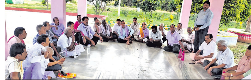
ମା'ରାମଚଣ୍ଡୀଙ୍କ ପ୍ରାର୍ଥନା ମଣ୍ଡପରେ ବସିଥିବା ବୈଠକରେ ଉପସ୍ଥିତ ଗ୍ରାମବାସୀ।

ଅନ୍ତର୍ଭୁକ୍ତ ହେବା ପରେ କେତେକ ଗୋଷ୍ଠୀ ଏହାକୁ ବିରୋଧ କରୁଥିବାରୁ ପ୍ରାୟ ୧୫ରୁ ଅଧିକ ପଞ୍ଚାୟତର ଗ୍ରାମବାସୀଙ୍କୁ ନେଇ ଏହାର ପ୍ରତିବାଦ କରାଯିବ ବୋଲି ଆଲୋଚନା ହୋଇଥିଲା। ଆସନ୍ତା ସୋମବାର ଉକ୍ତ ପଞ୍ଚାୟତ ଗୁଡ଼ିକକୁ ନିକଟକୁ ପଠାଇବା ପାଇଁ ବୈଠକରେ ମାନ୍ୟଗଣ୍ୟ ବ୍ୟକ୍ତିଙ୍କୁ ଡକାଯାଇ ପୁନର୍ବାର ନିଷ୍ପତ୍ତି ନିଆଯାଇଥିଲା। କୋଶଳା ଗୋଷ୍ଠୀ ଆଲୋଚନା କରାଯିବ ବୋଲି ସ୍ଥିର କରାଯାଇଥିଲା।