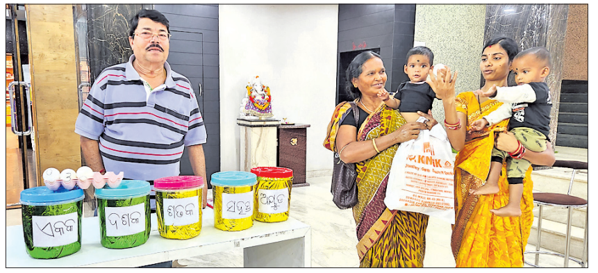
କେନ୍ଦୁଝର, ୩୧୫ (ସ.ପ୍ର.)

କେନ୍ଦୁଝର ଜିଲାର ଅଗ୍ରଣୀ ଅଳଙ୍କାର ପ୍ରତିଷ୍ଠାନ କନକ କୁଳଧରରୁ ସୁନା କିଣି ଇ-ବାଇକ୍ ପାଇଲେ ଗ୍ରାହକ।