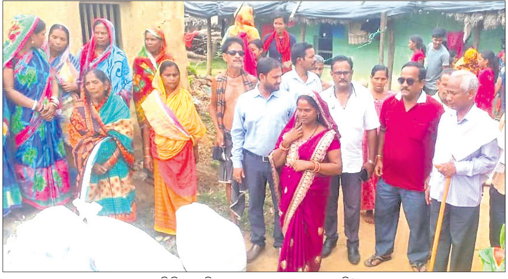
ଅଗ୍ନି ବିପନ୍ନ ପରିବାରଙ୍କୁ ସହାୟତା ପ୍ରଦାନ କରାଯାଇଛି।

ବିକିନ ଉପାୟରେ ଚଢ଼ା ଉଠାଇ ଏହାକୁ ଆତ୍ମସାତ୍ କରିଦେଇଥିଲେ। ଦୀର୍ଘ ୪ବର୍ଷ ଧରି ଅଧିକାରୀଙ୍କୁ ଅଭିଯୁକ୍ତା ମହିଳା ଭୁଆଁ କୁଲାଇଥିଲେ। ଶେଷରେ ଦେଈନାଳ ଅଧିକାରୀମାନଙ୍କୁ ମହାନ୍ତିଙ୍କ ଅଭିଯୋଗକ୍ରମେ ଗତ ମାର୍ଚ୍ଚ ୨୦ରେ ଏ ନେଇ ଭୁବନ ଥାନାରେ ନଂ. ୮୯/୨୩ରେ ଏକ ମାମଲା ରୁଜ୍ ହୋଇଥିଲା। ପୋଲିସ୍ ଘଟଣାର ତଦନ୍ତକରି ତଥ୍ୟପ୍ରାପଣ ସଂଗ୍ରହ କରିବା ପରେ ମାନସୀଙ୍କୁ ଗିରଫ କରି ଭୁବନ କୋର୍ଟରେ ହାଜର କରାଯାଇଥିଲା। ଜାମିନ ନାମସ୍ତର ହେବା ପରେ ତାଙ୍କୁ କାମାକ୍ଷାନଗରସ୍ଥିତ ବିଚାର ବିଭାଗର ହାଜତକୁ ପଠାଇ ଦିଆଯାଇଛି।