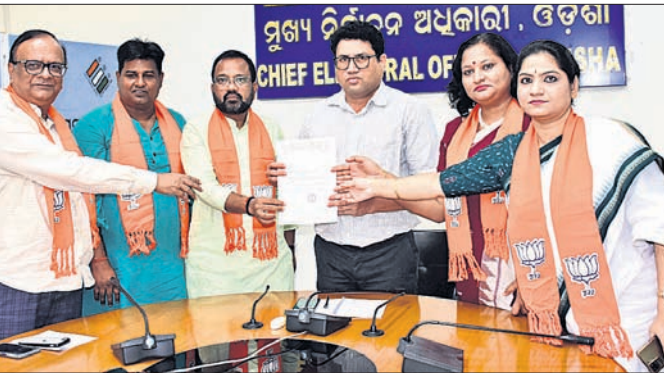
ସିଦ୍ଧିଚିତ୍ତି ଭେଟି ଭାଜପା ପ୍ରତିନିଧି ଦଳ ଝାରସୁଗୁଡ଼ା ଉପନିର୍ବାଚନ ସମ୍ପର୍କରେ ଦାବିପତ୍ର ଦେଉଛନ୍ତି।

ପୁଣି ଓ ନିରପେକ୍ଷ ନିର୍ବାଚନ ନେଇ ଆଶଙ୍କା ସୃଷ୍ଟି ହୋଇଛି। ସେହିପରି ଝାରସୁଗୁଡ଼ା ବିଧାନସଭାରେ ସମୁଦାୟ ୨୫୩ ରୁପ ଥିବା ୭୨ଟି ରୁପ ଅତି ଉଚ୍ଚେକମାପ୍ରବଣ ଥିବା ଆଶଙ୍କା କରାଯାଉଛି। ନିର୍ବାଚନ ସମୟରେ ଏହି ରୁପରେ ବ୍ୟାପକ ସୁରକ୍ଷା ଓ ସିଦ୍ଧିଚିତ୍ତି ବ୍ୟବସ୍ଥା କରି ଝାରସୁଗୁଡ଼ା ଉପନିର୍ବାଚନକୁ ଅଧାଧା, ପୁଣି, ନିରପେକ୍ଷ କରିବା ପାଇଁ ରାଜ୍ୟ ନିର୍ବାଚନ ଅଧିକାରୀ ଦୃଢ଼ ପଦକ୍ଷେପ ଗ୍ରହଣ କରନ୍ତୁ ବୋଲି ଭାଜପା ଦାବି କରିଛି।