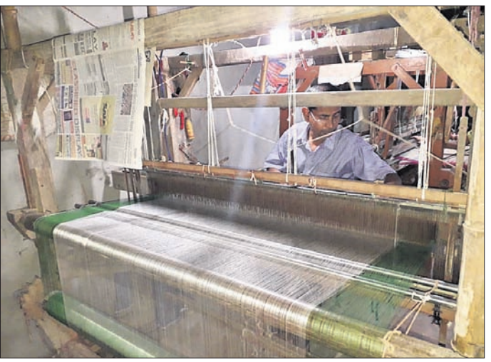
ଚନ୍ଦ୍ରକୋଷାରେ କୋଷା ବୁଣାକାର ଲୁଗା ବୁଣୁଛନ୍ତି।

ଦାବି ସମ୍ପର୍କରେ ବୟନଶିଳ୍ପ, ହସ୍ତତନ୍ତ ଓ ହସ୍ତଶିଳ୍ପ ବିଭାଗ ନିର୍ଦ୍ଦେଶକଙ୍କ ନିକଟରେ ଉର୍ଦ୍ଧ୍ୱ ଚନ୍ଦ୍ରକୋଷା ଠିକ୍ ହୋଇଯାଇଛି।