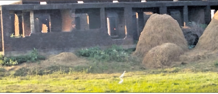
ଖଡ଼ିଅଣ୍ଡାରେ ଥିବା ଏବଂଏମ୍ କେନ୍ଦ୍ର ଏବେ ଭୂତକୋଠି ପାଲଟିଛି। ନିର୍ମିତ ତାଳବଜାର ଅଧାପଡ଼ିଆ ହୋଇ ପଡ଼ିରହିଛି।