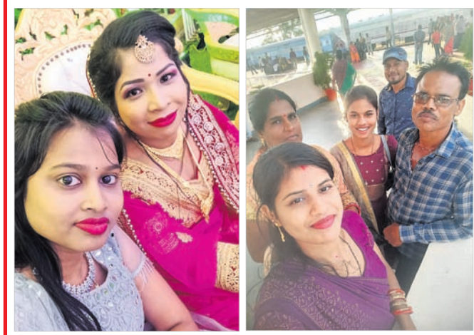
@ ସୁନାପ୍ତା @ ବୈଶାଳୀ