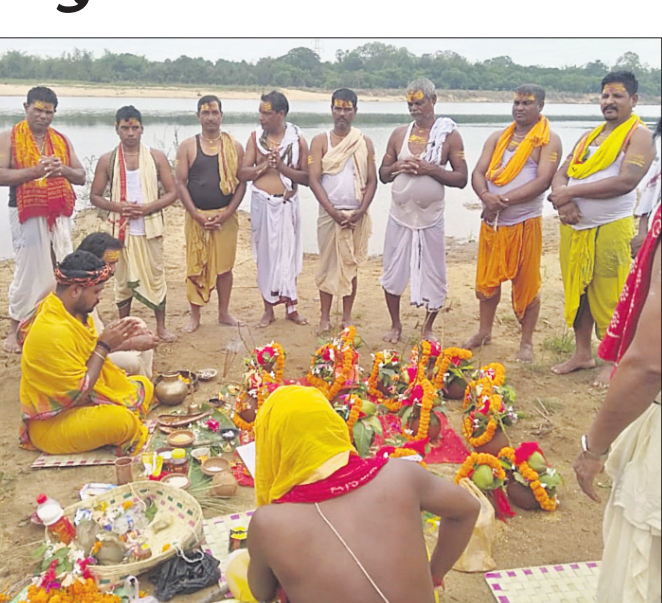
ବିଷ୍ଣୁଶାନ୍ତି ମହାଯଜ୍ଞ ପାଇଁ କବଚ ପୂଜା କରାଯାଇଛି।