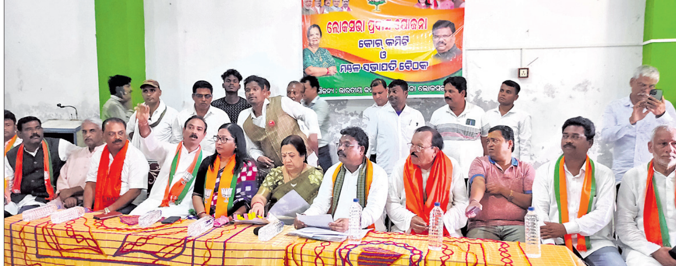
ଧରାକୋଟରେ ଆୟୋଜିତ ବୈଠକରେ କେନ୍ଦ୍ର ରେଳ ରାଷ୍ଟ୍ରମନ୍ତ୍ରୀଙ୍କ ସମେତ ଭାଜପା ପଦାଧିକାରୀ।

କେନ୍ଦ୍ର ରେଳ ଓ ବୟାନ ଶିଳ୍ପ ରାଷ୍ଟ୍ରମନ୍ତ୍ରୀ ଦର୍ଶନା ଯରଦୋଶ ଦୁଇ ଦିନିଆ ଗଞ୍ଜାମ ଗସ୍ତରେ ଆସିଛନ୍ତି। ରୁଧିରୀ ସହର ୧୧୨୩ ସମୟରେ ପ୍ରଥମେ ଖଲିକୋଟ ରେଳ ଷ୍ଟେଶନରେ ପହଞ୍ଚିଥିଲେ।