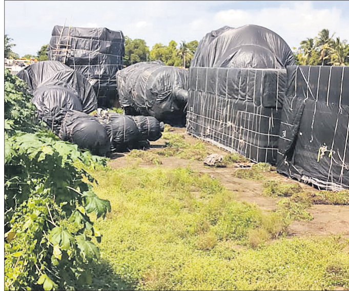
କମ୍ପାନୀ ପାଇଁ ଆସିଥିବା ଯନ୍ତ୍ରାଂଶ ଓ ଅନ୍ୟ ସାମଗ୍ରୀ ପଲିଥିନରେ ଘୋଡା ହୋଇ ରହିଛି।

କାମ ସରିଥିଲା। କମ୍ପାନୀର ନିର୍ମାଣ ସାମଗ୍ରୀ ମଧ୍ୟ ବିଦେଶରୁ ଆମଦାନୀ ସରିଥିଲା। ୨୦୧୭ ସେପ୍ଟେମ୍ବର ୧୫ରେ ପରିବେଶୀୟ ଜନଶୁଣାଣୀ ମଧ୍ୟ ସରିଥିଲା। ସେତେବେଳେ କମ୍ପାନୀ ପକ୍ଷରୁ କୁହାଯାଇଥିଲା ଯେ ନିର୍ମାଣ ୩୭ ମାସ ମଧ୍ୟରେ ସରିବ। କମ୍ପାନୀର ୨୦୨୦ରୁ ବୋଲି ରୂପାନ୍ତ ପର୍ଯ୍ୟାୟରେ ହେବୁଥିବା ୮୩.୨୬ ଏକର ଜମି ଅଧିଗ୍ରହଣ ସରିଛି। କମ୍ପାନୀ ପାଇଁ ପାଟେଣ୍ଟ