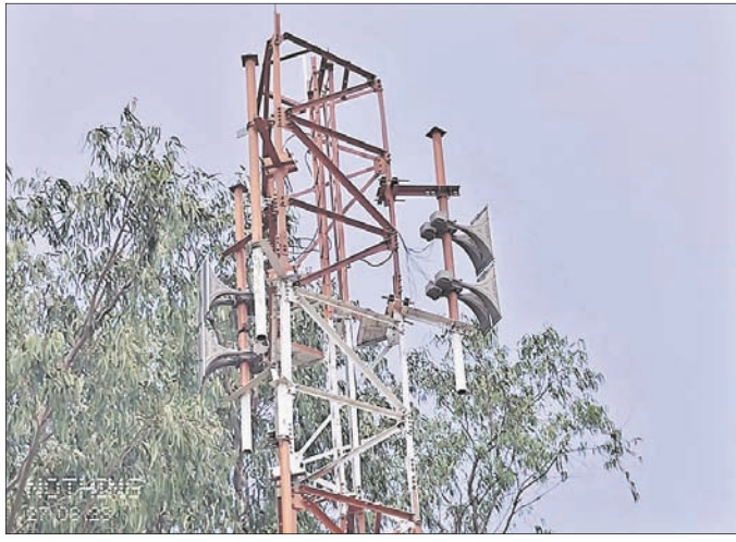
ମହାକାଳପଡ଼ା ବ୍ଲକରେ ଥିବା ସୁନାମି, ବାତ୍ୟା ଆଲର୍ଟ କେନ୍ଦ୍ରର ସାଇରନ

ପର୍ଯ୍ୟନ୍ତ ଏହା ଶୁଣାଯାଏ। ଲୋକମାନେ ତଳିଆ ଅଞ୍ଚଳକୁ ଉତ୍ତରାଧିକାରୀ ଯିବାକୁ ଏହା ଦ୍ୱାରା ସୂଚନା ଦିଆଯାଇଥାଏ। ପରେ ଲୋକମାନେ ସ୍ଥାନାନ୍ତର ହୋଇଥାନ୍ତି। ହେଲେ ଏଥିମଧ୍ୟରୁ ୧୦ଟିରେ ସାଇରନ୍ ବାଜୁ ନ ଥିବା ସ୍ଥାନୀୟ ଅଞ୍ଚଳବାସୀଙ୍କ ପାଇଁ ତିରାକରଣ ହୋଇଛି।