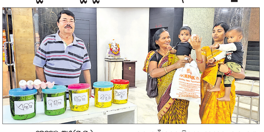
କେନ୍ଦୁଝର, ୩।୫ (ସ.ପ୍ର.)