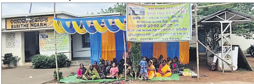
କ୍ରିୟାନ୍ୱୟାନ କମିଟି ପକ୍ଷରୁ ଗଣଧାରଣା ଦିଆଯାଇଛି।

ସୁନିଲ ଖଣି ଅଞ୍ଚଳର ୭ ପଞ୍ଚାୟତରେ ହେବାକୁ ଥିବା ବିଭିନ୍ନ ଗ୍ରାମର ପୋଖରୀ ସୌନ୍ଦର୍ଯ୍ୟକରଣ ଓ ରାସ୍ତା କାର୍ଯ୍ୟର ଶିଳାନ୍ୟାସ କରାଯାଇଛି।