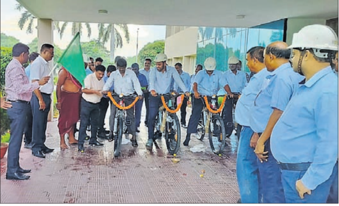
ପିପିଏଲ୍ ସିଏମ୍‌ପି ପ୍ରସାବ ଭଙ୍ଗାଚାର୍ଯ୍ୟ ଇ-ସାଇକେଲକୁ ଉଦ୍‌ଘାଟନ କରୁଛନ୍ତି।