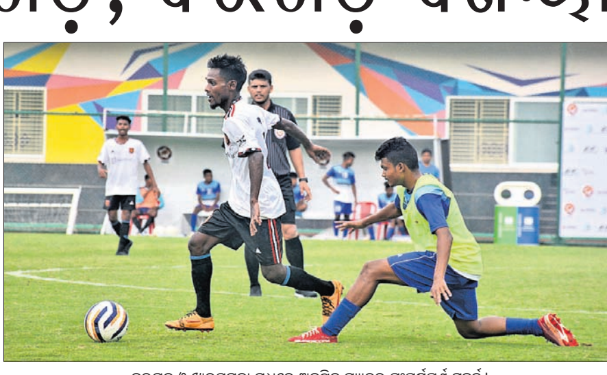
ବରଗଡ଼ ଓ ଖାରସୁକୁଡ଼ା ମଧ୍ୟରେ ଅନୁଷ୍ଠିତ ମ୍ୟାଚର ସଂଗ୍ରହପୂର୍ଣ୍ଣ ପୃଷ୍ଠା।

କମିଶନର ଦାୟିତ୍ୱ ତୁଲାଇଥିଲେ। ଭୁବନେଶ୍ୱରରେ ଖାସିଗାଲ ଆରୋନାଠିରେ ଖେଳାଯାଇଥିବା ଦ୍ୱିତୀୟ ମ୍ୟାଚରେ ବରଗଡ଼ ୩-୨ ଗୋଲରେ ଖାରସୁକୁଡ଼ାକୁ ହରାଇ ଦେଇଛି। ଏହି ମ୍ୟାଚରେ ବରଗଡ଼ ପକ୍ଷରୁ କମିଶନର ଦାୟିତ୍ୱ ତୁଲାଇଥିଲେ। ଭୁବନେଶ୍ୱରରେ ଖାସିଗାଲ ଆରୋନାଠିରେ ଖେଳାଯାଇଥିବା ଦ୍ୱିତୀୟ ମ୍ୟାଚରେ ବରଗଡ଼ ୩-୨ ଗୋଲରେ ଖାରସୁକୁଡ଼ାକୁ ହରାଇ ଦେଇଛି। ଏହି ମ୍ୟାଚରେ ବରଗଡ଼ ପକ୍ଷରୁ କମିଶନର ଦାୟିତ୍ୱ ତୁଲାଇଥିଲେ।