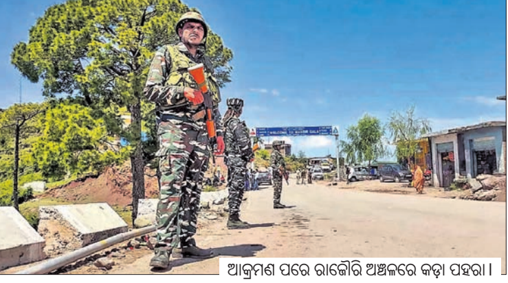
ଆକ୍ରମଣ ପରେ ରାକୌରି ଅଞ୍ଚଳରେ କଡ଼ା ପହରା।

ଶ୍ରୀନଗର, ୫/୫ କମ୍ପ୍ୟୁ-କମ୍ପାରର ରାକୌରି ଜିଲ୍ଲାରେ ଶୁକ୍ରବାର ଆତଙ୍କବାଦୀ ଆକ୍ରମଣରେ ୫ ଯବାନ ଶହୀଦ ହୋଇଛନ୍ତି। ଏଥିରେ ଅନ୍ୟ ଜଣେ ଯବାନ ଆହତ ହୋଇଛନ୍ତି। ଏପ୍ରିଲ ୨୦ରେ ରାକୌରିରେ ହୋଇଥିବା ଆତଙ୍କବାଦୀ ଆକ୍ରମଣରେ ୫ ଯବାନଙ୍କ ଜୀବନ ଯାଇଥିଲା। ସେହି ଆକ୍ରମଣ ଘଟାଇଥିବା ଆତଙ୍କବାଦୀମାନେ କାନ୍ଧି ଅଞ୍ଚଳର କେଶରୀ ହିଲ୍ସରେ ଏକ ଗୁମ୍ଫାରେ ଲୁଚି ରହିଥିବା ନେଇ ସେନାକୁ ଗୋଲିମା ସୂଚନା ମିଳିଥିଲା। ଯବାନମାନେ ଫ୍ଲୁଷ୍ଟା-୪