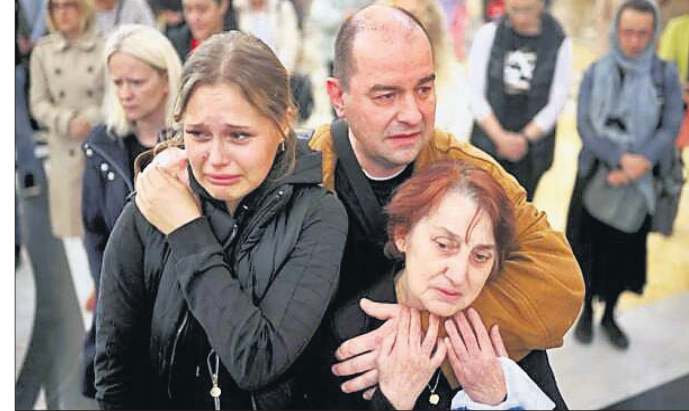
ସର୍ବିଆ ଗୁଳିକାଣ୍ଡରେ ଆତ୍ମୀୟସକଳକୁ ହରାଇ ଚାଲିଥିବା ଲୋକେ କାନ୍ଦୁଛନ୍ତି।

ସର୍ବିଆରେ ଦୁଇଦିନ ମଧ୍ୟରେ ଲଗାତର ଗୁଳିକାଣ୍ଡ ଦ୍ୱାରା ପୁଲିସ୍ ଦେଶବାସୀଙ୍କୁ ସ୍ତବ୍ଧ କରିଦେଇଛି। ପ୍ରଥମ ଆକ୍ରମଣରେ ୯ ଜଣଙ୍କ ପ୍ରାଣହାନି ଘଟିଥିବାବେଳେ ଦ୍ୱିତୀୟ ଗୁଳିକାଣ୍ଡରେ ଆଉ ୮ ଜଣ ନିହତ ହୋଇଛନ୍ତି। ରାଷ୍ଟ୍ରପତି ଆଲେକ୍ସାଣ୍ଡର ଭୁକ୍ସିଚ୍ ସର୍ବିଆ ଗୁଳିକାଣ୍ଡକୁ ନିନ୍ଦା କରିବା ସହ ଦେଶରେ ଖୁବ୍‌ଶୀଘ୍ର ନୂଆ ବନ୍ଧୁକ ନିୟନ୍ତ୍ରଣ ଆଇନ ଆଣିବାକୁ ପ୍ରତିଶ୍ରୁତି ଦେଇଛନ୍ତି। ସର୍ବିଆ ରାଜଧାନୀ ବେଲଗ୍ରାଡ୍‌ରେ ପ୍ରାୟ ୬୦ କି.ମି. ଦୂର ମାଡେନୋଭାକରେ ଗୁରୁତର ମଧ୍ୟରାଷ୍ଟ୍ରରେ ହୋଇଥିବାବେଳେ ଶବ୍ଦ ଶୁଣିବାକୁ ମିଳିଥିଲା। ଜଣେ ୨୧ ବର୍ଷୀୟ ବନ୍ଧୁକଧାରୀ ଏକ ଚଳନ୍ତା କାରକୁ ଆକ୍ରମଣ କରି ଚଳାଇଥିଲେ। ସେ ଏକ ଅଟୋମେଟିକ୍ ଅସ୍ତ୍ରରେ ଅତିବାହିତ ଭାବେ ଗୁଳି ଚଳାଇ