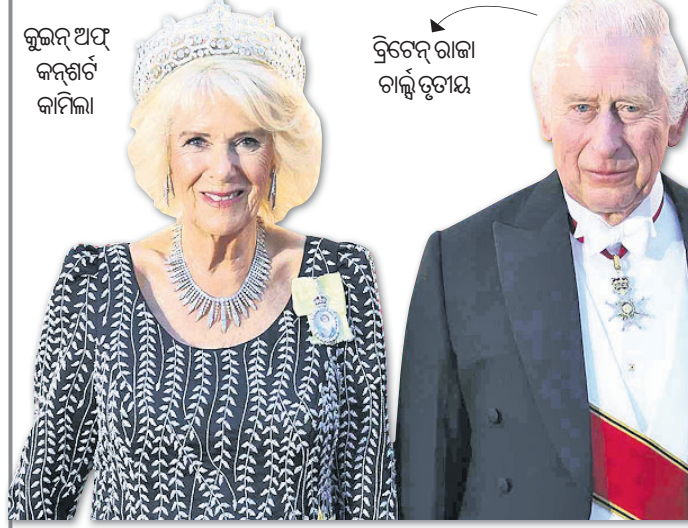
କୃତ୍ତିମ ଅର୍ପଣ କାମିଲା, ତ୍ରିଚେନ୍ଦ୍ର ରାଜା ଚାନ୍ଦ୍ରିତ୍ତାୟ

ଶାନ୍ତ କର୍ମଚର ଗସ୍ତ ବାଟିଲ କରି ମଣିପୁର ଛାତ୍ର ଉପରେ ନକର ରଖିଥିବା ଜଣାପଡ଼ିଛି। ଗୁରୁବାର ୯,୦୦୦ ଆଦିବାସୀଙ୍କୁ ପୁରୁଷିତ ସ୍ଥାନକୁ ସ୍ଥାନାନ୍ତର କରାଯାଇଥିବାବେଳେ ଶୁକ୍ରବାର ଭାରତୀୟ ବାୟୁସେନା ଆଇ ୫୦୦ ଲୋକଙ୍କୁ ଆସାମର କାଚର ଜିଲ୍ଲାକୁ ନେଇଛି। ମଣିପୁରର ସବୁ ଜିଲ୍ଲାରେ ହାଇ ଆଲର୍ଟ କାର୍ଯ୍ୟକାରୀ କରାଯାଇଛି।