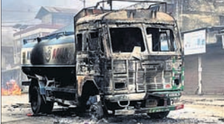
ରାଜ୍ୟବାସୀଙ୍କୁ ଶାନ୍ତି ବଜାୟ ରଖିବାକୁ ଅନୁରୋଧ କରିଛନ୍ତି। ସ୍ୱରାଷ୍ଟ୍ର ମନ୍ତ୍ରୀ ଅତି

ଗୋଷ୍ଠୀ ମଧ୍ୟରେ ସଂଘର୍ଷ ଯୋଗୁ ଛାତ୍ର ଅଣାୟତ ହୋଇଥିଲା। ପୋଲିସ୍ ଗୁଳିରେ ୬ ଜଣ ନିହତ ହେବା ପରେ ରାଜ୍ୟରେ ମୋବାଇଲ୍ ଜଣ୍ଡରନେଟକୁ ବନ୍ଦ କରାଯିବା ସହ ହିଂସା ପ୍ରଭାବିତ ଅଞ୍ଚଳରେ ୧୪୪ ଧାରା କାର୍ଯ୍ୟକାରୀ ହୋଇଥିଲା, ଯାହାକି ଶୁକ୍ରବାର ମଧ୍ୟ ବଳବତର ରହିଛି। ପୁଖ୍ୟମନ୍ତ୍ରୀ ଏନ୍.ବୀରେନ୍ ଦି