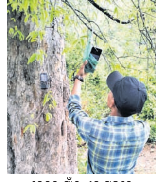
ବେତର ଗାଁର ଏକ ଗଛରେ ମୋବାଇଲ ଫୋନ୍ ଝୁଲାଇବାକୁ ଚେଷ୍ଟା କରାଯାଇଛି।

ଅନୁଗୋଳ / ତେଜାନାଳ ଅଞ୍ଚଳ / ଭୁବନେଶ୍ୱର (ବୁଧିଭୋଗ), ୫/୫ ବର୍ତ୍ତମାନ ସମୟରେ ମଣିଷ ଜୀବନର ଏକ ଗୁରୁତ୍ୱପୂର୍ଣ୍ଣ ଅଂଶ ପାଲଟିଛି ମୋବାଇଲ। ହେଲେ ଚିନ୍ତାର ବିଷୟ, ରାଜ୍ୟରେ ମୋବା ୫୧ ହଜାର ୧୭୬ ଗାଁ ମଧ୍ୟରୁ ୪ ହଜାର ୫୪୯ ଗ୍ରାମରେ ମୋବାଇଲ ନେଟୱାର୍କ ନାହିଁ। କେବଳ ଅନୁଗୋଳ ଓ ତେଜାନାଳ ଜିଲ୍ଲାକୁ ଦେଖିଲେ ଶତାଧିକ ଗ୍ରାମ ଏହି ତାଲିକାରେ ରହିଛି। ଅନୁଗୋଳର ୨୨୫ ପଞ୍ଚାୟତରେ ଥିବା ୧,୮୮୭ ଗାଁ ମଧ୍ୟରୁ ୯୫ ଗ୍ରାମରେ ଆୟୁର୍ବି ନେଟୱାର୍କ ଜିଲ୍ଲା ସଦର ମହକୁମାଠାରୁ ୪୦ କିଲୋମିଟର ଦୂର ସାତକୋଶିଆ ଫ୍ଲୁଷ୍ଟା-୪