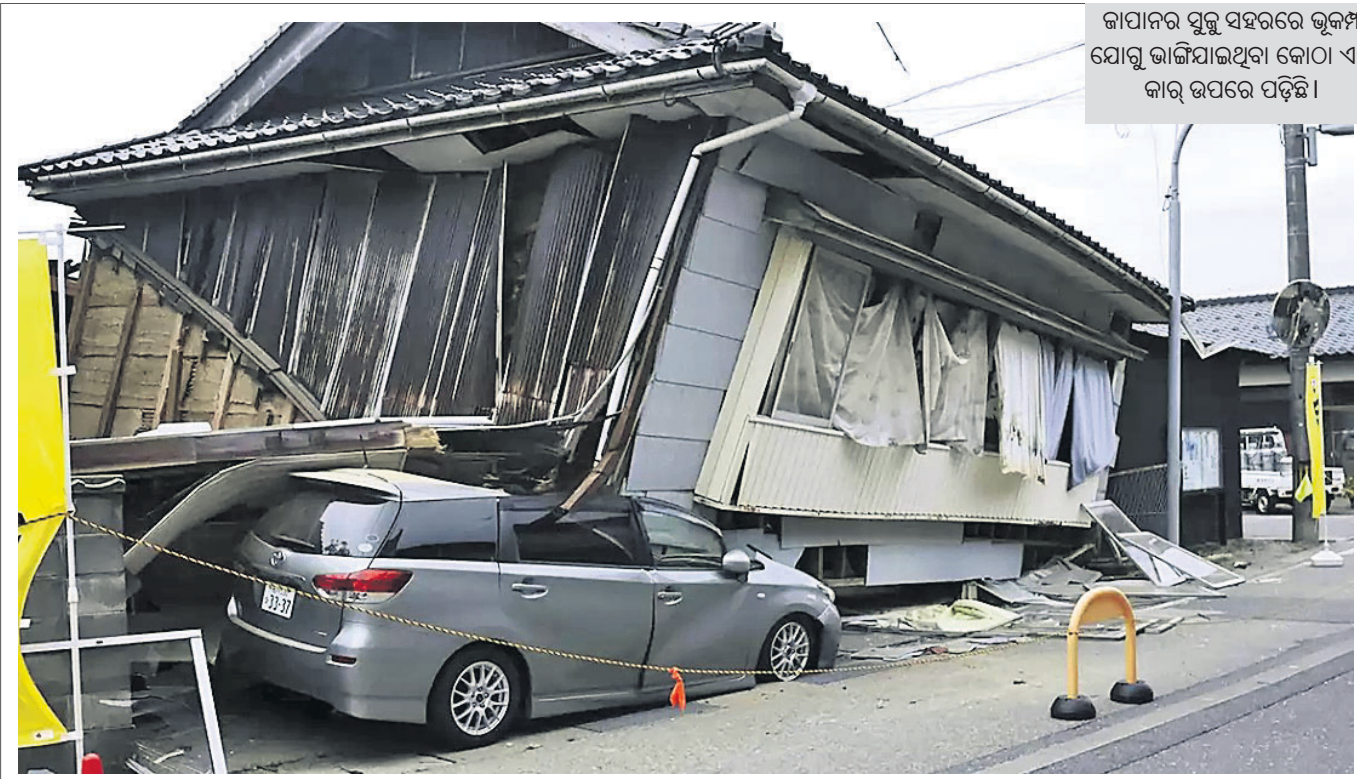
ଜାପାନର ସୁରୁ ସହରରେ ଭୂକମ୍ପ ଯୋଗୁ ଭାଙ୍ଗିଯାଇଥିବା କୋଠା ଏକ ବାର୍ ଉପରେ ପଡ଼ିଛି।

ଏପ୍ରିଲ ୩୦ରେ ପ୍ରସାରିତ ପ୍ରଧାନମନ୍ତ୍ରୀ ନରେନ୍ଦ୍ର ମୋଦିଙ୍କ ମାସିକ ରେଡିଓ କାର୍ଯ୍ୟକ୍ରମ 'ମନ୍ କା ବାଟ୍'ର ୧୦୦ତମ ଅଧ୍ୟାୟକୁ ଦେଶବିଦେଶରେ ଶୁଣାଯାଇଥିଲା। ଏଥିପାଇଁ ଭାରତୀୟ ଓ କେନ୍ଦ୍ର ସରକାରଙ୍କ ପକ୍ଷରୁ ବ୍ୟାପକ ଆୟୋଜନ କରାଯାଇଥିଲା। କିନ୍ତୁ ଉତ୍ତରାଖଣ୍ଡ ରାଜଧାନୀ ତେରାହୁନ୍ରେ ଥିବା ଏକ ସ୍କୁଲରେ ଏହାର ବ୍ୟତିକ୍ରମ ଦେଖାଯାଇଥିଲା। ଛାତ୍ରଛାତ୍ରୀମାନେ 'ମନ୍ କା ବାଟ୍' ଶୁଣିବା ପାଇଁ ସ୍କୁଲକୁ ଆସି ନ ଥିଲେ। ତେଣୁ ବିଦ୍ୟାଳୟ କର୍ତ୍ତୃପକ୍ଷ ଛାତ୍ରଛାତ୍ରୀମାନଙ୍କୁ ଜଣ ପିଛା ୧୦୦ ଟଙ୍କା ଲେଖାଏଁ ଜରିମାନା ଦେଇଛନ୍ତି। ବିଦ୍ୟାଳୟର ହାତୁଆପୁ ଗ୍ରୁପ୍ କ୍ରିଆରେ ପ୍ରତ୍ୟେକ ଛାତ୍ରଛାତ୍ରୀଙ୍କୁ ଜରିମାନା ଅର୍ପଣ କରିବା ଲାଗି ସ୍କୁଲ ମ୍ୟାନେଜମେଣ୍ଟ