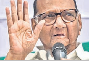
ଶୁକ୍ରବାର ଏକ ଖବରଦାତା ସମ୍ମିଳନୀରେ ପାଞ୍ଚର କହିଛନ୍ତି, ଏକାଧି ସହକର୍ମୀ ଓ କର୍ମୀମାନଙ୍କ ଭାବବେଗକୁ ସେ ଅସମ୍ଭାଳ କରିବାକୁ ଚାହୁଁନାହାନ୍ତି। ତାଙ୍କ ପ୍ରତି ବନ୍ଦୀ କର୍ମୀଙ୍କ ଭଲ ପାଇବା ଓ ଆତ୍ମୀୟ ଦେଖି ଯେ ଭାବବିହୀନ ହୋଇଯାଇଛନ୍ତି। ସେ ସମସ୍ତଙ୍କ ଅନୁରୋଧକୁ ରକ୍ଷାକରି ନିଷ୍ପତ୍ତିର ଏକ ବିଶେଷ ପ୍ରଦର୍ଶନ କରିଥିଲେ। ଘଟଣାରେ କେତେଜଣ ନେତା ମଧ୍ୟ ଦକର ପୁନର୍ବିଚାର କରିବାକୁ ପ୍ରସ୍ତୁତ ହୋଇଛନ୍ତି। ଦଳରେ ସାମ୍ବନ୍ଧିକ ପରିବର୍ତ୍ତନକୁ ସାମ୍ବନ୍ଧିକ ପଦକୁ ଲାଗୁ କରି ଦେଖି ଦେବେ ବୋଲି କହିଛନ୍ତି।

ଜାତୀୟତାବାଦୀ କଂଗ୍ରେସ ପାର୍ଟି (ଏନ୍‌ସିପି) ଅଧକ୍ଷ ଶରଦ୍ ପାଞ୍ଚର ୩ ଦିନ ପୂର୍ବେ ଦେଇଥିବା ଉପସଭାକୁ ଶୁକ୍ରବାର ପ୍ରତ୍ୟାହାର କରିଦେଇଛନ୍ତି। ପୁସାକରେ ମଙ୍ଗଳବାର ନିଜ ଆତ୍ମଜୀବନୀ 'ଲୋକ୍ ମାଝେ' ସମ୍ବନ୍ଧରେ ନୂଆ ସଂସ୍କରଣ ଉନ୍ମୋଚନ ଅବସରରେ ପାଞ୍ଚର ଏନ୍‌ସିପି ଅଧକ୍ଷ ପଦ ଛାଡ଼ିବା କେ.କେ.କୁ ସ୍କୁଲ ପରିସରରେ ପୋଲିସ୍ ଗିରଫ କରିଥିଲା। ସର୍ବିଆରେ ବନ୍ଧୁକ ବ୍ୟବହାରକୁ ନେଇ କଠୋର ଆଇନ ପ୍ରଦାନ ଏକ ଗୁଳିକାଣ୍ଡ ବିରୁଦ୍ଧ ୨୦୧୩ରେ କେନ୍ଦ୍ରୀୟ ସର୍ବିଆର ଏକ ଗାଁରେ ଜଣେ ବାଲକଙ୍କ ମୃତ୍ୟୁ ଘଟଣାରେ ଆଖିବୁଜା ଗୁଳି ଚଳାଇବାକୁ ୧୩ ଜଣ ନିହତ ହୋଇଥିଲେ। ଦୁଇଟି ଗୁଳିକାଣ୍ଡ ପରେ ସରକାର ବନ୍ଧୁକ ଆଇନକୁ ଆହୁରି ମଜବୁତ କରିବା ପାଇଁ ଉଦ୍ୟମ ଆରମ୍ଭ କରିଛନ୍ତି। ସ୍କୁଲଗୁଡ଼ିକରେ ପୁରୁଷା କର୍ମୀଙ୍କୁ ଗୁଳିକାଣ୍ଡ ବିରୁଦ୍ଧ ୧,୨୦୦ ନୂଆ ପୋଲିସ୍ ଅଧିକାରୀଙ୍କୁ ନିଯୁକ୍ତି ଦିଆଯିବ।