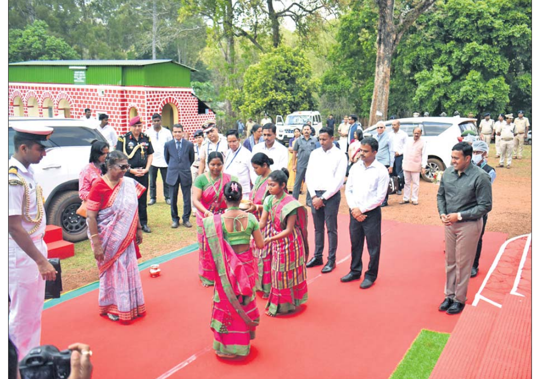
ଶିମିଳିପାଳ ଅଭୟାରଣ୍ୟ ମଧ୍ୟରେ ରାଷ୍ଟ୍ରପତି ଦ୍ରୌପଦୀ ମୁର୍ମୁଙ୍କୁ ସ୍ୱାଗତ କରାଯାଇଛି।