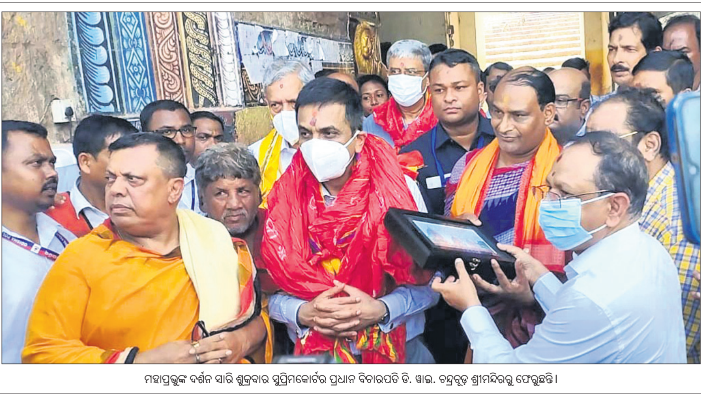
ମହାପ୍ରଭୁଙ୍କୁ ଦର୍ଶନ ସାରି ଶୁକ୍ରବାର ସୁପ୍ରିମକୋର୍ଟର ପ୍ରଧାନ ବିଚାରପତି ଡି. ଖାଲ. ଚନ୍ଦ୍ରଚୂଡ଼ ଶ୍ରୀମନ୍ଦିରକୁ ଫେରୁଛନ୍ତି।