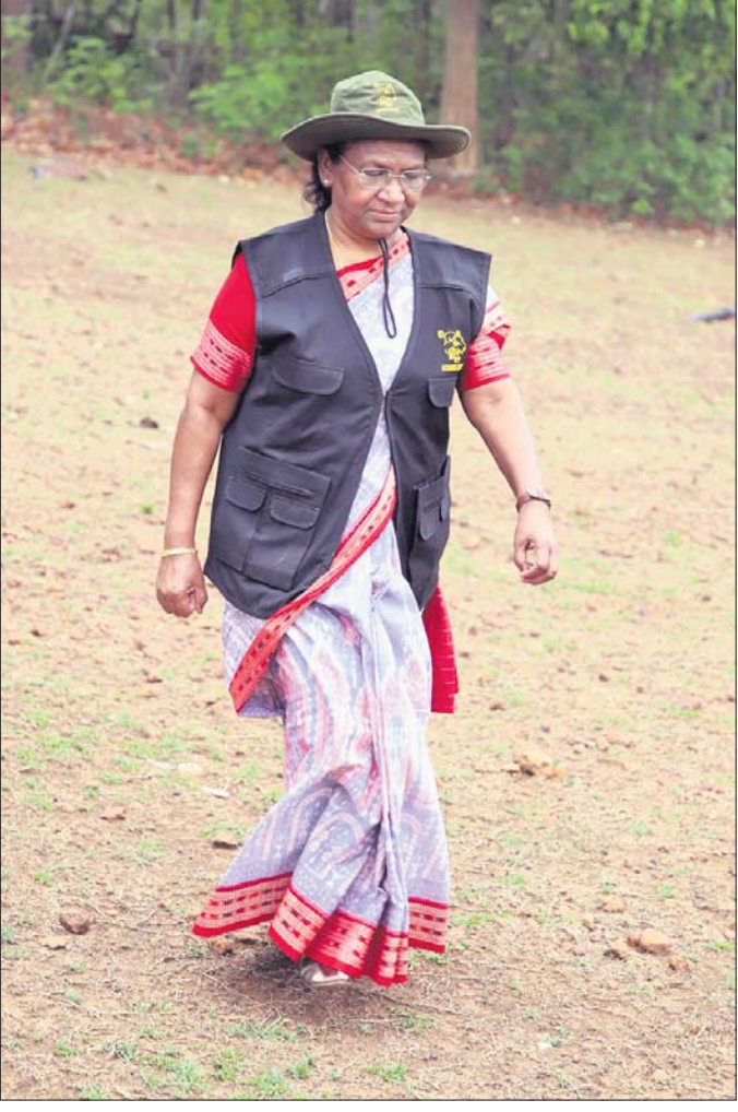
ରାଷ୍ଟ୍ରପତି ଶ୍ରୀମତୀ ସାରା କରାଯାଇଛି।