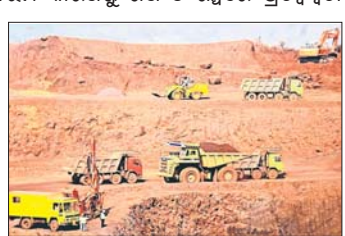
ଖଣି ବିଭାଗ ସୂଚନା ଅନୁଯାୟୀ, ବିଭିନ୍ନ ବୈଧାନିକ କାରଣ ଯଥା ଫରେଷ୍ଟ କଞ୍ଚାଉତ୍ତରଣ ଆଇ, ଏନଭାରମେଣ୍ଟ ଲିମିଟେଡ୍, ଆଇଏମ୍ଡି (ଇଣ୍ଡିଆନ୍ ମିନିଷ୍ଟର ଅଫ୍ ମାଇନିଂ) ଦ୍ୱାରା ପ୍ରଦତ୍ତ ଅନୁମତି ନାହିଁ ବୋଲି କେନ୍ଦ୍ର ଓ ରାଜ୍ୟ ସରକାରଙ୍କ ପ୍ରସ୍ତାବ କ୍ରମେ କେନ୍ଦ୍ର ସରକାରଙ୍କ ମନୁଆଲ୍‌ରୁ ଏହି ସବୁ ଅନୁମତି ନାହିଁ।