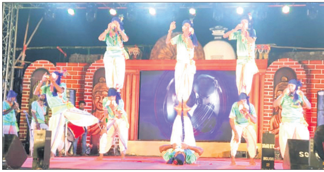
କଳାକାରମାନେ ଯୋଡ଼ିଶାଳ ନୃତ୍ୟ ପ୍ରଦର୍ଶନ କରୁଛନ୍ତି।