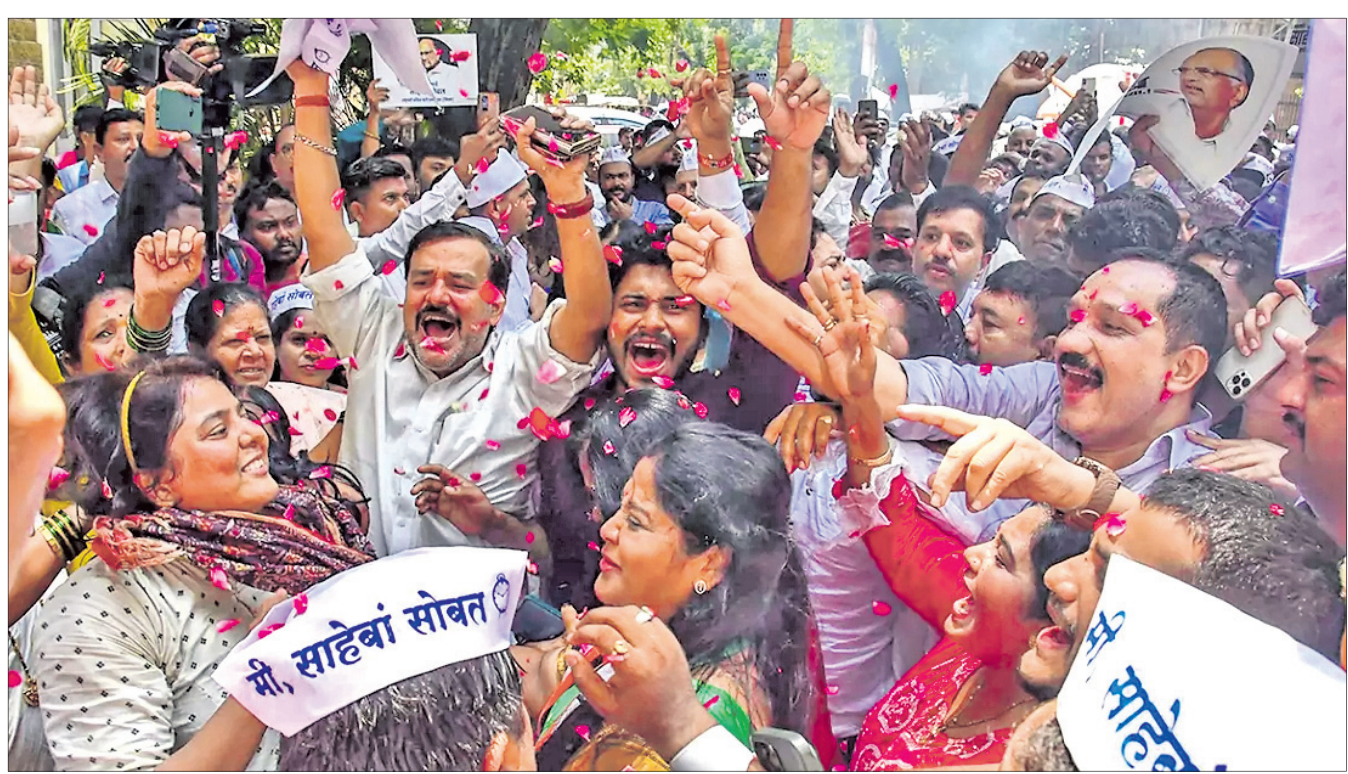
ଏକସିପି ପ୍ରସିମୋ ଶରଦ ପାଠ୍ୟ ଲକ୍ଷ୍ମୀ ନିଷ୍ପତ୍ତି ବଦଳାଇବା ପରେ ପୁଣ୍ୟଲକ୍ଷ୍ମି ବନ୍ଦୀୟ କାର୍ଯ୍ୟକ୍ରମ ବାହାରେ ସମର୍ଥକମାନେ ଖୁସି ମନାଉଛନ୍ତି ।