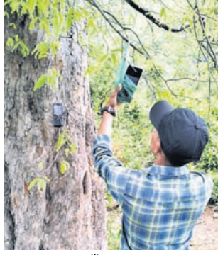
ବେତର ଗାଁର ଏକ ଗଛରେ ମୋବାଇଲ ଫୋନ୍ ଝୁଲାଇବାକୁ।

ଅନୁଗୋଳ / ତେଜାନାଳ ଅଞ୍ଚଳ / ଭୁବନେଶ୍ୱର (ବୁଧିଭୋ), ୫/୫ ବର୍ତ୍ତମାନ ସମୟରେ ମଣିଷ ଜୀବନର ଏକ ଗୁରୁତ୍ୱପୂର୍ଣ୍ଣ ଅଂଶ ପାଲଟିଛି ମୋବାଇଲ। ହେଲେ ଚିନ୍ତାର ବିଷୟ, ରାଜ୍ୟରେ ମୋବା ୫୧ ହଜାର ୧୭୬ ଗାଁ ମଧ୍ୟରୁ ୪ ହଜାର ୫୪୯ ଗ୍ରାମରେ ମୋବାଇଲ ନେଟୱାର୍କ ନାହିଁ। କେବଳ ଅନୁଗୋଳ ଓ ତେଜାନାଳ ଜିଲ୍ଲାକୁ ଦେଖିଲେ ଶତାଧିକ ଗ୍ରାମ ଏହି ତାଲିକାରେ ରହିଛି। ଅନୁଗୋଳର ୨୨୫ ପଞ୍ଚାୟତରେ ଥିବା ୧,୮୮୭ ଗାଁ ମଧ୍ୟରୁ ୯୫ ଗ୍ରାମରେ ଆୟୁରି ନେଟୱାର୍କ ଜିଲ୍ଲା ସଦର ମହକୁମାଠାରୁ ୪୦ କିଲୋମିଟର ଦୂର ସାତକୋଶିଆ ଫୁଷ୍ଟା-୪