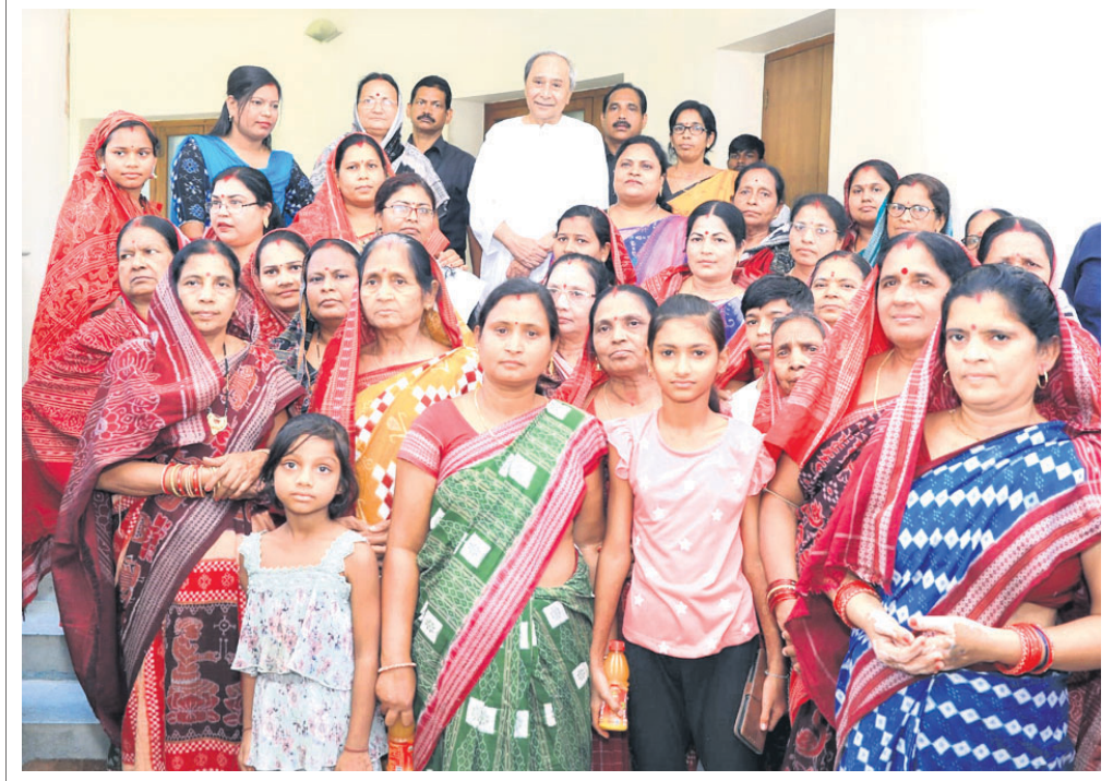
ଅଘରଥା ସମାଜ ଭବନ ନିର୍ମାଣ ପାଇଁ ରାଜ୍ୟ ସରକାର ଜମି ପ୍ରଦାନ କରିଥିବାରୁ ଶ୍ରଦ୍ଧାଂଜ୍ଞା ଓଡ଼ିଶାର ଅଘରଥା ସମ୍ପ୍ରଦାୟର ମହିଳାମାନେ ଶୁକ୍ରବାର ନବୀନ ନିବାସଠାରେ ମୁଖ୍ୟମନ୍ତ୍ରୀ ନବୀନ ପଟ୍ଟନାୟକଙ୍କୁ ଭେଟି କୃତଜ୍ଞତା ଜଣାଇଛନ୍ତି।

ବୟନିକା ୨୦୨୨-୨୩ ବର୍ଷରେ ନିଜର ପ୍ରତିଷ୍ଠିତ ବିକ୍ରୟ ଶାଖା ଏବଂ ରାଜ୍ୟ ତଥା ରାଜ୍ୟ ବାହାରେ ବିଭିନ୍ନ ପ୍ରଦର୍ଶନୀରେ ଭାଗନେଇ ଓ ଆୟୋଜନ କରି ୧୬୨ କୋଟିର ବ୍ୟବସାୟ ହାସଲ କରିଛି। ବର୍ତ୍ତମାନ ୨୦୨୩-୨୪ ବର୍ଷରେ ୨୦୦ କୋଟିର ବ୍ୟବସାୟ ଲକ୍ଷ୍ୟ ରଖାଯାଇଛି। ଆଗାମୀ ଦିନରେ ବୟନିକା ଏହାର ବ୍ୟବସାୟିକ ଅଭିବୃଦ୍ଧି ଘଟାଇବା ପାଇଁ ବଜପତିକର। ଏଥିସହ ଏହି ସମ୍ପନ୍ନ ଅଗଣିତ ବୁଣାକାରଙ୍କ ସାମାଜିକ ଓ ଅର୍ଥନୈତିକ ବିକାଶକୁ ପରିବର୍ଦ୍ଧିତ କରିବା ପାଇଁ ଚେଷ୍ଟା ଜାରି ରଖି ବୋଲି ସେମାନେ କହିଛନ୍ତି।