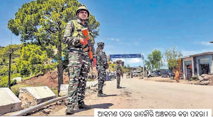
ଆକ୍ରମଣ ପରେ ରାକୌରି ଅଞ୍ଚଳରେ କଡ଼ା ପହରା।

ଦେଶ ତିନିଟାଳ ହେଉଛି। ବିକଶିତ ଭାରତର ସ୍ୱପ୍ନ ବୁଣା ରାଲିଛି। ହେଲେ ସେହି ସ୍ୱପ୍ନରେ ସାମିଲ ହୋଇପାରିନି ରାଜ୍ୟର ୪୫୪୯ ଗାଁ। କାରଣ ଦୂର ସଞ୍ଚାର ଠାରୁ ଦୂରରେ ରହିଛନ୍ତି ଏସବୁ ଗ୍ରାମବାସୀ। ମୋବାଇଲ ନେଟୱାର୍କ କି ଇଣ୍ଟରନେଟ ସେବା ଉପଲବ୍ଧ ନ ଥିବାରୁ ଏଠାରେ ହୋଇପାରୁନି କ୍ୟାଶଲେସ କାରବାର। ଘରେ ବସି ମାତ୍ର କେଇ ସେକେଣ୍ଡରେ ନିଜ ଅପ୍ଟିକା ଦୂର କରିପାରୁନାହାନ୍ତି ଗ୍ରାମବାସୀ। ଇଣ୍ଟରନେଟ କରିଥାରେ ରୋଜଗାର ତ ଦୂରର କଥା କାଗଜ ଓ ସମୟ ମଧ୍ୟ ସଞ୍ଚୟ ହୋଇପାରୁନି ଏମାନଙ୍କ ଦ୍ୱାରା। ବର୍ଷ ପରେ ବର୍ଷ ବିହୁଥିଲେ ମଧ୍ୟ ନା ଏମାନଙ୍କୁ ମିଳୁଛି କେନ୍ଦ୍ର ସରକାରଙ୍କ ସହଯୋଗ ନା ବିକାଶ ବିଗରେ କରାଯାଉଛି ଆବଶ୍ୟକ ପ୍ରୟାସ। ସେଇଥିପାଇଁ ସାରା ଜଗତ ସହ ଏଯାବ ଯୋଡ଼ି ହୋଇପାରିନାହାନ୍ତି ଏମାନେ।