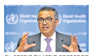
ଡା. ଟେଡ୍ରୋସ୍ ଆଧାନୋମ ଘୋଷଣା କରିଥିଲେ କୋଭିଡ୍-୧୯କୁ ବିଶ୍ୱିକ ମହାମାରୀ ତାଲିକାରୁ ହଟାଇ ଦିଆଯାଇଛି।

ସଂକ୍ରମିତ ହେବାର ଡର ରହିଛି। ଏହାଛଡା ଭଲ କୋଭିଡ୍ ମଧ୍ୟ ଏକ ମହାମାରୀ ଭାବେ ରହିବ। ବହୁ ଆଶାରେ କୋଭିଡ୍-୧୯କୁ ବିଶ୍ୱିକ ମହାମାରୀ ତାଲିକାରୁ ହଟାଇ ଦିଆଯାଏ। ଡବ୍ଲ୍ୟୁଏଚ୍ଡର ସୂଚନା ଦେଖିବା ପରେ ବିଶ୍ୱ ସ୍ୱାସ୍ଥ୍ୟ ସଙ୍ଗଠନର ସଭାପତି ଡା. ଟେଡ୍ରୋସ୍ ଆଧାନୋମ ଘୋଷଣା କରିଥିଲେ। କରୋନା ମୂଳକିଲା ପାଇଁ ତିନି ବର୍ଷ ଡବ୍ଲ୍ୟୁଏଚ୍ଡର ତାଲିକାରୁ ହଟାଇ ଦିଆଯାଇଛି। କରୋନା ମୂଳକିଲା ପାଇଁ ତିନି ବର୍ଷ ଡବ୍ଲ୍ୟୁଏଚ୍ଡର ତାଲିକାରୁ ହଟାଇ ଦିଆଯାଇଛି। କରୋନା ମୂଳକିଲା ପାଇଁ ତିନି ବର୍ଷ ଡବ୍ଲ୍ୟୁଏଚ୍ଡର ତାଲିକାରୁ ହଟାଇ ଦିଆଯାଇଛି।