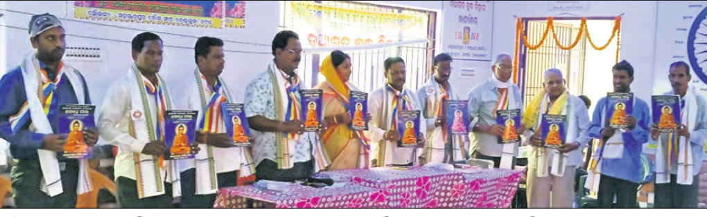
ବୌଦ୍ଧ ସଂଘ ତରଫରୁ ସ୍ମରଣିକା ବୋଧୁ ସଭ୍ ଏକ ତେତନାର ଜାଗରଣକୁ ଅତିଥିମାନେ ଉନ୍ମୋଚନ କରୁଛନ୍ତି।