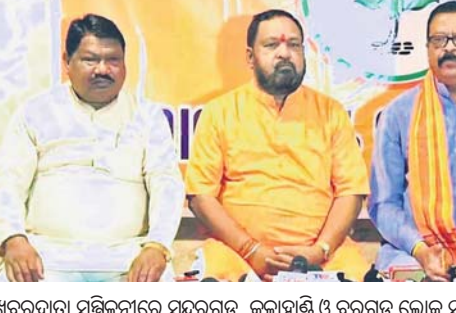
ଖବରଦାତା ସମ୍ମିଳନୀରେ ସୁନ୍ଦରଗଡ଼, କଳାହାଣ୍ଡି ଓ ବରଗଡ଼ ଲୋକ ସଭା ଏମ୍ପି।

ସମ୍ବଲପୁରରେ ହନୁମାନ ଜନ୍ମଷ୍ଟୀ ଶୋଭାଯାତ୍ରାବେଳେ ହିଂସା ଘଟିଥିଲା। ଆହତ ଓ ମୃତକଙ୍କ ପରିବାରକୁ ଭେଟିବାକୁ ଆସୁଥିବା ସମୟରେ ଭାଙ୍ଗିବା ସଂସଦୀୟ ଚିମ୍ବୁ ସମ୍ବଲପୁର ସାମାଜିକ ପୁରାଇ ଦିଆ ଯାଇ ନ ଥିଲା। ଏହାକୁ ନେଇ ବରଗଡ଼ ଏମ୍ପି ସୁରେଶ ପୂଜାରୀ, କଳାହାଣ୍ଡି ଏମ୍ପି ବସନ୍ତ ପଣ୍ଡା ଓ ସୁନ୍ଦରଗଡ଼ ଏମ୍ପି କୁଏଲ୍ ଓରାମ ଏମ୍ପି ୨୫ରେ ସ୍ୱାଧିକାର ଭଙ୍ଗ ପ୍ରସ୍ତାବ ଆଣିଥିଲେ। ଲୋକ ସଭା ଏହି ପ୍ରସ୍ତାବକୁ ଗ୍ରହଣ କରିଛି। ସଚିବାଳୟ ତରଫରୁ ଏହାର ସତ୍ୟାସତ୍ୟ (ପ୍ରତିଲେଖ ଓ ଏମ୍‌ସ୍) କମିଟି କେନ୍ଦ୍ର ସରକାରଙ୍କ କାର୍ଯ୍ୟ, ପେନସନ୍ ଏବଂ ଜନ ଅଭିଯୋଗ ମନ୍ତ୍ରାଳୟ (ଡିଓପିଟି)ର ମନ୍ତ୍ରୀ ଓ ସଚିବଙ୍କୁ ଚିଠି ଦେଇଛନ୍ତି। ଭାଙ୍ଗିବା ଏମ୍ପିଙ୍କ ଗତିରୋଧ କରିବା ଏବଂ ସଂସଦୀୟ କାର୍ଯ୍ୟ କରିବାରେ ବିରୋଧୀ କାରଣ ସମ୍ପର୍କିତ ପୂର୍ଣ୍ଣା ଚିପୋର୍ଟ ଆସନ୍ତା ୧୫ ଦିନ ଭିତରେ ରାଜ୍ୟ ସରକାରଙ୍କଠାରୁ ସମ୍ପୂର୍ଣ୍ଣ କରି ଡିଓପିଟି ମନ୍ତ୍ରାଳୟ ସଂସଦୀୟ ସଚିବାଳୟକୁ ପ୍ରଦାନ କରିବେ। ଏହାପରେ ସଂସଦୀୟ ସଚିବାଳୟ ଉକ୍ତ ଚିପୋର୍ଟ ସହ ଅଭିଯୋଗକୁ ସଂକଳିତ କରି ବାରହଟିକୁ ପ୍ରଦାନ କରିବେ ବୋଲି ଏମ୍ପି ସୁରେଶ ପୂଜାରୀ କହିଛନ୍ତି। ଝାରସୁଗୁଡ଼ାଠାରେ ଶୁକ୍ରବାର ଏକ ଖବରଦାତା ସମ୍ମିଳନୀରେ ଏମ୍ପି ଅନୁମତିକୁ ହଠାତ୍ ବାଟିଲ କରିଦିଆଯାଇଥିଲା। ବିନା