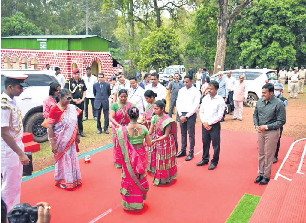
ଶିମିଳିପାଳ ଅଭୟାରଣ୍ୟ ମଧ୍ୟରେ ରାଷ୍ଟ୍ରପତି ଶ୍ରୀମତୀ ସାରା କରାଯାଇଛି।