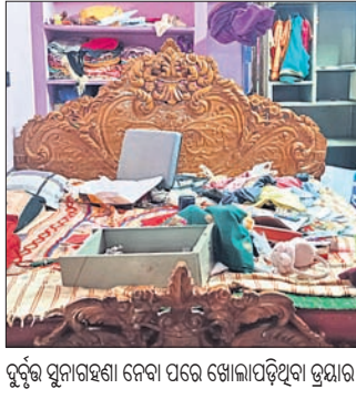
ଦୁର୍ଭୃତ ସୁନାଚଉକି ନେବା ପରେ ଖୋଲାପଡ଼ିଥିବା ଗୁମାସତୀ

ରାୟଗଡ଼ା(ସ.ପ୍ର.)/ରାୟଗଡ଼ା ଅଫିସ୍,୫୫: ରାୟଗଡ଼ା ଲୁକ କୋଡାପେଟା ପଞ୍ଚାୟତ ଅନ୍ତର୍ଗତ ସାରପ୍ରିୟା ୧୧ ନମ୍ବର ଗଳିରେ ରହୁଥିବା ଜଣେ ଅତିରିକ୍ତ ଥାନାଧିକାରୀଙ୍କ ଘରୁ ଗୁରୁବାର ରାତିରେ ଚୋରି ହୋଇଛି।