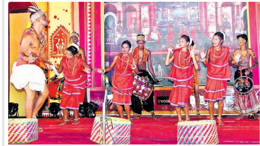
ପରିଚୟ ପାଇଖେନ ପକ୍ଷରୁ କଟକ ବାଲିଯାତ୍ରା ଉପର ପଡ଼ିଆରେ ଚାଲିଥିବା କାଗାୟ ଆଦିବାସୀ ମେଳାର ଶୁକ୍ରବାର ୮ମ ଦିନରେ କଳାକାରଙ୍କ ଦ୍ୱାରା ପରିବେଷିତ ଆଦିବାସୀ ନୃତ୍ୟ।