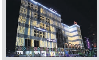
ଭୁବନେଶ୍ୱର, ୫୫୫ (ବୁଧରୋ)

■ ମାର୍କେଟ ବିଲଡିଂରେ ବୟନିକାର ଆଉଏକ ବିକ୍ରୟ କେନ୍ଦ୍ର ଖୋଲିଲା