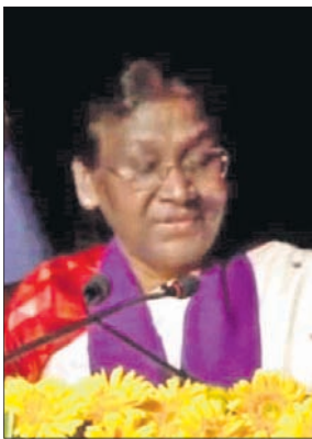
ଏମ୍ଏସ୍‌ସି ଅତିଗୋରିୟମ ହଲ୍‌ରେ ରାଷ୍ଟ୍ରପତି ଦ୍ରୌପଦୀ ମୁର୍ମୁ

୩ ଦିନିଆ ମୟୂରଭଞ୍ଜ ଗସ୍ତରେ ଥିବା ରାଷ୍ଟ୍ରପତି ଦ୍ରୌପଦୀ ମୁର୍ମୁଙ୍କ ଶନିବାର ଶ୍ରୀରାମଚନ୍ଦ୍ର ଭଞ୍ଜଦେଓ ବିଶ୍ୱବିଦ୍ୟାଳୟର ସମାବର୍ତ୍ତନ ଉତ୍ସବର ସାକ୍ଷାତ ଅଭିଭାଷଣ ସମୟରେ ଦେଖାଦେଇଛି ଗୁରୁତର ଛୁଟି । ରାଷ୍ଟ୍ରପତି ଅଭିଭାଷଣ ଆରମ୍ଭ କରିବା ମାତ୍ରେ ଅତିଗୋରିୟମରୁ ଆସୁଥିବା ଚାଲିଗଲା । କେନ୍ଦ୍ରରେ ଚଳିତ ମଧ୍ୟ ଠିକ୍ରେ ଚାଲିଲା । ରାଷ୍ଟ୍ରପତି ଅନ୍ଧାରରେ ୯ ମିନିଟ୍ ପର୍ଯ୍ୟନ୍ତ ନିଜର ଅଭିଭାଷଣ ଦେବା ପରେ କରେଖ ଆସିଥିଲା । ଦେଶର ପ୍ରଥମ ନାଗରିକଙ୍କ କାର୍ଯ୍ୟକ୍ରମରେ ଏଭଳି ସାଂପ୍ରତିକ ଛୁଟିକୁ ସବୁ ମହଲରୁ ନିନ୍ଦା କରାଯାଇଛି । ବିଶ୍ୱବିଦ୍ୟାଳୟ କର୍ତ୍ତୃପକ୍ଷ ଏଭଳି ଛୁଟି ନେତକତା ଦୃଷ୍ଟିରୁ ନିଜକୁ ଦାୟୀ କରିଥିବାବେଳେ ବିଦ୍ୟୁତ୍ ଯୋଗାଣକାରୀ ସଂସ୍ଥା ଏହାକୁ ବିଶ୍ୱବିଦ୍ୟାଳୟର ଇଣ୍ଟରନାଲ ଫଲ୍ଡ ବୋଲି କହି ନିଜ ଉପରୁ ଦୋଷ ଛଡ଼ାଇ ଦେଇଛି । ତେବେ ଏଭଳି ଘଟଣା