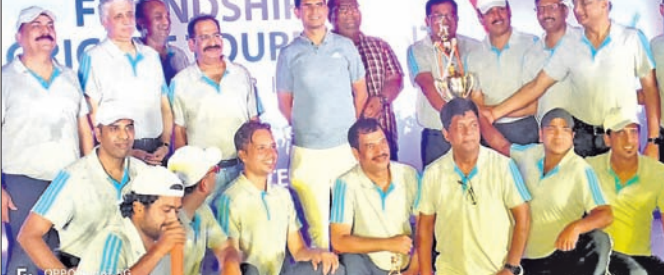
ତ୍ରୁପି ସହ ରତର୍ଣ୍ଣ ଅପ୍ ବଳ।