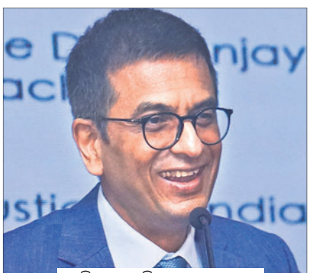
ସିଜେଆଇ ଡି. ଖାଇ. ଚନ୍ଦ୍ରଚୂଡ଼

କଟକ ଅର୍ପିସ, ୨୫ ଆଧୁନିକ ସୂଚନା ଓ ପ୍ରଯୁକ୍ତିବିଦ୍ୟା ବ୍ୟବହାର ଲୋକଙ୍କୁ ଦ୍ୱିତୀୟ ନ୍ୟାୟ ଯୋଗାଇ ପାରିଛି । ଏଥିସହ ସହାୟତା ନ୍ୟାୟିକ ପ୍ରକ୍ରିୟା ଅଧିକ ସରଳ, ସରଳ, ସ୍ୱଳ୍ପ ଓ ପାରଦର୍ଶୀ ହୋଇପାରିଛି ବୋଲି ସୁପ୍ରିମକୋର୍ଟ ପ୍ରଧାନ ବିଚାରପତି ଡି. ଖାଇ. ଚନ୍ଦ୍ରଚୂଡ଼ କହିଛନ୍ତି । କଟକ ଜୁଡିସିଆଲ ଏକାଡେମୀରେ ଆୟୋଜିତ ଉଚ୍ଚବିଦିଆ କାର୍ତ୍ତାୟ କର୍ମଶାଳାକୁ ଶନିବାର ପ୍ରଧାନ ବିଚାରପତି ଆନୁଷ୍ଠାନିକ ଭାବେ ଉଦ୍ଘାଟନ କରିବା ସହ ଆଧୁନିକ ସୂଚନା ଓ ପ୍ରଯୁକ୍ତିବିଦ୍ୟା କିଛି ଦୂରଦୂରାନ୍ତରେ ଥିବା ସାଧାରଣ ଲୋକଙ୍କୁ ନ୍ୟାୟପ୍ରାପନ କରିବାରେ ସହାୟକ ହୋଇପାରିଛି ସେ ସମ୍ପର୍କରେ ବିସ୍ତୃତ ସୂଚନା ଦେଇଥିଲେ । 'ଡିଜିଟାଲିଜେସନ, ପେପରଲେସ୍ କୋର୍ଟ୍ ଏବଂ ଇ-ଇନିସିଏଟିଭ୍' ଶୀର୍ଷକ ପ୍ରସଙ୍ଗରେ ପ୍ରଧାନ ବିଚାରପତି ଚନ୍ଦ୍ରଚୂଡ଼ କହିଛନ୍ତି, ଆଜିକାଲିରେ ଭାର୍ଟୁଆଲ ୨୦ଟି ଜିଲ୍ଲାକୁ ହାଇକୋର୍ଟ ସହ ଭାର୍ଟୁଆଲ ମାଧ୍ୟମରେ ଆମେ ସମଗ୍ର ଚାଲିବେଳେ ନ୍ୟାୟ