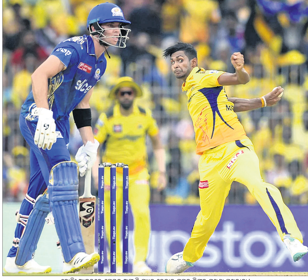
ବୋଲି ଆକ୍ରମଣରେ ଯେଉଁର ଅଧିକାଂଶ ଚେନାଇ ପୁଅର କିଙ୍କର ମଧୁଶା ପଥୁରାଣା ।