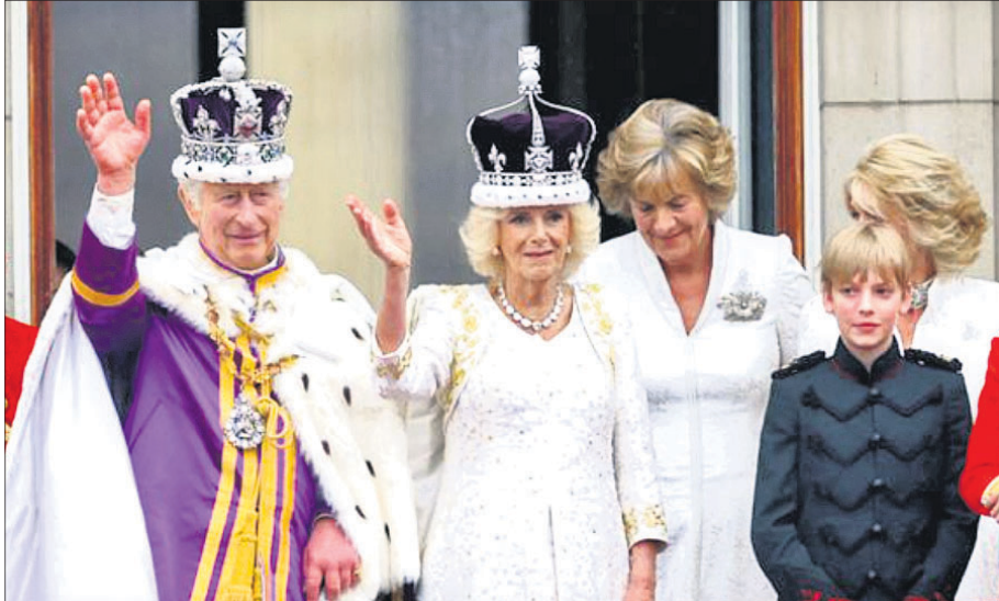
ଲଣ୍ଡନର ଷ୍ଟେସିନରେ ଆବେରେ ଶନିବାର ରାଜ୍ୟାଭିଷେକ ପରେ ସେଣ୍ଟ ଏଡ୍ୱାର୍ଡଙ୍କ ଗ୍ରାଉନ୍ଡ୍ ପରିସ୍ଥିତିରେ ଟ୍ରିଚେନ୍ଦ୍ର କିଙ୍ଗ୍ ଚାଲି ଓ କୁଇନ୍ କାମିଲା ଏବଂ ରାଜପରିବାର ସଦସ୍ୟମାନେ ।

ଟ୍ରିଚେନ୍ଦ୍ର ମିଲିଲା ନୂଆ ରାଜା । ଶନିବାର ବିଧିବଦ୍ଧ ଭାବେ କିଙ୍ଗ୍ ଚାଲି ଟ୍ରିଚେନ୍ଦ୍ର ରାଜା ରୂପେ ଦାୟିତ୍ୱ ଗ୍ରହଣ କରିଛନ୍ତି । ଲଣ୍ଡନ ଷ୍ଟେସିନରେ ଶ୍ରୀରାମଚନ୍ଦ୍ର ଆବେ ଚଳିତ କିଙ୍ଗ୍ ଚାଲି ଓ କୁଇନ୍ କାମିଲାଙ୍କ ରାଜ୍ୟାଭିଷେକ କରାଯାଇଛି । ରାଜପରିବାର ସମେତ ଦେଶ ବିଦେଶରୁ ଆସିଥିବା ବହୁ ଭିଆଇପି ଅତିଥି ଏହି ବିଶାଳ ସମାରୋହରେ ସାମିଲ ହୋଇଛନ୍ତି । ଚାଲିଙ୍କ ପ୍ରଶୋଧନ ଦେଖିବା ପାଇଁ ଅନେକ ସଂଖ୍ୟାରେ ଲୋକ ରାସ୍ତାକଡ଼ରେ ଉଲ୍ଲ୍ଲାସ ସହ ଅପେକ୍ଷା କରିଥିବାର ଦେଖାଯାଇଥିଲା ।