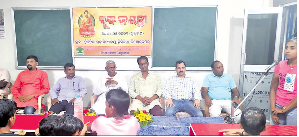
କାର୍ଯ୍ୟକ୍ରମରେ ମଞ୍ଚାସନ ଅତିଥିମାନେ।