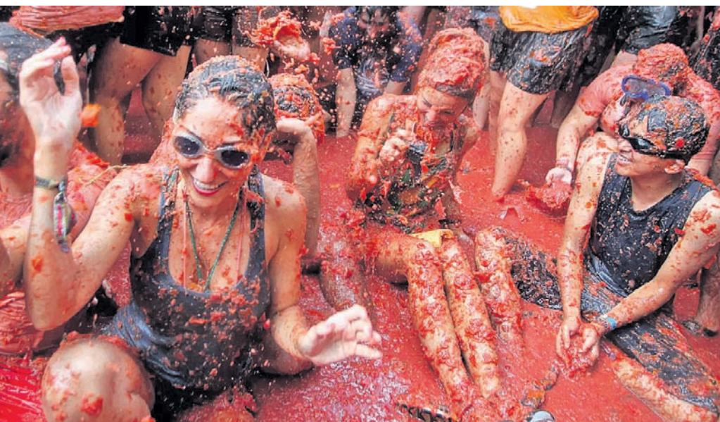
ଝୁରୋପର ଅଜବ ପ୍ରଥା

ଗୋଟିଏ ପର୍ବରେ ସମସ୍ତେ ମିଳିମିଶି ଖୁସି ମନାଇବା ବଦଳରେ ମହିଳାଙ୍କୁ ମାଡ଼ କାହିଁକି ହୁଏ, ଏକଥା ଆଶ୍ଚର୍ଯ୍ୟ ଲାଗୁଥିବ ନିଶ୍ଚୟ। ହେଲେ ଝୁରୋପର ଜେଟ୍ ରିପବ୍ଲିକ୍‌ରେ ରହିଛି ଏଭଳି ଏକ ଅଜବ ପରମ୍ପରା। ଇଣ୍ଡର ପାଳନ ଅବସରରେ ସେଠାକାର ପୁରୁଷମାନେ ମହିଳାମାନଙ୍କୁ ଦେଖିବା ମାତ୍ରେ ଗଛର ଡାଳରେ ମାଡ଼ ମାରିଥା'ନ୍ତି। ଏହାଦ୍ୱାରା ମହିଳାଙ୍କ ପ୍ରଜନନ କ୍ଷମତା ବୃଦ୍ଧି ହେବା ସହ ପରିବାରକୁ ପୁଣ୍ୟ ସମୃଦ୍ଧି ଆସିଥାଏ ବୋଲି ସେଠାକାର ଲୋକେ ବିଶ୍ୱାସ ରଖନ୍ତି। ତେବେ ଏହି ମାଡ଼ ବଦଳରେ ମହିଳାମାନେ ଯୁକ୍ତକାଳୀନ ରୁଜିନ ଅଣ୍ଡା ଦେଉଥିବା ବେଳେ ମଧ୍ୟବିୟତମାନଙ୍କୁ ମାଦ ଉପହାର