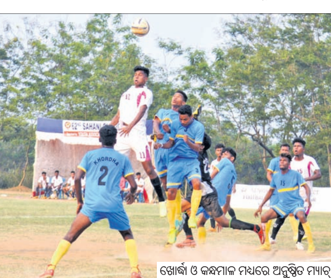
ଖୋର୍ଦ୍ଧା ଓ କନ୍ୟାମାଳ ମଧ୍ୟରେ ଅନୁଷ୍ଠିତ ମ୍ୟାଚ୍

ଭୁବନେଶ୍ୱର, ୬।୫ (ସ୍ପୋର୍ଟ୍ସ୍ ବିଜୁ) ୬୨ତମ କାଚାୟ ପୁରୁଷ ସିନିୟର ଆନ୍ଧ୍ରକେଳି ପୁରୁଷ ଚାମ୍ପିୟନଶିପ୍ ପ୍ରତିଯୋଗିତାରେ କଟକ ବିଜୟ ହାସଲ କରିଛନ୍ତି।