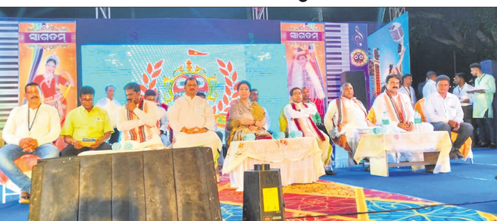
ଖମାଟା, ୬୫ (ଡି.ଏନ.ଏ.)