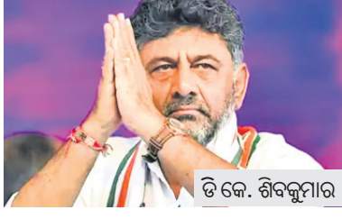
ଡି. କେ. ଶିବକୁମାର

ସୁନିର୍ଦ୍ଦିଷ୍ଟ ସମ୍ପତ୍ତି କୋଡ୍ ଏବଂ ନ୍ୟାଶନାଲ ରେଜିଷ୍ଟର ଅଫ୍ ସିଟିଜେନ(ଏନଆରସି) ଭଳି ପ୍ରସଙ୍ଗ ଉଦାହରଣ ସେ ଭାବପାଇଁ କଥା ସମାଲୋଚନା କରିଛନ୍ତି। ବିଧାନସଭା ନିର୍ବାଚନରେ ଭାବପାଇଁ କୋଣସି ଏକୋଥା ଏବଂ ବୁଲେଟ୍ ଅଧୀନରେ ପ୍ରଧାନମନ୍ତ୍ରୀ ନରେନ୍ଦ୍ର ମୋଦି ପଦାଧିକାର କରିବ ନାହିଁ।