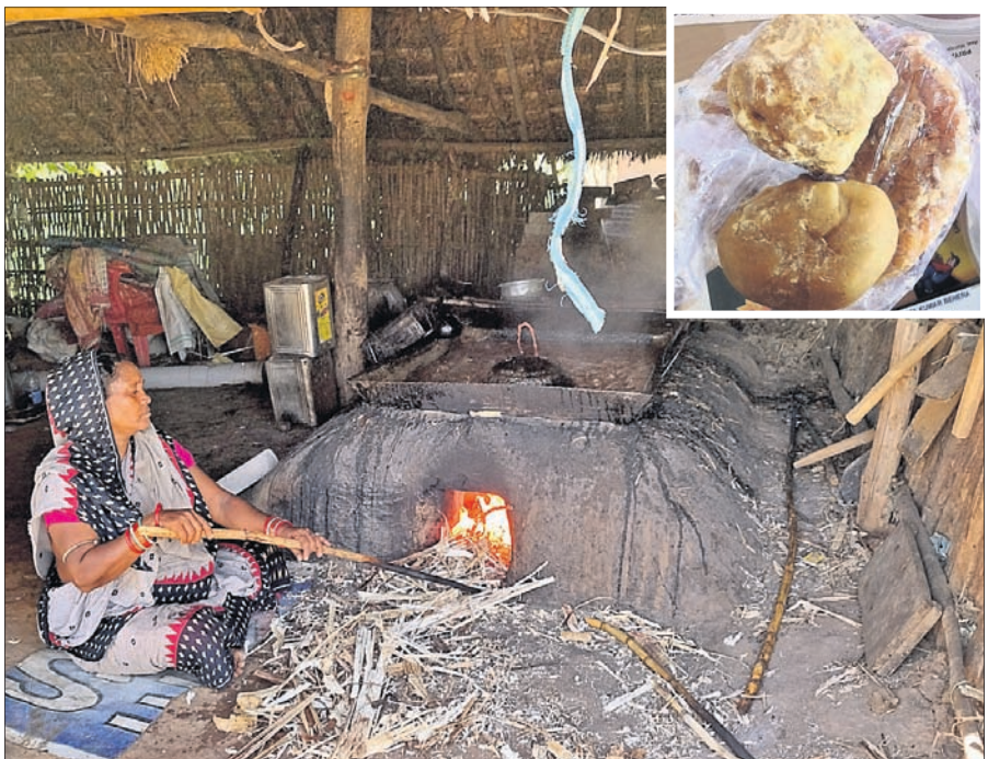
ନୂଆ କଣ୍ଟାବଣିଆ ଗାଁରେ ଜଣେ ମହିଳା ପାରମ୍ପରିକ ପଦ୍ଧତିରେ ଗୁଡ଼ ପ୍ରସ୍ତୁତ କରୁଛନ୍ତି ।

୧୯୮୦ରେ ପ୍ରତିଷ୍ଠିତ ନୟାଗଡ଼ ସମବାୟ ଚିନିକଳ ଏକଦା ଏହି ଜିଲ୍ଲାର କୃଷିଭିତ୍ତିକ ଅର୍ଥନୀତିକୁ ସୁଦୃଢ଼ କରିଥିଲା । ଚିନିକଳର ଉତ୍ପାଦନ କ୍ଷମତା ୧.୨ ଲକ୍ଷ ଟନ୍ ଥିବାବେଳେ ଏହା ଉପରେ ୩୦ ହଜାରରୁ ଊର୍ଦ୍ଧ୍ୱ ଚାଷୀ ନିର୍ଭର କରି ଚଳୁଥିଲେ । କିନ୍ତୁ ୨୦୧୫ରେ ଚିନିକଳ ବନ୍ଦ ହେବା ପରେ ଆଖୁଚାଷୀ ପୁଣି ହାତ ଦେଇବିନି । ତଥାପି ଚିନି ବଦଳରେ ଗୁଡ଼ର ଚାହିଦା ବହୁଥିବାରୁ ଅନେକ କୃଷକ ପାରମ୍ପରିକ ଗୁଡ଼ ବ୍ୟବସାୟ ପୁଣି ଫେରାଇ ନାହାନ୍ତି । ପ୍ରୋସାହନ ମିଳିପାରିଲେ ଚାଷୀମାନେ ଅଧିକ ପରିମାଣର ଆଖୁ ଉତ୍ପାଦନ କରି ଗୁଡ଼ର ଚାହିଦାକୁ ମେଣ୍ଟାଇବାରେ ସକ୍ଷମ ହୁଅନ୍ତେ । ଫଳରେ ଚାଷୀଙ୍କ ଲାଭ ବଢ଼ନ୍ତା ଓ ଲୋକେ ମଧ୍ୟ ଉଚିତ ମୂଲ୍ୟରେ ଚିନି ବଦଳାଇ ଗୁଡ଼କୁ ଆଦରିପାରନ୍ତେ ।