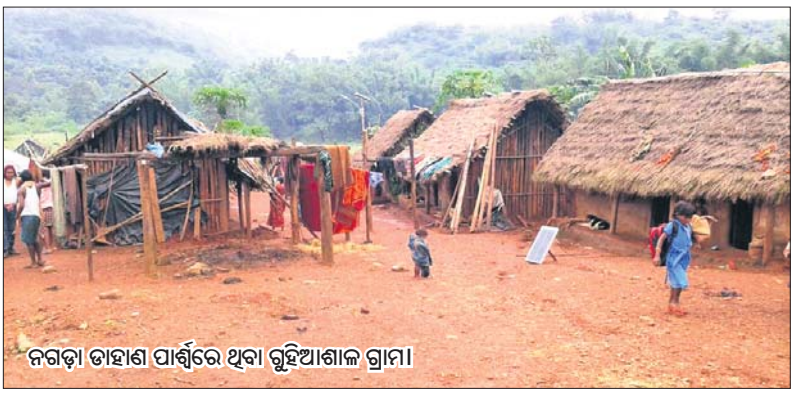
ନଗଡ଼ା ଡାହାଣ ପାର୍ଶ୍ଵରେ ଥିବା ଗୁହଁଆଖାଇ ଗ୍ରାମ।