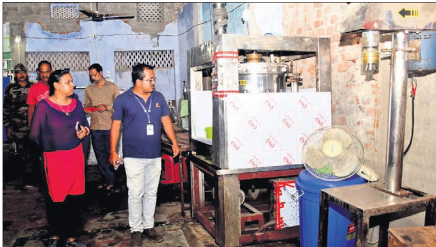
ନକଲି ମୃଦୁ ପାନୀୟ କାରଖାନାରେ ସିଏମ୍‌ସି ପକ୍ଷରୁ ଦର୍ଶନ କରାଯାଇଛି।