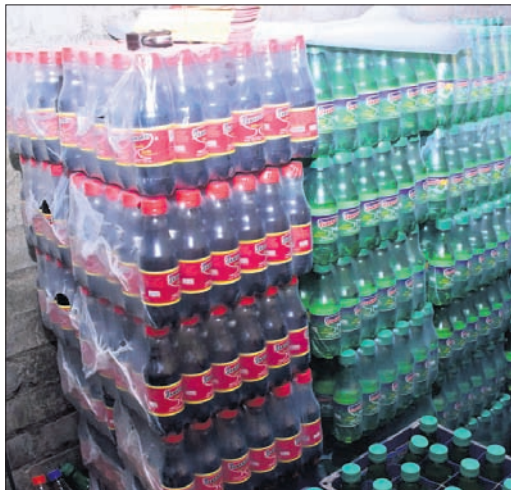
କଟକ ଅଞ୍ଚଳରେ ପାନୀୟ ବୋତଲ।

କଟକ ଅଞ୍ଚଳ, ୬ (ଭ୍ୟୁରୋ): କଟକ ନକଲି ଓ ଅପମିଶ୍ରିତ କାରଖାନାରେ ସିଏମ୍‌ସି ପକ୍ଷରୁ ଦର୍ଶନ କରାଯାଇଛି। କଟକ ନକଲି ଓ ଅପମିଶ୍ରିତ କାରଖାନାରେ ସିଏମ୍‌ସି ପକ୍ଷରୁ ଦର୍ଶନ କରାଯାଇଛି। କଟକ ନକଲି ଓ ଅପମିଶ୍ରିତ କାରଖାନାରେ ସିଏମ୍‌ସି ପକ୍ଷରୁ ଦର୍ଶନ କରାଯାଇଛି।