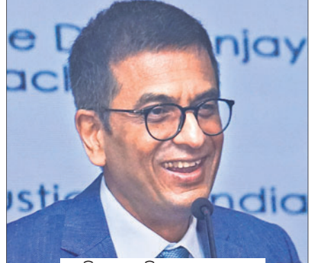
ସିଜେଆଇ ଡି. ଖାଲ୍. ଚନ୍ଦ୍ରଚୂଡ଼