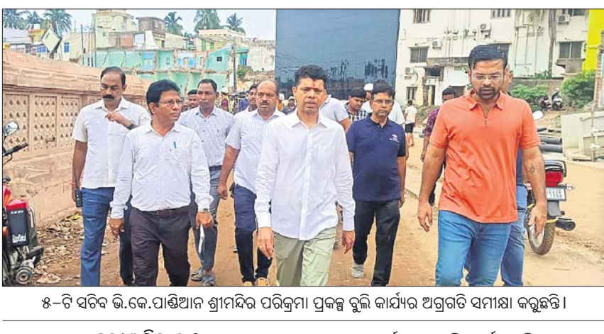
୫-ଟି ସିଟିଭି.ଭି.କେ.ପାଠିଆନ ଶ୍ରାମିକ ପରିକ୍ରମା ପ୍ରକଳ୍ପରୁ ଉଲ୍ଲ୍ଲାସୀ ସମସ୍ତ କାର୍ଯ୍ୟ ଅଗ୍ରଗତି ସମୀକ୍ଷା କରୁଛନ୍ତି ।

ପୂର୍ବା ସହରକୁ ବିଶ୍ଵସ୍ତରୀୟ ସହରରେ ପରିଣତ କରିବା ପାଇଁ ରାଜ୍ୟ ସରକାର ପକ୍ଷରୁ ବିଭିନ୍ନ ପ୍ରକଳ୍ପ କାର୍ଯ୍ୟ ଚାଲିଛି । ଚେପ୍ ନିର୍ଦ୍ଧାରିତ ସମୟ ମଧ୍ୟରେ କାର୍ଯ୍ୟ ସମ୍ପନ୍ନ କରିବା ନିମନ୍ତେ ସରକାରଙ୍କ ପକ୍ଷରୁ ଅନେକ ସମୟରେ କାର୍ଯ୍ୟ ଅଗ୍ରଗତି ନେଇ ସମୀକ୍ଷା କରୁଛନ୍ତି ।