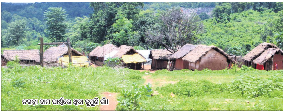
ନଗଡ଼ା ବାମ ପାର୍ଶ୍ଵରେ ଥିବା ଚୁମୁଣି ଗାଁ।