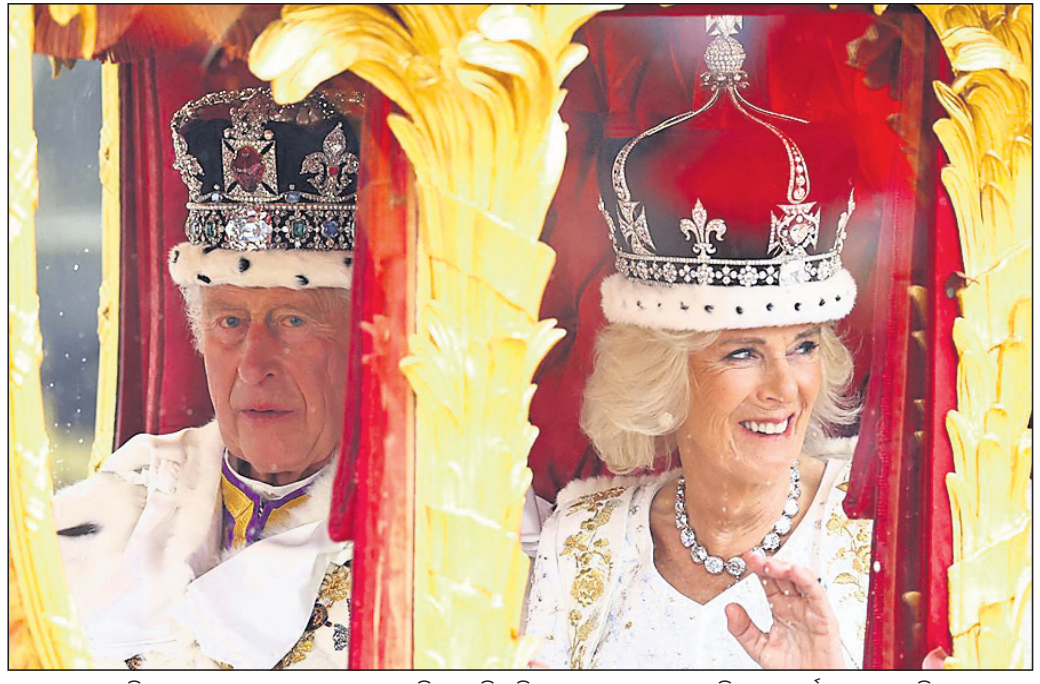
ରାଜ୍ୟାଭିଷେକ ପରେ ଗୋଲ୍ଡ୍ ଷ୍ଟେଜ୍ ଯୋଡ଼ାଗାଡ଼ିରେ ବସି ବକ୍ସିଙ୍ଗ୍ ପ୍ୟାଲେସ୍ ଫେରୁଛନ୍ତି ରାଜା ଚାର୍ଲ୍ସ୍ ଓ ରାଣୀ କାମିଲା ।

ରାଜା ଚାର୍ଲ୍ସ୍ ଶାୟଳ ଏବଂ ରାଣୀ କାମିଲାଙ୍କ ରାଜ୍ୟାଭିଷେକ କରାଯାଇଛି । ୩ ଦିନ ଧରି ଏହି କାର୍ଯ୍ୟକ୍ରମ ଦେଖାଯାଏ । ରାଜ୍ୟାଭିଷେକ ସାରି ବକ୍ସିଙ୍ଗ୍ ପ୍ୟାଲେସକୁ ଫେରିବା ସମୟରେ ରାସ୍ତାକଡ଼ରେ ଛିଡ଼ା ରହିଥିବା ଚାର୍ଲ୍ସ୍ ପ୍ରଶଂସକ ‘ଇଶ୍ୱର ରାଜାଙ୍କୁ ରକ୍ଷା କରନ୍ତୁ’ ବୋଲି ନାଚା ଦେଖାଯାଇଛି ।