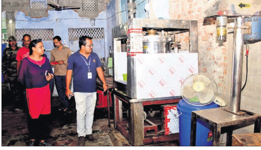
ନକଲି ମୃଦୁ ପାନୀୟ କାରଖାନାରେ ସିଏନ୍ସି ପକ୍ଷରୁ ତତ୍ତ୍ୱାବଳି କରାଯାଇଛି।