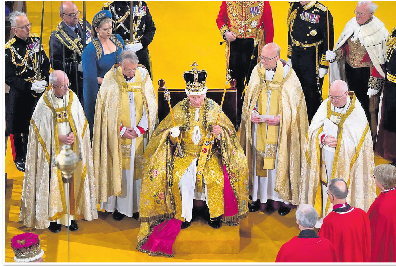
କିଙ୍ଗ ଚାର୍ଲ୍ସ୍ ଶାୟଳ ସେଣ୍ଟ ଏଡ଼ୱାର୍ଡ୍ କ୍ରୁନ ପିନ୍ଧାଯିବା ପରେ ଦୃଶ୍ୟ ।

ହଜାରେ ବର୍ଷ ପୁରୁଣା ରାଜକୀୟ ପରମ୍ପରା ଅନୁସାରେ କିଙ୍ଗ ଚାର୍ଲ୍ସ୍ ତୃତୀୟଙ୍କ ରାଜ୍ୟାଭିଷେକ ଷ୍ଟେସ୍ମିନ୍‌ସ୍ଟର ଆବେରେ ଶନିବାର ସମ୍ପନ୍ନ ହୋଇଛନ୍ତି । ୭୦ ବର୍ଷ ପରେ ଲଣ୍ଡନର ଆବେ ଚର୍ଚ୍ଚରେ କିଙ୍ଗ ଚାର୍ଲ୍ସ୍ ଓ କୁଇନ୍ କାମିଲାଙ୍କ ଐତିହାସିକ ରାଜ୍ୟାଭିଷେକ ଦେଶ ଆଡ଼ମ୍ବର ସହକାରେ କରାଯାଇଛି । ଏଥିରେ ଭାରତର ଉପରାଷ୍ଟ୍ରପତି ଜଗଦୀପ୍ ପଟ୍ଟନାୟକ ସମେତ ଦେଶ ବିଦେଶରୁ ବହୁ ବିଶିଷ୍ଟ ବ୍ୟକ୍ତି ଯୋଗ ଦେଇଥିଲେ । ସମାରୋହରେ ବିଭିନ୍ନ ସମ୍ପ୍ରଦାୟର ଧର୍ମଗୁରୁ ଉପସ୍ଥିତ ରହିଥିଲେ । ଏହି ଅବସରରେ ଚାର୍ଲ୍ସ୍ ସେଣ୍ଟ ଏଡ଼ୱାର୍ଡ୍ କ୍ରୁନ ପିନ୍ଧାଯାଇଛନ୍ତି । ରାଜ୍ୟାଭିଷେକ ପରେ କିଙ୍ଗ ଚାର୍ଲ୍ସ୍ ତ୍ରିଟେନର ୪୦ତମ ରାଜା ହୋଇଛନ୍ତି । ରାଜ୍ୟାଭିଷେକରେ ଅନେକ ବର୍ଷ ପୁରୁଣା ସୁନା ଓ ରୂପା ନିର୍ମିତ ଆଭୂଷଣ ବ୍ୟବହାର କରାଯାଇଛି, ଯେଉଁଥିରେ ସୁନାରେ ତିଆରି କିଙ୍ଗ୍ସ ଅର୍ବ୍, ସେପ୍ଟେସ୍, ଆସ୍ତ୍ରାଲ, ଗାମ୍‌ଗା ବିଦି ରହିଛି ।