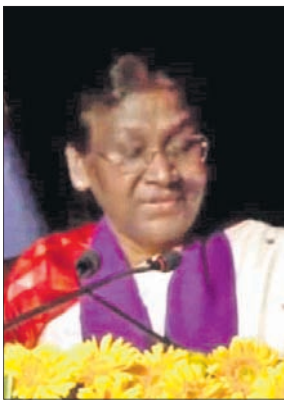
ଏମ୍ଏସ୍‌ସି ଅତିଶୋଭିତମ ହଲ୍ଲରେ ରାଷ୍ଟ୍ରପତି ଦ୍ରୌପଦୀ ମୁର୍ମୁ

୩ ଦିନିଆ ମୟୂରଭଞ୍ଜ ଗସ୍ତରେ ଥିବା ରାଷ୍ଟ୍ରପତି ଦ୍ରୌପଦୀ ମୁର୍ମୁଙ୍କ ଶନିବାର ଶ୍ରୀରାମଚନ୍ଦ୍ର ଭଞ୍ଜଦେଓ ବିଶ୍ୱବିଦ୍ୟାଳୟର ସମାବର୍ତ୍ତନ ଉତ୍ସବର ସାକ୍ଷାତ୍ ଅଭିଭାଷଣ ସମୟରେ ଦେଖାଦେଇଛି ଗୁରୁତର ଛୁଟି । ରାଷ୍ଟ୍ରପତି ଅଭିଭାଷଣ ଆରମ୍ଭ କରିବା ମାତ୍ରେ ଅତିଶୋଭିତମରୁ ଆଲୁଅ ଚାଲିଗଲା । କେନ୍ଦ୍ରରେ ଚଳୁ ମଧ୍ୟ ଠିକ୍ରେ ଚାଲିଲା । ରାଷ୍ଟ୍ରପତି ଅନ୍ଧାରରେ ୯ ମିନିଟ୍ ପର୍ଯ୍ୟନ୍ତ ନିଜର ଅଭିଭାଷଣ ଦେବା ପରେ କରେଖ ଆସିଥିଲା । ଦେଶର ପ୍ରଥମ ନାଗରିକଙ୍କ କାର୍ଯ୍ୟକ୍ରମରେ ଏଭଳି ସାଂଘାତିକ ଛୁଟିକୁ ସବୁ ମହଲରୁ ନିନ୍ଦା କରାଯାଇଛି । ବିଶ୍ୱବିଦ୍ୟାଳୟ କର୍ତ୍ତୃପକ୍ଷ ଏଭଳି ଛୁଟିକୁ ନୈତିକତା ଦୃଷ୍ଟିରୁ ନିଜକୁ ବାଧ୍ୟ କରିଥିବାବେଳେ ବିଦ୍ୟୁତ୍ ଯୋଗାଣକାରୀ ସଂସ୍ଥା ଏହାକୁ ବିଶ୍ୱବିଦ୍ୟାଳୟର ଇଣ୍ଟରନାଲ ଫଲ୍ଡ ବୋଲି କହି ନିଜ ଉପରୁ ଦୋଷ ଛଡ଼ାଇ ଦେଇଛି । ତେବେ ଏଭଳି ଘଟଣା