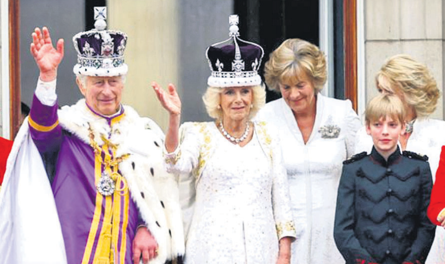
ଲଣ୍ଡନର ଷ୍ଟେସିନରେ ଆବେଦନ ଶନିବାର ରାଜ୍ୟାଭିଷେକ ପରେ ସେକ୍ସ ଏଡ଼୍‌ଫର୍ଟଙ୍କ ଗ୍ରାଉନ୍ ପରିସ୍ଥିତିରେ ବ୍ରିଟେନ୍ କିଙ୍ଗ୍ ଚାର୍ଲ୍ସ ଓ କୁଇନ୍ କାମିଲା ଏବଂ ରାଜପରିବାର ସଦସ୍ୟମାନେ ।

ବ୍ରିଟେନ୍‌ରୁ ମିଳିଲା ନୂଆ ରାଜା । ଶନିବାର ବିଧିବଦ୍ଧ ଭାବେ କିଙ୍ଗ୍ ଚାର୍ଲ୍ସ ତୃତୀୟ ବ୍ରିଟେନ୍ ରାଜା ରୂପେ ଦାୟିତ୍ୱ ଗ୍ରହଣ କରିଛନ୍ତି । ଲଣ୍ଡନ ଷ୍ଟେସିନରେ ଆବେଦନ କରି କିଙ୍ଗ୍ ଚାର୍ଲ୍ସ ଓ କୁଇନ୍ କାମିଲାଙ୍କ ରାଜ୍ୟାଭିଷେକ କରାଯାଇଛି । ରାଜପରିବାର ସମେତ ଦେଶ ବିଦେଶକୁ ଆସିଥିବା ବହୁ ଭିଆଇପି ଅତିଥି ଏହି ବିଶାଳ ସମାରୋହରେ ସାମିଲ ହୋଇଛନ୍ତି । ଚାର୍ଲ୍ସଙ୍କ ପ୍ରଶୋଧନ ଦେଖିବା ପାଇଁ ଅନେକ ସଂଖ୍ୟାରେ ଲୋକ ରାସ୍ତାକଡ଼ରେ ଉଲ୍ଲସାର ସହ ଅପେକ୍ଷା କରିଥିବାର ଦେଖାଯାଇଥିଲା ।