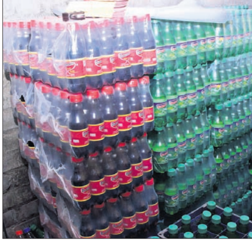
କଟକ ଥଣ୍ଡା ପାନୀୟ ବୋତଲ।