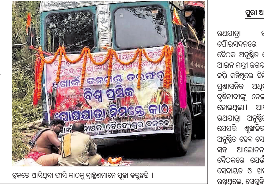
ସୁକ୍ଷ୍ମ ଆସିଥିବା ପାସିକାଠକୁ ଗ୍ରାହଣମାନେ ପୂଜା କରୁଛନ୍ତି।

ଖୋର୍ଦ୍ଧା ଅଞ୍ଚଳ, ୬ (ଭ୍ୟୁରୋ): ଦୈତ୍ୟେଶ୍ୱରରୁ ଶ୍ରୀକ୍ଷେତ୍ର ଗଲା ପାସିକାଠ। ଦୈତ୍ୟେଶ୍ୱରରୁ ଶ୍ରୀକ୍ଷେତ୍ର ଗଲା ପାସିକାଠ।