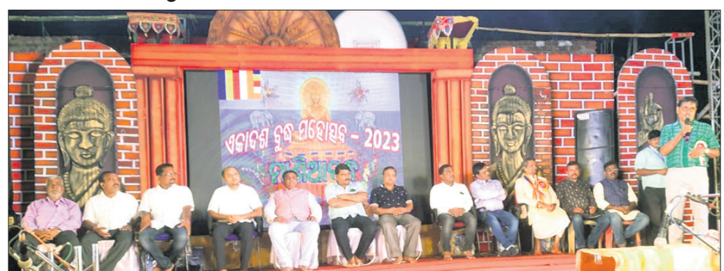
ମାଣିଆବନ୍ଧୁ ଏକାଦଶ ବୁଦ୍ଧ ମହୋତ୍ସବର ତୃତୀୟ ସନ୍ଧ୍ୟାରେ ମଞ୍ଚାସୀନ ଅତିଥିମାନେ।