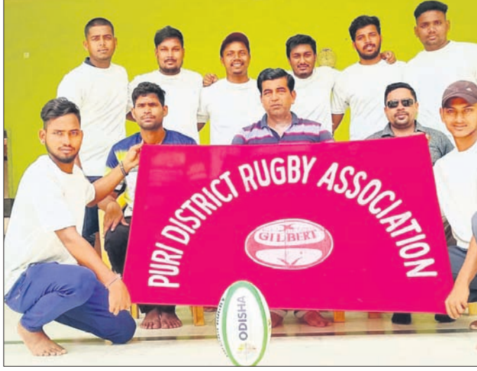
ଭୁବନେଶ୍ୱର କିର୍ ବିଶ୍ୱବିଦ୍ୟାଳୟରୁ ବାହାରିଥିବା ପୁରୀ ରଗର୍ବୀ ଦଳ।

ଶିବିର ଅନୁଷ୍ଠିତ ହୋଇଥିଲା। ଏହି ଶିବିରରେ ଖେତେକାନ୍ତର କିର୍ ସମ୍ପାଦକ ପ୍ରାଥ୍ୟସାରଥୀ ମହାପାତ୍ର ଉପସ୍ଥିତ ଥିଲେ। ଏହି ଚାମ୍ପିୟନଶିପରେ ପୁରୀ ଜିଲ୍ଲାର ପ୍ରାୟ ୩୦ଜଣ ଖେଳାଳି ଭାଗ ନେଇଥିଲେ। ସେଥିମଧ୍ୟରୁ ୧୧ ଜଣ ଦଳ ଖେଳାଳି କିର୍ଠାରେ ଅନୁଷ୍ଠିତ ହେବାକୁ ଥିବା ପ୍ରତିଯୋଗିତାରେ ଭାଗ ନେବା ପାଇଁ