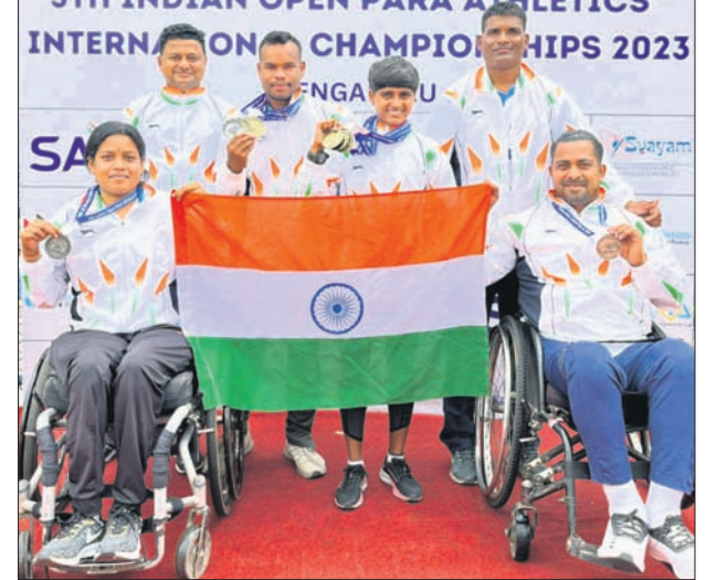
ପଦକ ବିଜୟୀ ଓଡ଼ିଶା ପ୍ରତିଯୋଗୀ।

ଭୁବନେଶ୍ୱର, ୭/୫ (କ୍ରୀଡ଼ା ପ୍ରତିନିଧି) ବେଙ୍ଗାଲୁରୁର ଶ୍ରୀ କାନ୍ତିରଭା ସ୍ଥାଡିୟମରେ ରବିବାର ଶେଷ ହୋଇଥିବା ୫ମ ଇଣ୍ଡିଆନ୍ ଓପନ୍ ପାରା ଆଥଲେଟିକ୍ସ ଚାମ୍ପିୟନଶିପ୍ରେ ଅଜିମ୍ ବିବସରେ ଓଡ଼ିଶାକୁ ୨ଟି ସ୍ୱର୍ଣ୍ଣ ପଦକ ମିଳିଛି। ଏହାକୁ ମିଶାଇ