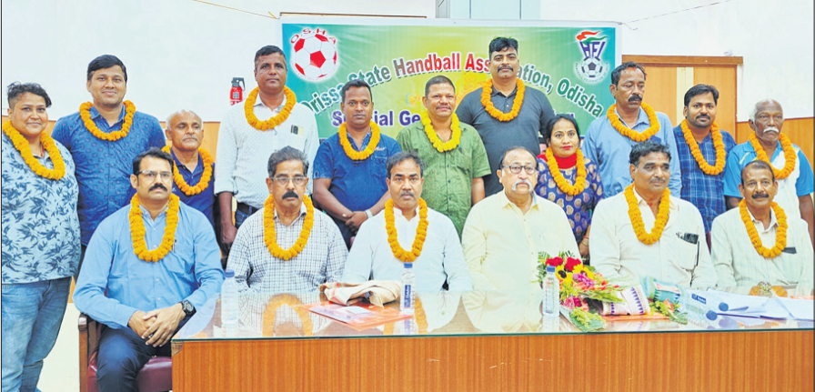
ଓଡ଼ିଶା ରାଜ୍ୟ ହାଣ୍ଡବଲ୍ ଆସୋସିଏସନ୍ର ନବନିର୍ବାଚିତ କର୍ମକର୍ମୀ।