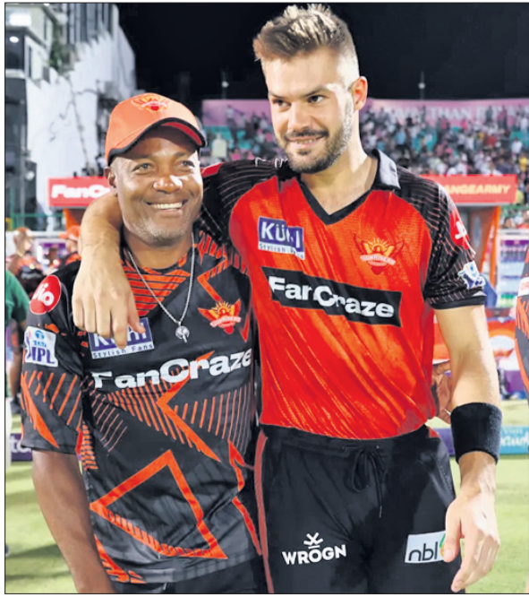
କୋର୍ ସ୍ତ୍ରାସନ୍ ଲାଗାଇ ସହ ଅଧିନାୟକ ଏଡେନ ମାରକ୍ରମ।

ଅନମୋଲପ୍ରାପ୍ତ ୪ ଟୋକା ଓ ୧ ଛକା ମାରିଥିଲେ। ରାହୁଲ ତ୍ରିପାଠୀ କ୍ରମରେ ଯୋଗ ଦେବା ସହିତ ଅଭିଷେକ ଶର୍ମାଙ୍କ ସହିତ ୬୫ ରନ୍ ଯୋଡ଼ିଥିଲେ। ଅଭିଷେକ ଚଳିତ ସିଜନର ବିଶିଷ୍ଟ ଅର୍ଦ୍ଧଶତକ ହାସଲ କରିବା ପରେ ଅଭିଷେକ ବଲ୍ରେ ଆଉଟ ହୋଇଥିଲେ। ଟାକ ଇନିଂସରେ ୧୦ ଟୋକା ଓ ୪ ଛକା ମାରିଥିଲେ। ଅନ୍ୟ ପକ୍ଷରେ ଶେଷ ସାଧ୍ୟ ଅପରାଜିତ ଥିବା ରୟାଲ୍ ଅଧିନାୟକ ସାମସନ ୬୬ ରନ୍ କରିଥିଲେ। ଟାକ ଇନିଂସରେ ୪ ଟୋକା ଓ ୫ ଛକା ମାରିଥିଲେ। ଉଭୟ ସାମସନ ଓ ବଟଲର ୮୧ ବଲ୍ ଖେଳି ୧୩୮ ରନ୍ ଯୋଡ଼ିଥିଲେ। ସନରାଇଜର୍ସ ପକ୍ଷରୁ ମାର୍କୋ କାନସେନ୍ ଓ ଭୁବନେଶ୍ୱର କ୍ଲବର ଗୋଟିଏ ଲେଖାଏ ଉଇକେଟ ନେଇଥିଲେ। ୨୧୫ ରନ୍ ଲକ୍ଷ୍ୟରେ ସନରାଇଜର୍ସ ପକ୍ଷରୁ ବୁଲ୍ ଓପନର ହାସଲକାରୀ ପାଲଟିଥିଲେ।