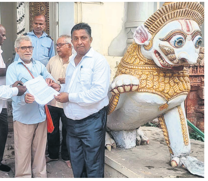
ଶ୍ରୀମନ୍ଦିର ଉତ୍କଳଶ୍ରୀ ଖୋଲିବା ସହ ଉଚ୍ଚ ଅଧିକାରୀ ଗଣତି କରାଯିବା ଦାବିରେ ଭାରତୀୟ ବିକାଶ ପରିଷଦ ପକ୍ଷରୁ ରବିବାର ଗଜପତି ମହାରାଜାଙ୍କ ଉଦ୍‌ଦେଶ୍ୟରେ ଦାବିପତ୍ର ପ୍ରଦାନ କରାଯାଇଛି।

ସେଲ୍‌ଫି ପଠାଇବା ସମୟରେ ନିଜର ନାମ ଏବଂ ମୋବାଇଲ୍ ନମ୍ବର ଦେବାକୁ ଭୁଲନ୍ତୁ ନାହିଁ। ଯୋଗ୍ୟ ବିବେଚିତ ଫଟୋ ପ୍ରକାଶ ପାଇବ।