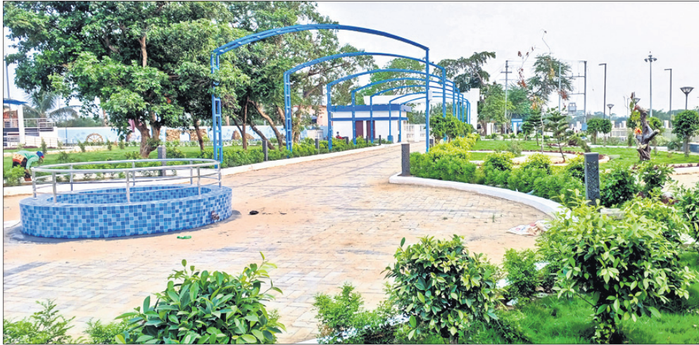
ସିଲଭର ସିଟି ବୋର୍ଡ୍ କ୍ଲବ୍ରେ ଜାରି ରହିଥିବା ଉନ୍ନତ ମାର୍ଗ।

କଟକ ମାତାମଠିତ ମହାନଦୀ କୁଳରେ ଥିବା ସିଲଭର ସିଟି ବୋର୍ଡ୍ କ୍ଲବ୍ ଏବେ ନୂଆ ରୂପ ପାଇବାକୁ ଯାଉଛି। ପର୍ଯ୍ୟଟକଙ୍କୁ ଅଧିକ ଆକୃଷ୍ଟ କରିବା ପାଇଁ ଓଡ଼ିଶା ପର୍ଯ୍ୟଟନ ଉନ୍ନୟନ ନିଗମ (ଓଡିଟିସି) ପକ୍ଷରୁ ଏହାର ପରିସରରେ ବିଭିନ୍ନ ଉନ୍ନୟନମୂଳକ କାର୍ଯ୍ୟ ଜାରି ରହିଛି। ବିଶେଷକରି ବୋର୍ଡ୍ କ୍ଲବ୍ ପରିସରରେ ୮ କୋଟି ଟଙ୍କା ବ୍ୟୟରେ ଓପନ୍-ସ୍ପାସ୍ ପାର୍କ, ଟେକ୍ସ, ଗ୍ଲାସ୍ ଟେକ୍, ବୋକ୍ସିଂହାଉସ୍, ଫାଇଭ୍ ଟେକ୍, ପିଲାଇ ପାଇଁ ପାର୍କ, ଟେକ୍ସ ଟେକ୍ ଆଦି କାମ ଜାରି ରହିଛି। ଚଳିତମାସ ଶେଷ ପୂର୍ବ ଏହି କାର୍ଯ୍ୟ ଶେଷ କରିବାକୁ ଓଡିଟିସି ଲକ୍ଷ୍ୟ ରଖିଛି। ୨୦୨୧ ମସିହାରେ ୧.୩୫ କୋଟି ଟଙ୍କା ବ୍ୟୟରେ ଏହାର ପାର୍କ ନିର୍ମାଣକାର୍ଯ୍ୟ କରାଯାଇଥିଲା। ପର୍ଯ୍ୟଟକମାନଙ୍କୁ ମହାନଦୀରେ ବୁଡ଼ିବାକୁ ଲକ୍ଷ୍ୟକ୍ରମ ସହ ମନୋରଞ୍ଜନର ସୁବିଧା ଯୋଗାଇ ଦେବା ନିମନ୍ତେ ଓଡିଟିସି ପକ୍ଷରୁ ଏହି ଖର୍ଚ୍ଚ ଖୋର୍ଚ୍ଚ ପାର୍କ କରାଯାଇଛି। ପୂର୍ଣ୍ଣମାନ୍ଦ୍ରୀ ନଦୀର ପକ୍ଷମାନଙ୍କୁ ଏହାର ଉଦ୍ଘାଟନ କରିଥିଲେ। ଏଠାରେ ପର୍ଯ୍ୟଟକମାନେ ମହାନଦୀର ମନୋରଞ୍ଜନ ସିଦ୍ଧାନ୍ତ ପାଇଁ ଯୋଗାଇ ଦେବା ପାଇଁ ନିଗମ ପକ୍ଷରୁ ଉଦ୍ୟମ ଜାରି ରହିଛି। ବୃତ୍ତୀୟ ପର୍ଯ୍ୟାୟରେ ୮ କୋଟି ଟଙ୍କା ଖର୍ଚ୍ଚ କରାଯାଇ ଏହାର ପରିସରରେ ବିଭିନ୍ନ ଉନ୍ନୟନମୂଳକ କାର୍ଯ୍ୟ କରାଯାଉଛି। ଅଧିକାଂଶ କାମ ଶେଷ ପର୍ଯ୍ୟାୟରେ ପହଞ୍ଚିଛି। ୨୦୦ରୁ ଊର୍ଦ୍ଧ୍ୱ ଖର୍ଚ୍ଚ କାପେ ବ୍ୟୟ ହୋଇଛି। ଏତଦ୍ବ୍ୟତୀତ ପର୍ଯ୍ୟଟକଙ୍କ ପାଇଁ ଓଡିଟିସି ପକ୍ଷରୁ ଏଠାରେ ଏକ ରେଷ୍ଟୁରାଣ୍ଟ କରାଯାଇଛି। ବିଶେଷକରି ପର୍ଯ୍ୟଟକଙ୍କୁ ଉନ୍ନତମାନର ସେବା ଯୋଗାଇ ଦେବା ପାଇଁ ନିଗମ ପକ୍ଷରୁ ଉଦ୍ୟମ ଜାରି ରହିଛି।