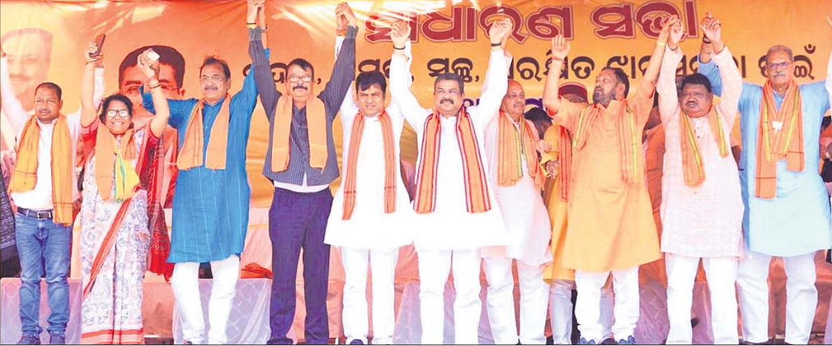
ରବିବାର ଝାରସୁଗୁଡ଼ା ଉପନିର୍ବାଚନରେ ଭୋଟ ପ୍ରଚାରରେ ସାମିଲ ହୋଇଥିବା ଭାଜପାର କେନ୍ଦ୍ରମନ୍ତ୍ରୀ, ସମ୍ପ୍ରଦି, ବିଧାୟକ ଓ ଦଳୀୟ ନେତୃତ୍ୱ ।

ସମ୍ବଲପୁର, ୭୫୫ (ବୁଧବେଳା) ମୁଖ୍ୟମନ୍ତ୍ରୀ ନବୀନ ପଟ୍ଟନାୟକଙ୍କୁ ଯେତିକି ଜାଣିଛି, ଲାସ ସମୟ ଦେଖିବା ପରେ ଯାହା ଲାଗୁଛି ମୁଖ୍ୟମନ୍ତ୍ରୀଙ୍କ ହାତରେ ଓଡ଼ିଶାର ଶାସନ ବ୍ୟବସ୍ଥା ନାହିଁ । ତାଙ୍କ କ୍ୟାବିନେଟ ମନ୍ତ୍ରୀମାନେ ଭେଟିବାର ସୁଯୋଗ ପାଉନାହାନ୍ତି । ତାଙ୍କ ଦଳର ବିଧାୟକ, ମୁଖ୍ୟ ଶାସନ ସଚିବ, ବିଜିପି ମୁଖ୍ୟମନ୍ତ୍ରୀଙ୍କୁ ଭେଟି ପାଉନାହାନ୍ତି । ଏଠାରେ କଳାପାହାଡ଼ଙ୍କ ଶାସନ ବ୍ୟବସ୍ଥା ଚାଲିଛି ବୋଲି ଝାରସୁଗୁଡ଼ାରେ ହେବାକୁ ଥିବା ଉପ ନିର୍ବାଚନ ପାଇଁ ପ୍ରଚାର କରିବା ଅବସରରେ କେନ୍ଦ୍ର ଶିକ୍ଷାମନ୍ତ୍ରୀ ଧର୍ମେନ୍ଦ୍ର ପ୍ରଧାନ କହିଛନ୍ତି ।