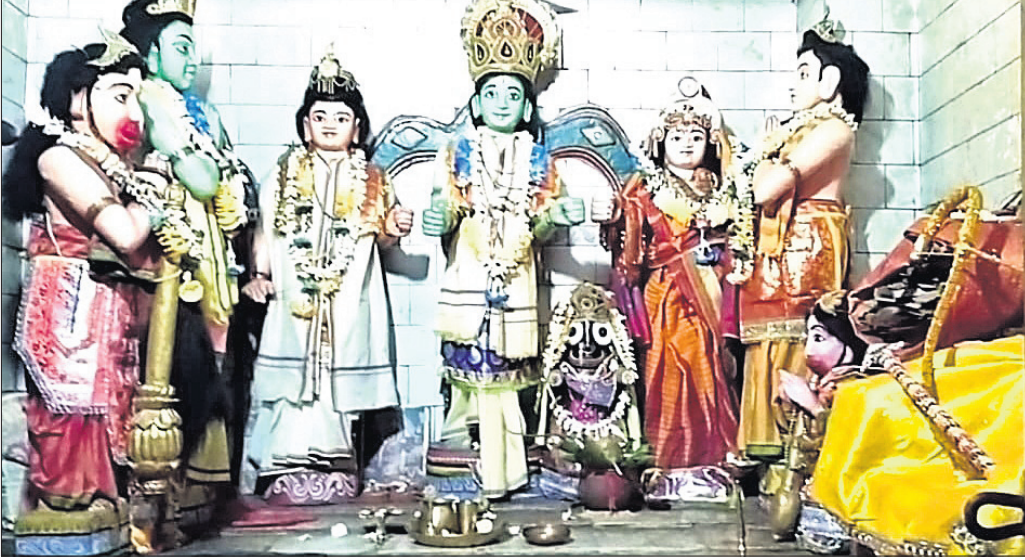
ପୂଜା ପାଉଥିବା ପ୍ରଭୁ ଶ୍ରୀରାମ, ଲକ୍ଷ୍ମଣ, ଦେବୀ ସୀତା ଏବଂ ହନୁମାନଙ୍କ ପ୍ରତିମୂର୍ତ୍ତି।

ଖୋର୍ଦ୍ଧା ଜିଲ୍ଲା ବୋଲଗଡ଼ ବ୍ଲକ ଅନ୍ତର୍ଗତ ଖଲୁଗିଆ ପଞ୍ଚାୟତର ସଂପୂର୍ଣ୍ଣ ଗ୍ରାମ ନିକଟରେ ରହିଛି ମୁଣ୍ଡିଆପଡ଼ା ବା ମଣ୍ଡନଗିରି ପାହାଡ଼। ପ୍ରାକୃତିକ ସବୁଜିମା ଭରା ପରିବେଶ ମଧ୍ୟରେ ଏହି ପାହାଡ଼ ଉପରେ ଶ୍ରୀରଘୁନାଥ ଜୀଉଙ୍କ ପୀଠ ଅବସ୍ଥିତ। ଏହା ପର୍ଯ୍ୟଟନ ସ୍ଥଳୀର ମାନ୍ୟତା ଲାଭ କରିଛି। ତଥାପି ଏହି ପୀଠ ଅବହେଳିତ ଅବସ୍ଥାରେ ରହିଛି। ଏହାର ଉନ୍ନତୀକରଣ ପ୍ରତି ଗୁରୁତ୍ୱ ଦିଆଯାଉନାହିଁ। ଗୋଟିଏ ପଟେ ସରକାର ପ୍ରମୁଖ ପର୍ଯ୍ୟଟନ କ୍ଷେତ୍ର, ମନ୍ଦିରର ଉନ୍ନତୀକରଣ ଉପରେ ଗୁରୁତ୍ୱ ଦେଉଛନ୍ତି। ହେଲେ ଅନ୍ୟପଟେ ଏଥିପ୍ରତି ଚରମ ଅବହେଳା କରାଯାଇଛି। ରାଜନୈତିକ ଲଘୁଶକ୍ତି ଓ ଜିଲ୍ଲା ପ୍ରଶାସନର ଅଚଳିତତା ଅଭାବ କାରଣରୁ ଏହି ପର୍ଯ୍ୟଟନ କ୍ଷେତ୍ର ଗୁରୁତ୍ୱ ହରାଇଛି।