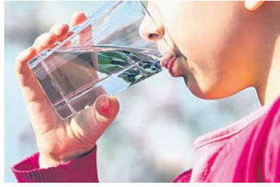
କିମ୍ବା ଖାଇବା ଠିକ୍ ପରେ ପାଣି ପିଅନ୍ତୁ ନାହିଁ। ଏହା ପାଚନ କ୍ରିୟାରେ ବାଧା ସୃଷ୍ଟି କରିଥାଏ। ଖାଇବାର ଅଧଃଶ୍ୱାସ ପରେ କିମ୍ବା ପୂର୍ବରୁ ପାଣି ପିଅନ୍ତୁ।

ଆପଣଙ୍କର ଏଭଳି ଅଭ୍ୟାସ ଅଛି ତେବେ ତାହାକୁ ତୁରନ୍ତ ବର୍ଜନ କରନ୍ତୁ। କାରଣ ଖାଦ୍ୟ ଖାଇବା ପରେ ଯଦି ଗାଧାତି, ତେବେ ତାହା ରକ୍ତ ପ୍ରବାହକୁ ଶିଥିଳ କରିଦିଏ। ଖାଇବା ପରେ କିଛି ସମୟ ବୁଲାଇବାକୁ କରନ୍ତୁ। ଏହା ଖାଦ୍ୟକୁ ହଜମ କରିବାରେ ସାହାଯ୍ୟ କରିଥାଏ। ଖାଇବା ପରେ ସାଙ୍ଗେ ସାଙ୍ଗେ ଶୋଇଲେ ତାହା ମେଦ ବୃଦ୍ଧି କରିବାରେ ସହାୟକ ହୋଇଥାଏ। ଖାଉଥିବା ସମୟରେ