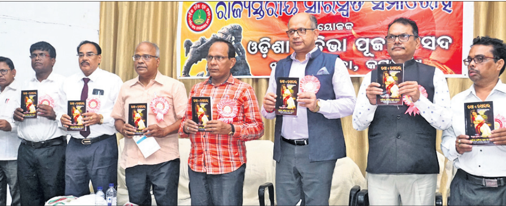
କଟକ ଶତାବ୍ଦୀ ଭବନରେ ଅନୁଷ୍ଠିତ ବାର୍ଷିକ ସାରସ୍ୱତ ସମାରୋହରେ ଅତିଥିମାନେ ପୁସ୍ତକ ଉଦ୍ଘାଟନ କରୁଛନ୍ତି।