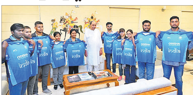
ଓଡ଼ିଶା ମୋ ପରିବାର ପକ୍ଷରୁ ମଣିପୁରରୁ ଉଦ୍‌ଗାତା ହୋଇଥିବା ୧୦ ଓଡ଼ିଆ ଛାତ୍ରୀଛାତ୍ରଙ୍କୁ ପୁଖ୍ୟମନ୍ତ୍ରୀ ନବୀନ ପଟ୍ଟନାୟକ ହଜି ଜର୍ସି ଦେଇ ସ୍ୱାଗତ କରୁଛନ୍ତି ।

ଭୁବନେଶ୍ୱର, ୭।୫(ବୁଧବୋ) ମଣିପୁରର କେନ୍ଦ୍ରୀୟ କୃଷି ବିଶ୍ୱବିଦ୍ୟାଳୟରେ ପଢୁଥିବା ୧୦ଜଣ ଓଡ଼ିଆ ଛାତ୍ରୀଛାତ୍ର ରବିବାର ସୁରକ୍ଷିତ ଭାବେ ଭୁବନେଶ୍ୱରରେ ପହଞ୍ଚିଛନ୍ତି । ପୁଖ୍ୟମନ୍ତ୍ରୀ ନବୀନ ପଟ୍ଟନାୟକ ନିର୍ଦ୍ଦେଶକ୍ରମେ ଓଡ଼ିଶା ମୋ ପରିବାର ପକ୍ଷରୁ ଜାରିତ ହେବାରେ କ୍ଷତିଗ୍ରସ୍ତ ମଣିପୁରରେ ପାଠ ପଢୁଥିବା ଓଡ଼ିଆ ଛାତ୍ରୀଛାତ୍ରମାନଙ୍କୁ ଓଡ଼ିଶା ଆଣିବାକୁ ଉଦ୍ୟମ ଆରମ୍ଭ ହୋଇଥିଲା । ଶନିବାର ରାତିରେ ସେମାନଙ୍କୁ କୋଲକାତା ଅଣାଯାଇଥିଲା । ରବିବାର ପୂର୍ବାହ୍ନରେ ସେମାନେ ଆସି ଭୁବନେଶ୍ୱରରେ ପହଞ୍ଚିଥିଲେ । ବିନାବନ୍ଦରରେ ଓଡ଼ିଶା ପରିବାର ପକ୍ଷରୁ ଛାତ୍ରୀଛାତ୍ରମାନଙ୍କୁ ସ୍ୱାଗତ କରାଯାଇଥିଲା । ଏହାପରେ ସେମାନେ ନବୀନ ନିବାସ ଯାଇ