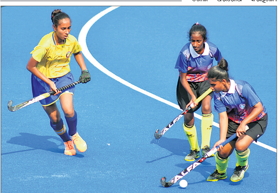
ଚଣ୍ଡିଗଡ଼ ଓ ଚେଲେଙ୍ଗାନା ମଧ୍ୟରେ ଅନୁଷ୍ଠିତ ମ୍ୟାଚ।