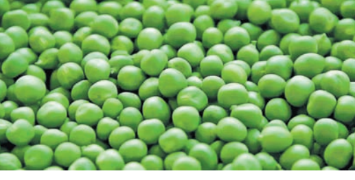
ମଧ୍ୟ ମ୍ୟାଗ୍ନେସିୟମ୍ ଓ ପୋଟାସିୟମ୍ ରହିଛି ଯାହା ଶରୀର ପାଇଁ ବେଶ୍ ଉପକାରୀ। ଗ୍ରୀନ୍ ମଟରରେ ଥିବା ଆର୍ଦ୍ର-ଅକ୍ଟିଡ଼ାକ୍ସ ଗୁଣ ଥିବାରୁ ଏହା ଶରୀରର ରୋଗ ପ୍ରତିରୋଧକ ଶକ୍ତିକୁ ଦୃଢ଼ ରଖିଥାଏ।

ଗ୍ରୀନ୍ ମଟର ସ୍ୱାସ୍ଥ୍ୟ ପାଇଁ ବେଶ୍ ଉପକାରୀ। ଏଥିରେ ପ୍ରୋଟିନ୍, ଆଇରନ୍, ଫସ୍ଫରସ୍, ଭିଟାମିନ୍-ଏ, ଭିଟାମିନ୍-କେ, ଭିଟାମିନ୍-ସି ଭଳି ରହିଛି। ଏହା ମେଦ ବହୁଳତାକୁ କମାଇବାରେ ସାହାଯ୍ୟ କରିଥାଏ ବୋଲି କାଲିଫର୍ନିଆ ବିଶ୍ୱବିଦ୍ୟାଳୟର ପୁଷ୍ଟିବିଜ୍ଞାନୀମାନେ ଏକ ସର୍ବେକ୍ଷ୍ମା ଜାଣିପାରିଛନ୍ତି। ଏଥିରେ କ୍ୟାଲୋରୀ ପରିମାଣ ମଧ୍ୟ କମ୍ ରହିଛି। ଉଚ୍ଚରେ ସୁଗାର ସ୍ତରକୁ ମଧ୍ୟ ଏହା ସମ୍ବଳିତ ରଖେ। ଏଥିରେ ଯେହେତୁ ଆଇରନ୍ ଓ ଫାଇବର୍ ରହିଛି ତେଣୁ ତାହା ପାଚନକ୍ରିୟାକୁ ସକ୍ରିୟ ରଖିବାରେ ସାହାଯ୍ୟ କରେ। ଏଥିରେ