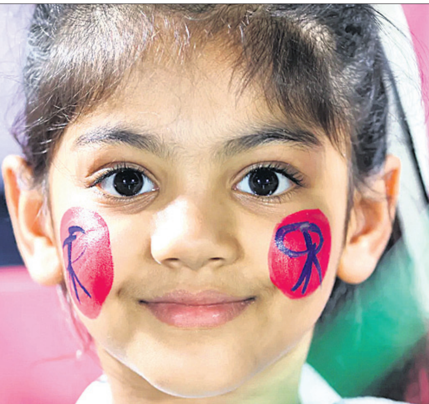
ଜୟପୁରଠାରେ ଅନୁଷ୍ଠିତ ସନରାଇଜର୍ସ ହାଇଦ୍ରାବାଦ ବିପକ୍ଷ ଆଇପିଏଲ୍ ମ୍ୟାଚରେ ଜଣେ ରାଜଗୁମ୍ଫା ରୟାଲ୍ ସମର୍ଥକ।

ସଂକ୍ଷିପ୍ତ ସ୍ୱାଭାବ ରାଜଗୁମ୍ଫା ରୟାଲ୍ ୨୦ ଓଭରରେ ୨୧୪/୨ (କୋର୍ ବଟଲର-୯୫, ସଞ୍ଜୁ ସାମସନ-୬୬, ଯଶସ୍ୱୀ ଜୟସାଲ-୩୫, ମାର୍କୋ କାନସେନ୍-୧/୪୪, ଭୁବନେଶ୍ୱର କ୍ଲବ-୧/୪୪)। ସନରାଇଜର୍ସ ହାଇଦ୍ରାବାଦ ୨୦ ଓଭରରେ ୨୧୭/୬ (ଅଭିଷେକ ଶର୍ମା-୫୫, ରାହୁଲ ତ୍ରିପାଠୀ-୪୭, ଅନମୋଲପ୍ରାପ୍ତ ସି-୩୩, ୟୁଜିସିଏସ୍ ଚହଲ-୪/୨୯, ଆର୍. ଅଶ୍ୱିନ-୧/୩୫, କୁଲଦୀପ ସାଦବ-୧/୫୦)।