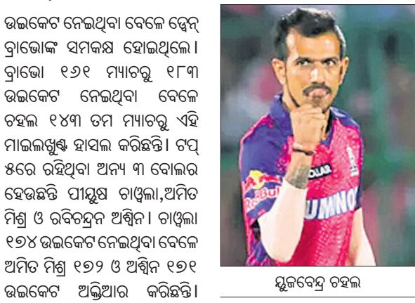
ଫୁଲ୍ ସେକ୍ସ ଚହଲ।

ଜୟପୁର, ୭/୫: ଆଇପିଏଲ୍ରେ ସର୍ବାଧିକ ଉଇକେଟ ନେବାର ରେକର୍ଡ୍ ନିଜ ନାମରେ କରିଛନ୍ତି ୟୁଜିସିଏସ୍ ଚହଲ। ୧୪୩ ମ୍ୟାଚରୁ ୧୮୩ ଉଇକେଟ ନେବା ସହିତ ସେ ଆଇପିଏଲ୍ରେ ଅଧିକ ଉଇକେଟ ନେବାର ରେକର୍ଡ୍ ବ୍ରେକ୍ କ୍ରୀଡ଼ାକାରୀ ହୋଇଛନ୍ତି। ଉଭୟ ଖେଳାଳି ମଧ୍ୟରେ ୟୁଗ୍ଗ ଭାବରେ ପ୍ରଥମ ସ୍ଥାନରେ ରହିଛନ୍ତି। ସନରାଇଜର୍ସ ହାଇଦ୍ରାବାଦ ବିପକ୍ଷ ମ୍ୟାଚରେ ଚହଲ ୨୯ ରନ୍ ଦେଇ ୪