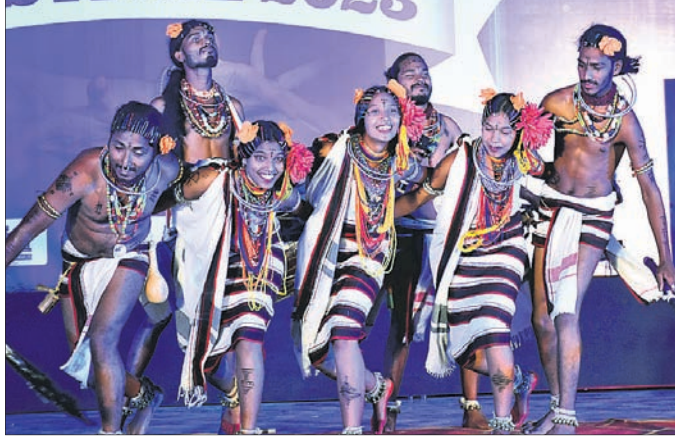
ଲୋକ ମହୋତ୍ସବର ଉଦ୍‌ଯାପନା ସନ୍ଧ୍ୟାରେ ପରିବେଷିତ ଲୋକକଳା।