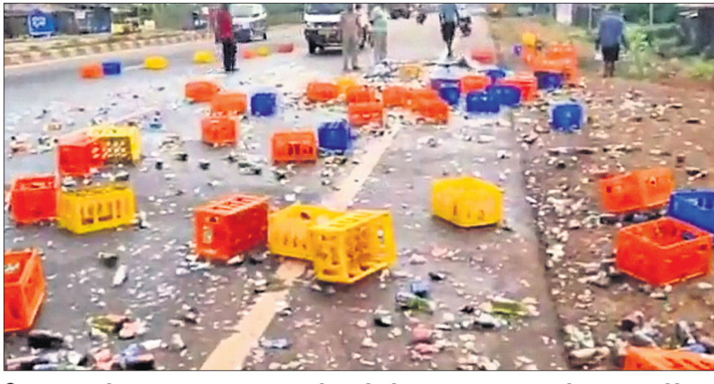
ନିରାକାରପୁର: କଳିଆ ଥାନା ସମ୍ମୁଖ ରାଜପଥରେ ଗାଟା ଏସିଇ ଓଲଟି ପଡ଼ିବାକୁ ମୃତ୍ୟୁ ପାନୀୟ ବୋଝେଇ ଗାଡ଼ି ଏଣେତେଣେ ପଡ଼ିଛି।

ନିରାକାରପୁର, ୭ାଃ(ଡି.ଏନ୍.ଏ.) ଖୋର୍ଦ୍ଧା ଗାଙ୍ଗା ଅଭିଯୁକ୍ତେ ମାଉସିଆ ଏକ ମୃତ୍ୟୁ ପାନୀୟ ବୋଝେଇ ଗାଟା ଏସିଇ ରିଭିବାର ଭାରସାମ୍ୟ ହରାଇ କଳିଆ ଥାନା ସମ୍ମୁଖ ୧୬ ନମ୍ବର ଜାତୀୟ ରାଜପଥରେ ଓଲଟି ପଡ଼ିଥିଲା। ଭ୍ରାଜଭର ଅଳ୍ପବେ ଏକ ବଡ଼ ଦୁର୍ଘଟଣାକୁ ବର୍ତ୍ତି ଯାଇଥିବା ବେଳେ ସେଥିରେ ଥିବା ଥଣ୍ଡା ପାନୀୟ ବୋଝେଇଗୁଡ଼ିକ ଭାଙ୍ଗି ରାସ୍ତାରେ କଳିଆ ଥାନା ସମ୍ମୁଖ ୧୬ ନମ୍ବର ଜାତୀୟ