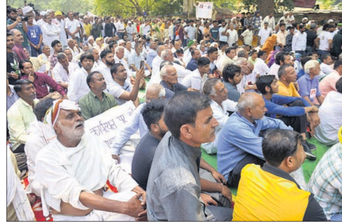
ନୂଆଦିଲ୍ଲୀର ଯତ୍ନମତ୍ତରେ ବିରୋଧରେ କୁହାଯାଏ ସମର୍ଥନ ପାଇଁ ଆସିଥିବା ୨୫୦ ଖାସ୍ ପଞ୍ଚାୟତ ଏବଂ କୃଷକ ସଙ୍ଘଠନ ପ୍ରତିନିଧି ।

ନୂଆଦିଲ୍ଲୀ, ୭/୫ ସୌନ୍ଦର୍ଯ୍ୟ ନିର୍ଦ୍ଧାରଣ ପାଇଁ ଭାରତୀୟ କ୍ଷୁଦ୍ର ମହାସଂଘ (ଡିଏସ୍ଏଫ୍) ଦ୍ୱାରା ତଥା ଭାରତୀୟ ଏମ୍ପ୍ଲି ଟ୍ରିକ୍ସ୍ ଶରଣା ଫାଣ୍ଡ ୧୦ ଦିନ ମଧ୍ୟରେ ଗିରଫ କରା ନଗେର ଦେଖାଯାଏ। ଆନ୍ଦୋଳନ କରାଯିବ। ନୂଆଦିଲ୍ଲୀର ଯତ୍ନମତ୍ତରେ ଧାରଣାରେ କୁହାଯାଏ ଓ ସେମାନଙ୍କ ସମର୍ଥନରେ ଆରୋଧି ଆସିଥିବା ଖାସ୍ ପଞ୍ଚାୟତ ସଦସ୍ୟମାନେ ରବିବାର କେନ୍ଦ୍ର ସରକାରକୁ ଏପରି ଚେତାବନୀ ଦେଇଛନ୍ତି। ହରିୟାଣା, ରାଜସ୍ଥାନ ଓ ପଶ୍ଚିମ ଭାରତପ୍ରଦେଶର ପ୍ରାୟ ୨୫୦ ଖାସ୍ ପଞ୍ଚାୟତ ଏବଂ କୃଷକ ସଙ୍ଘଠନ ପ୍ରତିନିଧି ବିରୋଧରେ କୁହାଯାଏ। ସହ ରବିବାର ସାମଲ ହୋଇଥିଲେ। ସେମାନେ ଟ୍ରିକ୍ସ୍ ଶରଣାଙ୍କ ବିରୋଧରେ କାର୍ଯ୍ୟାନୁଷ୍ଠାନ ନେବା ପାଇଁ କେନ୍ଦ୍ରକୁ ୧୦ ଦିନ ମହଲତ ଦେଇଛନ୍ତି। ୧୦ ଦିନ ମଧ୍ୟରେ କାର୍ଯ୍ୟାନୁଷ୍ଠାନ ନିଆ ନ