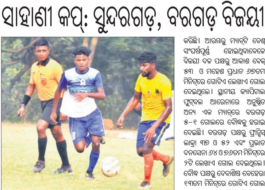
ସାହାଣୀ କପ୍ ଯୁବକଲର ରବିବାର ଅନୁଷ୍ଠିତ ଏକ ମ୍ୟାଚ୍।

ପ୍ଲେୟର ଅଫ୍ ଦି ମ୍ୟାଚ୍ ବିବେଚିତ ହୋଇଥିଲେ। ୫ ମ୍ୟାଚରୁ ଓଡ଼ିଶା ଏପ୍ରିଲ୍ ଏହା ଥିଲା ୪ର୍ଥ ବିଜୟ। ଫଳରେ ୧୨ ପଏଣ୍ଟ୍ ସହିତ ଏହି ଦଳ ଚେନ୍ନାଇର ଦ୍ୱିତୀୟ ସ୍ଥାନରେ ପହଞ୍ଚିଛି। ଅନ୍ୟ ଏକ ମ୍ୟାଚରେ ସେଣ୍ଟାଲ ରିଭର୍ ପୋଲିସ୍ ୫-୦ରେ ହରାଇ ସେଥି ମୁଦୁରାଲ ଚେନ୍ନାଇ ଶୀର୍ଷରେ ରହିଛି। ଏହି ଦଳକୁ ୧୫ ପଏଣ୍ଟ୍ ମିଳିଛି। ଅନ୍ୟ ମ୍ୟାଚରୁ ଓପେନ୍ ଲିଗ୍ରେ କିକ୍ସ୍ ଏପ୍ରିଲ୍ ୫-୦ରେ ସେଲ୍ଟିକ୍ କ୍ଲବ୍ ଏପ୍ରିଲ୍, ଇଣ୍ଡିଆନ୍ ଷୋର୍ଟ୍ ୪-୧ରେ ଚର୍ଚ୍ଚିକ୍ ବ୍ରଦର୍ସ ଏପ୍ରିଲ୍ ପରାସ୍ତ କରିଛି।