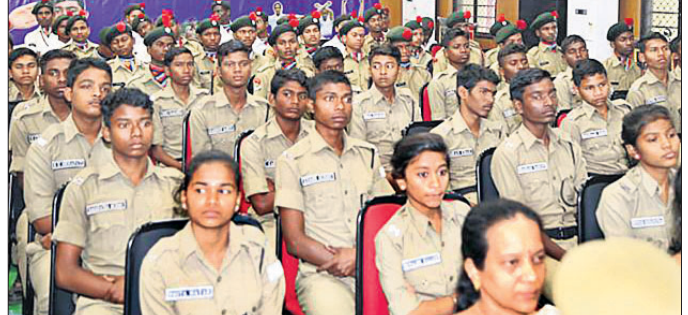
୨୦୧୯ ଜାନୁୟାରୀ ୨୪ରେ ଆରମ୍ଭ ହୋଇଥିବା ଷ୍ଟୁଡେଣ୍ଟ ପୋଲିସ କ୍ୟାଡେଟ୍ କାର୍ଯ୍ୟକ୍ରମରେ ଯୋଗଦେଇଥିବା ଛାତ୍ରାଛାତ୍ରୀ । (ଫାଇଲ ଫଟୋ)

■ ୨୦୧୯ରେ ରାଜ୍ୟର ୫୦ ସ୍କୁଲରେ ହୋଇଥିଲା କାର୍ଯ୍ୟକାରୀ ■ ଶୁଭାରମ୍ଭ ପରେ ଭୁବନେଶ୍ୱରୀ ରାଜ୍ୟ ପୋଲିସ