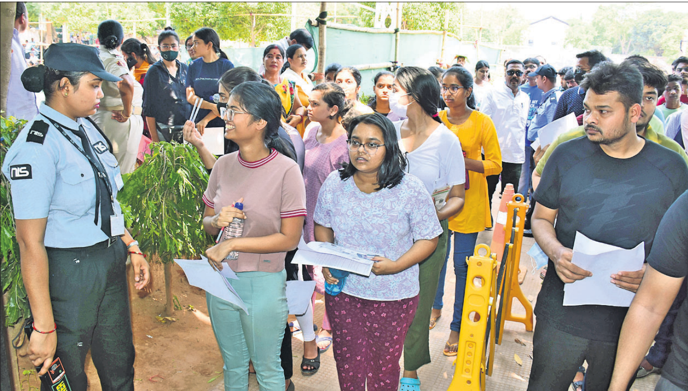
ମେଡିକାଲ କଲେଜରେ ନାମଲେଖା ପାଇଁ ରବିବାର ଅନୁଷ୍ଠିତ ସର୍ବଭାରତୀୟ ପ୍ରବେଶିକା ପରୀକ୍ଷା 'ନିର୍ବ' ଦେବାକୁ ଭୁବନେଶ୍ୱରସ୍ଥିତ ମଦର୍ସ ପବ୍ଲିକ୍ ସ୍କୁଲ୍ କେନ୍ଦ୍ରକୁ ଯାଉଥିବା ଛାତ୍ରାଛାତ୍ରୀଙ୍କୁ ଯାଞ୍ଚ କରି ଛଡ଼ାଯାଇଛି ।