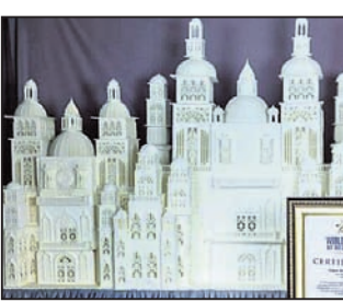
ଏପରି ଏକ ରାଜକାର୍ଯ୍ୟ ପ୍ୟାଲେସ୍ ପ୍ରସ୍ତୁତ କରି ଖାଲ୍ ରେକର୍ଡ କରିଛନ୍ତି। ଡିପୋର୍ଟ ମୁଦ୍ରାବଦ୍ଧ, ପୁଣ୍ୟେ ୩୭ ବର୍ଷୀୟା ପ୍ରାଣୀ ଏକ ବେଦ କେକ୍ ଆର୍ଟିଷ୍ଟ ଭାବେ ଏହି ପ୍ୟାଲେସ୍‌କୁ ପ୍ରସ୍ତୁତ କରିଛନ୍ତି। ଏହାର ଲମ୍ବ ୧୦ ଫୁଟ୍ ୧ ଲକ୍ଷ ହୋଇଥିବାବେଳେ ଉଚ୍ଚତା ୪ ଫୁଟ୍ ୭ ଲକ୍ଷ ଏବଂ ମୋଟେଲ ୩ ଫୁଟ୍ ୮ ଲକ୍ଷ। ଉକ୍ତ କେକ୍‌ର ଓଜନ ୨୦୦ କିଗ୍ରା। ଏହା ଦେଖିବାକୁ

ଅତ୍ୟନ୍ତ ସୁନ୍ଦର ଏବଂ ସ୍ୱାସ୍ଥ୍ୟ। ବଡ଼ ନିରାମିଷ କେକ୍‌ରେ ପ୍ୟାଲେସ୍ ପ୍ରସ୍ତୁତ କରିଥିବା ନେଇ ପ୍ରାଣୀଙ୍କ ଏହା ୩୫ ଖାଲ୍ ରେକର୍ଡ। ଏଥିରେ ସେ ଅନେକ ଭାରତୀୟ ଗ୍ଲାମରେ ତାଙ୍କର ଦେଖିଛନ୍ତି କି? ନିକଟରେ ଜଣେ କେକ୍ ଆର୍ଟିଷ୍ଟ ରହିଛି ସମ୍ପୂର୍ଣ୍ଣ ଧନୀ। ସେ ଏହାକୁ ଭାରତର ବିଭିନ୍ନ ଗ୍ଲାମରେ ଥିବା ବିଭିନ୍ନ କାର୍ଡିନାଲ୍‌ସ୍ ଅନୁପ୍ରାଣିତ ହୋଇ ଏହି କେକ୍ ପ୍ୟାଲେସ୍ ପ୍ରସ୍ତୁତ କରିଥିବା କହିଛନ୍ତି। ତାଙ୍କୁ ଏହି କେକ୍ ପ୍ୟାଲେସ୍ ପାଇଁ ୩ ସପ୍ତାହ ସମୟ ଲାଗିଥିଲା। କିନ୍ତୁ ଏହା କୌଣସି ପ୍ୟାଲେସ୍ ଅବିକଳ ରୁହେଁ। ସେ ୨୦୨୨ରେ କରିଥିବା ନିଜ ରେକର୍ଡକୁ ବର୍ତ୍ତମାନ ଭାଙ୍ଗିଛନ୍ତି। ସେତେବେଳେ ସେ ୧୦୦ କିଗ୍ରାର ଏକ କେକ୍ ପ୍ୟାଲେସ୍ ପ୍ରସ୍ତୁତ କରିଥିଲେ। ପ୍ରାୟ ସବୁବେଳେ ତାଙ୍କ କେକ୍ ସାହାଯ୍ୟରେ କିଛି ନୂଆ କରିବାକୁ ପ୍ରୟାସ କରିଥାନ୍ତି। ପ୍ରଥମ ପ୍ରୟାସରେ ସେ ୩ ଲକ୍ଷ ଲମ୍ବର ଏକ ପ୍ୟାଲେସ୍ ପ୍ରସ୍ତୁତ କରିଥିଲେ।