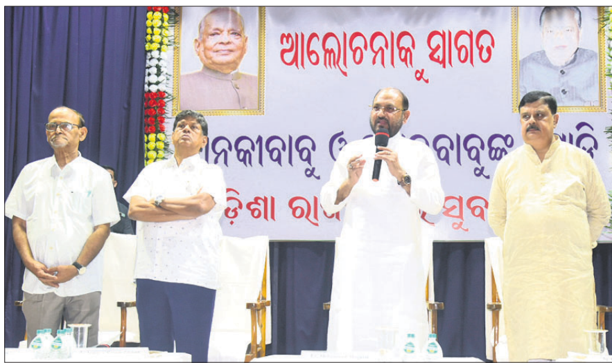
ସୁଚନାଭବନାରେ ଯୋଗଦାନ ଆୟୋଜିତ 'ଜାନକୀ ବାବୁ ଓ ବସନ୍ତବାବୁ ଯୋଡ଼ି- ଓଡ଼ିଶା ରାଜନୀତିର ସୁବର୍ଣ୍ଣ ଯୁଗ' ଆଲୋଚନାଚକ୍ରରେ ଯୋଗଦେଇଥିବା ଅତିଥିମାନେ।