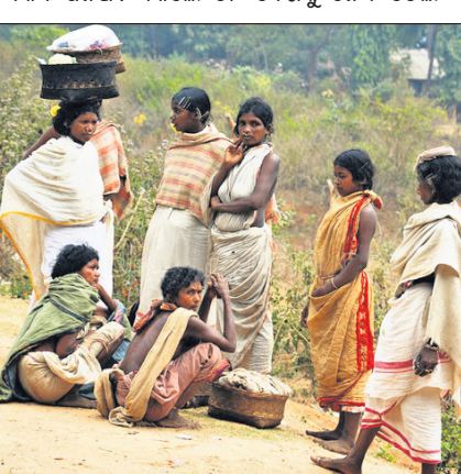
ଲୁଣ ଶୁଖୁଆ । ଆଉ ମଦ ପିଇବା । ସେଥିପାଇଁ ଉଦାର ହୃଦୟରେ ଦେଇଦିଏ ଡାକ୍ ଜିନିଷ କମ ମୂଲ୍ୟରେ । ବଦଳିଛି ତଳ ଦେଶ । ବଦଳିଛି ତଳ ଦେଶର ଲୋକ । ଆଗ ପରି ଗାଁରେ ଆତିଥେୟତା ନାହିଁ । ଦିନ ଥିଲା ଗାଁକୁ ଯିବ ଆସୁଥିଲା । ସେ ଗାଁର ଅତିଥି । ପରିଚୟ ଓ ସମ୍ପର୍କ ନ ଥିଲେ ବି ସମସ୍ୟା ନାହିଁ । ଖାଇବା ବେଳରେ ପହଞ୍ଚିଲେ ଅତିଥି ଖାଲି ପେଟରେ ଫେରିବି କେବେ । ମଠ ମନ୍ଦିରରେ ଅଭାଗତ ଖାଣା ହୋଇଥିବା ବାହାର ଆଗକୁକଙ୍କ ପାଇଁ କିଛି ନ ହେଲେ ବି ଗାଁ ଭାଗବତ ଚୁଲିରେ ରହିବା ଓ ଖାଇବା ଲାଗି ବ୍ୟବସ୍ଥା ହେବ ତୁରନ୍ତ । ଜଣକର ସମ୍ପର୍କର ଗାଁର ସମସ୍ତଙ୍କର ସମ୍ପର୍କର । ଦେଖୁ ଦେଖୁ ଖୋଲିଯାଏ ଆହ୍ଲାୟତାର ପସରା । କୁଣ୍ଡଳ ଜିଣାଯାଏ । ଏବେ ଗାଁର ପରିବେଶ ଉନ୍ନତ । ସହର ସହର ବାସୁଛି ଗାଁ । ଘର-ଘର ଭିତରେ ଅପଡ଼ା ସାହି-ସାହି ଭିତରେ ସଂଘର୍ଷ । ସବୁଠି ରାଜନୀତି ।

ପାରମ୍ପରିକ ବାଜା ବାଜୁଥିଲା । ଭାମ୍ପ, ମହୁଡ଼ା ଓ ଗୁମ୍ଫାର ନାଦରେ ଗଗନ ପବନ କମ୍ପି ଉଠୁଥିଲା । ଗୁମ୍ଫାଲ ସବୁ ଧଳାଗୁଆ ପିନ୍ଧି ମନ୍ତ୍ର ପଢୁଥିଲେ । ଅଲିଖିତ ଧାରାରେ ନାଚୁଥିଲେ ସେମାନେ । ବାକି ଗାଁ ଲୋକ ପାରମ୍ପରିକ ଅସ୍ତ୍ରଶସ୍ତ୍ର ଧରି ନିଜ ଇଚ୍ଛାରେ ନାଚୁଥିଲେ । ଗାଁରେ ଏକପ୍ରକାର ଉତ୍ସବର ପରିବେଶ । ସମସ୍ତେ ଉତ୍ସାହ ଓ ଅତିଶୟ ଉତ୍ସାହିତ । ପୁରୁଷ ଦେବତା ସଦରଘର କାନ୍ଧରେ କୁମ୍ଭାକା ଡିଆଁ ସବୁ ପାରମ୍ପରିକ ତଳଦିଆ । ତାକୁ କାନ୍ଦୁଥିଲେ । ସକଳଥିଲେ ଦେବତାଙ୍କ ଘର । କୁଟରଭାଲି ଦେବୀ ନିକଟରେ ଗୁମ୍ଫାଲଙ୍କ ଗହଳି । ମନ୍ତ୍ର ସହ ବଳିପଢ଼ିବା ପସ୍ତୁପକ୍ଷୀ । ଏମିତି ଏକ ଅତୁଳ ପରିବେଶ ତଳଦିଆ ଗାଁରେ । ଚାଲିଛି ମେଗିଆ ପରବ । ହଠାତ୍ ଏକ ଦଉଡ଼ିଆ ଖଟ ଆସିଲା । ବୟସ୍କ ତଳଦିଆ ଜଣକ ଆସି କହିଲେ- ମାହାପୁ ! ଖଟରେ ବସ ! ସ୍ୱାଭାବିକ ଭାବେ ବସିଗଲା । ଭାବିଲି ବିସିବାକୁ ଏମିତି ସକଳାକ । ପାଖରେ ଥିବା କିଛି ତଳଦିଆ ଯୁବକ ଦଉଡ଼ିଆ ଖଟକୁ ଧରିଲେ । ଖୁରାଦୁଡ଼ିକୁ ଭିଡ଼ି ଧରି ଶୂନ୍ୟକୁ ଚେକିଲେ । କିଛି ପଚାରିବା ଆଗରୁ ଝୁଲେଇ ଝୁଲେଇ ଗାଁ ଦେବତା ସଦର ଘର ଚାରିପଟେ ବୁଲେଇବାକୁ ଲାଗିଲେ । ଆଗରେ ଆଉ କିଛି ଯୁବକ କିଲି ମାରି ଗୁମ୍ଫୁଥିଲେ । ଉପରେ ବସି ଗାଁକୁ ଦେଖିଲି । ଖଟ ସହ ବୁଲୁଥିଲା ଗାଁ, ଘର, ତଳଗର, ଝୁଲା ଝରଣା । ତିନିଥର ବୁଲେଇଲା ପରେ ତଳେ ଆଇଲେଲେ । କିଛି ଦି ଚାଣିପାଉ ନ ଥିଲା । ପୂଣି ସେଇ ବୟସ୍କ ତଳଦିଆ ଆସି କହିଲେ- ତରିଗଲୁ କି ମାହାପୁ ! ଭମିତି କା ଆମ ଦେଶରେ ଚାଲିଛି । ତୁର ତଳ ଦେଶର ଲୁକ । ଆମର କୁଟିଆ । ତୋତେ ସମ୍ମାନ ନ ଦେଲେ ଆମ ଗାଁକୁ ନିଆ । ଆଉ ଜଣେ କୁଟିଆକୁ ଏମିତି ସମ୍ମାନ ଦେବାକୁ ଚାଲିଗଲେ । ଗାଁପରେ ଚକିତ ହୋଇଗଲି । ତଳଦିଆଙ୍କ ହିସାବ ଅଲଗା । ନିୟମିତ ପାହାଡ଼ ତଳେ ରହୁଥିବା ଅଞ୍ଚଳ ତଳ ଦେଶ । ପାହାଡ଼ ଉପରେ ଡାକ୍ ରାଜକା ସେଠି ଯିବ ରହନ୍ତି ଡାକ୍ ନିଜର ଲୋକ ବୋଲି ଭାବନ୍ତି । ବାକି ସମସ୍ତେ ତଳ ଦେଶର ଲୋକ । ସେମାନଙ୍କ ପାଇଁ ଅତିଥି ନିୟମିତର ଉପଦିତ ଫସଲକୁ ତଳ ଦେଶର ଲୋକଙ୍କ ନଜର । ଖାଲି ଫସଲ ନୁହେଁ, ତଳଦିଆଙ୍କ ପ୍ରତି ଭିନ୍ନ ଦୃଷ୍ଟିଭଙ୍ଗା । ଅଖିଷିତ ଓ ଆଦିମର ଆଖ୍ୟା