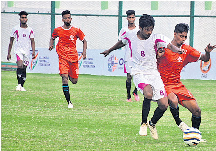
କଟକ ଓ କନ୍ୟାମାଳ ମଧ୍ୟରେ ଅନୁଷ୍ଠିତ ମ୍ୟାଚ।

ସେବାସ୍ଥିଆନ ଭେଟେଲଙ୍କ ସମକକ୍ଷ ହୋଇପାରିଛନ୍ତି। ଆସୁନ ମାର୍ଟିନ ପାଇଁ ଚଳିତ ସିଜନରେ ଫର୍ନାଣ୍ଡୋ ଆଲୋସୋଙ୍କ ପ୍ରଦର୍ଶନ ଖୁବ୍ ଭଲ ରହିଛି। ୫ଟି ରେସ୍‌ରେ ଏହା ଥିଲା ତାଙ୍କୁ ଚତୁର୍ଥ ପୋଡିୟମ ଫିନିଶ୍। ମସିହାରେ ଜର୍ଜ ରସେଲ୍ ଚତୁର୍ଥ ସ୍ଥାନ ଅଧିକାର କରିଥିଲେ। ରେସ୍‌ରେ ଯଥାକ୍ରମେ ପଞ୍ଚମରୁ ସପ୍ତମ ସ୍ଥାନ ଅଧିକାର କରିଥିବା ଡ୍ରାଇଭରମାନେ ହେଲେ କାର୍ଲୋସ୍ ସେଜା କୁନିୟର (ଫୋରାରି), ଲୁଇସ୍ ହାମିଲଟନ (ମସିଜିକ୍), ଚାର୍ଲ୍ସ ଲେକ୍ଲେର୍ (ଫୋରାରି), ପିଏରେ ଗାସ୍କି (ଅଲ୍‌ପାଇନ୍), ଏଷ୍ଟିବାନ ଓଜନ (ଅଲ୍‌ପାଇନ୍) ଓ କେଭିନ ମାଗ୍ନୁସେନ୍। ସୁତନାଯୋଗ୍ୟ, ଏଠାରେ ବିଜୟ ଦ୍ୱାରା ଭର୍ଷ୍ଟାପେନ୍ ସ୍ପ୍ରିଣ୍ଟ୍‌ରେ ପେରେଜଙ୍କ ମଧ୍ୟରେ ବ୍ୟବଧାନ ବର୍ତ୍ତମାନ ୧୪ ପଏଣ୍ଟ ରହିଛି। ପେରେଜ ଏଠାରେ ମାତ୍ର ୫.୩ ସେକେଣ୍ଡ ବ୍ୟବଧାନରେ ବୃତ୍ତୀୟ ସ୍ଥାନରେ ରହିଥିଲେ।