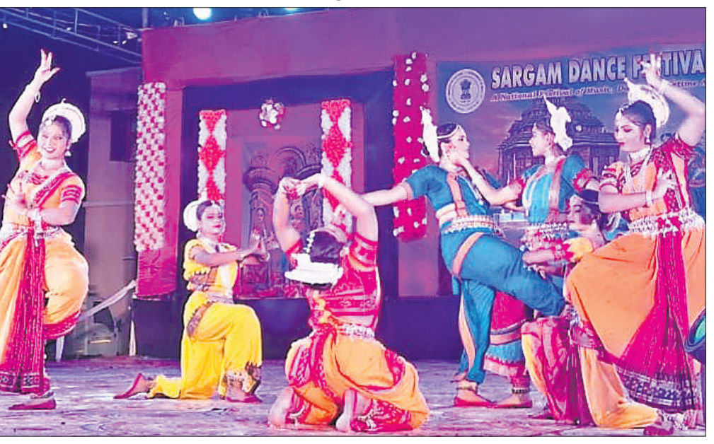
ଅନୁଷ୍ଠାନର କଳାକାରଙ୍କ ଦ୍ୱାରା ପରିବେଷିତ ନୃତ୍ୟ।

ମନୋଭାବ ପରିତ୍ୟାଗ କରିବାକୁ ପଡ଼ିବ। ତ୍ୟାଗ ଏବଂ ସମର୍ପଣ ଭାବନା ରଖିଲେ ଏହା ସମ୍ଭବପଦ ହୋଇପାରିବ। ଶିକ୍ଷା ସହ ନୃତ୍ୟସଙ୍ଗୀତ ପ୍ରତି ଆଗ୍ରହ ରଖିଲେ