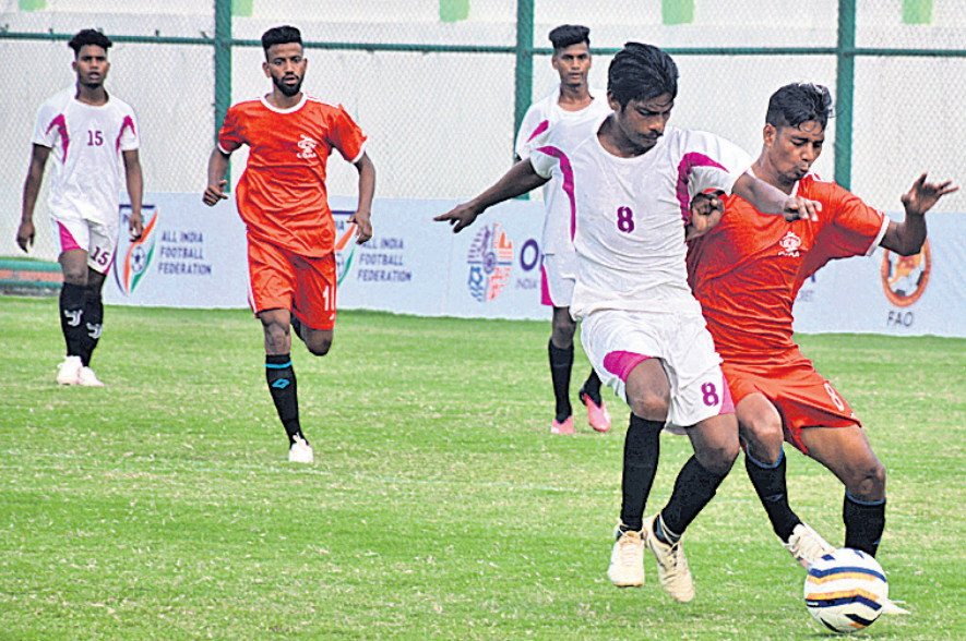
କଟକ ଓ କନ୍ୟାମାଳ ମଧ୍ୟରେ ଅନୁଷ୍ଠିତ ମ୍ୟାଚ।

ସେବାସ୍ଥିତ ଭେଟେଲ୍‌ଙ୍କ ସମକକ୍ଷ ହୋଇପାରିଛନ୍ତି। ଆସୁନ ମାର୍ଟିନ ପାଇଁ ଚଳିତ ସିଜନରେ ଫର୍ମାଣ୍ଡୋ ଆଲୋସୋଙ୍କ ପ୍ରଦର୍ଶନ ଖୁବ୍ ଭଲ ରହିଛି। ୫ଟି ରେସ୍‌ରେ ଏହା ଥିଲା ତାଙ୍କୁ ଚତୁର୍ଥ ପୋଜିସନ୍ ଦିଅନ୍ତା। ମସିହାରେ ଜିତି ରଖିବାକୁ ଚତୁର୍ଥ ସ୍ଥାନ ଅଧିକାର କରିଥିଲେ। ରେସ୍‌ରେ ଯଥାକ୍ରମେ ପଞ୍ଚମରୁ ଦଶମ ସ୍ଥାନ ଅଧିକାର କରିଥିବା ଡ୍ରାଇଭିଙ୍ଗ୍‌ମାନେ ହେଲେ କାର୍ଲୋସ୍ ସେଜା କୁନିୟର (ଫୋରାରି), ଲୁଇସ୍ ହାମିଲଟନ (ମସିହା), ଚାର୍ଲ୍ସ ଲେକ୍‌ଟେର (ଫୋରାରି), ପିଏସ୍‌ରେ ଗାସ୍କି (ଅଲ୍‌ପାଇନ୍), ଏସ୍ଟିବାନ ଓଜନ (ଅଲ୍‌ପାଇନ୍) ଓ କେଭିନ ମାଗୁଏର୍ଡ୍। ସୁତନାଯୋଗ୍ୟ, ଏଠାରେ ବିଜୟ ଦ୍ୱାରା ଭର୍ଷ୍ଟାପେନ୍ ଷ୍ଟାଣ୍ଡିଂରେ ପେରେକ୍ ମଧ୍ୟରେ ବ୍ୟବଧାନ ବର୍ତ୍ତମାନ ୧୪ ପଏଣ୍ଟ ରହିଛି। ପେରେକ୍ ଏଠାରେ ମାତ୍ର ୫.୩ ସେକେଣ୍ଡ ବ୍ୟବଧାନରେ ବୃତ୍ତୀୟ ସ୍ଥାନରେ ରହିଥିଲେ।