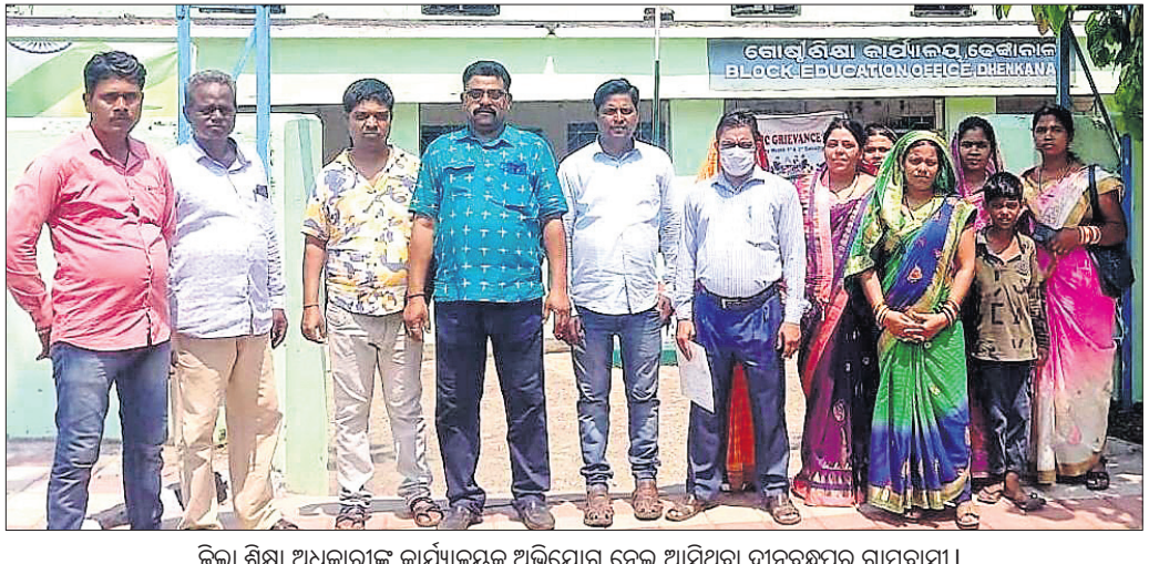
ଜିଲା ଶିକ୍ଷା ଅଧିକାରୀଙ୍କ କାର୍ଯ୍ୟାଳୟରେ ଅଭିଯୋଗ ନେଇ ଆସିଥିବା ଦୀନବନ୍ଧୁପୁର ଗ୍ରାମବାସୀ।