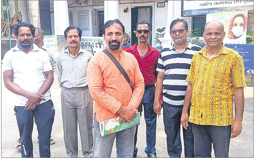
ଜିଲାପାଳଙ୍କ ଦ୍ୱାରା ହୋଇଥିବା ଗ୍ରାମବାସୀ।