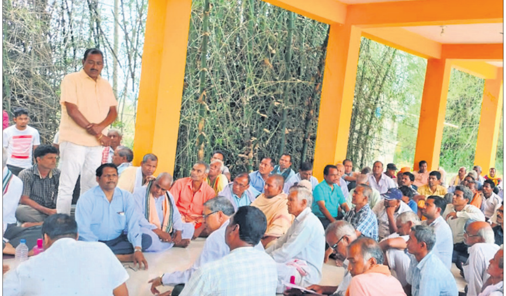
ବୈଠକରେ ଉପସ୍ଥିତ ଗ୍ରାମ ସଭାପତି ଓ ସମ୍ପାଦକମାନେ।