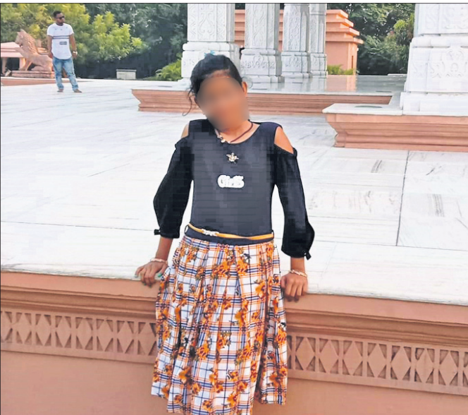
ହତ୍ୟାର ଶିକାର ହୋଇଥିବା ନାବାଳିକା।