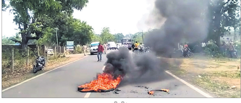
ଅନୁଗୋଳରେ ଘଟଣା ସ୍ଥଳରେ ଘାଟଣା ଲୋକମାନେ ରାସ୍ତାରୋକ୍ କରିଛନ୍ତି।