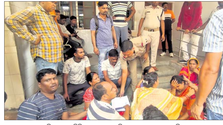
ଜିଲା ମୁଖ୍ୟ ବିକ୍ରମକନ୍ଦର ପୋଲିସ୍ ଘଟଣାର ତଦନ୍ତ କରୁଛି।