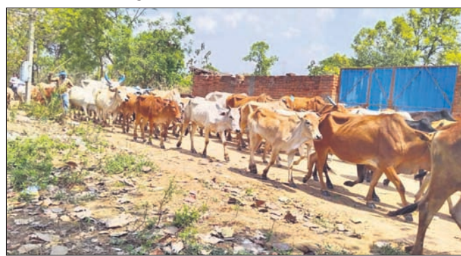
ଚାଲାଣ ହେଉଥିବା ଗୋରୁପାଲି।

ବରଗଡ଼ ଜିଲ୍ଲା ପଦ୍ମପୁର ଉପଖଣ୍ଡ ଝାରବନ୍ଧ, ପାଇକମାଳ ଓ ଜଗଦଲପୁର ଥାନା ଅଞ୍ଚଳରୁ ବଳାଙ୍ଗୀର ଓ କଳାହାଣ୍ଡି ଜିଲ୍ଲା ସୀମା ଦେଇ ବେଆଇନ ଗୋରୁଚାଲାଣ କରାଯାଇଛି।