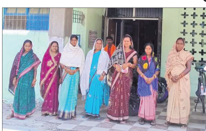
ଖୁବ୍‌କେନପାଲିର ସର୍ବସମ୍ମତ ମହିଳାମାନେ ଅବକାରୀ ଅଧିକାରୀଙ୍କୁ ଦାବି କରିଛନ୍ତି। ପାଇଁ ଖେଳ ପଡ଼ିଆ ରହିଛି। ଉକ୍ତ ପ୍ରତିଯୋଗିତା ସାଙ୍ଗକୁ ଖୁଲ୍‌ମାନଙ୍କର ବାର୍ଷିକ ଖେଳ ପ୍ରତିଯୋଗିତା ହୋଇଥିଲା।

ବଲାଙ୍ଗୀର ସଦର କ୍ଷେତ୍ର ଅଧିକାରୀଙ୍କୁ ଖୁବ୍‌କେନପାଲି ଗ୍ରାମ ପଞ୍ଚାୟତ ଅଞ୍ଚଳରେ କୌଣସି ମଦଭାଟି ନ ଖୋଲିବା ପାଇଁ ଗାଁର ସର୍ବସମ୍ମତ ମହିଳାମାନେ ଦାବି କରିଛନ୍ତି। ଖୁବ୍‌କେନପାଲି ଗ୍ରାମ ପଞ୍ଚାୟତ ଅଧିକାରୀଙ୍କୁ ଏକ ଦେଶୀ ମଦ ଦୋକାନ ଖୋଲିବା ପାଇଁ ବଲାଙ୍ଗୀର ଜିଲ୍ଲାପାଳଙ୍କ (ଅବକାରୀ ବିଭାଗ) ପତ୍ରରେ ସର୍ବସାଧାରଣ ଅଭିଯୋଗ ନିମନ୍ତେ ବିକ୍ଷିପ୍ତ ପ୍ରକାଶ ପାଇଥିଲା। ସେଠାରେ ମଦ ଦୋକାନ ବା ଭାଟି ଖୋଲିଲେ ଲୋକେ ବିଶେଷକରି ମହିଳାମାନେ ଅନେକ ଅସୁବିଧା ସମ୍ମୁଖୀନ ହେବେ। ସେହି ସ୍ଥାନରେ ଖୁଲ୍ ଛାତ୍ରଛାତ୍ରୀଙ୍କୁ