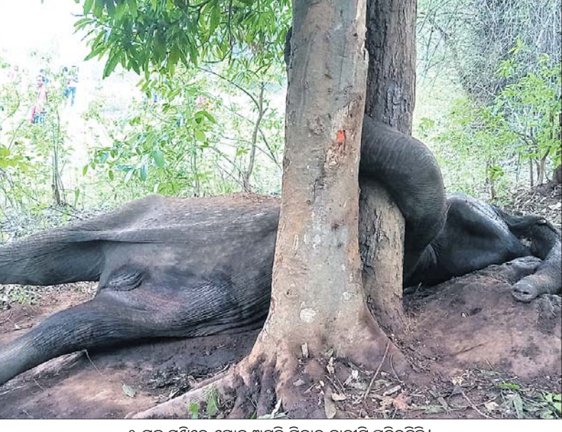
୨ ଗଛ ମଝିରେ ଗୋଡ଼ ଅଟକି ଯିବାକୁ ହାତୀଟି ପଡ଼ିରହିଛି।