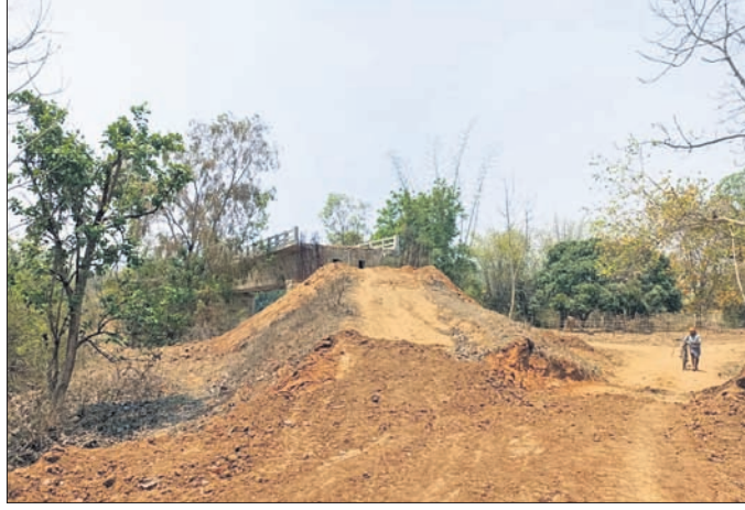
ସୁନ୍ଦରୀ ନଦୀ ଉପରେ ନିର୍ମାଣ ହୋଇଥିବା ବିଜୁ ସେତୁ।