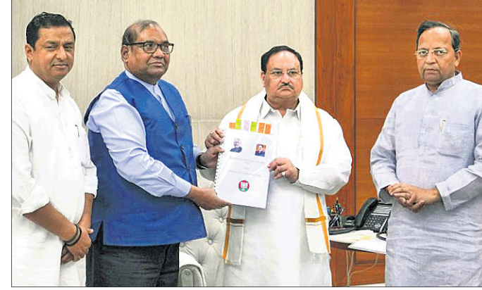
ଭାଜପା କେନ୍ଦ୍ରୀୟ ଫ୍ୟାକ୍ ଫାଇଲ୍ ଚିମ୍ ସମ୍ବଲପୁର ହିଂସା ଘଟଣାର ରିପୋର୍ଟ ଦୂଆଦିଲ୍ଲୀଠାରେ ମଙ୍ଗଳବାର ରାଷ୍ଟ୍ରୀୟ ଅଧକ୍ଷ ଜେ.ପି.ନନ୍ଦାଙ୍କୁ ପ୍ରଦାନ କରାଯାଇଛି।