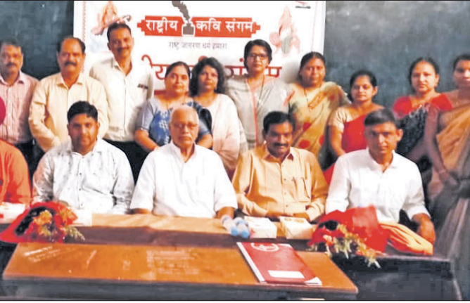
ବୈଠକରେ ଉପସ୍ଥିତ ଅତିଥି ଓ କବିଗଣ।

ନିଖିଳ ଓଡ଼ିଶା ବିଦ୍ୟୁତ୍ ମଜଦୁର ମହାସଂଘ ପକ୍ଷରୁ ଦିଆଯାଇଥିବା ଏକ ପ୍ରେସ ବିବୃତି ଅନୁସାରେ, ଓପିଟିସିଏଲ ଅଧୀନରେ କାର୍ଯ୍ୟରତ କର୍ମଚାରୀମାନେ ବନ୍ଧା, ବାତ୍ୟା, ପ୍ରଚଣ୍ଡ ରୋଦ୍ରପାତ ତଥା ମହାମାରୀ କରୋନା ସମୟରେ ଜନସାଧାରଣଙ୍କୁ ନିରବଚ୍ଛିନ୍ନ ବିଦ୍ୟୁତ୍ ଯୋଗାଣ ପାଇଁ କାର୍ଯ୍ୟ କରିଆସୁଛନ୍ତି।