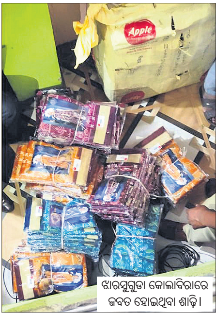
ଝାରସୁଗୁଡ଼ା କୋଲିବିରାରେ ଜବତ ହୋଇଥିବା ଶାଢ଼ି