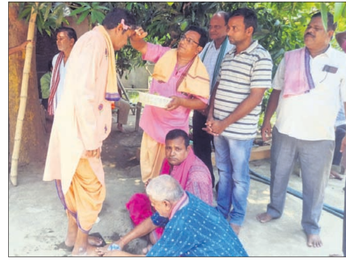
ଅତିଥିମାନଙ୍କ ପାଦସୌଧ କରାଯାଇଛି।

ଯୋଗଦାନ କରିଥିଲେ। ବ୍ରାହ୍ମଣ ସମାଜକୁ ତୁଣ୍ଡପୁର ସ୍ତରରୁ ସୁଦୃଢ଼ କରିବାକୁ ନିଷ୍ପତ୍ତି ନିଆଯାଇଥିଲା।