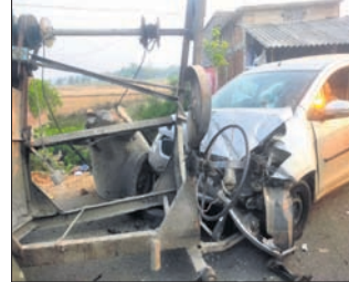
ଦୁର୍ଘଟଣାଗ୍ରସ୍ତ କାର୍ ।

ବୌଦ୍ଧ ଜିଲ୍ଲା ଦେଇ ଯାଇଥିବା ୫୭ ନଂ ଜାତୀୟ ରାଜପଥ ର ଜହ୍ନାପଦ ଡାକ୍ତରଖାନା ନିକଟରେ ମଙ୍ଗଳବାର ସକାଳ ପ୍ରାୟ ୬ଟା ସମୟରେ ଏକ ମିଶ୍ଟ୍ରି ମେଣିନକୁ ଧକ୍କା ଦେଇ କାର ଦୁର୍ଘଟଣାଗ୍ରସ୍ତ ହୋଇଛି।