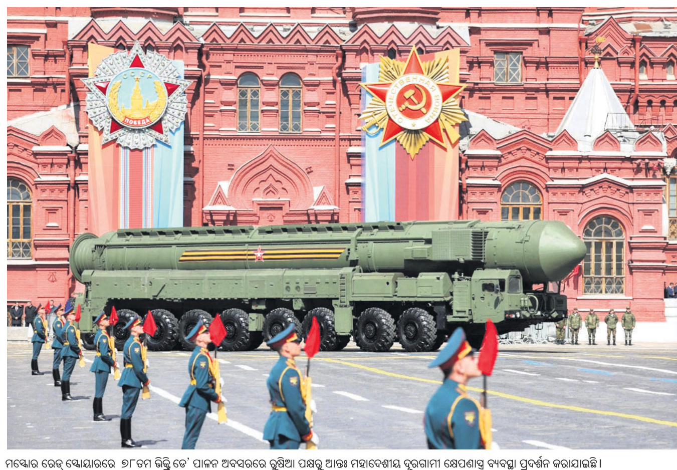
ମସ୍କୋର ରେଡ୍ ସ୍କୋୟାରରେ ୨୮ତମ ଭିକ୍ଟି ଡେ' ପାଇନ ଅବସରରେ ରୁଷିଆ ପକ୍ଷରୁ ଆକାଶ ମହାଦେଶୀୟ ଦୂରଗାମୀ କ୍ଷେପଣାସ୍ତ୍ର ବ୍ୟବସ୍ଥା ପ୍ରଦର୍ଶନ କରାଯାଇଛି।

ଲକ୍ଷ୍ନୌ/ନୂଆଦିଲ୍ଲୀ, ୯୫: ପଶ୍ଚିମବଙ୍ଗ ସରକାର ବିବାଦୀୟ ଫିଲ୍ 'ଦି କେରଲା ଷ୍ଟୋରି' କୁ ବ୍ୟାନ୍ କରିବା ପରେ ମଙ୍ଗଳବାର ଉତ୍ତର ପ୍ରଦେଶରେ ଫିଲ୍ମକୁ ଟିକସମୁକ୍ତ ଘୋଷଣା କରାଯାଇଛି। ପଶ୍ଚିମବଙ୍ଗରେ ଫିଲ୍ମ ପ୍ରସାରଣକୁ ରୋକିବା ପାଇଁ ମୁଖ୍ୟମନ୍ତ୍ରୀ ମମତା ବାନାର୍ଜୀଙ୍କ ନିର୍ଦ୍ଦେଶକୁ ବିରୋଧକରି ଚଳଚ୍ଚିତ୍ର ନିର୍ମାତା ସର୍ବୋଚ୍ଚ ଅଦାଲତଙ୍କ ଫ୍ରାନ୍ସରୁ ହୋଇଛନ୍ତି। ଦକ୍ଷିଣ ଭାରତରେ ଫିଲ୍ମର ସ୍କିନ୍ ନେଇ ସୁରକ୍ଷା ଯୋଗାଇଦେବାକୁ ସେ ଦାବି କରିଛନ୍ତି।