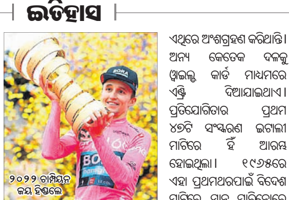
୨୦୨୨ ଚାମ୍ପିୟନ ଜୟ ହିଞ୍ଜଲେ

ଗିରୋ ଡି' ଇଟାଲିଆ ସାଧାରଣତଃ ଚୁର ଡି' ଇଟାଲିଆ ଭାବେ ପରିଚିତ। କେବଳ 'ଗିରୋ' ନାମରେ ମଧ୍ୟ ଏହା ବେଶ୍ ଜଣାଶୁଣା।