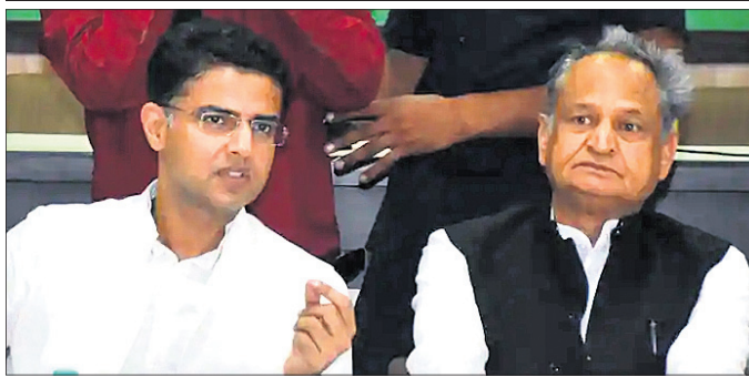
ସଚିନ ପାଇଲଟ୍ ଓ ପୁଞ୍ଜ୍ୟମନ୍ତ୍ରୀ ଅଶୋକ ଗେହଲଟ୍

ରାଜସ୍ଥାନ ପୁଞ୍ଜ୍ୟମନ୍ତ୍ରୀ ଅଶୋକ ଗେହଲଟଙ୍କ ଅଭିଯୋଗର କଡ଼ା ଜବାବ ଦେଇଛନ୍ତି ପୂର୍ବତନ ଉପପୁଞ୍ଜ୍ୟମନ୍ତ୍ରୀ ସଚିନ ପାଇଲଟ୍। ନିକଟରେ ତୋଲପୁରରେ ପୁଞ୍ଜ୍ୟମନ୍ତ୍ରୀ ଗେହଲଟ୍ ଦେଇଥିବା ଭାଷଣକୁ ଲାଗୁଛି ଯେ ତାଙ୍କ ନେତା ସୋନିଆ ଗାନ୍ଧୀ ନୁହଁନ୍ତି ବରଂ ବସୁନ୍ଦରା ରାଜେ। ଗୋଟିଏ ପଟେ ଭାଜପା ଆମ ସରକାରକୁ ଭାଙ୍ଗିବାକୁ ଉଦ୍ୟମ କରୁଥିବା କୁହାଯାଉଥିବା ବେଳେ ଅନ୍ୟପଟେ ସରକାରକୁ ବସୁନ୍ଦରା ରାଜେ ବଞ୍ଚାଇଥିଲେ ବୋଲି କୁହାଯାଇଛି। ଗେହଲଟ୍ କ'ଣ କହିବାକୁ ଚାହାନ୍ତି ସ୍ପଷ୍ଟ କରିବା ଉଚିତ। ନିଜର ବିଧାୟକତ୍ୱ ବିକ୍ରୟ କରିଥିବା ଅଭିଯୋଗ ସେମାନଙ୍କ ପ୍ରତି ଅପମାନ। ଗେହଲଟ୍ ଯେଉଁମାନଙ୍କ ପାଇଁ ପୁଞ୍ଜ୍ୟମନ୍ତ୍ରୀ ହୋଇଛନ୍ତି, ସେହିମାନଙ୍କୁ ବଦନାମ କରୁଛନ୍ତି ବୋଲି ପାଇଲଟ୍ କହିଛନ୍ତି। ସୂଚନାଯୋଗ୍ୟ, ବୁଲେଟିନ ପୂର୍ବେ