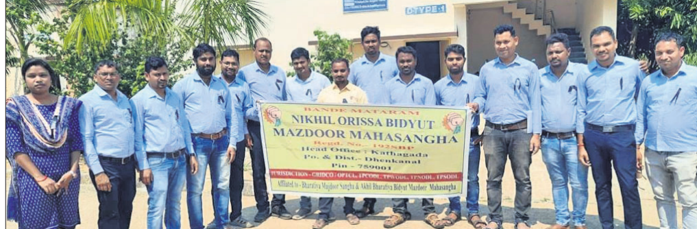
ବରଗଡ଼ରେ ବିଦ୍ୟୁତ୍ କର୍ମଚାରୀମାନେ କଳାବନ୍ଧା ପିନ୍ଧି ପ୍ରତିବାଦ କରୁଛନ୍ତି।

ଓଡ଼ିଶା ଶକ୍ତି ସଂରକ୍ଷଣ ନିଗମ ଲିଡ଼ (ଓପିଟିସିଏଲ) ଅଧୀନରେ କାର୍ଯ୍ୟରତ ବିଦ୍ୟୁତ୍ କର୍ମଚାରୀଙ୍କ ସମସ୍ୟାକୁ ଆଗେଇ ଆଣାଯାଇଛି।