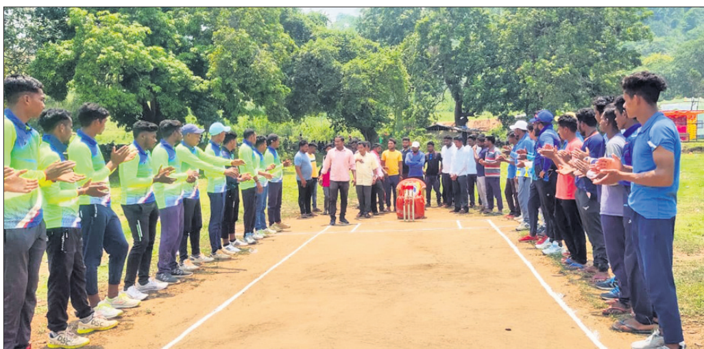
ଉଦ୍ୟୋଗନୀ ମ୍ୟାଚରେ ଅତିଥିଙ୍କ ସହ ଖେଳାଳିମାନେ।