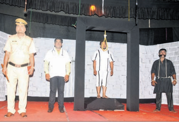
ନାଟକ ସେହି ଚାରିଦିନର ଏକ ଦୃଶ୍ୟ ।