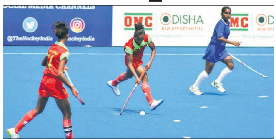
ବିଦ୍ୟାଳୟ ଷ୍ଟାଡିୟମରେ ରୁଧିରା ଅନୁଷ୍ଠିତ ଏକ ମ୍ୟାଚ୍।

ରାଉରକେଲା ଅଫିସ୍, ୧୦।୫ ରାଉରକେଲା ବିଦ୍ୟାଳୟ ଅନ୍ତର୍ଗତୀୟ ହକି ଷ୍ଟାଡିୟମରେ ଚାଲିଥିବା ୧୩ତମ ଜାତୀୟ ସର୍ବ କୁନିୟର ମହିଳା ହକି ଚାମ୍ପିୟନସିପ୍ରେ ସପ୍ତମ ଦିନରେ ରୁଧିରା ହରିୟାଣା, ଝାଡ଼ଖଣ୍ଡ, ଉତ୍ତରପ୍ରଦେଶ ବିଜୟୀ ହୋଇଛି।