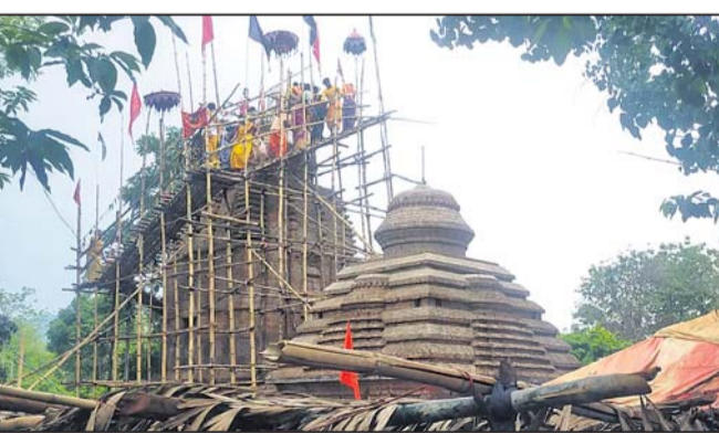
ପେନାଲା ମା' ରୁଦ୍ରକାଳିଙ୍କ ମନ୍ଦିରରେ ରତ୍ନମୁଦ ସ୍ଥାପନ କରାଯାଇଛି।