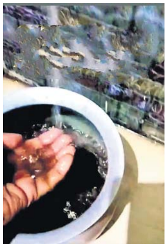
ପାଇପଲୁ ବାହାରୁଥିବା ଗୋଳିଆ ପାଣି ।

ଗଞ୍ଜାମ ଜିଲାର ୧୨ଟି ଖାର୍ତ୍ତ ନେଇ ଗଠିତ ଚିକିତ୍ସା ବିଭାଗ ଅଧୀନ ୬, ୭, ୮ ଓ ୯ ନମ୍ବର ଖାର୍ତ୍ତରେ ଜନସ୍ୱାସ୍ଥ୍ୟ ବିଭାଗ ଅଧୀନରେ ଥିବା ପାଇପଲୁ ଗୋଳିଆ ପାଣି ବାହାରୁଥିବା ଅଭିଯୋଗ ହେଉଛି।