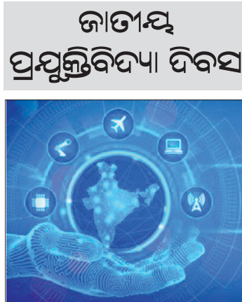
ଜାତୀୟ ପ୍ରଯୁକ୍ତିବିଦ୍ୟା ଦିବସ

ଭାରତରେ ୧୧ ମେ'ରେ ପାକନ କରାଯାଉଥିବା 'ଜାତୀୟ ପ୍ରଯୁକ୍ତିବିଦ୍ୟା ଦିବସ' ଆମ ଦେଶରେ ବୈଷୟିକ ଜ୍ଞାନକୋଶଳ, ଅନୁସନ୍ଧାନକାରୀ ଏବଂ ଇଞ୍ଜିନିୟରମାନଙ୍କ ସଫଳତାକୁ ସମର୍ଥନ କରିଥାଏ।