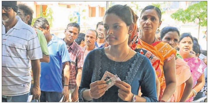
କୋଲାବିରା ବୁକ୍‌ର ଏକ ମତଦାନ କେନ୍ଦ୍ରରେ ଭୋଟରଙ୍କ ଲମ୍ଫାଧି।