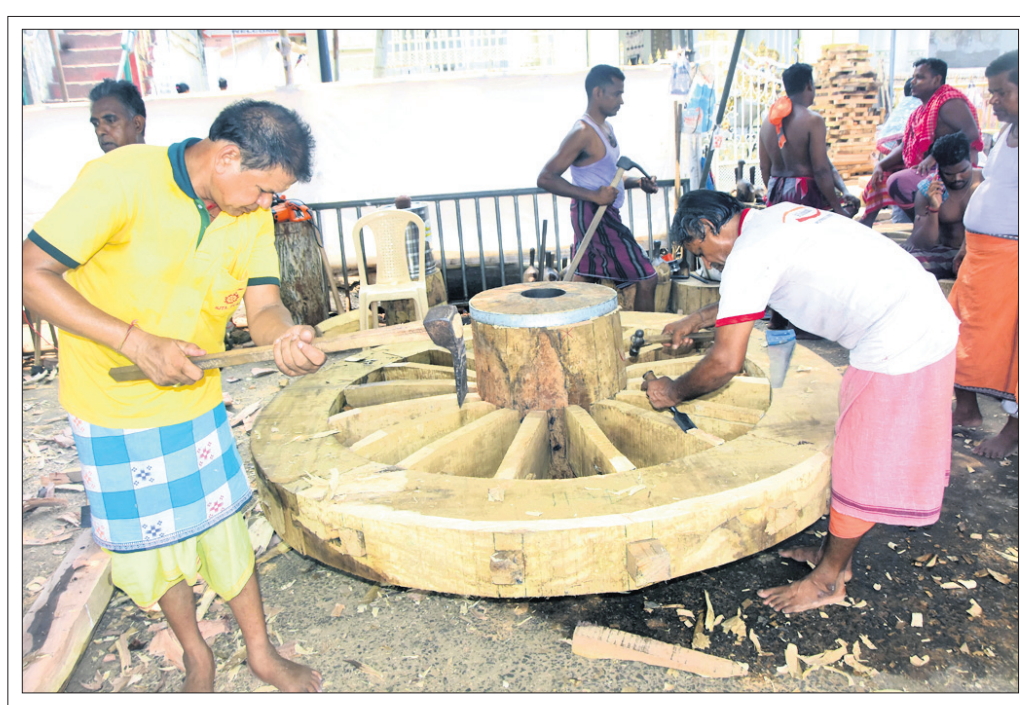
ପୁରୀ ରଥଖଳାରେ ବୁଧବାର ରଥବଳ ନିର୍ମାଣ କାର୍ଯ୍ୟ କରାଯାଉଛି।