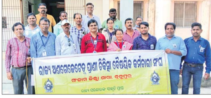
ଜିଲ୍ଲା ପ୍ରାଣୀ ଚିକିତ୍ସାକାରୀ କାର୍ଯ୍ୟାଳୟ ସମ୍ମୁଖରେ କଳାବ୍ୟାଜ ପିନ୍ଧି ପ୍ରତିବାଦ ।

ରାଜ୍ୟ ଅଶରକେତେ ପ୍ରାଣୀ ଚିକିତ୍ସା ବୈଷୟିକ କର୍ମଚାରୀ ସଂଘ ଗଞ୍ଜାମ ଜିଲ୍ଲା ଶାଖା ପକ୍ଷରୁ ୪ ଦମ୍ପା ଦାବି ସମ୍ବନ୍ଧରେ ନେଇ ରୁଧିରାଠାରୁ କଳା ବ୍ୟାଜ ପରିଧାନ କରି ପ୍ରତିବାଦ କରାଯାଇଛି।