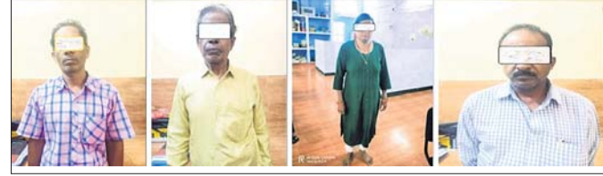
ଗିରଫ ୪ ଅଭିଯୁକ୍ତ।

ଉତ୍ତମାଧିକାରୀଙ୍କୁ ୨୫ଲକ୍ଷ, ରାୟଗଡ଼ ସରକାରୀ ଏସ୍ଏସ୍ଡି ଉଚ୍ଚ ମାଧ୍ୟମିକ ବିଦ୍ୟାଳୟକୁ ୨୫ଲକ୍ଷ, ନୂଆଗଡ଼ ରୁକ୍ମିଣୀ ୨୫ଲକ୍ଷ, କେସିପୁର ସରକାରୀ ଉଚ୍ଚମାଧ୍ୟମିକ ବିଦ୍ୟାଳୟକୁ ୨୫ଲକ୍ଷ, ରାମଚନ୍ଦ୍ର ସରକାରୀ ଉଚ୍ଚ ମାଧ୍ୟମିକ ବିଦ୍ୟାଳୟକୁ ୨୫ଲକ୍ଷ ସହାୟତା ରାଶି ଅନୁମୋଦନ ହୋଇଛି।