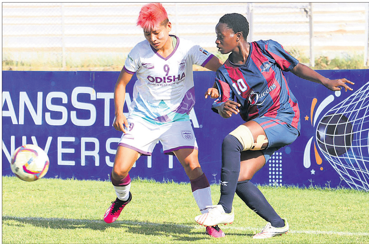
ଓଡ଼ିଶା ଏସ୍ସି ଓ ସେଲଟିକ୍ କ୍ଲବ୍ସ ଏସ୍ସି ଖେଳାଳିଙ୍କ ମଧ୍ୟରେ ବଲ୍ ପାଇଁ ସଂଘର୍ଷ।

ଅହମଦାବାଦ, ୧୦।୫ ଇଣ୍ଡିଆନ ଓପେନ୍ ଲିଗ୍ (ଆଇଡବ୍ଲ୍ୟୁଏଲ)ରେ ଓଡ଼ିଶା ଏସ୍ସି ପଞ୍ଚମ ବିଜୟ ହାସଲ କରିଛି।