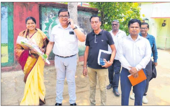
ଅଧ୍ୟକ୍ଷ ଯତ୍ନା ଉପଦେଷ୍ଟାଙ୍କୁ ସାଗତ କରୁଛନ୍ତି।

ପଞ୍ଚାୟତରାଜ ଓ ପାନୀୟଜଳ ବିଭାଗ ବସ୍ତୁଧା ଯୋଜନାର ଗ୍ରାମୀଣ ଉପଦେଷ୍ଟା ଭୂମିକା ଯାଏ ବୁଦ୍ଧଦିନିଆ ଗଞ୍ଜାମ ଜିଲ୍ଲା ଗସ୍ତରେ ଆସି ବୁଧବାର ଭଞ୍ଜନଗର ଉପଖଣ୍ଡର ବିଭିନ୍ନ ଗ୍ରାମ ପରିଦର୍ଶନ କରି ଅପରାହ୍ଣରେ ଭୁବନେଶ୍ୱର ଫେରିଯାଇଛନ୍ତି।