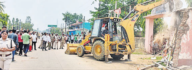
କେସିଡି ଦ୍ଵାରା ଜବତଦଖଲ ଉଚ୍ଛେଦ କରାଯାଇଛି।

ବନ୍ଧ, ୧୦।୫ (ଡି.ଏନ.ଏ.) କେସିଡି ଦ୍ଵାରା ଜବତଦଖଲ ଉଚ୍ଛେଦ କରାଯାଇଛି। ସେତେବେଳେ ଉପଜିଲ୍ଲାପାଳ ଜବତଦଖଲ ଉଚ୍ଛେଦ କରାଯିବ ବୋଲି ଆନ୍ଦୋଳନକାରୀଙ୍କୁ ପ୍ରତିଶ୍ରୁତି ଦେଇଥିଲେ। ସେହି ଅନୁଯାୟୀ ତତ୍ଵସିଲ ପକ୍ଷରୁ ବଜାରରୁ ଜବତଦଖଲ ହଟାଯାଇଛି। ତତ୍ଵସିଲଦ୍ଵାରା ଅଧିକାରୀ ବାରିକ, ଅତିରିକ୍ତ ତତ୍ଵସିଲଦ୍ଵାରା ବିନିତାରାଣୀ କିଷ୍କୁ ଏସ୍ପିପିଓ ବିଜୟକୃଷ୍ଣ ମହାପାତ୍ର, ବନ୍ଧ ଥାନାଧିକାରୀ ଆଦିତ୍ୟ ଫକରେ ରାସ୍ତାପାର୍ଶ୍ଵରେ ଗହଳି ଲାଗିବା ସହ ଦୁର୍ଘଟଣା ଘଟୁଥିଲା। କିଛିଦିନ ତଳେ ଏଠାରେ ସଡ଼କ ଦୁର୍ଘଟଣାରେ ଜଣେ ଫଳ ଦୋକାନୀଙ୍କ ମୃତ୍ୟୁ ଘଟିଥିଲା। ସ୍ଥାନୀୟ ଲୋକେ ବନ୍ଧ ବଜାରକୁ ଜବତଦଖଲ ଉଚ୍ଛେଦ ଦାବିରେ ରାସ୍ତାଗୋଡ଼େଇ ଉପସ୍ଥିତ ଥିଲେ। ୨ ପ୍ଲାନୁର ପୋଲିସ ଯୋଗ୍ୟ ପୁରସ୍କର କରାଯାଇଥିଲା।