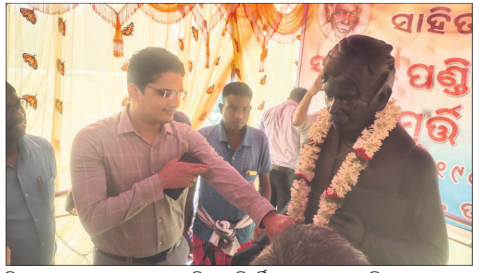
ଜିଲ୍ଲାପାଳ ଦତ୍ତାତ୍ରେୟ ଭାଇସାହେବ ଶିରେ ପ୍ରତିମୂର୍ତ୍ତିକୁ ଉଦ୍ଘୋଷଣ କରୁଛନ୍ତି।