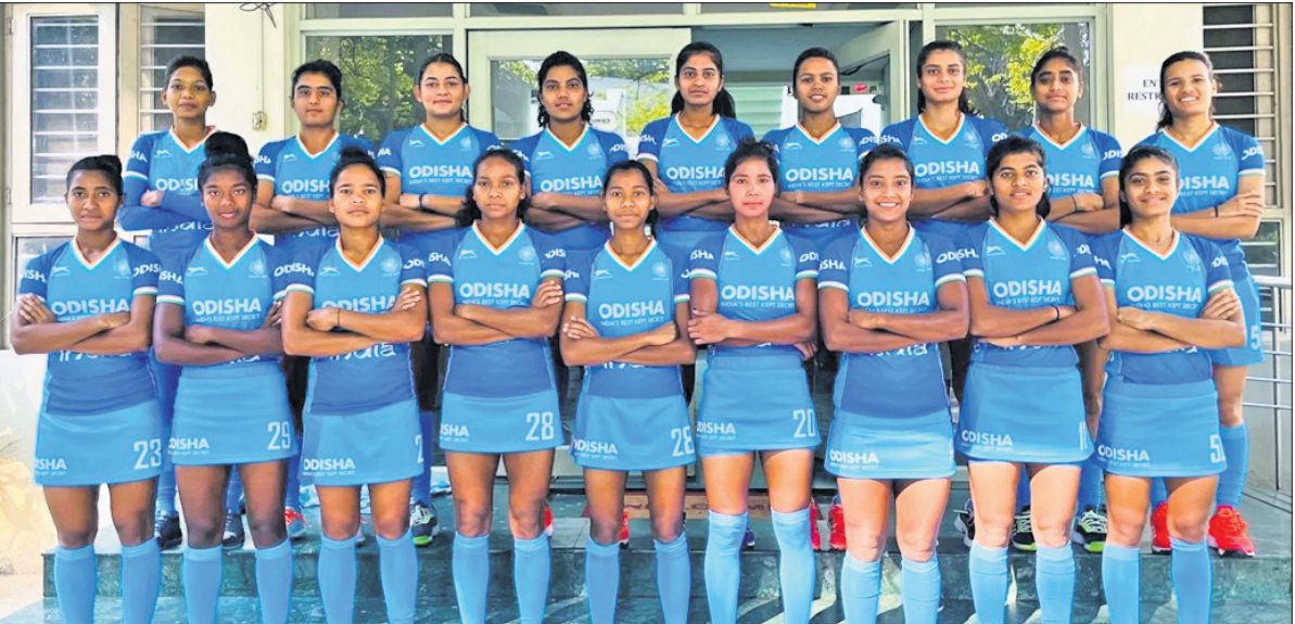
ଏସିଆ କପ୍ ଜୁନିୟର ମହିଳା ହକି ପାଇଁ ମନୋନୀତ ଭାରତୀୟ ଦଳ ।