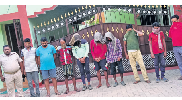
ଗିରଫ ଏ ଅଭିଯୁକ୍ତ।