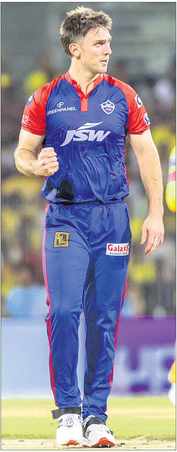
ଉତ୍ତମେ ନେବାପରେ ମିଚେଲ୍ ମାର୍ଶ୍ ।

ଚେନ୍ନାଇ, ୧୦।୫ ଷ୍ଟୋରର ଏମ୍. ଏ. ବିବାହରେ ଷ୍ଟୋରର ଷ୍ଟୋର ଆଇପିଏଲ୍ ୫୫ ତମ ମ୍ୟାଚ୍‌ରେ ୧୨୭ ରନ୍‌ରେ ସାମିତ ରହିଛି ଚେନ୍ନାଇ ସୁପର କିଙ୍ଗ୍ସ । ଦିଲ୍ଲୀ କ୍ୟାପିଟାଲ୍ସ ପକ୍ଷରୁ ମିଚେଲ୍ ମାର୍ଶ୍ ସର୍ବାଧିକ ୩ ରଜ୍‌କେଟ୍ ଅଭିଆର କରିଥିଲେ । ଚେନ୍ନାଇ ଜଣେ ବି ଖେଳାଳି ଅର୍ଦ୍ଧଶତକ ହାସଲ କରି ନ ଥିବା ବେଳେ ୨୫ ରନ୍ ସହିତ ଶିବମ ଦୁବେ ଚମ୍ପିୟନ ରହିଥିଲେ । ଚମ୍ପିୟନ ପ୍ରଥମ ବ୍ୟାଟିଂ କରିଥିବା