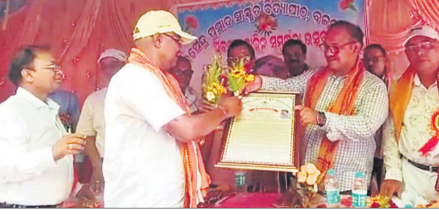
ଅତିଥିମାନେ ଅବସରପ୍ରାପ୍ତ ପ୍ରଧାନାବାର୍ଯ୍ୟଙ୍କୁ ଭରତୀୟ ଓ ମାନପତ୍ର ପ୍ରଦାନ କରୁଛନ୍ତି।