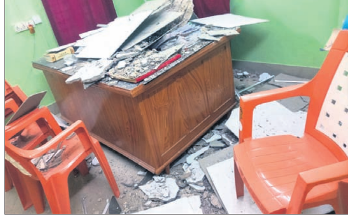
ଭିଜିଲାନ୍ସ ଲେବର କମିଶନରଙ୍କ କାର୍ଯ୍ୟାଳୟ ଛାଡ଼ିବାକୁ ଖସିପଡିଥିବା କମ୍ପ୍ୟୁଟର।

କହିଛନ୍ତି, ତାଙ୍କ କକ୍ଷ ଛାଡ଼ିବାକୁ ଖସି ଚେନ୍ଦ୍ର ଉପରେ ପଡ଼ିଥିଲା। ଫଳରେ ଚେନ୍ଦ୍ରଙ୍କ ସମ୍ପୂର୍ଣ୍ଣ ଭାବେ ଭାଙ୍ଗିଯାଇଥିବା ବେଳେ ଫାଇଲସବୁ ଏଣେତେଣେ ବିଛାଡି ହୋଇପଡ଼ିଥିଲା। ପାଖାପାଖି ଏକ ମାସ ପୂର୍ବରୁ ପିଡିଏମ୍ ସହର ମରାମତି କରାଯିବା ପାଇଁ ପତ୍ର କରାଯାଇଥିଲା। ହେଲେ ବର୍ତ୍ତମାନ ସୁଦ୍ଧା ଏହାର ମରାମତି ହୋଇ ନ ପାରିବାରୁ ଏଭଳି ଛାଡ଼ି ଉପସ୍ଥିତ ବୋଲି ପ୍ରକାଶ କରିଛନ୍ତି।