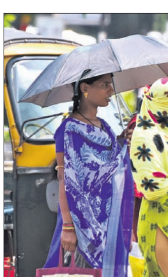
ଭୁବନେଶ୍ୱରରେ ବୁଲି ମହିଳା ଛତା ମୁଣ୍ଡାଇ ଯାଉଛନ୍ତି।

ବେଗରେ ଗତି କରୁଛି। ଏହା ଦକ୍ଷିଣ-ପୂର୍ବ ପୋର୍ଟବେଲ୍‌ରେ ୦.୫୩୦ କିମି ଦୂରରେ କେନ୍ଦ୍ରାଭୂତ ହୋଇଛି। ୧୧ ତାରିଖ ସକାଳ ସୁଦ୍ଧା ଏହା ବାତ୍ୟାରେ ପରିଣତ ହେବାର ସମ୍ଭାବନା ହେବ। ମଧ୍ୟରାତ୍ରରେ ଏହା ଆହୁରି ତୀବ୍ର ହେବ। ଏହାପରେ ସାମୁଦ୍ରିକ ଝଡ଼ ଉତ୍ତର-ଉତ୍ତର-ପୂର୍ବ ଦିଗକୁ ଯାଇ ଦକ୍ଷିଣ-ପୂର୍ବ ବାଙ୍ଗାଦେଶ ଏବଂ ଉତ୍ତର ମ୍ୟାନ୍‌ଦୀର ଉପକୂଳକୁ ମେ' ୧୪ ପୂର୍ବସ୍ତରୀରେ ଅତିକ୍ରମ କରିବା ସମ୍ଭାବନା ରହିଛି। ଏହାର ପ୍ରଭାବରେ ଦକ୍ଷିଣ-ପୂର୍ବ ବଙ୍ଗୋପସାଗରରେ ଘଣ୍ଟାପ୍ରତି ପବନର ବେଗ ୯୦ରୁ ୧୦୦ କିଲୋମିଟର ପର୍ଯ୍ୟନ୍ତ ବଢ଼ିପାରେ। ସେହିଭଳି ୧୧ ତାରିଖ ସନ୍ଧ୍ୟା ସୁଦ୍ଧା ପବନର ବେଗ ଘଣ୍ଟା ପ୍ରତି ୧୧୦ ହେବ ବୋଲି ଆକଳନ ହୋଇଛି। ଏହି ସମୟରେ ସମୁଦ୍ରରେ ଉଚ୍ଚ ଲହଡ଼ି ଉଠିବା ସହିତ ସମୁଦ୍ର ଅଣାନ୍ତ ରହିବାର ସମ୍ଭାବନା ଥିବାରୁ ଆଜିଠାରୁ ୧୪ ତାରିଖ ପର୍ଯ୍ୟନ୍ତ ସମୁଦ୍ର ପ୍ରବେଶ ପାଇଁ ବାରଣ କରାଯାଇଛି।