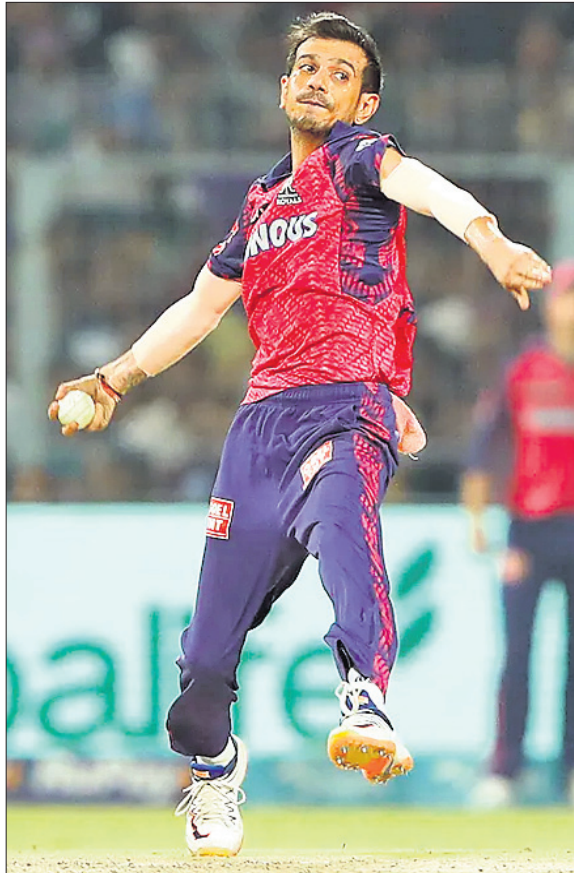
୪ ଉଇକେଟ ହାସଲକାରୀ ରାଜସ୍ଥାନ ମୁମ୍ବାଇ ଟ୍ରେନ୍ସରେ

ଇଡେନ ଗାର୍ଡେନ୍ସରେ ଆଇପିଏଲର ୫୬ତମ ମ୍ୟାଚରେ ମୁମ୍ବାଇ ରୋୟାଲ୍ସ ଓ ରାଜସ୍ଥାନ ରୟାଲ୍ସ ମଧ୍ୟରେ ମ୍ୟାଚ ଖେଳାଯାଇଥିଲା। ତୃତୀୟ ସ୍ଥାନରେ ରାଜସ୍ଥାନ ଯାଇଛି।