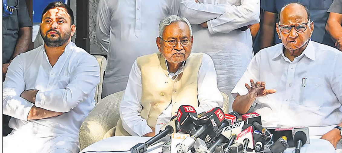
ମୁ୍ୟାଳୟରେ ଗୁରୁବାର ବିହାର ମୁଖ୍ୟମନ୍ତ୍ରୀ ନାଟାଶ କୁମାର ଏବଂ ଏନ୍‌ସିପି ସୁପ୍ରିମୋ ଶରଦ ପାଠ୍ରର ଗଣମାଧ୍ୟମକୁ ସୂଚନା ଦେଇଛନ୍ତି। ନିକଟରେ ଉପସ୍ଥିତ ଅଛନ୍ତି ବିହାର ଉପମୁଖ୍ୟମନ୍ତ୍ରୀ ତଥା ଆରଜେଡି ନେତା ତେଜସ୍ୱୀ ସାହୁ।