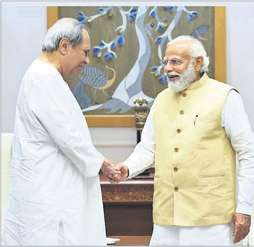
ନୂଆଦିଲ୍ଲୀ ଗସ୍ତରେ ଥିବା ମୁଖ୍ୟମନ୍ତ୍ରୀ ନବୀନ ପଟ୍ଟନାୟକ ରୁରୁବାର ପ୍ରଧାନମନ୍ତ୍ରୀ ନରେନ୍ଦ୍ର ମୋଦିଙ୍କୁ ସାକ୍ଷାତ୍ କରିବା ଅବସରରେ ।