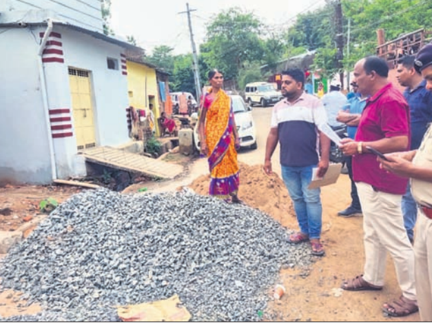
ରାସ୍ତାକୁ ଘର ତିଆରି ସାମଗ୍ରୀ ହଟାଇବାକୁ ଅଧିକାରୀମାନେ ବୁଝାଇଛନ୍ତି।

ଖ୍ରୀଷ୍ଟିଆନପେଟା କୋର୍ଟ ରୋଡ୍ରେ ପହଞ୍ଚି ରାସ୍ତା ଅବରୋଧ ହଟାଇବାକୁ ସଚେତନ କରାଯାଇଛି। ରାସ୍ତାରେ ଘର ନିର୍ମାଣ ଜିନିଷ ରଖି ରାସ୍ତା ଅବରୋଧ କରିବା ଫଳରେ ଗ୍ରାମିକ ସମସ୍ୟା ଦେଖାଯାଇଛି।