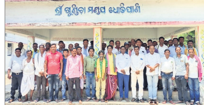
ମନ୍ଦିର ପରିଚାଳନା କମିଟିର ସଭ୍ୟମାନେ।

ହେଉଛି। ମଣ୍ଡଳୀୟ ଦାମକୁ ରକ୍ଷାପାଇବା ପାଇଁ ଧୂଆଁ ଛଡ଼ାଯାଇନାହିଁ। ହୋଲିଡ଼ି ଚ୍ୟାକ୍ ନାମରେ ଜନସାଧାରଣଙ୍କୁ ଲକ୍ଷ୍ୟକ୍ମକ ଚ୍ୟାକ୍ ଆଦାୟ ହେଉଛି। କିନ୍ତୁ ଲୋକଙ୍କୁ ସେବା ଠିକ୍ ଭାବେ ମିଳୁନାହିଁ। କହିବାକୁ ଲାଗେ ପୌରସଂସ୍ଥା ଜନସାଧାରଣଙ୍କୁ ଚୈଦିକ ସୁବିଧା ଯୋଗାଇବାରେ ବିଫଳ ହୋଇଛି।