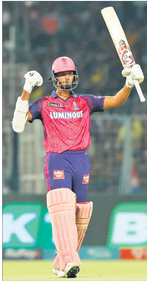
ଆଇପିଏଲର ଦୁତତମ ଅର୍ଦ୍ଧଶତକ ହାସଲ କରିବା ପରେ ଯଶସ୍ୱୀ କରସାଲ।

ସଂକ୍ଷେପରେ କୋଲକାତା ନାଇଟ୍ ରାଇଡର୍ସ ୨୦ ଓଭରରେ ୧୪୯/୮(ଭେକ୍ଟରସ୍ ଆୟାର-୫୭, ନାତୀଶ ରାଣା-୨୨, ରେହମାନୁଲ୍ଲା ରୁରବାଜ-୧୮, ଯୁକ୍ତବେନ୍ଦ୍ର ଚହଲ-୪/୨୫, ବିକେଟ୍-୨/୧୫, କେ ଏମ୍ ଆସିଫ-୧/୨୭)।