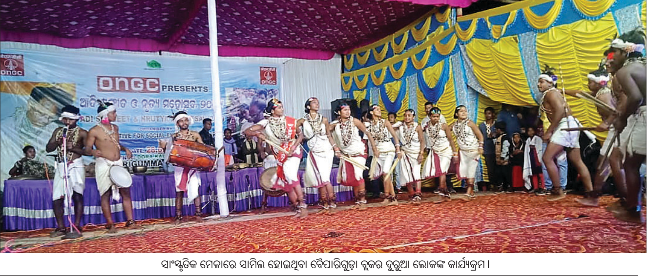
ସାଂସ୍କୃତିକ ମେଳାରେ ସାମିଲ ହୋଇଥିବା ବୈପାରିଗୁଡ଼ା ବୁକର ବୁରୁଆ ଲୋକଙ୍କ କାର୍ଯ୍ୟକ୍ରମ।