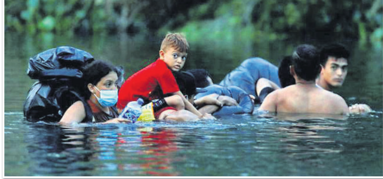
ଆମେରିକା ଅଭିଯୁକ୍ତ ବାହାରିଥିବା ଶରଣାର୍ଥୀମାନେ ରିଓ ଗ୍ରାଣ୍ଡେ ନଦୀ ପାରହେଉଛନ୍ତି ।

ଇସ୍ଲାମାବାଦ, ୧୨୫(ପି.ଟି.): ପାକିସ୍ତାନର ପୂର୍ବତନ ପ୍ରଧାନମନ୍ତ୍ରୀ ଇମ୍ରାନ ଖାନ୍ଙ୍କୁ ସାମୟିକ ଆଣ୍ଡ୍ରିଫ୍ ମିଳିଛି । ଇସ୍ଲାମାବାଦ ହାଇକୋର୍ଟର ଏକ ସ୍ୱତନ୍ତ୍ର ଖଣ୍ଡପୀଠ ଶୁକ୍ରବାର ଇମ୍ରାନଙ୍କୁ ୨ ସପ୍ତାହ ସୁରକ୍ଷାମୂଳକ ଜାମିନ ପ୍ରଦାନ କରିଛନ୍ତି । ମଜଲିସ୍‌ବାର ପରେ ଦାଏର କୌଣସି ମାମଲାରେ ତାଙ୍କୁ ମେ' ୧୭ ପର୍ଯ୍ୟନ୍ତ ରିଟ୍‌ଫ କରାଯାଇପାରିବ ନାହିଁ ବୋଲି ଅପାଲତ ନିର୍ଦ୍ଦେଶ ଦେଇଛନ୍ତି । ଇମ୍ରାନଙ୍କ ରିଟ୍‌ଫପାରିକୁ ସୁପ୍ରିମକୋର୍ଟ