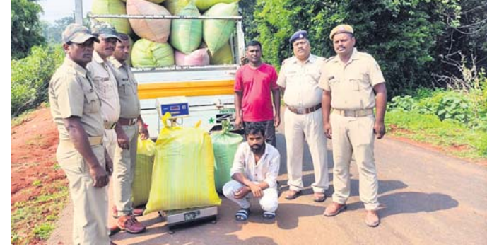
ଗିରଫ ଅଭିଯୁକ୍ତ ସହ ଜବତ ଭାଙ୍ଗି ଓ ପିକଅପ୍ ଭ୍ୟାନ ।