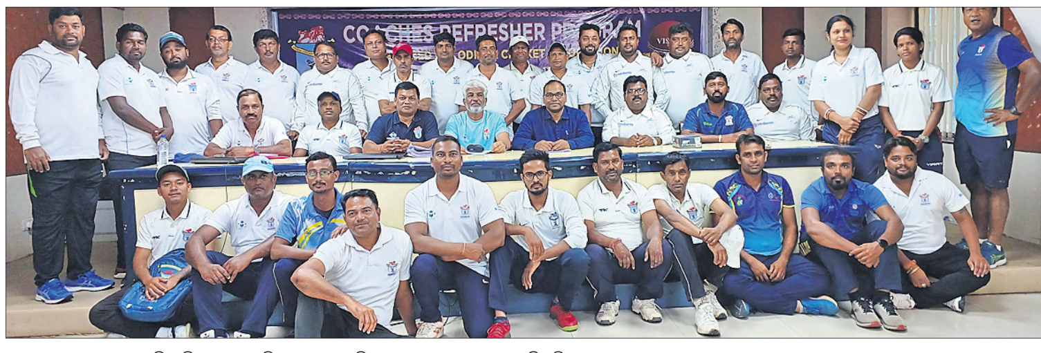
ଓଡ଼ିଶା କ୍ରିକେଟ ଆସୋସିଏଶନ ପକ୍ଷରୁ ଓସିଏ କର୍ମସଂପନ୍ନ ହଲ୍ରେ ଆୟୋଜିତ ରିପ୍ରେଜେଣ୍ଟେସନ୍ ପ୍ରୋଗ୍ରାମରେ ଭାଗ ନେଇଥିବା କୋଚ୍ଙ୍କ ସହ ଅନ୍ୟମାନେ।

ଭୁବନେଶ୍ୱର, ୧୨୧୫ (କ୍ରୀଡ଼ା ପ୍ରତିନିଧି) ସ୍ଥାନୀୟ କଳିଙ୍ଗ ଷ୍ଟାଡ଼ିୟମରେ ହେବାକୁ ଯାଉଥିବା ହିରୋ ଇଣ୍ଡରକଣ୍ଠିନେଷ୍ଟାଲ କପ୍ ପୁରୁଷ ଚାମ୍ପିୟନଶିପର କାର୍ଯ୍ୟକ୍ରମ ଶୁକ୍ରବାର ପ୍ରକାଶ ପାଇଛି। ଏଥିରେ ଭାରତ ସମେତ ଲେବାନନ, ମଙ୍ଗୋଲିଆ ଓ ଭାନ୍ସୁଆରୁ ଏକ ଅଂଶଗ୍ରହଣ କରିବେ। ଜୁନ ୯ ତାରିଖରୁ ପ୍ରତିଯୋଗିତା ଆରମ୍ଭ ହେବ। ଏହି ଦିନ ଅପରାହ୍ଣ ୪ଟା ୩୦ରେ ଲେବାନନ ଓ ଭାନ୍ସୁଆରୁ ମଧ୍ୟରେ ପ୍ରଥମ ମ୍ୟାଚ ଅନୁଷ୍ଠିତ। ରାତି ୭ଟା ୩୦ରେ ଭାରତ ଏହାର ପ୍ରଥମ ମ୍ୟାଚରେ ମଙ୍ଗୋଲିଆକୁ ଭେଟିବ। ଅଂଶଗ୍ରହଣକାରୀ ୪ ଦଳ ପରସ୍ପରକୁ ଗୋଟିଏ ଲେଖାଏ ମ୍ୟାଚରେ ଭେଟିବେ। ଶୀର୍ଷ ଦୁଇଦଳ ଜୁନ ୧୮ରେ ଫାଇନାଲରେ ପରସ୍ପରକୁ ଭେଟିବେ। ଜାତୀୟରେ ହେବାକୁଥିବା ୨୦୨୩ ଏସିଆ ଏସିଆନ୍ କପ୍ ପାଇଁ ଏହି ଚାମ୍ପିୟନଶିପ ପ୍ରସ୍ତୁତି ସଦୃଶ ହେବ। ଭାରତ ସାଧୁ ଚାମ୍ପିୟନଶିପ ଖେଳିବ। ଏହା ଆସନ୍ତା ଜୁନ ୧୧ରୁ ଜୁଲାଇ ୩ ପର୍ଯ୍ୟନ୍ତ ବେଙ୍ଗାଳୁରୁରେ ଅନୁଷ୍ଠିତ ହେବ। ପୁଷ୍ପା କୋଚ୍ ଇରାନ ଷ୍ଟିମାକ୍ସ ଅଧିନରେ ଜାତୀୟ ଦଳ ଚଳିତ ମାସ