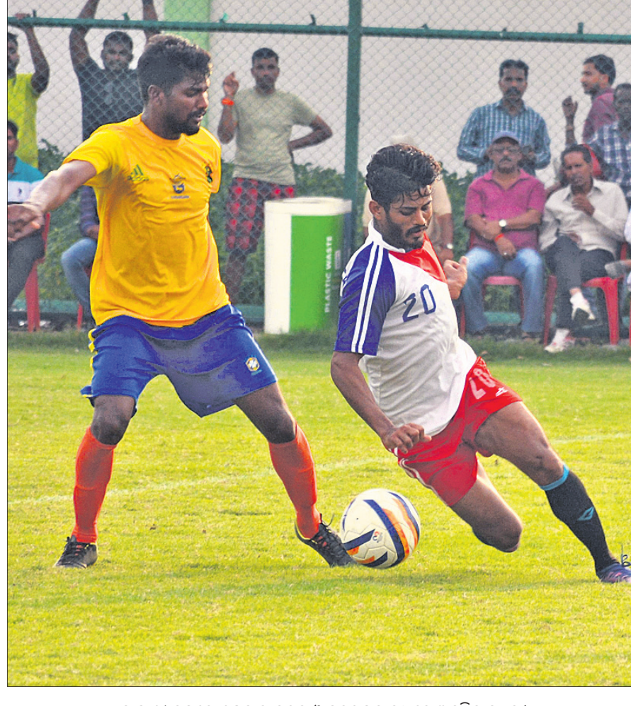
ସାହାଣୀ କପ୍ରେ ଶୁକ୍ରବାର କଟକ ଓ ସୁନ୍ଦରଗଡ଼ ମଧ୍ୟରେ ଅନୁଷ୍ଠିତ ମ୍ୟାଚ।

ଭୁବନେଶ୍ୱର, ୧୨୧୫ (ପି.ଡି.): ଗୁରୁତାର ଇଡେନଗାଡ଼େଟୁଠାରେ କୋଲକାତା ନାଜର୍ ରାଜତର୍ସ (କେକେଆର) ବିପକ୍ଷ ଇଣ୍ଡିଆନ୍ ପ୍ରିମିୟର ଲିଗ୍ ମ୍ୟାଚରେ ଖେଳର ଆଚରଣ ବିଧି ଉଲ୍ଲଙ୍ଘନ କରିଥିବାରୁ ରାଜ୍ୟର ଉନ୍ନତ ଓପନର କୋଚ୍ ବଟଲରଙ୍କୁ ତାଙ୍କ ମ୍ୟାଚ ଫି'ର ୧୦ ପ୍ରତିଶତ ଜରିମାନା କରାଯାଇଛି। ବଟଲର ଆଚରଣ ଯଶସ୍ୱୀ ଡିଏଲ୍‌ଏଲ୍ ସହ ଭୁଲ ରୁଖିମାନା ଯୋଗୁ ବଟଲର ରନ ଆଉଟ ହୋଇଥିଲେ। ଏଥିରେ ସେ ଅସନ୍ତୋଷ ପ୍ରକାଶ କରିଥିଲେ। ଡିଏଲ୍‌ଏଲ୍ ସହ ଏହି ମ୍ୟାଚ ୯ ଉଇକେଟରେ ଜିତି ନେଇଥିଲା। ବଟଲର ଆଚରଣ ବିଧିର ଧାରା ୨.୨ ଅନୁସାରେ ଲେଉଟ-୧ ଅପରାଧ କରିଥିବା ବିଷୟ ସ୍ୱୀକାର କରିଥିଲେ। ମ୍ୟାଚ ରେଫରିଙ୍କ ନିଷ୍ପତ୍ତି ଚୁଡ଼ାଚ ଏବଂ ମାନ୍ଦିବା ବାଧ୍ୟତାମୂଳକ