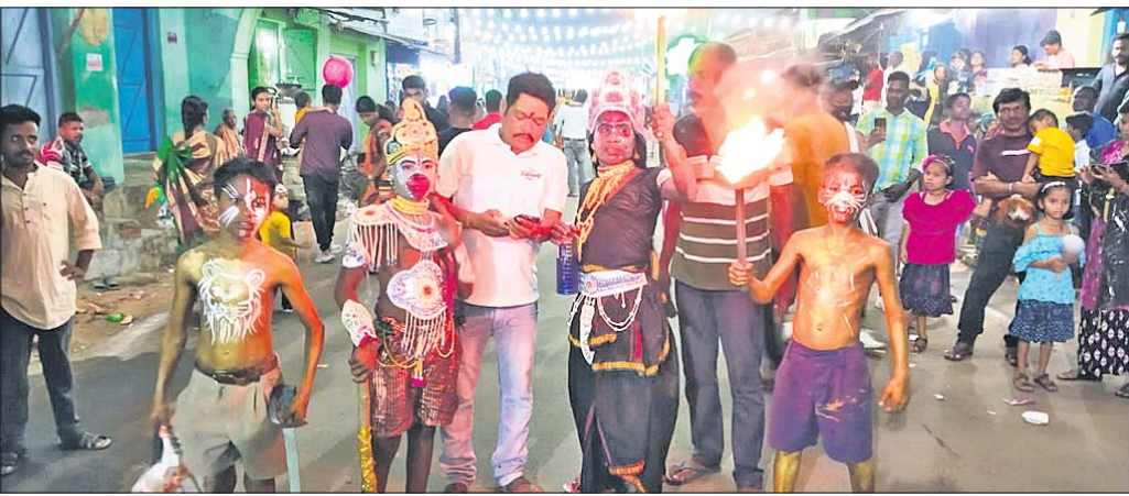
ବେଶଧାରୀଙ୍କ ସାହି ପରିକ୍ରମା ।