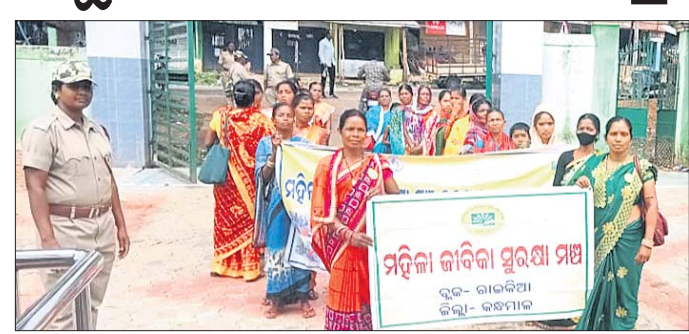
ସ୍ମାରକପତ୍ର ପ୍ରଦାନ କରିବାକୁ ଆସିଥିବା ମହିଳା ଜୀବିକା ସୁରକ୍ଷା ମଞ୍ଚର ସଦସ୍ୟ ।

କନ୍ଧମାଳ ଜିଲ୍ଲା ରାଇକିଆ ବ୍ଲକ୍ ମହିଳା ଜୀବିକା ସୁରକ୍ଷା ମଞ୍ଚ ଶାଖା ପକ୍ଷରୁ ପୁଣ୍ୟମଙ୍ଗଳ ଉଦ୍ଦେଶ୍ୟରେ ଏକ ସ୍ମାରକ ପତ୍ର ରାଇକିଆ ଗୋଷ୍ଠୀ ଉନ୍ନୟନ ଅଧିକାରୀଙ୍କୁ ପ୍ରଦାନ କରାଯାଇଛି । ମହିଳା ଜୀବିକା ସୁରକ୍ଷା ମଞ୍ଚ ରାଇକିଆ ମହିଳାମାନେ ସଦର ବ୍ୟବହାର ଏକ ଶୋଭାଯାତ୍ରାରେ ବାହାରି ରାଇକିଆ ପଞ୍ଚାୟତ ସମିତି କାର୍ଯ୍ୟାଳୟରେ ପହଞ୍ଚି ରାଇକିଆ ଗୋଷ୍ଠୀ ଉନ୍ନୟନ ଅଧିକାରୀଙ୍କୁ କରୁଥିବା ପୁଣ୍ୟମଙ୍ଗଳ ଉଦ୍ଦେଶ୍ୟରେ ଏକ ସ୍ମାରକ ପତ୍ର ପ୍ରଦାନ କରିଥିଲେ । ସମସ୍ତ ସରକାରୀ ବିଦ୍ୟାଳୟରେ ଗୁଣାତ୍ମକ ଶିକ୍ଷାକୁ ପୁନିଷ୍ଠିତ କରିବା,