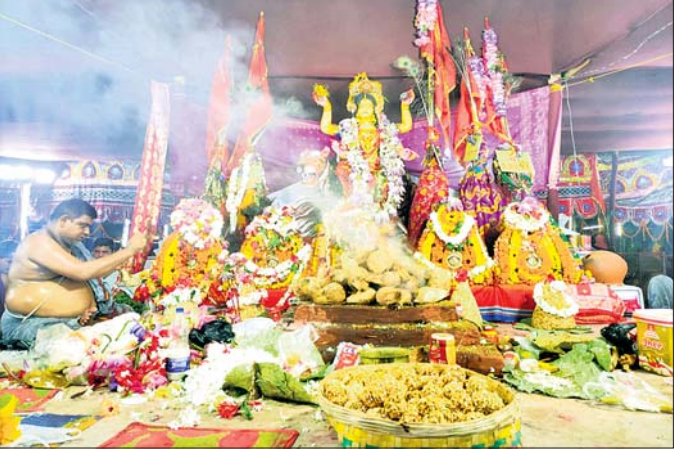
ପଞ୍ଚ ଠାକୁରାଣୀଙ୍କ ପୂଜାର୍ଚ୍ଚନା ଚାଲିଛି ।