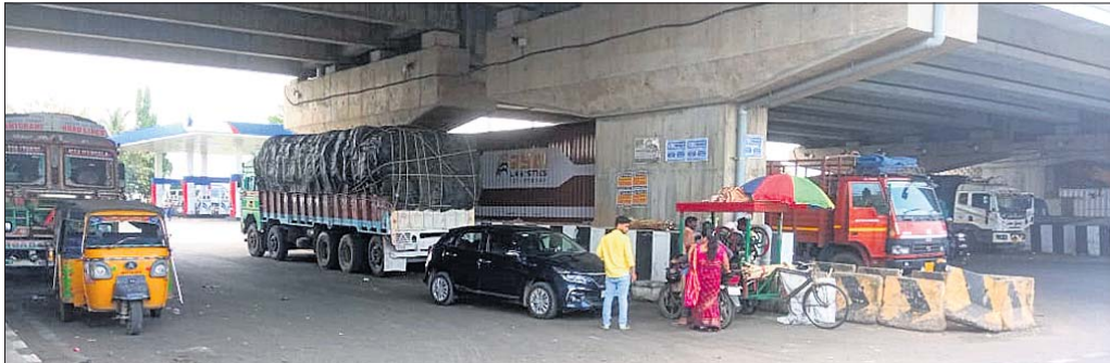
ଅଟୋନଗର ଓଭରବ୍ରିଜ୍ ରାସ୍ତାରେ ବେଆଇନ ପାର୍କିଂ କରାଯାଇଛି ।

ଘଟୁଛି । ବେଆଇନ ପାର୍କିଂ ଯୋଗୁ ଧୂଳି ଧୂସର ଭଳି ପରିବେଶ ପ୍ରଦୂଷଣ ହେବା ସହ ନାନା ଅସୁବିଧାରେ ସମ୍ମୁଖୀନ ହେଉଛନ୍ତି ପଥଚାରୀ । ଜିଲ୍ଲା ପ୍ରଶାସନ ଓ ଗୋପାଳପୁର ପ୍ରଶାସନ ନିକଟରେ ବାରମ୍ବାର ସଂଯୋଗ କରୁଥିବା ରାସ୍ତାରେ ଥିବା ଓଭରବ୍ରିଜ୍ ତଳେ ମାଲମାଲ ଟ୍ରକ ଓ ବିଭିନ୍ନ ଯାନବାହନ ବେଆଇନ ପାର୍କିଂ କରିବା ଫଳରେ ପ୍ରତିଦିନ ଦୁର୍ଘଟଣା