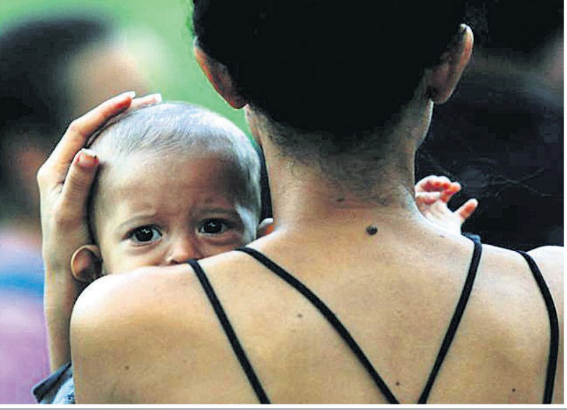
ଜଣେ ପ୍ରବାସୀ ମହିଳା ନିଜ ଶିଶୁକୁ ଧରି ରିଓ ଗ୍ରାଣ୍ଡେ ନଦୀକୂଳରେ ଛିଡ଼ା ହୋଇଛନ୍ତି ।