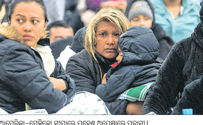
ଆମେରିକା-ମେକ୍ସିକୋ ସୀମାରେ ପ୍ରବେଶ ଅପେକ୍ଷାରେ ପ୍ରବାସୀ ।

୨୦୨୦ ମାର୍ଚ୍ଚରେ ଆମେରିକାର ତତ୍କାଳୀନ ରାଷ୍ଟ୍ରପତି ଡୋନାଲ୍ଡ୍ ଟ୍ରୁମ୍ପ କୋଭିଡ୍-୧୯ ଭୁତାଣୁ ସଂକ୍ରମଣ ରୋକିବା ପାଇଁ 'ଟାଇଟଲ ୪୨' ନାତି ଆରମ୍ଭ କରିଥିଲେ । ଫଳରେ ଆମେରିକାକୁ ପ୍ରବେଶ ଆଶାରେ ଥିବା ୨.୮ ନିୟୁତ ଶରଣାର୍ଥୀ ମେକ୍ସିକୋ ସୀମା ଅତିକ୍ରମ କରିପାରି ନ ଥିଲେ । ମହାମାରୀ ମୁକାବିଲା କେବଳ ଏକ ବାହାନୀ, ପ୍ରବାସୀଙ୍କ ଅନୁପ୍ରବେଶ ଉପରେ କଟକଣା ଲାଗି କରିବା ତ୍ରୁମ୍ପଙ୍କ ଅସଲ ଉଦ୍ଦେଶ୍ୟ ବୋଲି ଅଧିକାର ଗୋଷ୍ଠୀଗୁଡ଼ିକ ପକ୍ଷରୁ ସେତେବେଳେ ସମାଲୋଚନା କରାଯାଇଥିଲା । ଏହି ବିବାଦୀୟ ନିଷ୍ପତ୍ତିକୁ ନାତିର ଅବଧି ରୁକ୍ଷକାର ମଧ୍ୟରାଜ୍ୟରେ ହୋଇଛି । ଫଳରେ ପ୍ରବାସୀଙ୍କ ମନରେ ଆଶାର ନୂଆ କିରଣ ଜାଗ୍ରତ ହୋଇଛି । ମେକ୍ସିକୋର ପ୍ରବାସୀମାନେ ଉତ୍ତର କାନ୍ସା ଆଶାରେ ଆମେରିକାରେ ବସବାସ ପାଇଁ ବ୍ୟାକୁଳ ହୋଇ ଉଠିଛନ୍ତି । ତେବେ ସୀମାର ଉଭୟ ପାର୍ଶ୍ୱରେ ସେମାନଙ୍କୁ ଅନେକ ଅସୁବିଧାର ସମ୍ମୁଖୀନ ହେବାକୁ ପଡ଼ିଛି । କାରଣ ବାଇଡେନ୍ ପ୍ରଶାସନ 'ଟାଇଟଲ ୪୨'କୁ ରଦ୍ଦ କରିବା ସହ 'ଟାଇଟଲ ୮' ନାମରେ ଏକ ନୂଆ ନାତି ଆରମ୍ଭ କରିଛନ୍ତି । ସେମାନଙ୍କୁ ଭାବେ ଅନୁପ୍ରବେଶ କଲେ ପ୍ରବାସୀଙ୍କ ବିରୋଧରେ ୫ ବର୍ଷ ପ୍ରବେଶ କଟକଣା