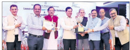
କେନ୍ଦ୍ରମନ୍ତ୍ରୀ ସର୍ବନନ୍ଦ ସୋନେଖାଲଙ୍କଠାରୁ ବନ୍ଦର ଅଧ୍ୟକ୍ଷ ପି.ଏଲ୍. ହାରାଜ ଆଖିଆଁ ଗ୍ରହଣ କରୁଛନ୍ତି।