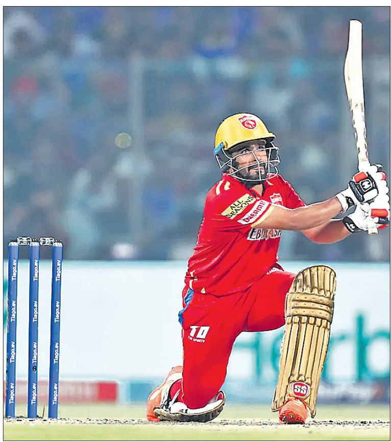
ଶତକୀୟ ଇନିଂସ ଅବସରରେ ପ୍ରଭସିମ୍ଭରନ ସିଂ

କ୍ଲବେନ୍ ୨୯ ବଲ୍ ଖେଳି ୩ଟି ଲେଖାଏ ଛକା ଓ ଚୌକା ମାରିଥିଲେ। ଲକ୍ଷ୍ମୀ ଅଧିନାୟକ କୁନାଲ ପାଣ୍ଡା ୨୪ ରନ୍ରେ ୨ ଉଇକେଟ ନେଇଥିବା ବେଳେ ମୁଖ୍ୟବୀର ସିଂ ଚରକ, ଆଭେଶ ଖାନ୍, ଅମିତ ମିଶ୍ର ଓ ଯଶ ଠାକୁର ଗୋଟିଏ ଲେଖାଏ ଉଇକେଟ ନେଇଥିଲେ। ୧୮୩ ରନ୍ରେ ପିଛା କରୁଥିବା ଲକ୍ଷ୍ମୀ ଆରମ୍ଭରୁ ଅତ୍ୟନ୍ତ ଧିମା ବ୍ୟାଟି କରିଥିଲେ। କାଜଲ୍ ଯେଉଁ ୧୪ ବଲ୍ରେ ମାତ୍ର ୨ ରନ୍ କରି ଆଉଟ ହୋଇଥିଲେ। କିଷ୍କନ୍ ତ କେ ୧୯ ବଲ୍ରେ ୨୯ ରନ୍ କରି ଆଉଟ ହେବା ବେଳକୁ ୯ ଓଭରରେ ବଳ ମାତ୍ର ୬୦ ରନ୍ କରିଥିଲେ। ଓଭର ପିଛା ୧୨ରୁ ଅଧିକ ରନ୍ ଆବଶ୍ୟକ ଥିବା ବେଳେ ବିଟାୟ ମ୍ୟାଟ୍ ଖେଳୁଥିବା ପ୍ରେରକ୍ ମକତ ହାସଲ କରିଥିଲେ ଅପରାଜିତ ଅର୍ଦ୍ଧଶତକ। ୪୫ ବଲ୍ ଖେଳି ୬ ଚୌକା ଓ ୨ ଛକା ମାରିଥିଲେ। ବନାୟ ଷୋର ୧୨୭ରେ ୨୫ ବଲ୍ରେ ୪୦ ରନ୍ କରି ମାର୍କସ୍ ଷ୍ଟେଭିନସ ଆଉଟ ହୋଇଥିଲେ। ୨୭ ବଲ୍ରେ ୫୩ ରନ୍ ଆବଶ୍ୟକ ଥିବା ବେଳେ କ୍ରିଜକୁ ଆସିଥିଲେ ନିକୋଲାସ୍ ପୁରନ୍। ଅଭିଷେକ ଶର୍ମାଙ୍କୁ ହାତ୍ରୁ ଛକା ମାରି ସେ ଇନିଂସ ଆରମ୍ଭ କରିଥିଲେ। ୧୩ ବଲ୍ ଖେଳି ସେ ୪୪ ରନ୍ କରିଥିବା ବେଳେ ତାଙ୍କ ଇନିଂସରେ ୩ ଚୌକା ଓ ୪ ଛକା ସାମିଲ ଥିଲେ। ସଂକ୍ଷିପ୍ତ ଷୋର ସନରାଇଜର୍ସ ହାଇଡ୍ରାବାଦ ୨୦ ଓଭରରେ ୧୮୨/୬ (ହେନରିଚ୍ କ୍ଲବେନ୍-୪୭, ଅବଦୁଲ୍ ସମଦ-୩୭, ଅନମୋଲପ୍ରାଟ୍ ବି-୩୭, କୁନାଲ ପାଣ୍ଡା-୨/୨୪, ମୁଖ୍ୟବୀର ସିଂ ଚରକ-୧/୨୪, ଯଶ ଠାକୁର-୧/୨୮)। ଲକ୍ଷ୍ମୀ ପୁରନ୍ ଜାଏଣ୍ଟ ୧୯.୨ ଓଭରରେ ୧୮୫/୩ (ପ୍ରେରକ ମକତ-୬୪, ନିକୋଲାସ୍ ପୁରନ୍-୪୪, ମାର୍କସ୍ ଷ୍ଟେଭିନସ୍-୪୦, ରୁନୁ ପିଲିସ୍-୧/୧୦, ମୟଙ୍କ ମାର୍କେଣ୍ଡ-୧/୩୯, ଅଭିଷେକ ଶର୍ମା-୧/୪୨)।