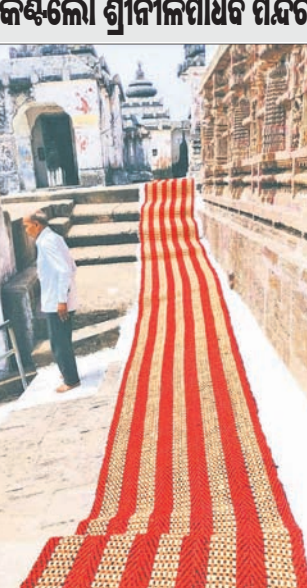
ମନ୍ଦିର ପାହାଡ଼ରେ ଗାଳିତା ପକାଯାଇଛି।

କଣ୍ଟିଲୋ ଶ୍ରୀନୀଳମାଧବ ମନ୍ଦିର ପରିସରରେ ଗ୍ରୀଷ୍ମ ତାତିରୁ ରକ୍ଷା ପାଇବାକୁ ଏବେ କଡ଼ା ଗାଳିତା ବିଛା ଯାଇଛି। ପ୍ରତ୍ୟେକ ରାତ୍ରୀ ତଥା ରାତ୍ରୀ ବାହାକୁ ଶତାଧିକ ପର୍ଯ୍ୟନ୍ତ ଜଳନାଥ ସଂସ୍କୃତି ଆଦିପାଠ ଭାବେ ପଢ଼ିତ କଣ୍ଟିଲୋ ଶ୍ରୀନୀଳମାଧବ ମନ୍ଦିରକୁ ଦର୍ଶନ କରିବାକୁ ଆସିଥାନ୍ତି। ତେବେ ଗ୍ରୀଷ୍ମ ପ୍ରବାହ ସମୟରେ ପାହାଡ଼ ଉପରେ ବିରାଜିତ ଶ୍ରୀକାନ୍ତକ ମନ୍ଦିରକୁ ପର୍ଯ୍ୟଟକମାନେ ଯିବାରେ ସମସ୍ୟା ସୃଷ୍ଟି ହୋଇଥାଏ। ପ୍ରବଳ ତାତିରେ ମନ୍ଦିର ପାହାଡ଼ ସହ ମନ୍ଦିର ପରିସର ତାତି ଯାଉଥିବାରୁ ଖାଲି ପାଦରେ ଶ୍ରଦ୍ଧାଳୁମାନେ ଯିବା କଷ୍ଟକର ହୋଇଥାଏ। ଏ ନେଇ ଶ୍ରଦ୍ଧାଳୁମାନଙ୍କ ମଧ୍ୟରେ ଅସନ୍ତୋଷ ପ୍ରକାଶ ପାଇଥାଏ। ଏଥିପାଇଁ କେବୋତର ବିଭାଗ ପକ୍ଷରୁ ପ୍ରତିବର୍ଷ ମନ୍ଦିର ପାହାଡ଼ ଓ ପରିସରରେ ରୁନ ପ୍ରଲେପ ଦିଆଯାଇଥାଏ। ତେବେ ଚଳିତବର୍ଷ ପର୍ଯ୍ୟଟକମାନଙ୍କର ସୁରକ୍ଷା ପ୍ରତି ଦୃଷ୍ଟି ଦିଆଯାଇ ପ୍ରବଳ ତାତିରୁ ରକ୍ଷା ପାଇବାକୁ ପଦକ୍ଷେପ ସ୍ୱରୂପ କେନେଲ ରଥୁଆ ଇଷ୍ଟିକ ନାମକ ଏକ କମ୍ପାନୀଠାରୁ ନିର୍ମାଣ କଡ଼ା ଗାଳିତା ବରାଦ ଦିଆଯାଇଥିଲା। ମନ୍ଦିର ପାହାଡ଼ ସମେତ ମନ୍ଦିର ବେଢ଼ା ଚତୁଃପାର୍ଶ୍ୱରେ