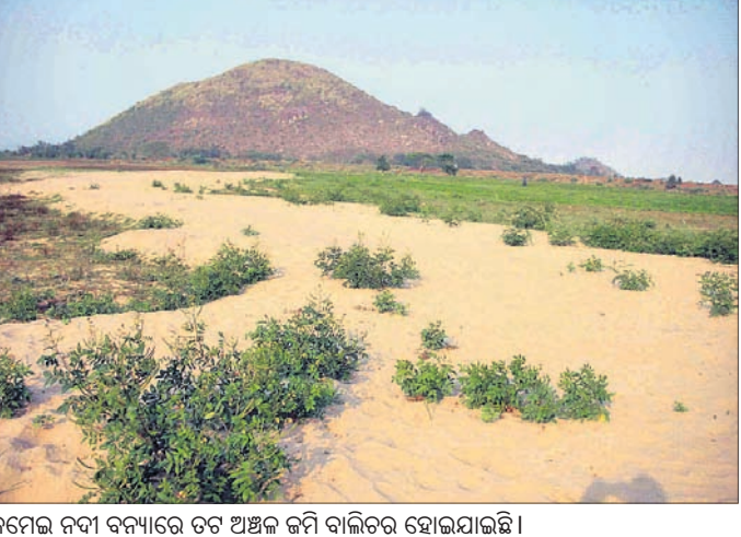
କମେଇ ନଦୀ ବନ୍ୟାରେ ତଟ ଅଞ୍ଚଳ ଜମି ବାଲିତର ହୋଇଯାଇଛି।

ତଟବର୍ତ୍ତୀ ଜମିର ସୁରକ୍ଷା ପାଇଁ ଏସ୍‌କେପ ନିର୍ମାଣ ଦାବି ଛଣାପାଟ, ପାଟକୁଳୁଆ, ବୋଲୁଆ ପାଟ, କେରୁଆ ଓ ମରେଇକଣର ପ୍ରାୟ ହଜାର ଏକରରୁ ଊର୍ଦ୍ଧ୍ୱ ଜମି ପ୍ରତିବର୍ଷ ବନ୍ୟାରେ ଜଳ ମଗ୍ନ ହୋଇଥାଏ। ଜମିକୁଡ଼ିକରେ ପଡ଼ି ମାଟି ଯାଉଥିବାରୁ ସେଥିରେ ଧାନ ଫସଲ କରିବା ସମ୍ଭବ ନୁହେଁ। ମାତ୍ର ଏହିସବୁ ଜମିକୁଡ଼ିକରେ ଧାନ ଫସଲ ବ୍ୟତିତ ଆଖୁ, ମୁଗ, ବିରି, କୋଳପ ଓ ବାଦାମ ଗଣ କରାଯାଇ ପ୍ରଚୁର ପରିମାଣର ମୁଗ, ବିରି ଫସଲ ଉତ୍ପାଦନ ହୋଇଥାଏ। ପରିତାପର ବିଷୟ ପ୍ରବଳ ବନ୍ୟା ଜଳ ଉକ୍ତ ଜମିରେ ପ୍ରବାହିତ ହେବା ସମୟରେ ଅଧିକାଂଶ ଜମି ବାଲିତର ହେବାର ଲାଗିଛି। ଫଳରେ ନଦୀ କୂଳରେ ଥିବା ଜମି ଅତଡ଼ା ଖାଲ ପ୍ରତିବର୍ଷ ଆସ୍ତେ