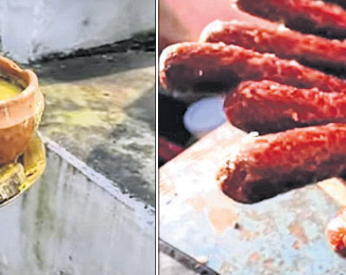
ଠାକୁରଙ୍କ ପାଖରେ ଲାଗି ହେଉଥିବା ପ୍ରସାଦ ଓ ଭୋଗ।