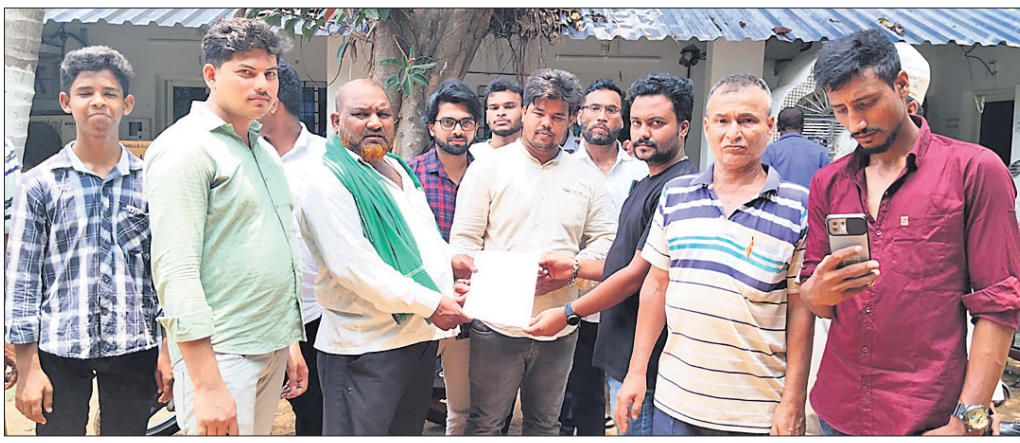
ଉପଭୋକ୍ତାମାନେ ବିଭାଗୀୟ କର୍ମୀଙ୍କୁ ଦାବିପତ୍ର ପ୍ରଦାନ କରୁଛନ୍ତି।

ବିଦ୍ୟୁତ୍ କାର୍ଯ୍ୟାଳୟ ଘେରିବା ସମୟରେ ଉପଭୋକ୍ତାମାନେ କର୍ମୀଙ୍କୁ ଦାବିପତ୍ର ପ୍ରଦାନ କରୁଛନ୍ତି।