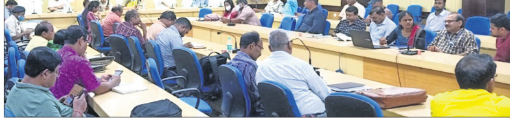
କରତସିଂହପୁର ଅଫିସ, ୧୫୫୫

କରତସିଂହପୁର ଅଫିସ, ୧୫୫୫ : ଅଭିଯୋଗ ଶୁଣାଣି ଶିବିର ଅନୁଷ୍ଠିତ ହୋଇଥିଲା।