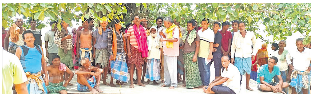
କାରାଗାରକୁ ବିରୋଧ କରି ଗ୍ରାମବାସୀ ଏକାଠି ହୋଇଛନ୍ତି।

ଯାଜପୁର ରୁକ୍ମିଣୀ ବସ୍ ଷ୍ଟାପେଜରେ ପ୍ରାଥମିକ ଶିକ୍ଷା ପ୍ରାପ୍ତ ଶିଶୁମାନଙ୍କୁ ଶିକ୍ଷା ଦେବା ପାଇଁ ଏକ ଶିଶୁ ଶିକ୍ଷା କେନ୍ଦ୍ର ନିର୍ମାଣ ପାଇଁ ଯୋଜନା କରାଯାଇଥିଲା। କିନ୍ତୁ ଗ୍ରାମବାସୀଙ୍କ ବିରୋଧରେ ଏହାକୁ ସମ୍ପୂର୍ଣ୍ଣ ଭାବେ ବନ୍ଦ କରି ଦିଆଯାଇଛି। ଗ୍ରାମବାସୀଙ୍କ କହିବା ଅନୁଯାୟୀ ଏହି କେନ୍ଦ୍ର ନିର୍ମାଣ ପାଇଁ ଗ୍ରାମବାସୀଙ୍କ ସମ୍ପତ୍ତି ଉପରେ କ୍ଷତି ହେଉଛି। ଏହାଛଡ଼ା କେନ୍ଦ୍ର ନିର୍ମାଣ ପାଇଁ ଗ୍ରାମବାସୀଙ୍କ ସମ୍ପତ୍ତି ଉପରେ କ୍ଷତି ହେଉଛି। ଏହାଛଡ଼ା କେନ୍ଦ୍ର ନିର୍ମାଣ ପାଇଁ ଗ୍ରାମବାସୀଙ୍କ ସମ୍ପତ୍ତି ଉପରେ କ୍ଷତି ହେଉଛି।