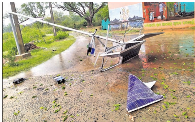
ଝଟିଯାଇଥିବା ଏକ ସୋଲାର ଲାଇଟ୍ ଖୁଣ୍ଟ ଭାଙ୍ଗିପଡ଼ିଛି।

ରଘୁଲପୁର ରୁକ୍ମିଣୀ ବସ୍ ଷ୍ଟାପେଜରେ ପ୍ରାଥମିକ ଶିକ୍ଷା ପ୍ରାପ୍ତ ଶିଶୁମାନଙ୍କୁ ଶିକ୍ଷା ଦେବା ପାଇଁ ଏକ ଶିଶୁ ଶିକ୍ଷା କେନ୍ଦ୍ର ନିର୍ମାଣ ପାଇଁ ଯୋଜନା କରାଯାଇଥିଲା। କିନ୍ତୁ ଗ୍ରାମବାସୀଙ୍କ ବିରୋଧରେ ଏହାକୁ ସମ୍ପୂର୍ଣ୍ଣ ଭାବେ ବନ୍ଦ କରି ଦିଆଯାଇଛି। ଗ୍ରାମବାସୀଙ୍କ କହିବା ଅନୁଯାୟୀ ଏହି କେନ୍ଦ୍ର ନିର୍ମାଣ ପାଇଁ ଗ୍ରାମବାସୀଙ୍କ ସମ୍ପତ୍ତି ଉପରେ କ୍ଷତି ହେଉଛି। ଏହାଛଡ଼ା କେନ୍ଦ୍ର ନିର୍ମାଣ ପାଇଁ ଗ୍ରାମବାସୀଙ୍କ ସମ୍ପତ୍ତି ଉପରେ କ୍ଷତି ହେଉଛି। ଏହାଛଡ଼ା କେନ୍ଦ୍ର ନିର୍ମାଣ ପାଇଁ ଗ୍ରାମବାସୀଙ୍କ ସମ୍ପତ୍ତି ଉପରେ କ୍ଷତି ହେଉଛି।