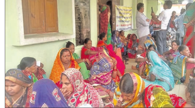
ସୋମବାର ରାଜନଗର ରୁକ୍ମଣୀ ଅନ୍ତର୍ଗତ ଗ୍ରାମବାସୀଙ୍କୁ ପୁରୁସ୍କାରିତ କରାଯାଇଛି।