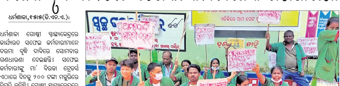
ଧର୍ମଶାଳା ଗୋଷ୍ଠୀ ସ୍ୱାସ୍ଥ୍ୟକେନ୍ଦ୍ର ଆଗରେ ସଫେଇ କର୍ମଚାରୀ ଗଣଧାରଣା ଦେଇଛନ୍ତି।

ଯାଜପୁର ପ୍ରେସ୍ କ୍ଲବର ବନ୍ଧୁମିଳନ ଦରମା ବୃଦ୍ଧି ଦାବିରେ ସଫେଇ କର୍ମଚାରୀଙ୍କ ଗଣଧାରଣା। ଯାଜପୁର ପ୍ରେସ୍ କ୍ଲବର ବନ୍ଧୁମିଳନ ଦରମା ବୃଦ୍ଧି ଦାବିରେ ସଫେଇ କର୍ମଚାରୀଙ୍କ ଗଣଧାରଣା। ଯାଜପୁର ପ୍ରେସ୍ କ୍ଲବର ବନ୍ଧୁମିଳନ ଦରମା ବୃଦ୍ଧି ଦାବିରେ ସଫେଇ କର୍ମଚାରୀଙ୍କ ଗଣଧାରଣା। ଯାଜପୁର ପ୍ରେସ୍ କ୍ଲବର ବନ୍ଧୁମିଳନ ଦରମା ବୃଦ୍ଧି ଦାବିରେ ସଫେଇ କର୍ମଚାରୀଙ୍କ ଗଣଧାରଣା।