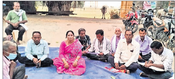
କର୍ମୀ ଏକତ୍ର ହୋଇ କାର୍ଯ୍ୟକଳାରେ ଦଳ ମଜଭୁତ ହେବ

କର୍ମୀ ଏକତ୍ର ହୋଇ କାର୍ଯ୍ୟକଳାରେ ଦଳ ମଜଭୁତ ହେବ। କର୍ମୀ ଏକତ୍ର ହୋଇ କାର୍ଯ୍ୟକଳାରେ ଦଳ ମଜଭୁତ ହେବ। କର୍ମୀ ଏକତ୍ର ହୋଇ କାର୍ଯ୍ୟକଳାରେ ଦଳ ମଜଭୁତ ହେବ। କର୍ମୀ ଏକତ୍ର ହୋଇ କାର୍ଯ୍ୟକଳାରେ ଦଳ ମଜଭୁତ ହେବ। କର୍ମୀ ଏକତ୍ର ହୋଇ କାର୍ଯ୍ୟକଳାରେ ଦଳ ମଜଭୁତ ହେବ। କର୍ମୀ ଏକତ୍ର ହୋଇ କାର୍ଯ୍ୟକଳାରେ ଦଳ ମଜଭୁତ ହେବ।