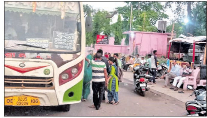
ଜାରକା ବସ୍ ଷ୍ଟାପେଜ

ଉଚ୍ଚ ବିଦ୍ୟାଳୟର ପ୍ରଧାନ ଶିକ୍ଷକ ଶ୍ରୀ ଶ୍ରୀ ରାମଚନ୍ଦ୍ର ମହାପାତ୍ର ଏହାକୁ ନିଜର ଅଧିକାର କରାଯାଇଥିବା ଦାବି କରିଥିଲେ। ଏହାକୁ ନେଇ ବିଦ୍ୟାଳୟର ପ୍ରଧାନ ଶିକ୍ଷକ ଶ୍ରୀ ଶ୍ରୀ ରାମଚନ୍ଦ୍ର ମହାପାତ୍ର ଏହାକୁ ନିଜର ଅଧିକାର କରାଯାଇଥିବା ଦାବି କରିଥିଲେ। ଏହାକୁ ନେଇ ବିଦ୍ୟାଳୟର ପ୍ରଧାନ ଶିକ୍ଷକ ଶ୍ରୀ ଶ୍ରୀ ରାମଚନ୍ଦ୍ର ମହାପାତ୍ର ଏହାକୁ ନିଜର ଅଧିକାର କରାଯାଇଥିବା ଦାବି କରିଥିଲେ।