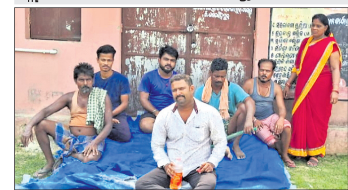
ଅଜ୍ଞାନତ୍ରାଡ଼ି କେନ୍ଦ୍ର ସମ୍ମୁଖରେ ଧାରଣାରେ ବିଦ୍ୟୁତ୍ ସଂଯୋଗ ପାଇବା ପାଇଁ ଗ୍ରାମବାସୀ।

ବିଦ୍ୟୁତ୍ ସଂଯୋଗ ପାଇବା ପାଇଁ ଗ୍ରାମବାସୀ ଘେରିଲେ।