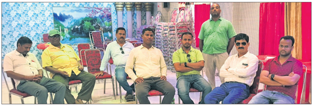
ବନ୍ଧୁମିଳନରେ ଯୋଗଦେଇଥିବା ଖବରଦାତାମାନେ।

ଯାଜପୁର ପ୍ରେସ୍ କ୍ଲବର ବନ୍ଧୁମିଳନ ଦରମା ବୃଦ୍ଧି ଦାବିରେ ସଫେଇ କର୍ମଚାରୀଙ୍କ ଗଣଧାରଣା। ଯାଜପୁର ପ୍ରେସ୍ କ୍ଲବର ବନ୍ଧୁମିଳନ ଦରମା ବୃଦ୍ଧି ଦାବିରେ ସଫେଇ କର୍ମଚାରୀଙ୍କ ଗଣଧାରଣା। ଯାଜପୁର ପ୍ରେସ୍ କ୍ଲବର ବନ୍ଧୁମିଳନ ଦରମା ବୃଦ୍ଧି ଦାବିରେ ସଫେଇ କର୍ମଚାରୀଙ୍କ ଗଣଧାରଣା। ଯାଜପୁର ପ୍ରେସ୍ କ୍ଲବର ବନ୍ଧୁମିଳନ ଦରମା ବୃଦ୍ଧି ଦାବିରେ ସଫେଇ କର୍ମଚାରୀଙ୍କ ଗଣଧାରଣା।