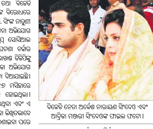
ବିଜେଡି ନେତା ଅର୍ଦ୍ଧଶତାବ୍ଦୀ ବିରୋଧରେ ଏବଂ ଆଦିକା ମଞ୍ଜୁରୀ ବିରୋଧରେ ଚାଳି ଚର୍ଚ୍ଚା ହେଉଛି।