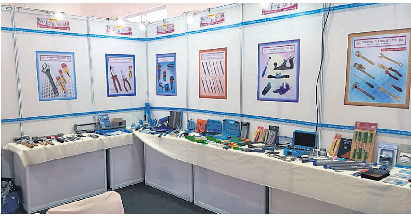
ହାଇଡ୍ରାବଦର ହାଇଲେଭ୍ ପ୍ରଦର୍ଶନୀ କେନ୍ଦ୍ରଠାରେ 'ଇଣ୍ଡୋନା କଲେକ୍ଟିଭ ଆଣ୍ଡ ପେଟିନାରି ଏକ୍ସପୋ-୨୦୨୩' ନିକଟରେ ଅନୁଷ୍ଠିତ ହୋଇଯାଇଛି । ଏହି ପରିପ୍ରେକ୍ଷାରେ ଟାପିଆ ଟୁଲ୍ସ ଏକ ସ୍ୱତନ୍ତ୍ର ଷ୍ଟଲ୍ ସହ ବ୍ରାଣ୍ଡର ସମସ୍ତ ଯନ୍ତ୍ରପାତି ଓ ଉତ୍ପାଦ ପ୍ରଦର୍ଶିତ ହୋଇଛି ।