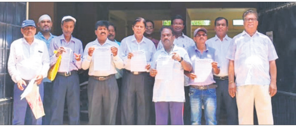
କମିଟି ପକ୍ଷରୁ ଦାବିପତ୍ର ପ୍ରଦାନ ପାଇଁ ଆସିଥିବା କର୍ମକର୍ତ୍ତା।

ବ୍ରହ୍ମପୁର ରେଭିନ୍ୟୁ ଷ୍ଟେଶନଠାରୁ ଲୋଚାପଡ଼ା ରାସ୍ତା ଓ ଡ୍ରେନ୍ କାମ ଦୀର୍ଘ ୪ ବର୍ଷ ଧରି ସମ୍ପୂର୍ଣ୍ଣ ହେଉ ନ ଥିବା ଏବଂ ନିମଗଣ୍ଡି-ରଢ଼ପୁର ରାସ୍ତାକାମ ବର୍ଷାଦିନ ପୂର୍ବରୁ ସାରିବା ପାଇଁ ସହରକିଛି ଅଞ୍ଚଳ ନିର୍ମିତ କ୍ରିୟାନୁଷ୍ଠାନ କମିଟି ଦାବି କରିଛି। ଏ ନେଇ କମିଟି ପକ୍ଷରୁ ସୋମବାର ରାସ୍ତା ଓ କୋଠାପଡ଼ି ବିଭାଜନ ନଂ-୨ର ଅଧୀକ୍ଷଣ ଯନ୍ତ୍ରାଳୟ ଦାବିପତ୍ର ପ୍ରଦାନ କରାଯାଇଛି। ଦାବିପତ୍ରରେ ଉଲ୍ଲେଖ ରହିଛି, ରେଭିନ୍ୟୁ ଷ୍ଟେଶନଠାରୁ ବ୍ରହ୍ମନଗରସ୍ଥିତ ଧୋବାନାଳ ପର୍ଯ୍ୟନ୍ତ ଡିଆରି ହୋଇଥିବା ଡ୍ରେନ୍‌ରେ ଡ୍ରଟ୍ ରହିଛି। ଫଳରେ ଗତ କିଛିଦିନ ତଳେ ବ୍ରହ୍ମନଗରସ୍ଥିତ ରାଧାକୃଷ୍ଣ ମନ୍ଦିରରେ ପାଣି ପଡ଼ିବା ସହ ବହୁଦିନ ଧରି ଲୋଚାପଡ଼ା ରାସ୍ତାରେ ପାଣି ଲହଡ଼ି ମାରିଥିଲା। ପରେ ପରିସ୍ଥିତିରେ ସୁଧାର ଆସିଥିଲେ ମଧ୍ୟ ସେ ଡ୍ରଟ୍ ସଜ୍ଜା ଯାଇ ନାହିଁ। ବର୍ତ୍ତମାନ ଲୋଚାପଡ଼ା ପୁଣ୍ୟରାସ୍ତାରେ ଥିବା ହନୁମାନ ମନ୍ଦିର ନିକଟରେ ପୁଣିଥରେ ଡ୍ରଟ୍‌ସୂଚି ଭାବରେ ମନଲଜ୍ଜା ଡ୍ରେନ୍ ନିର୍ମାଣ କରାଯାଇଛି। ଯାହାଦ୍ୱାରା ଭବିଷ୍ୟତରେ