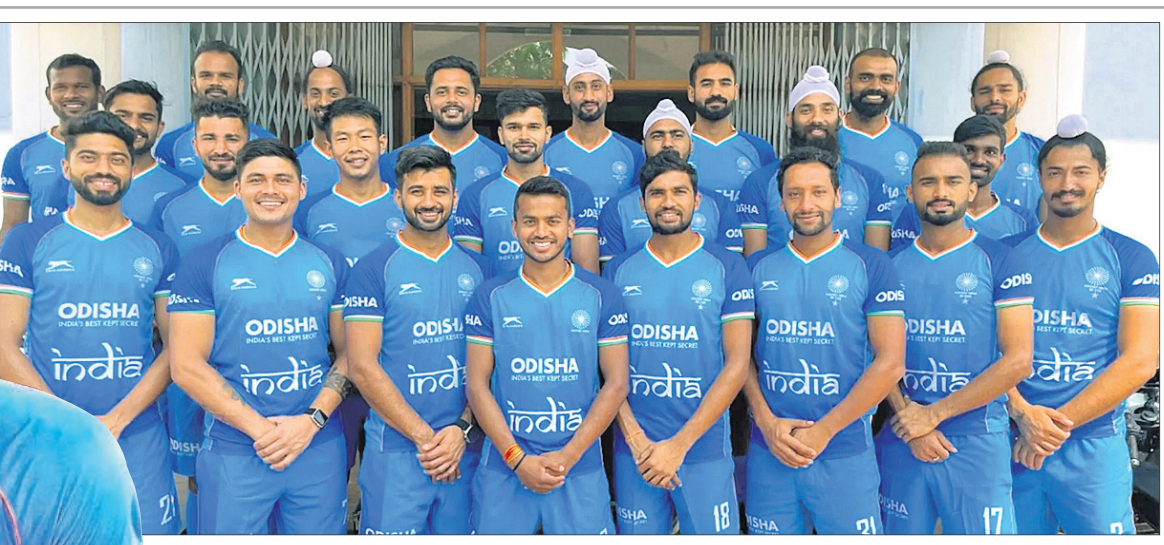
ଏସିଆଇଏଚ୍ ପ୍ରୋ ଲିଗ୍‌ର ଯୁରୋପ ଚରଣ ପାଇଁ ମନୋନାତ ଭାରତୀୟ ଦଳ।

ହରାଇଥିବାବେଳେ ୧୨ ତାରିଖରେ ଅଷ୍ଟ୍ରେଲିଆକୁ ୫-୪ ଗୋଲରେ ପରାସ୍ତ କରିଥିଲା। ଏହାପରେ ୧୩ ତାରିଖରେ ଜର୍ମାନୀକୁ ୬-୩ ଓ ୧୫ରେ ଅଷ୍ଟ୍ରେଲିଆକୁ ଶୁଆଉଟ୍ ୪-୩ ଗୋଲରେ ପରାସ୍ତ କରିଥିଲା। ଅର୍ଥାତ୍ ସ୍ୱେନ୍ ବିପକ୍ଷରେ ଗୋଟିଏ ମ୍ୟାଚକୁ ଛାଡ଼ିଦେଲେ ଭାରତ ଏପର୍ଯ୍ୟନ୍ତ ଅଧିକାଂଶ ମ୍ୟାଚ ହାରିନାହିଁ।