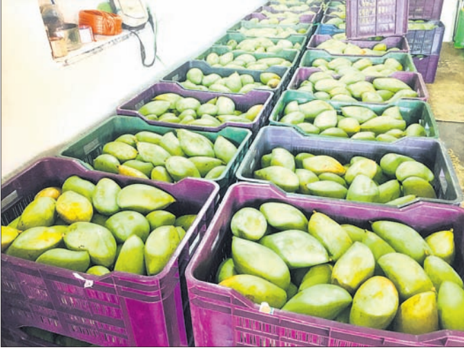
ବଜାରରେ ବିକ୍ରି ଲାଗି ରଖାଯାଇଥିବା ବିଭିନ୍ନ କିମ୍ପାର ଆୟ।

ଗଞ୍ଜାମ ଜିଲ୍ଲା ସମେତ ରାଜ୍ୟ ବାହାରୁ ଆୟ ଉତ୍ପାଦି କ୍ଷେତ୍ରରେ ବ୍ରହ୍ମପୁର ନୀଳକଣ୍ଠେଶ୍ୱର ଆୟ ବଜାର ବିଶେଷ ଚାହିଦା ରହିଛି। ଏହି ବଜାରକୁ ପ୍ରତିଦିନ ୩୬୦ ଟନ୍ ଆୟ ଆସୁଛି। ଏଠାରୁ ଗଞ୍ଜାମ ସମେତ କଟକ, ଭୁବନେଶ୍ୱରକୁ ମଧ୍ୟ ପଠାଯାଉଛି। ଏପରିକି ସମଗ୍ର ଦକ୍ଷିଣ ଓଡ଼ିଶାର ଏହା ଆୟ ବ୍ୟବସାୟର ପେଣ୍ଠାକାନ୍ଥ କହିଲେ ଅତ୍ୟୁକ୍ତି ହେବନାହିଁ। ବଜାରରେ ବର୍ତ୍ତମାନ ଆୟ ବିକ୍ରି ବୃଦ୍ଧି ପାଇଛି। ସୁବର୍ଣ୍ଣରେଖା ଆୟର ଚାହିଦା ଅଧିକ ଥିବା ଜଣାପଡ଼ିଛି।