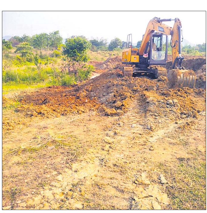
ଏମ୍.ଜି.ଏନ୍.ଆର୍.ଇ.ଏସ୍ କାମ ମେଶିନରେ କରାଯାଉଛି ।

ଏବଂ ଅଣ ଶ୍ରମିକଙ୍କ ବ୍ୟାଙ୍କ ଆକାରକୁ ଟଙ୍କା ପଠାଇ ସେମାନଙ୍କୁ ଶହେ ଦୁଇ ଶହ ଦେଇ ବାକି ଟଙ୍କା ଦଲାଲମାନେ ଉଠାଇ ନେଉଥିବା ଅଭିଯୋଗ ହେଉଛି । ଫଳରେ ପ୍ରକୃତ ଶ୍ରମିକମାନେ କାମ ନ ପାଇ ଦାଦନ ଖଟିବାକୁ ବାହାର ରାଜ୍ୟକୁ ପଳାଉଥିବା ଅଭିଯୋଗ ହେଉଛି । ଏମ୍.ଜି.ଏନ୍.ଆର୍.ଇ.ଏସ୍ ଯୋଜନାରେ ଶ୍ରମିକମାନେ କେତେ କାର୍ଯ୍ୟ କରୁଛନ୍ତି ତାହା କରୁଛି ପଞ୍ଚାୟତରେ ଚାଲିଥିବା ଦୁଇଟି ପୋଖରୀ ଉନ୍ନତୀକରଣ କାର୍ଯ୍ୟକୁ ଦେଖିଲେ ସ୍ପଷ୍ଟ ଭାବେ ବାରି ହୋଇଛି । ଏଠି ଦିନ ତିନିଘଣ୍ଟାରେ କେବଳ ଦ୍ୱାରା ପୋଖରୀ ଖୋଳାଯାଇ ଲକ୍ଷ୍ୟକ ଟଙ୍କା ଚଳୁକରାଯାଇଛି । ଏହି ପୋଖରୀରେ କୌଣସି ଯୋଜନାର ଫଳକ ଲାଗି ନ ଥିବା ବେଳେ ଏହାର କାର୍ଯ୍ୟ ଏମ୍.ଜି.ଏନ୍.ଆର୍.ଇ.ଏସ୍ ଯୋଜନାରେ ହେଉଥିବା ଜଣାଯାଇଛି । ପୋଖରୀ ଖୋଳା କାର୍ଯ୍ୟ ସରିବା ପରେ ସେଠାରେ ଫଳକ ଲଗାଯାଇ କାମ କରି ନ ଥିବା ଲୋକଙ୍କୁ