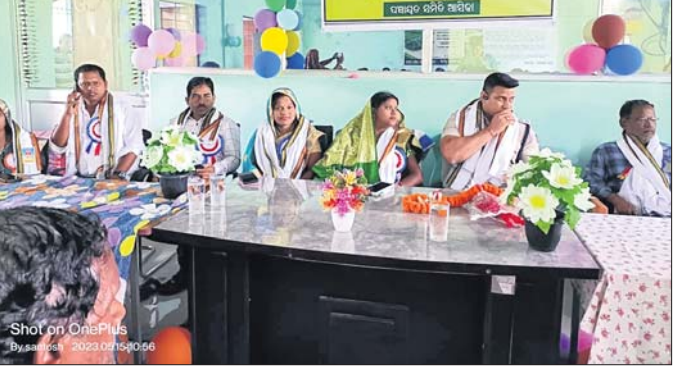
କାର୍ଯ୍ୟକ୍ରମରେ ମଞ୍ଚାସୀନ ଅତିଥି ।