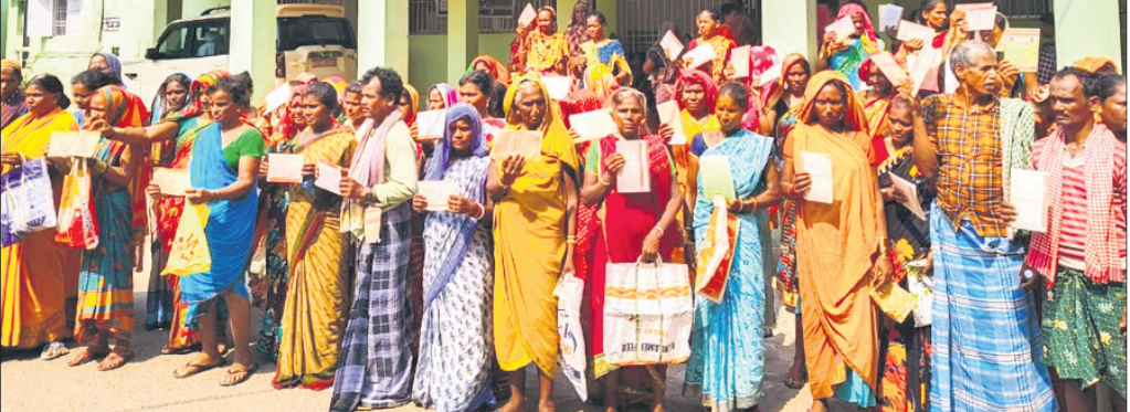
ବ୍ରହ୍ମପୁର ଉପଜିଲ୍ଲାପାଳଙ୍କ କାର୍ଯ୍ୟକ୍ରମ ସମ୍ମୁଖରେ ଶତାଧିକ ମହିଳା।

କୌଣସି ପଦକ୍ଷେପ ଗ୍ରହଣ କରାଯାଇ ନ ଥିବା ଅଭିଯୋଗ ହୋଇଛି। ଏଣୁ ଶ୍ରମିକଙ୍କୁ ପ୍ରାପ୍ୟ ମିଳୁ ନାହିଁ। ଗ୍ରାମସାଥୀ ଏହି ଦୁର୍ଦ୍ଦିନୀର ମୁଖ୍ୟ ବୋଲି ଗ୍ରାମବାସୀ ଅଭିଯୋଗ କରିଛନ୍ତି। ଏପରିକି ବହୁ ଗ୍ରାମବାସୀ ଜବକାର୍ତ୍ତ ପଞ୍ଚାୟତର ପାଇଁ ଆବେଦନ କରିଥିଲେ ମଧ୍ୟ କାର୍ଯ୍ୟକାରୀତା ସଦୃଶ୍ୟ ମାମା ବ୍ୟାନ ସାମଗ୍ରୀୟଙ୍କ ସମେତ ଡି.ପୋଲେଇ ରେଞ୍ଜା, ଡି. ଭେନ୍ ଗୋପାଳ ରେଞ୍ଜା ତଦନ୍ତ କରି ଦୋଷୀଙ୍କ ବିରୋଧରେ ଦୃଢ଼ କାର୍ଯ୍ୟାନୁଷ୍ଠାନ ପାଇଁ ଗ୍ରାମବାସୀ ଦାବି କରିଛନ୍ତି। ଦାବିପତ୍ର ପ୍ରଦାନ ସମୟରେ ରାଜ୍ୟ ମହିଳା ମୋର୍ଚ୍ଚା