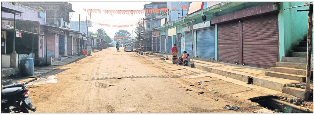
ସିମନବାଡ଼ିରେ ସମସ୍ତ ଦୋକାନ ବନ୍ଦ ରହିଛି ।

ଗାଡ଼ି ଚଳାଚଳ ସ୍ୱାଭାବିକ, ସିମନବାଡ଼ିରେ ସମସ୍ତ ଦୋକାନ ବନ୍ଦାର ବନ୍ଦ