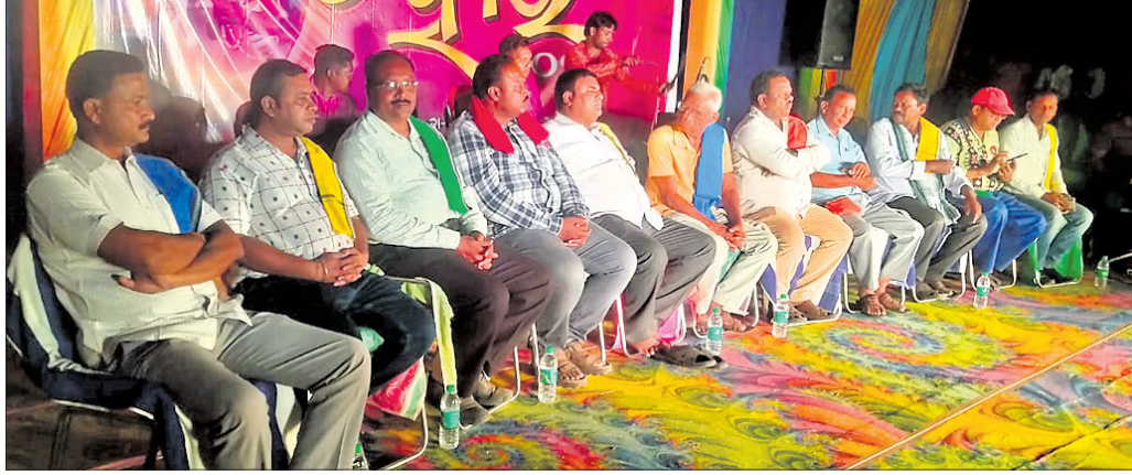
ମହୋତ୍ସବରେ ଯୋଗ ଦେଇଥିବା ଅଭିଯତ୍ରି

ବୌଦ୍ଧ ଜିଲ୍ଲା କଣ୍ଠାମାଳ ବୁଦ୍ଧ ଶିଳ୍ପିମିଳନ ପଞ୍ଚାଶ ଶତାବ୍ଦୀ ସାଂସ୍କୃତିକ ଅନୁଷ୍ଠାନ ଦ୍ୱାରା ଆୟୋଜିତ ତିହାର ମହୋତ୍ସବ-୨୦୨୩ ରବିବାର ଉଦ୍‌ଘାଟିତ ହୋଇଯାଇଛି।