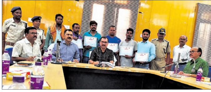
ସଡ଼କ ପୁରସ୍କାର କମିଟି ବୈଠକରେ ପୁରସ୍କୃତ ହୋଇଥିବା ସ୍ୱେଚ୍ଛାସେବୀ

ଜିଲ୍ଲାସ୍ତରୀୟ ସଡ଼କ ପୁରସ୍କାର କମିଟି ବୈଠକ ଜିଲ୍ଲାପାଳଙ୍କ ସମ୍ମୁଖରେ ଯୋଜନା କରାଯାଇଛି।