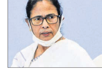
କହିଛନ୍ତି, ୨୦୨୪ ଲଢ଼େଇରେ ଆଞ୍ଚଳିକ ଦଳକୁ ଉଲ୍ଲେଖନୀୟ ଭୂମିକା ମିଳିବ। ଆବଶ୍ୟକ। ଏହି ଅବସରରେ କଂଗ୍ରେସକୁ ସାଥରେ ନେବା ପାଇଁ ସେ ସୂଚନା ଦେଇଛନ୍ତି। ଯେଉଁଠି ଆଞ୍ଚଳିକ ଦଳ ଦୁର୍ବଳ, ସେଠାରେ ଭାବପାତ୍ର ପ୍ରତିସ୍ପର୍ଦ୍ଧା କରିପାରୁ ନାହିଁ। କର୍ମଚର ଜନାଦେଶ ଭାବପାତ୍ର ବିରୋଧରେ ରାୟ। ମଧ୍ୟରେ ମତପାର୍ଥକ୍ୟ ଦୂର କରିବା ଦିନରେ କାମ କରିବାକୁ ସେ ପ୍ରସ୍ତାବ ଦେଇଛନ୍ତି, ଯେଉଁଥିରେ କଂଗ୍ରେସକୁ ସାମିଲ କରିବା ଯୋଜନା ରହିଛି। ରାଜ୍ୟ ସର୍ବୋଚ୍ଚ ନେତୃତ୍ୱ ଏକ ଖବରଦାତା ସମ୍ମିଳନୀରେ ମମତା