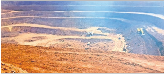
ଯୋଡ଼ା ଖଣି ମଞ୍ଚଳରେ ଥିବା ଏକ ଖଣି।

ସେଥିମଧ୍ୟରୁ ୧୪, ୭୯୩ କୋଟି ୭୧ ଲକ୍ଷ ୮୯ ହଜାର ୭୧୩ ଟଙ୍କା ଆଦାୟ ହୋଇଥିଲା। ସେଥିମଧ୍ୟରୁ ପ୍ରାୟ ୪୪୯୭ କୋଟି ୦୯ ଲକ୍ଷ ୮୩ ହଜାର ୭୧୦ ଟଙ୍କା ବକେୟା ଅର୍ଥ କେତେଜଣ ଖଣି ଲିଜ୍‌ଧାରୀଙ୍କ ପାଖରେ ଅନାଦେୟ ୬୮ ଖଣିକୁ ପ୍ରାୟ ୧୯,୨୯୦ କୋଟି ୮୧ ଲକ୍ଷ ୭୩ ହଜାର ୪୨୩ ଟଙ୍କା କ୍ଷତି ଭରଣା କରିବାକୁ ନିର୍ଦ୍ଦେଶ ହୋଇଥିଲା।