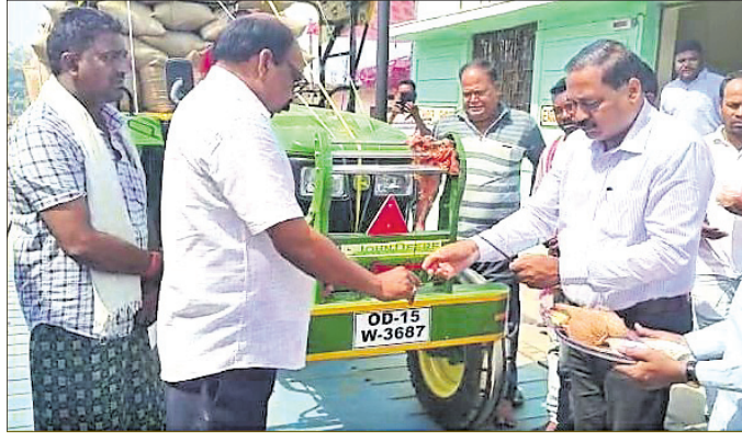
ରବିଧାନ ସଂଗ୍ରହର ଶୁଭାରମ୍ଭ କରାଯାଇଛି ।

ସମ୍ବଲପୁର ଜିଲ୍ଲାରେ ଚଳିତ ରବି ଧାନ ସଂଗ୍ରହ ଆରମ୍ଭ ହୋଇଛି । ସୋମବାର ବରଜପାଲି ମାର୍କେଟ ଯାଏଁ ପ୍ରଶାସନ ପକ୍ଷରୁ ଅନୁଷ୍ଠାନିକ ଭାବେ ଏହାର ଶୁଭାରମ୍ଭ କରାଯାଇଥିଲା ।