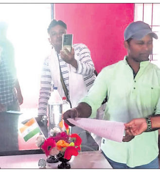
ଖାର୍ଡ ସଭ୍ୟାସଭ୍ୟ ଇସ୍ତଫା ପତ୍ର ପ୍ରଦାନ କରୁଛନ୍ତି।

ପଞ୍ଚାୟତର ଜନସାଧାରଣଙ୍କ ସମ୍ମୁଖରେ ସମାଧାନ କରିବାକୁ ଖାର୍ଡ ସଭ୍ୟ ଭାବେ ନିର୍ବାଚିତ ହୋଇଥିଲେ।