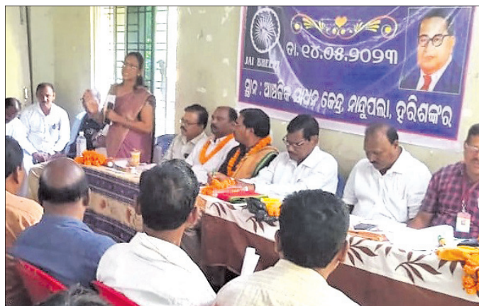
ସମାବେଶରେ ମହାସଭା ଅଭିଯତ୍ରି

ବଲାଙ୍ଗୀର ଜିଲ୍ଲା ଖପ୍ରାଖୋଲ ବୁଦ୍ଧ ହରିଶଙ୍କର ପର୍ଯ୍ୟଟନ ବିଭାଗ ଅଭ୍ୟର୍ଥନା କେନ୍ଦ୍ରଠାରେ ପାଟଣାଗଡ଼ ଉପଖଣ୍ଡ ଲକ୍ଷ୍ମଣର ଗଣ୍ଡା ସମାଜ ଆହ୍ୱାନରେ ସମାବେଶ ରବିବାର ଅନୁଷ୍ଠିତ ହୋଇଯାଇଛି।