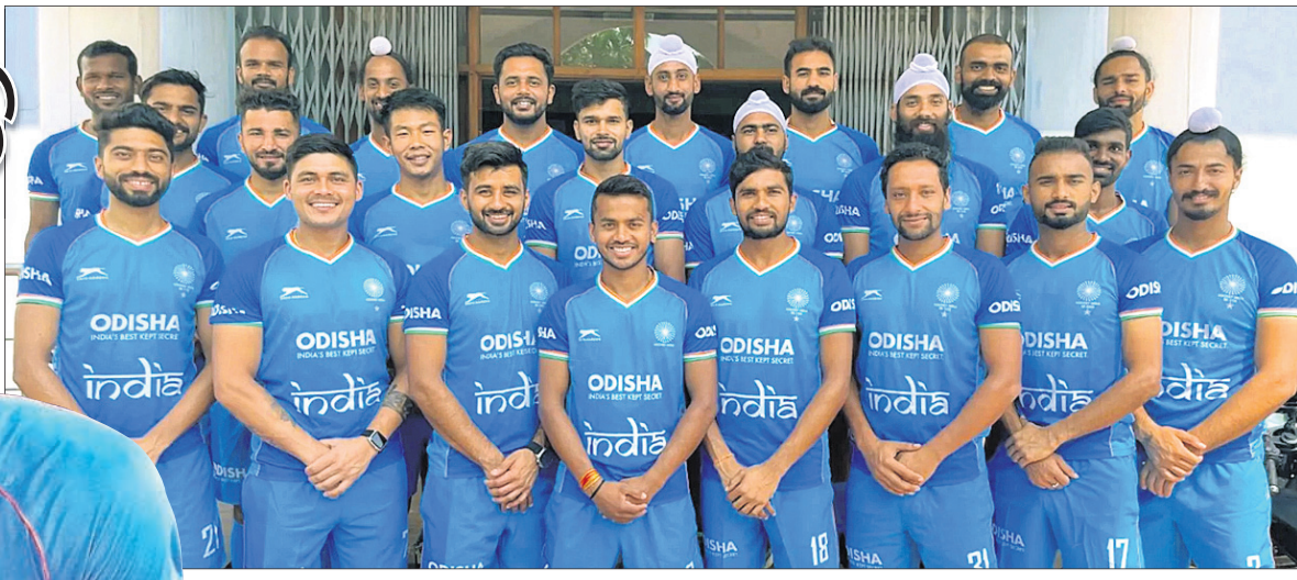
ଏସିଆଇଏଚ୍ ପ୍ରୋ ଲିଗ୍‌ର ଯୁରୋପ ଚରଣ ପାଇଁ ମନୋନାତ ଭାରତୀୟ ଦଳ।

ହରାଇଥିବାବେଳେ ୧୨ ଚାରିଖରେ ଅଷ୍ଟ୍ରେଲିଆକୁ ୫-୪ ଗୋଲରେ ପରାସ୍ତ କରିଥିଲା। ଏହାପରେ ୧୩ ଚାରିଖରେ ଜର୍ମାନୀକୁ ୬-୩ ଓ ୧୫ରେ ଅଷ୍ଟ୍ରେଲିଆକୁ ଶୁଆଉଟ୍ ୪-୩ ଗୋଲରେ ପରାସ୍ତ କରିଥିଲା। ଅର୍ଥାତ୍ ସ୍ନେକ୍ ବିପକ୍ଷରେ ଗୋଟିଏ ମ୍ୟାଚକୁ ଛାଡ଼ିଦେଲେ ଭାରତ ଏପର୍ଯ୍ୟନ୍ତ ଅନ୍ୟ କୌଣସି ମ୍ୟାଚ ହାରିନାହିଁ।