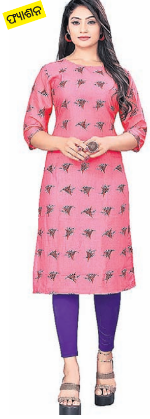
ଏଥିରେ ଆପଣ ଫ୍ଲୋରାଲ ପ୍ରିଣ୍ଟ୍ ସହିତ ସ୍ଟ୍ରେଟ୍ ପ୍ୟାଣ୍ଟ ମଧ୍ୟ ପିନ୍ଧିପାରିବେ।

ଏମ୍ପ୍ଲୋଏଡୋରି କୁର୍ତ୍ତ : ଏହି କୁର୍ତ୍ତ ଗରମ ଦିନରେ ପିନ୍ଧିବାକୁ କମ୍‌ବେକଲ୍ ଲାଗିଥାଏ। ଆପଣ ଏହି ଷ୍ଟାଇଲ୍ ଏମ୍ପ୍ଲୋଏଡୋରି ପ୍ରିଣ୍ଟ୍‌ଡ୍ କୁର୍ତ୍ତକୁ ଜିନ୍‌ସ୍ ଆରମ୍ଭକରି ଲେକ୍‌ସି ସହିତ ମଧ୍ୟ ପିନ୍ଧିପାରିବେ। ଏହାକୁ ହୁସ୍ ସହିତ ଷ୍ଟାଇଲ୍ କରନ୍ତୁ। ପ୍ରିଣ୍ଟ୍‌ଡ୍ କୁର୍ତ୍ତ : ଯଦି ଆପଣ ଲାଇଟ୍ ଡେଫ୍ ପିନ୍ଧିବାକୁ ଚାହୁଁଥାନ୍ତି ତେବେ ଏମିତିରେ ପ୍ରିଣ୍ଟ୍‌ଡ୍ କୁର୍ତ୍ତ ପିନ୍ଧିପାରିବେ। ବାନ୍ଧେଣି ପ୍ରିଣ୍ଟ୍ କୁର୍ତ୍ତକୁ ଅକ୍ଟୋକାଲ୍ କୁ ବଲେରି ପିନ୍ଧିବା ଦ୍ୱାରା ଏହା ଭଲ ମାନିଥାଏ। ଫ୍ଲୋ କୁର୍ତ୍ତ : ଆପଣ ଯଦି ଷର୍ଟ୍ ପିନ୍ଧିଥାନ୍ତି ତେବେ ଫ୍ଲୋ କୁର୍ତ୍ତକୁ ପ୍ରାଥମିକ କିମ୍ବା କୁଲିଫ୍ ସହିତ ଷ୍ଟାଇଲ୍ କରି ପିନ୍ଧିପାରିବେ। ପ୍ଲେନ୍ କୁର୍ତ୍ତ : ପ୍ଲେନ୍ କୁର୍ତ୍ତକୁ ଯଦି ଆପଣ ମାଟି ପ୍ଲାଇଡ୍ ସହ କ୍ୟାମି କରିବେ ତେବେ ଆପଣଙ୍କ ଲୁକ୍ ବହୁତ ସୁନ୍ଦର ଲାଗିବ। ଏହା ସହିତ ପ୍ରିଣ୍ଟ୍‌ଡ୍ ଟୁପ୍‌ଡା କ୍ୟାମି କରି ନିଜ ଷ୍ଟାଇଲ୍‌କୁ ଏନ୍‌ହାନ୍ସ କରନ୍ତୁ। ଶର୍ଟ୍ କୁର୍ତ୍ତ : ଶର୍ଟ୍ କୁର୍ତ୍ତକୁ ବି ଆପଣ ନିଜର ଷ୍ଟାଇଲିଷ୍ଟ ଲୁକ୍ ପାଇଁ ଚଏସ୍ କରିପାରିବେ। ଆପଣ ଏହି ଶର୍ଟ୍ କୁର୍ତ୍ତକୁ ପ୍ଲାଇଡ୍ କିମ୍ବା ଜିନ୍ସ ସହ ପେୟାରକରି ପିନ୍ଧିପାରିବେ। ଅର୍ଡ଼ିଫ୍ ଲୁକ୍‌ରେ ଏହି କୁର୍ତ୍ତ ବହୁତ ଭଲ ମାନିଥାଏ। ଷ୍ଟ୍ରେଟ୍ କୁର୍ତ୍ତ : ଏଭଳି କୁର୍ତ୍ତ ପିନ୍ଧିବା ଦ୍ୱାରା ଏହା ଆପଣଙ୍କୁ ଫ୍ଲିଫ୍ ଲୁକ୍ ଦେଇଥାଏ।