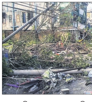
ବାଗ୍ରେ ଜିଲ୍ଲାର ୧୭ ସହର କ୍ଷତିଗ୍ରସ୍ତ ହୋଇଥିବା କର୍ତ୍ତୃପକ୍ଷ କହିଛନ୍ତି। ଫିର, ମାନାଉଜ, ରାମ୍‌ପି, ଆନ, ସିବ୍‌ଡ଼େ, ପାରକଟ, ପୋନାଲିଅମ, ଗଢ଼ା ଆଦି ଜିଲ୍ଲାକୁ ପ୍ରାକୃତିକ ବିପର୍ଯ୍ୟୟ ପ୍ରବଳ ଅଞ୍ଚଳ ଭାବେ ଘୋଷଣା କରାଯାଇଛି। ପ୍ରଭାବିତ

ବାଦ୍ୟା ମୋଟା ପ୍ରଭାବରେ ବ୍ୟାଲବେଶ ଓ ମ୍ୟାନ୍‌ମାରରେ ବହୁ କ୍ଷତି ଘଟିଛି। ବର୍ଷା ଓ ଭାଷଣ ପଦନ ଯୋଗୁ ବିଭିନ୍ନ ସ୍ଥାନରେ ଶୋଚନୀୟ ପରିସ୍ଥିତି ସୃଷ୍ଟି ହୋଇଛି। ୫ ଡ଼େର ବଳ ରଖୁଥିବା ମୋଟାର ୫ ଜଣଙ୍କ ମୃତ୍ୟୁ ଘଟିଥିବାବେଳେ ଅନେକ ଏବେ ବାସସହରା ହୋଇଛନ୍ତି। ବ୍ୟାଲବେଶରେ ଥିବା ବିଶ୍ୱର ସବୁକୁ ଦେଖି ଶରଣାର୍ଥୀ ବାରିଲ ହେବାକୁ ଯେଉଁମାନେ କ୍ଷତିଗ୍ରସ୍ତ ହେଲେ ସେମାନଙ୍କୁ କ୍ଷତିପୂରଣ ଦେବା ଲାଗି ପାଇଲଟ୍ ଦାବି କରିଛନ୍ତି। ଗତ ମାସରେ ମଧ୍ୟ ପାଇଲଟ୍ ଦୁର୍ନୀତି ବିରୋଧରେ କାର୍ଯ୍ୟାନୁଷ୍ଠାନ ଦାବିରେ ପଡ଼ିଥିବାବେଳେ ରାଜସ୍ଥାନ କଂଗ୍ରେସରେ