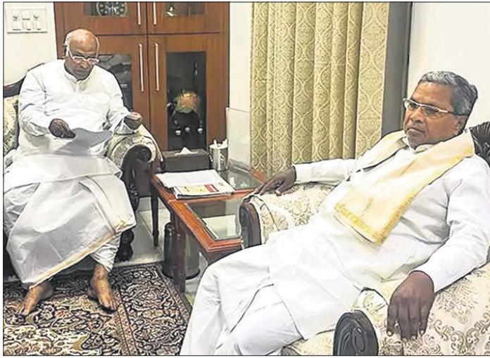
କଂଗ୍ରେସ ଅଧକ୍ଷ ମଲ୍ଲିକାର୍ଜୁନ ଖାର୍ଯ୍ୟକ ନୂଆଦିଲ୍ଲୀରେ ବାସଭବନରେ ତାଙ୍କୁ କର୍ମାଚକ ରାଜ୍ୟ କଂଗ୍ରେସ ସଭାପତି ଡି.କେ. ଶିବକୁମାର ଓ ବରିଷ୍ଠ ନେତା ସିଦ୍ଧାରାମାୟା ଭେଟୁଛନ୍ତି ।