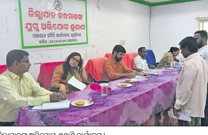
ଜିଲାପାଳଙ୍କ ଅଭିଯୋଗ ଶୁଣାଣି କାର୍ଯ୍ୟକ୍ରମ।