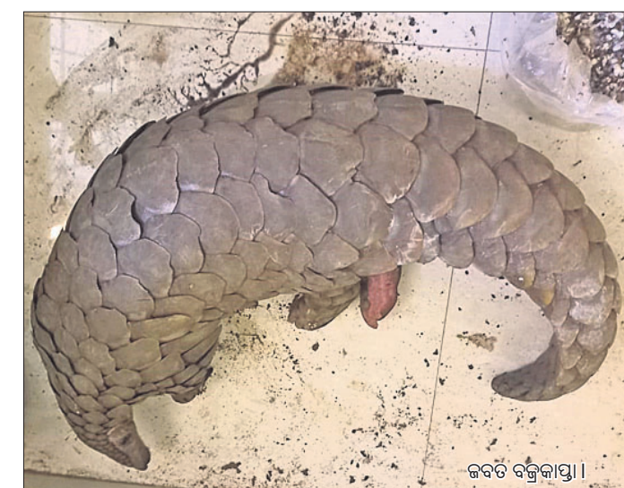
ଜବତ ବଜ୍ରକାୟା ।

କେନ୍ଦ୍ରୁଝର ବନଖଣ୍ଡ ଭୂୟାଁ-କୁଆଙ୍ଗ ପାଠ ଉପଖଣ୍ଡ ଅନ୍ତର୍ଗତ କାଞ୍ଜିପାଣି ସେକ୍ଟର ଗାଙ୍ଗପଡ଼ା ଗ୍ରାମରେ ଜଣେ ବ୍ୟକ୍ତି ଏକ ବଜ୍ରକାୟା ରଖି ବିକ୍ରି ଯୋଜନା କରୁଥିବାବେଳେ ବନ ବିଭାଗ କର୍ମଚାରୀ ଗ୍ରାହକ ବେଶରେ ଯାଇ ତାଙ୍କୁ ଧରିଛନ୍ତି । ତାଙ୍କଠାରୁ ୩ବର୍ଷ ବୟସ୍କ ଏକ ମାଛ ବଜ୍ରକାୟା ଉଦ୍ଧାର କରାଯାଇଛି । ତାର ଓଜନ ୧୦କେଜି ଏବଂ ଲମ୍ବ ଅଢେଇ ଫୁଟ ହେବ ବୋଲି ଜଣାପଡ଼ିଛି । ବଜ୍ରକାୟାକୁ ଭୂୟାଁ-କୁଆଙ୍ଗ ଉପଖଣ୍ଡ କାର୍ଯ୍ୟାଳୟରେ ରଖାଯାଇ ଖାଇଲୁ ଲାଖି ଗ୍ରହଣ ଅର୍ଥ ଲକ୍ଷ୍ମୀଆର ଡାକ୍ତର ବ୍ରଜରାଜ ଯାଦବ ଚିକିତ୍ସା କରୁଛନ୍ତି । ସୂଚନା ଅନୁଯାୟୀ, ତେଲକୋଇ ଉପଖଣ୍ଡ ସିଲ୍ଲିକାବାହାଳ ଜଙ୍ଗଲ ଉପଖଣ୍ଡ ପର୍ବତରୁ ଗାଙ୍ଗପଡ଼ା ଗ୍ରାମର ଜଣେ