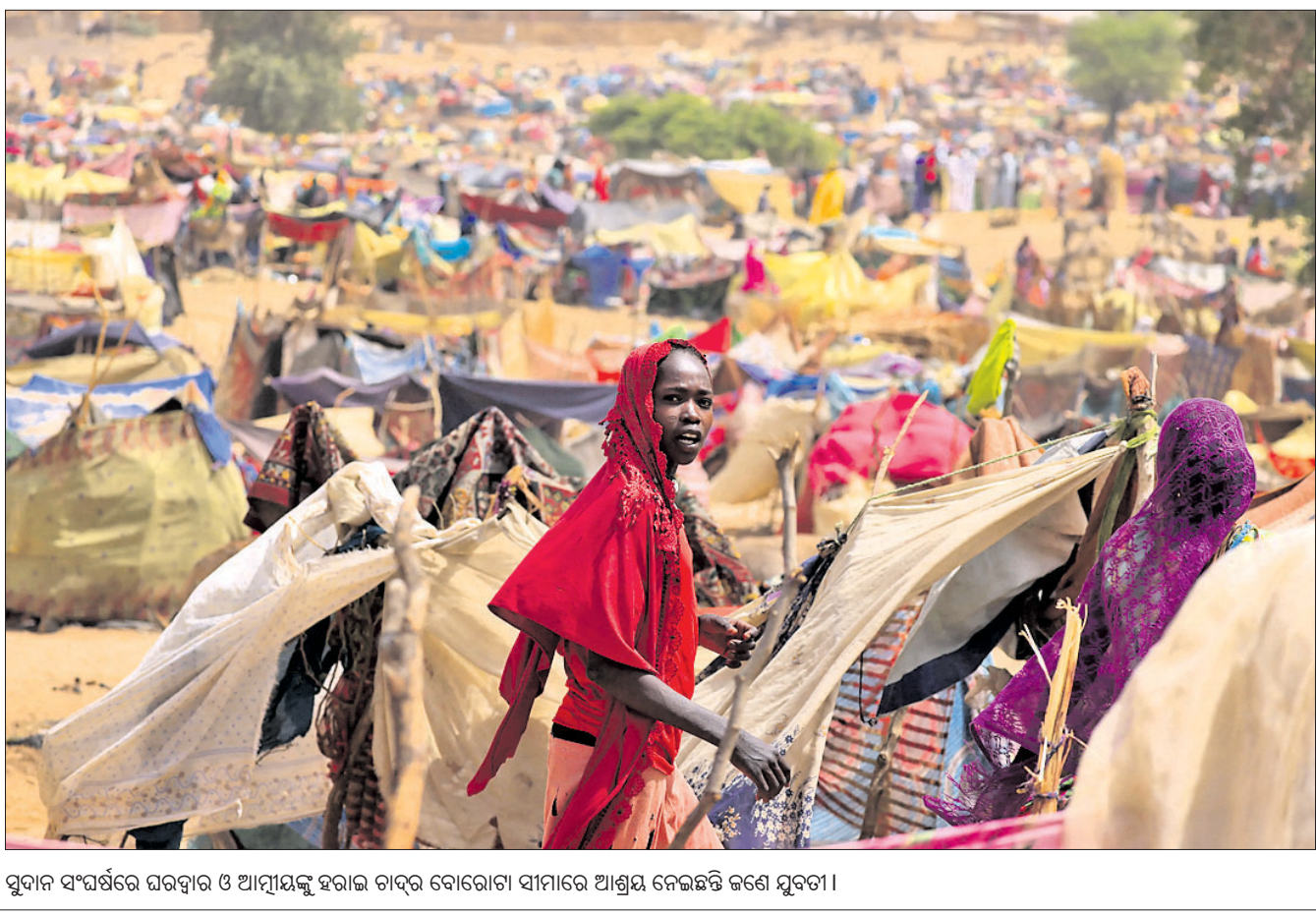
ସୁଦାନ ସଂଘର୍ଷରେ ଘରଫାର ଓ ଆତ୍ମୀୟତା ହରାଇ ଚାନ୍ଦ ବୋରୋଗା ସାମାଜିକ ଆଶ୍ରୟ ନେଇଛନ୍ତି ଜଣେ ସୁଦାନୀ।

ବେଙ୍ଗାଳ, ୧୬୫: ତାମିଲନାଡୁରେ ବିଶାଳ ମତମୁଦ୍ରେତା ମୁଦ୍ରେତା ଘଟଣା ମଙ୍ଗଳବାର ୧୯ରେ ପହଞ୍ଚିଛି। ଭିଲ୍ଲୁପୁରମ୍ ପୋଲିସ୍ କର୍ମଚାରୀଙ୍କୁ ଅନୁଯାୟୀ, ମଙ୍ଗଳବାର ସକାଳେ ଉକ୍ତ ଜିଲ୍ଲାର ୨ ଜଣ ସରକାରୀ ହସ୍ପିଟାଲରେ ଚିକିତ୍ସାଧୀନ ଅବସ୍ଥାରେ ପ୍ରାଣ ହରାଇଛନ୍ତି। ରାଜ୍ୟରେ ଦେଖାଦେଇ ମତ ବିକ୍ରି ସମ୍ପର୍କିତ ବନ୍ଦ ଦାବିରେ ମତମୁଦ୍ରେତା ସମ୍ପର୍କିତ ମତମୁଦ୍ରେତା ପୂର୍ବରୁ-ଚିକିତ୍ସାଧୀନ ରାଷ୍ଟ୍ରୀୟ ଅବସ୍ଥାରେ କରିଥିଲେ। ସୁତରାଫ, ଗତ ଶନିବାର ଭିଲ୍ଲୁପୁରମ୍ ଜିଲ୍ଲା ମରକତମ ଅନ୍ତର୍ଗତ ଏକିୟାରାକୁପୁମ୍ ଗ୍ରାମରେ ଏକ ବିବାହ ଉତ୍ସବରେ ସ୍ଥାନୀୟ ମତ ପିଲ ୫୦ ଜଣ ଅସୁସ୍ଥ ହୋଇ ପଡ଼ିଥିଲେ। ସେମାନଙ୍କୁ ହସ୍ପିଟାଲ ନିଆଯାଇଥିବାବେଳେ ରବିବାର ୧୧ ଜଣଙ୍କର ମୃତ୍ୟୁ ଘଟିଥିଲା। ସୋମବାର ୬ ଜଣ ପ୍ରାଣ ହରାଇଥିବାବେଳେ ମଙ୍ଗଳବାର ଆଉ ୨ ଜଣଙ୍କ ଜୀବନ ଯାଇଛି।