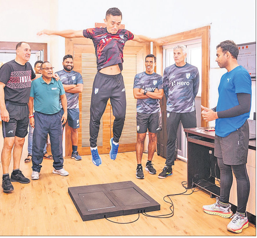
କଳିଙ୍ଗ ଷ୍ଟାଡ଼ିୟମରେ ଆରମ୍ଭ ହେବାକୁ ଯାଉଥିବା ହିରୋ ଇଣ୍ଟରକଣ୍ଟିନେଣ୍ଟାଲ କପ୍ ପୁରୀର ଚୁନାମେଣ୍ଟ ପୂର୍ବରୁ ମଙ୍ଗଳବାର ଖେଳା ଉଦ୍ଦେଶ୍ୟ ସେକ୍ଟର ଅଫ୍ ଏକ୍ସିଲେନ୍ସଠାରେ ଭାରତୀୟ ଖେଳାଳିଙ୍କ ପିଟିଂରେ ଥିଲା।