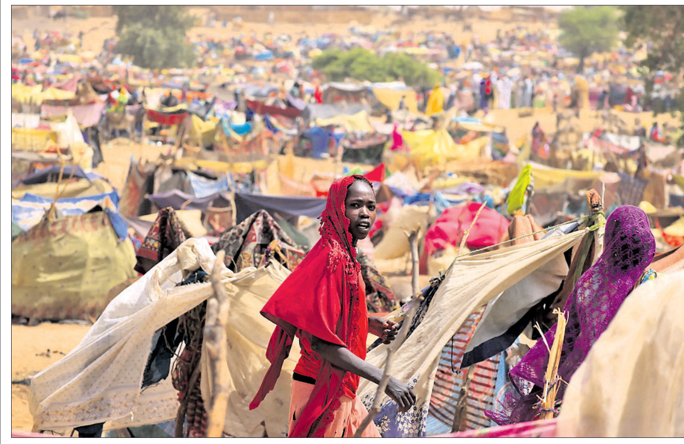
ସୁଦାନ ସଂଘର୍ଷରେ ଘରଫାର ଓ ଆତ୍ମୀୟଙ୍କୁ ହରାଇ ଚାନ୍ଦ୍ ବୋରୋଟା ସାମାଜିକ ଆଶ୍ରୟ ନେଇଛନ୍ତି ଜଣେ ସୁଦାନୀ।

ନୂଆଦିଲ୍ଲୀ, ୧୬୫: କେନ୍ଦ୍ର ସଚିବ ସଚିବର ଦଳ ଓ ରାଜପତ ମନ୍ତ୍ରୀ ନାଟକ ଗଡ଼ଜାତୀୟ ହତ୍ୟା ଧମକ ପିଲିବା ପରେ ଦିଲ୍ଲୀ ପୋଲିସ୍ ଏହାର ତଦନ୍ତ ଚଳାଇଛି। ଗଡ଼ଜାତୀୟ ହତ୍ୟା ଧମକ ପିଲିବା ପରେ ଦିଲ୍ଲୀ ପୋଲିସ୍ ଏହାର ତଦନ୍ତ ଚଳାଇଛି। ଗଡ଼ଜାତୀୟ ହତ୍ୟା ଧମକ ପିଲିବା ପରେ ଦିଲ୍ଲୀ ପୋଲିସ୍ ଏହାର ତଦନ୍ତ ଚଳାଇଛି। ଗଡ଼ଜାତୀୟ ହତ୍ୟା ଧମକ ପିଲିବା ପରେ ଦିଲ୍ଲୀ ପୋଲିସ୍ ଏହାର ତଦନ୍ତ ଚଳାଇଛି।