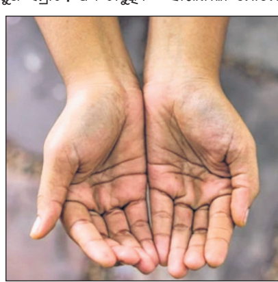
ମୂଲ୍ୟହୀନ । ସେସବୁ ତା'ର ଜୀବନରକ୍ଷା ପାଇଁ ସାମାନ୍ୟମାତ୍ର ସାହାଯ୍ୟ କରିପାରିଲେ ନାହିଁ କି କାଣି କହୁଥିବେ ମଧ୍ୟ ତା' ସହ ଗଲେ ନାହିଁ ।

ହାତରେ ଏ ମୁଦ୍ରାଟି ଧରାଇଦେଲି । ଆଲେକ୍ସାଣ୍ଡର ଅତ୍ୟନ୍ତ ଉତ୍ସାହ ହୋଇ କହିଲେ- ଜାଣିଛ ତ ମୁଁ ବିଶ୍ୱବିଜୟୀ ଗ୍ରାକ୍ତବୀର ଆଲେକ୍ସାଣ୍ଡର । ପୃଥିବୀର ସମସ୍ତ ସ୍ୱାଧିକାର ଓ ପ୍ରାକୃତ୍ୟ ମୋର ପଦାନତ । ଏହା ସତ୍ତ୍ୱେ ମୋତେ ଭିକାରି ବୋଲି କହିବାର ଧୂଷ୍ଟତା ପାଇଁ ମୁଁ ତୁମର ଶିରଚ୍ଛେଦ କରିପାରେ । ଅବିଚଳ ଦାଓଜିନସ୍ ଅଳ୍ପ ହସି କହିଲେ- "ମୋର କିଛି ନାହିଁ, ତେଣୁ ମୁଁ ଭିକାରି ହେବାକୁ ବାଧ୍ୟ । ତୁମର ଏତେସବୁ ଥିବା ସତ୍ତ୍ୱେ ଆହୁରି ପାଇବା ପାଇଁ ତୁମର ଏ ଯେଉଁ ଭୋକ, ତାହା କ'ଣ ପାଇଁ ? ତୁମେ ମୋଠାରୁ ବଡ଼ ଭିକାରି ନୁହଁ କି ? ଶୁଣ ସମ୍ରାଟ୍ ! ଯିଏ ଚାହୁଁଥିବ କୋଟିଏ କିନ୍ତୁ ପାଇଥିବ ଗୋଟିଏ, ସେ ଏ ସଂସାରର ସବୁଠାରୁ ବଡ଼ ଦରିଦ୍ର । ଯିଏ ଜୀବନରେ କିଛି ଚାହିଁ ନାହିଁ, କିଛି ପାଇ ବି ନାହିଁ, ସିଏ ଧନୀ ନ ହୋଇପାରେ, କିନ୍ତୁ ତୁମ ଭଳି ଦରିଦ୍ର ତୁମେ ନୁହଁ । ଆବଶ୍ୟକତାଠାରୁ ଅଧିକ, କ୍ଷମତା ଓ ପ୍ରତିପତ୍ତିର ପିପାସା ହିଁ ପ୍ରକୃତ ଦାରିଦ୍ର୍ୟ । ଯାହାର ଦୃଷ୍ଟି ବା ଅଭିଳାଷ ଯେତେ ଅଧିକ, ସେ ସେତେ ଅଧିକ ଦରିଦ୍ର । ଯାହାର ମନ ସନ୍ତୁଷ୍ଟ ଓ ତୃପ୍ତ, ତା' ପାଇଁ ଧନୀଦରିଦ୍ର କି ଫରକ ? ଏଥର କୁହ, ତୁମେ ଭିକାରି ନା ମୁଁ ଭିକାରି ? ବାସ୍ତବରେ ଏ ସଂସାରରେ ଭିକାରି କିଏ ? ଭିକାରି ସିଏ ନୁହେଁ ଯିଏ ଅନ୍ୟ ଆଗରେ ହାତ ପତେଇ ଭିକା ମାଗେ, ପ୍ରକୃତ ଭିକାରି ତ ସିଏ ଯାହା ପାଖରେ ସବୁ ଥାଇ ମଧ୍ୟ ସେ ଆହୁରି ଚାହୁଁଥାଏ । ପାଠକେ ! ଏଭଳି ଏକ ପ୍ରସଙ୍ଗ ଏଠି ଅବତାରଣା କରିବାର ଉଦ୍ଦେଶ୍ୟ ହେଉଛି ଏହା ଯେ, ବିଷ ଅଭିଯାନରେ ବାହାରିଥିବା ସମ୍ରାଟ୍ ଆଲେକ୍ସାଣ୍ଡର ନିଜ ଦେଶକୁ ମଧ୍ୟ ଫେରିପାରିଲେ ନାହିଁ । ଭାରତ ଅଭିଯାନ ସାରି ଫେରିବା ବାଟରେ ବେବିଲୋନ ନଗରୀରେ ମାତ୍ର ୩୩ବର୍ଷ ବୟସରେ ସେ