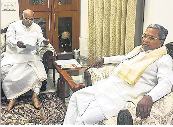
କଂଗ୍ରେସ ଅଧକ୍ଷ ମଲ୍ଲିକାର୍ଜୁନ ଖାର୍ଯ୍ୟକ ନୂଆଦିଲ୍ଲୀରେ ବାସଭବନରେ ତାଙ୍କୁ କର୍ମାଚକ ରାଜ୍ୟ କଂଗ୍ରେସ ସଭାପତି ଡି.କେ. ଶିବକୁମାର ଓ ବରିଷ୍ଠ ନେତା ସିଦ୍ଧାରାମାୟା ଭେଟୁଛନ୍ତି ।

ନୂଆଦିଲ୍ଲୀ, ୧୬/୫ କର୍ମାଚକ ବିଧାନସଭା ନିର୍ବାଚନ ଫଳାଫଳ ପ୍ରକାଶ ପାଇବା ୩ ଦିନ ବିତିଥିଲେ ମଧ୍ୟ ମୁଖ୍ୟମନ୍ତ୍ରୀ କିଏ ହେବେ ତାକୁ ନେଇ କଂଗ୍ରେସରେ ଉତ୍ତୁକତା ଜାରି ରହିଛି । ଦୁଇ ମୁଖ୍ୟମନ୍ତ୍ରୀ ଦାବିଦାର ଡି.କେ. ଶିବକୁମାର ଏବଂ ସିଦ୍ଧାରାମାୟା ମଙ୍ଗଳବାର ସନ୍ଧ୍ୟାରେ ବକ୍ ଅଧକ୍ଷ ମଲ୍ଲିକାର୍ଜୁନ ଖାର୍ଯ୍ୟକଙ୍କୁ ଅଲଗା