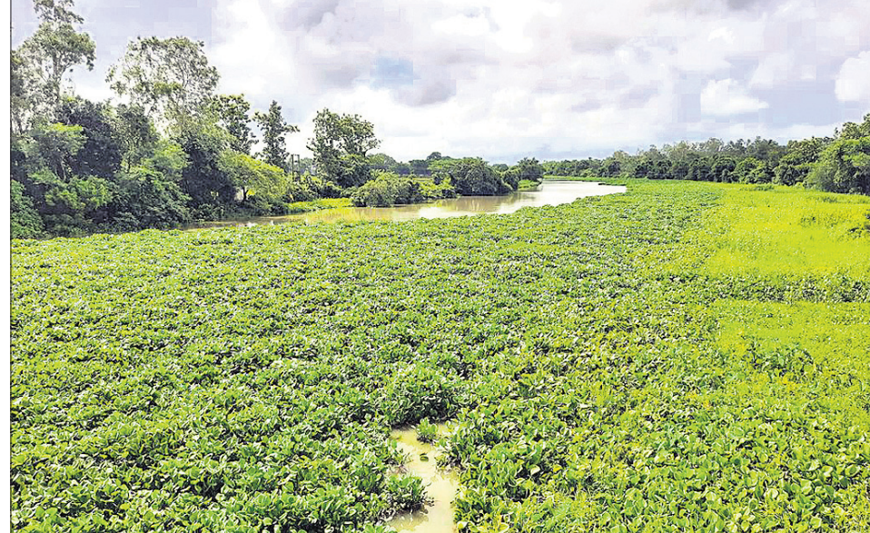
ବିଲାତି ଦଳ ଭରି ହୋଇପଡ଼ିଛି କେନ୍ଦ୍ରାପଡ଼ା କେନାଲ।

■ ତଳା ଚାଲୁଥିଲା, ଏବେ କ୍ଷେତକୁ ପାଣି ମଡ଼ାଇ ପାରୁନି ■ ନଅଙ୍କ ଦୁର୍ଭିକ୍ଷର ପ୍ରତିକାର ପାଇଁ ଖୋଜାଯାଇଥିଲା