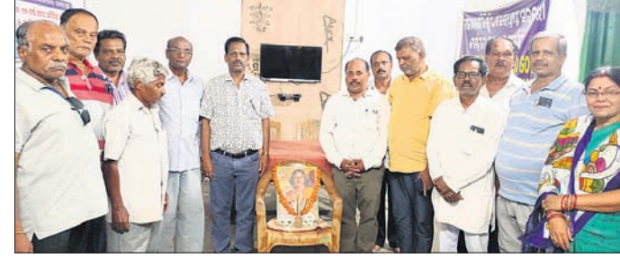
ଉତ୍କଳ ସମ୍ମିଳନୀ ଶାଖା ପକ୍ଷରୁ ଭଞ୍ଜଜୟନ୍ତୀ କାର୍ଯ୍ୟକ୍ରମରେ ଉପସ୍ଥିତ ଅତିଥି ଓ ଅନ୍ୟମାନେ ।

ମାଲକାନଗିରି, ୧୬ା୫ (ଡି.ଏନ.ଏ.) - ଉତ୍କଳ ସମ୍ମିଳନୀ ଶାଖା ପକ୍ଷରୁ ଭଞ୍ଜଜୟନ୍ତୀ କାର୍ଯ୍ୟକ୍ରମରେ ଉପସ୍ଥିତ ଅତିଥି ଓ ଅନ୍ୟମାନେ ।