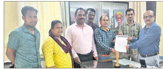
କର୍ମଚାରୀମାନେ ବିତିଖୁଳୁ ଦାବିପତ୍ର ଦେଉଛନ୍ତି ।