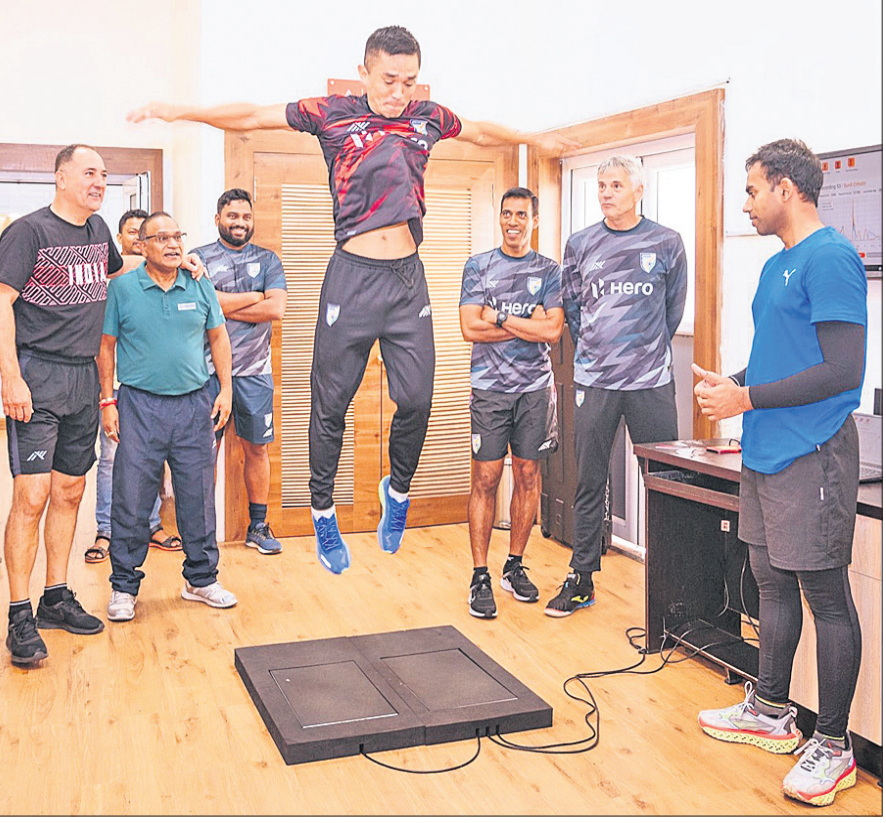
କଳିଙ୍ଗ ଷ୍ଟାଡିୟମରେ ଆରମ୍ଭ ହେବାକୁ ଯାଉଥିବା ହିରୋ ଇଣ୍ଟରକଣ୍ଟିନେଣ୍ଟାଲ କପ୍ ଫୁଟବଲ ଚୁନାମେଣ୍ଟ ପୂର୍ବରୁ ମଙ୍ଗଳବାର ଖେଳା ଉଦ୍ଦିଷ୍ଟ। ସେଠାର ଅଫ୍ ଏକ୍ସିକ୍ୟୁଟିଭ୍ ଡିଭିଜନ୍ ଖେଳାଳିଙ୍କ ପିଟିଂ ସେଣ୍ଟ୍

ବି.ପ୍ର.: ମେ' ୩ରେ ଲକ୍ଷ୍ମଣ ସୁପର କାନ୍ଥର ବିପକ୍ଷରେ ଚେନ୍ନାଇ ସୁପର କିଙ୍ଗ୍ସ ମଧ୍ୟରେ ଅନୁଷ୍ଠିତ ମ୍ୟାଚ୍ ବର୍ଷୀ ଯୋଗୁଁ ବାଧାପ୍ରାପ୍ତ ହୋଇ ଫଳାଫଳ ବିହୀନ ରହିଥିଲା।