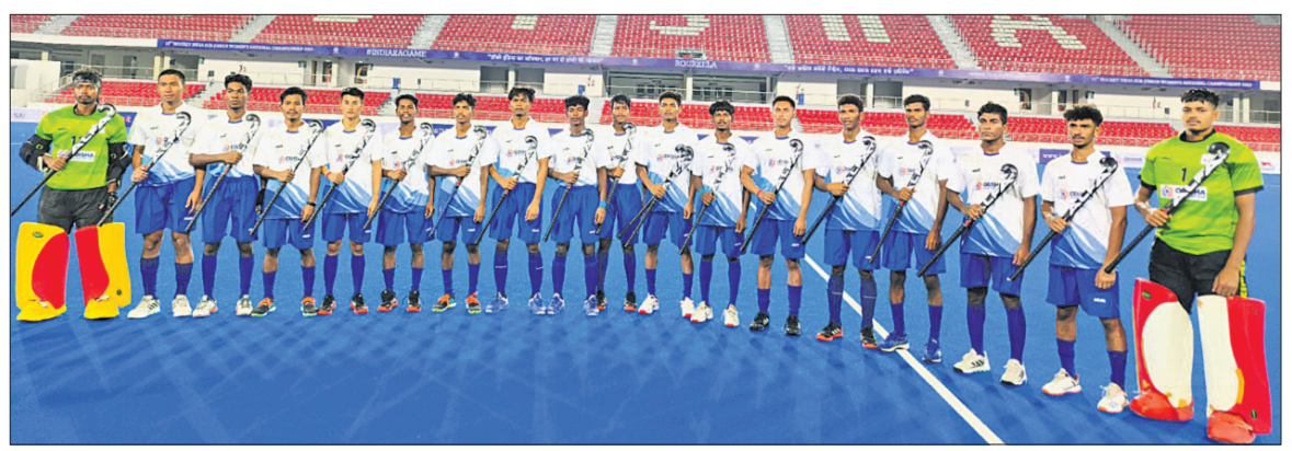
ଜାତୀୟ ସବ୍‌ଜୁନିୟର ପୁରୁଷ ହକି ପାଇଁ ମନୋନୀତ ଓଡ଼ିଶା ଦଳ।

ଭୁବନେଶ୍ୱର, ୧୭।୫ (କ୍ରୀଡ଼ା ପ୍ରତିନିଧି) ରାଉରକେଲାରେ ବିର୍ଦ୍ଧା ପୁଣ୍ୟ ଷ୍ଟାଡ଼ିୟମରେ ଜାତୀୟ ସବ୍‌ଜୁନିୟର ପୁରୁଷ ହକିର ୧୩ତମ ସଂସ୍କରଣ ଗୁରୁବାରଠାରୁ ଆରମ୍ଭ ହେବାକୁ ଯାଉଛି। ୧୧ ଦିନିଆ ଟୁର୍ନାମେଣ୍ଟରେ ମୋଟ ୨୮ଟି ଦଳ ଅଂଶଗ୍ରହଣ କରିବେ। ନବଦିନିତ ବିଶ୍ୱପ୍ରଭାସ ବିର୍ଦ୍ଧା ପୁଣ୍ୟ ଷ୍ଟାଡ଼ିୟମରେ ଦେଶର ଯୁବ ଖେଳାଳିମାନେ ସେମାନଙ୍କ ପ୍ରତିଭା ପ୍ରଦର୍ଶନର ସୁଯୋଗ ପାଇବେ। ଚଳିତ ମାସ ୨୮ରେ ପ୍ରତିଯୋଗିତାର ଫାଇନାଲ ଅନୁଷ୍ଠିତ ହେବ। ପ୍ରତିଯୋଗିତାରେ ଭାରତୀୟ ଦଳକୁ ଯାଜ୍ଞାଦେବୀ କଳଗୁଡ଼ିକୁ ୮ଟି ପୁଲ୍‌ରେ ବିଭକ୍ତ କରାଯାଇଛି। ପୁଲ୍ 'ଏ'ରେ ଉତ୍ତର ପ୍ରଦେଶ, କର୍ନାଟକ, କେରଳ, ପୁଲ୍ 'ବି'ରେ ଝାଡ଼ଖଣ୍ଡ, କେନ୍ଦ୍ରଶାସିତା, ହିମାଚଳ ପ୍ରଦେଶ, ପୁଲ୍ 'ସି'ରେ ଓଡ଼ିଶା, ଉତ୍ତରାଖଣ୍ଡ, ମହାରାଷ୍ଟ୍ର ଏବଂ ପୁଲ୍ 'ଡି'ରେ ହରିୟାଣା, ଗୋଆ ଓ ଛତିଶଗଡ଼ ଗ୍ଲାନ ପାଇଛି। ସେହିପରି ପୁଲ୍ 'ଇ'ରେ ପଞ୍ଜାବ, ଦିଲ୍ଲୀ, ଆସାମ, ତ୍ରିପୁରା, ପୁଲ୍ 'ଏଫ'ରେ ଦାଦ୍ରା ଆଣ୍ଡ ନଗର ହାଭେଲି, ତାମିଲ ଆଣ୍ଡ ତିରୁ, ଆନ୍ଧ୍ର ପ୍ରଦେଶ, ଚାଣିନୀନାଡୁ, ପୁଡୁଚେରୀ, ପୁଲ୍ 'ଜି'ରେ ବିହାର, ମଧ୍ୟପ୍ରଦେଶ, ମିଜୋରାମ, ତେଲଙ୍ଗାନା ଏବଂ ପୁଲ୍ 'ଏଚ୍'ରେ ଚଣ୍ଡିଗଡ଼, ଅରୁଣାଚଳ, ଗୁଜରାଟ ଓ ରାଜସ୍ଥାନ ଗ୍ଲାନ