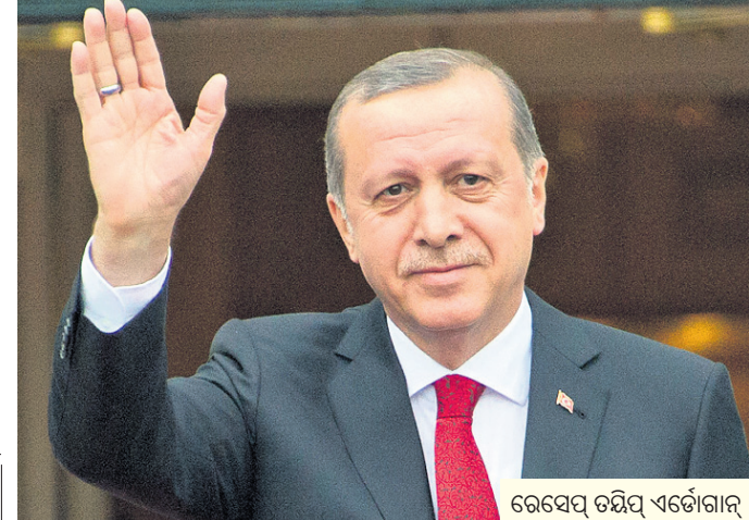
ରେସେପ୍ ତୟ୍ୟିପ୍ ଏର୍ଡୋଗାନ

ଓଡ଼ିଶା ୨୦୨୨ ରିପୋର୍ଟରେ ୭୪୧ ଶିଳ୍ପ ପାଇଁ ୧୦ ଲକ୍ଷ ୪୮ ହଜାର ୮୦୭ କୋଟି ନିବେଶ ପାଇଁ ପୁଞ୍ଜିନିବେଶ ଆସିଥିଲା। ଏଥିରୁ କାର୍ଯ୍ୟକାରୀ ହେଲେ ୧୦ ଲକ୍ଷ ୩୭ ହଜାର ୮୦୧ ନିୟୁତ ଟଙ୍କା ହେବ। ତାହାଛଡ଼ା ଇଣ୍ଡିଆ ପାଇଁ ମଧ୍ୟ ୩୬ଟି ଶିଳ୍ପ ସଂସ୍ଥା ସହ ରୁଚି ହୋଇଛି। କେବଳ ଖଣିଜଭିତ୍ତିକ ଶିଳ୍ପ ରୁହେଁ କୃଷି, ବୟନ ଶିଳ୍ପ, ଆଇଟି ଓ ଆଇଟିଏସ୍, ପ୍ରେଡ଼ିକ୍ଟିଭ୍ ମେଡିକାଲ ସେକ୍ଟରରେ ମଧ୍ୟ ପୁଞ୍ଜିନିବେଶରେ ଓଡ଼ିଶା ରେକର୍ଡ କରିଛି।