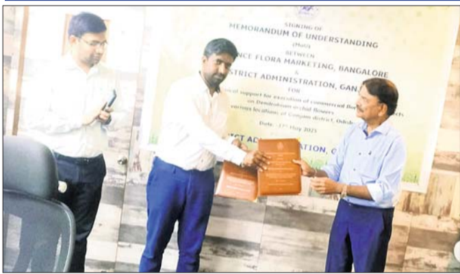
ହସ୍ତି ସ୍ୱାକ୍ଷରଣ ।

ଫୁଲଚାଷୀ ଲାଭବାନ ହୋଇପାରିବେ ଓ ଏହି ଚାଷ ପାଇଁ ଆଗ୍ରହ ପ୍ରକାଶ କରିବେ । ଏହାସହ ଜିଲ୍ଲାକୁ ପୁଷ୍ଟ ହବ କରିବା ପାଇଁ ଯତ୍ନ ନେଇ ଗଞ୍ଜାମ ଜିଲ୍ଲା ପ୍ରଶାସନ ଏମ୍ବ୍ଲୋ ସ୍ୱାକ୍ଷରଣ କରିଛି ।