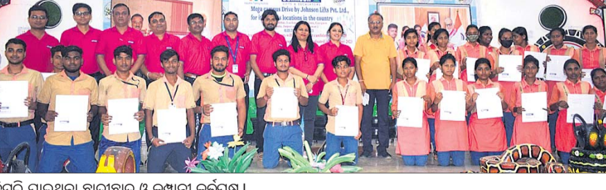
ନିୟୁକ୍ତି ପାଇଥିବା ଛାତ୍ରୀଛାତ୍ର ଓ କମ୍ପାନୀ କର୍ମଚାରୀ ।