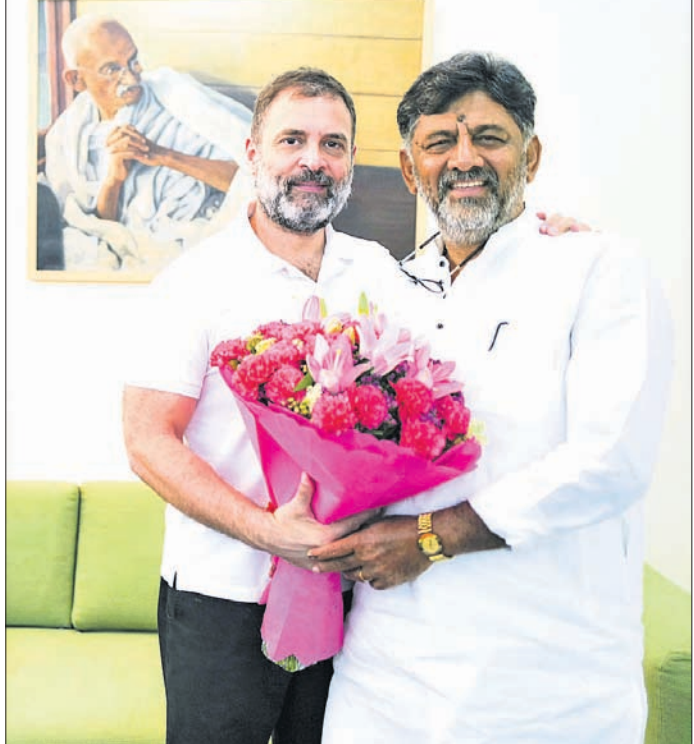
କଂଗ୍ରେସ୍ ନେତା ରାହୁଲ ଗାନ୍ଧୀଙ୍କୁ ଗୁପ୍ତାବାର ନୂଆଦିଲ୍ଲୀରେ ସାକ୍ଷାତ କରୁଛନ୍ତି ଡି.କେ.ଶିବକୁମାର ।

କର୍ନାଟକ ବିଧାନସଭା ନିର୍ବାଚନ ଫଳ ମେ' ୧୭ରେ ଆସିଥିଲା । ୨୨୪ ଆସନ ମଧ୍ୟରୁ କଂଗ୍ରେସ୍ ୧୩୫ ସମ୍ପାଦକରି ଅଭୁତପୂର୍ବ ବିଜୟ ହାସଲ କରିଛି । ଗୁରୁବାର ନୂଆ ମୁଖ୍ୟମନ୍ତ୍ରୀ ଶପଥ ନେବେ । ଶପଥ ଗ୍ରହଣ ପାଇଁ ମଞ୍ଚ ସଜ୍ଜା ମଧ୍ୟ ହୋଇଯାଇଛି । କିନ୍ତୁ ଶେଷ ମୁହୂର୍ତ୍ତ ପର୍ଯ୍ୟନ୍ତ ମୁଖ୍ୟମନ୍ତ୍ରୀ କିଏ ହେବେ ତାଙ୍କ ନାମ ପ୍ରକାଶ କରାଯାଇନାହିଁ । ପ୍ରଦେଶ କଂଗ୍ରେସ୍ କମିଟି (ପିସିସି) ସଭାପତି ଡି.କେ. ଶିବକୁମାର ଓ ପୂର୍ବତନ ମୁଖ୍ୟମନ୍ତ୍ରୀ ସିଦ୍ଧାରାମାୟା ନିଜ ନିଜ ଜିନ୍ଦରେ ଅଡ଼ିବସିଥିବାରୁ ଦଳର ହାଇକମାଣ୍ଡ ବର୍ତ୍ତମାନ ସୁଦ୍ଧା ନାମ ଘୋଷଣା କରିନାହାନ୍ତି । କର୍ନାଟକରେ କଂଗ୍ରେସ୍ ବିଜୟର ମୁଖ୍ୟ ବିକାଶ କୁହାଯାଉଥିବା ଶିବକୁମାର ଉପମୁଖ୍ୟମନ୍ତ୍ରୀ ପଦ ଗ୍ରହଣ କରିବାକୁ ନାରାଜ ଥିବାରୁ ଦଳ ପାଇଁ ଚିନ୍ତା ବଢ଼ିଯାଇଛି ।