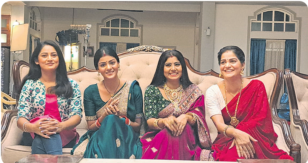
ଧାରାବାହିକ 'ପୁଁ ବି ବିଜୟିନୀ'ର ଅଭିନେତ୍ରୀମାନେ।