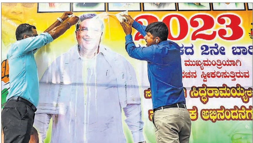
ବେଙ୍ଗାଲୁରୁରେ କଂଗ୍ରେସ ନେତା ସିଦ୍ଧାରାମାୟା ଓ ନୂଆଦିଲ୍ଲୀରେ କର୍ମଚର ରାଜ୍ୟ କଂଗ୍ରେସ ସଭାପତି ଡି.କେ. ଶିବକୁମାରଙ୍କ ସମର୍ଥକମାନେ ନିଜ ନେତାଙ୍କୁ ପୁଖ୍ୟମନ୍ତ୍ରୀ କରିବାକୁ ଦାବି ଜଣାଉଛନ୍ତି ।

ସର୍ବାଙ୍ଗ: ଏହି ଦୂପଦ ବ୍ୟବହାର କରି ସମ୍ପୂର୍ଣ୍ଣ ମାତ୍ରାରେ ଜନ୍ମଦିନ ଶୁଭେଚ୍ଛା ଜଣାନ୍ତୁ । ଫଟୋଗ୍ରାଫ ସହିତ ଦୂପଦଟି ପ୍ରକାଶନ ତାରିଖର ୨ ଦିନ ପୂର୍ବରୁ ଚଳେଇବାକୁ ହେବ । ଧାରତ୍ରି, ପୃ-୨୬, ଉତ୍କଳନଗର ଶିଳ୍ପାଗାର, ଭୁବନେଶ୍ୱର-୧୦ ଠିକଣାରେ ପଠାଯିବା ଆବଶ୍ୟକ ।