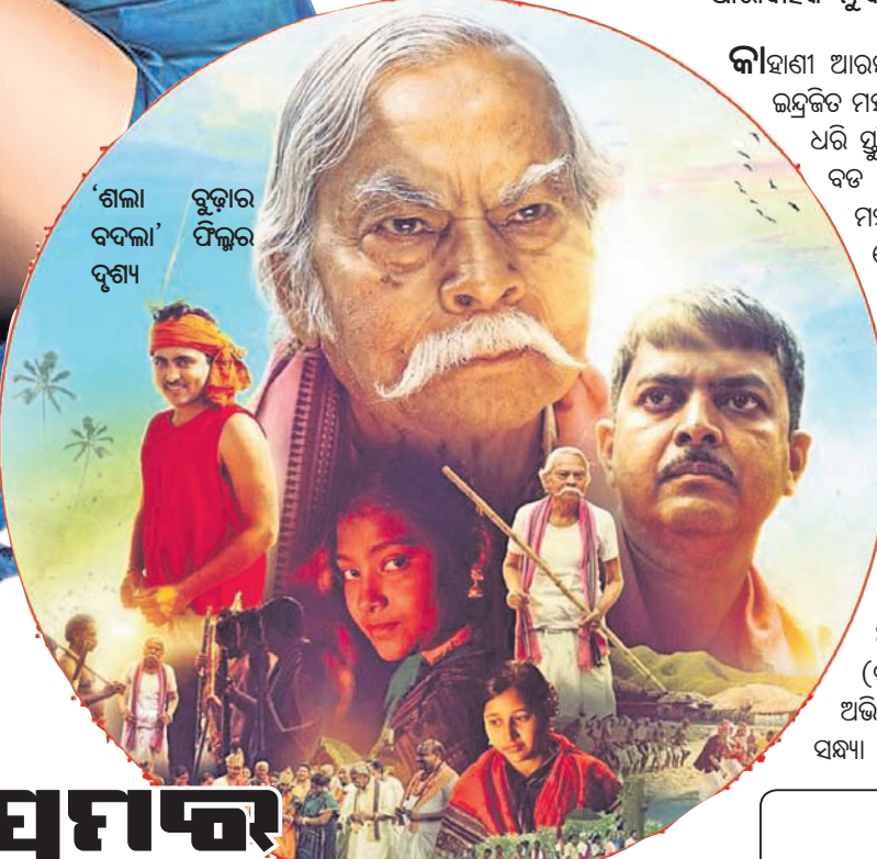
'ଶଲା ବୁଢ଼ାର ବଦଲା' ଚଳଚ୍ଚିତ୍ରର ପୃଷ୍ଠା