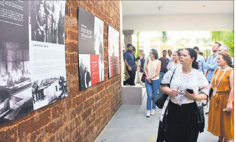
ଖଣ୍ଡଗିରିରୁତ ଗାନ୍ଧୀ ଶାନ୍ତିକେନ୍ଦ୍ରକୁ କେନ୍ଦ୍ର ବୈଦେଶିକ ବ୍ୟାପାର ଓ ସଂସ୍କୃତି ରାଷ୍ଟ୍ରମନ୍ତ୍ରୀ ମାନାକ୍ଷୀ ଏବଂ ବିଦେଶୀ ଅତିଥିମାନେ ବୁଲି ଦେଖିଛନ୍ତି।