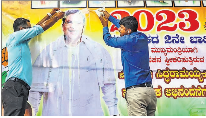
ବେଙ୍ଗାଳୁରୁଠାରେ କଂଗ୍ରେସ ନେତା ସିଦ୍ଧାରାମାୟା ଓ ନୂଆଦିଲ୍ଲୀଠାରେ କର୍ମଚର ରାଜ୍ୟ କଂଗ୍ରେସ ସଭାପତି ଡି.କେ. ଶିବକୁମାରଙ୍କ ସମର୍ଥକମାନେ ନିଜ ନେତାଙ୍କୁ ପୁଞ୍ଜୀମାତ୍ରା କରିବାକୁ ଦାବି ଜଣାଉଛନ୍ତି ।

ଗର୍ଭାବସା: ଏହି ପୂଜା ବ୍ୟବସ୍ଥା କରି ସମ୍ପୂର୍ଣ୍ଣ ମାତାପିତାଙ୍କର ଜନ୍ମଦିନ ଶୁଭେଚ୍ଛା କରାଯାଏ । ଫଟୋଗ୍ରାଫ ସହିତ ପୂଜାପତ୍ର ପ୍ରକାଶନ ତାରିଖର ୨ ଦିନ ପୂର୍ବରୁ ଚଳେ । ଧାରତ୍ରି, ପୃ-୨୬, ଉତ୍କଳନଗର ଶିଳ୍ପାଗାର, ଭୁବନେଶ୍ୱର-୧୦ ଠିକଣାରେ ପଞ୍ଜିକା ଆବଣ୍ଟକ ।