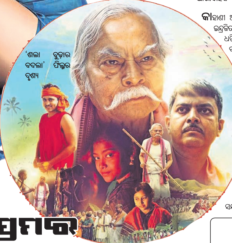
'ଶଲା ବୁଢ଼ାର ବଦଲା' ଚଳଚ୍ଚିତ୍ରର ସୂଚୀ