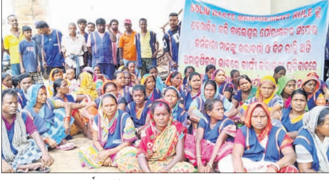
ଧାରଣାର ସଫେଇ କର୍ମଚାରୀ

ବାଲେଶ୍ୱର ପୌର ପରିଷଦର ଏକ କର୍ମଚାରୀ ବେଠକ ସମ୍ପର୍କରେ କାର୍ଯ୍ୟକାରୀ ଅନୁଷ୍ଠିତ ହୋଇଛି। ଏଥିରେ ସଫେଇ କର୍ମଚାରୀଙ୍କ ଆୟୋଜନର ଦାବିକୁ ନିରାକରଣ ପ୍ରସ୍ତାବ ଆଲୋଚନା କରାଯାଇଥିଲା।