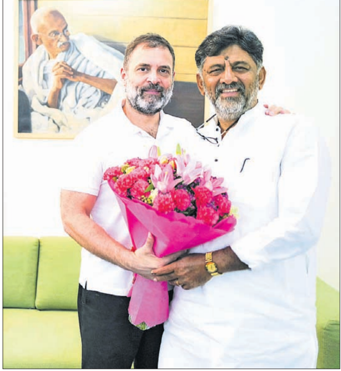
କଂଗ୍ରେସ ନେତା ରାହୁଲ ଗାନ୍ଧୀଙ୍କୁ ରୁଧିର କଂଗ୍ରେସରୁ ଦି.କେ.ଶିବକୁମାର ।

କର୍ନାଟକ ବିଧାନସଭା ନିର୍ବାଚନ ଫଳ ମେ' ୧୭ରେ ଆସିଥିଲା । ୨୨୪ ଆସନ ମଧ୍ୟରୁ କଂଗ୍ରେସ ୧୩୫ ସମ୍ପାଦକରି ଅଭୁତପୂର୍ବ ବିଜୟ ହାସଲ କରିଛି । ଗୁରୁବାର ନୂଆ ମୁଖ୍ୟମନ୍ତ୍ରୀ ଶପଥ ନେବେ । ଶପଥ ଗ୍ରହଣ ପାଇଁ ମଞ୍ଚ ସଜ୍ଜା ମଧ୍ୟ ହୋଇଯାଇଛି । କିନ୍ତୁ ଶେଷ ମୁହୂର୍ତ୍ତ ପର୍ଯ୍ୟନ୍ତ ମୁଖ୍ୟମନ୍ତ୍ରୀ କିଏ ହେବେ ତାଙ୍କ ନାମ ପ୍ରକାଶ କରାଯାଇନାହିଁ । ପ୍ରଦେଶ କଂଗ୍ରେସ କମିଟି (ପିସିସି) ସଭାପତି ଡି.କେ. ଶିବକୁମାର ଓ ପୂର୍ବତନ ମୁଖ୍ୟମନ୍ତ୍ରୀ ସିଦ୍ଧାରାମାୟା ନିଜ ନିଜ ଜିତ୍ରେ ଅଡ଼ିବସିଥିବାରୁ ଦଳର ହାଇକମାଣ୍ଡ ବର୍ତ୍ତମାନ ସୁଦ୍ଧା ନାମ ଘୋଷଣା କରିନାହାନ୍ତି । କର୍ନାଟକରେ କଂଗ୍ରେସ ବିଜୟର ମୁଖ୍ୟ ବିକାଶ କୁହାଯାଉଥିବା ଶିବକୁମାର ଉପମୁଖ୍ୟମନ୍ତ୍ରୀ ପଦ ଗ୍ରହଣ କରିବାକୁ ନାରାଜ ଥିବାରୁ ଦଳ ପାଇଁ ଚିନ୍ତା ବଢ଼ିଯାଇଛି । ହୁଆକୁ ହୁଆ ଗପ୍ତ, ମାରାଥନ୍ ଟୈକ୍‌କା । ମନେ ହେଉଛି ତଥାପି ଛିତ୍ତନି ହିସାବ । ଶିବକୁମାରଙ୍କୁ କଂଗ୍ରେସ ପକ୍ଷରୁ ଦିଆଯାଇଥିବା ଦୁଇଟି ଅଫରକୁ ସେ ପ୍ରତ୍ୟାଖ୍ୟାନ କରିଦେଇଥିବା ଜଣାପଡ଼ିଛି । ଶିବକୁମାର ରୁଧିର କଂଗ୍ରେସ ଅଧକ୍ଷ ମଲ୍ଲିକାର୍ଜୁନ ଖାର୍ଗେ ଓ ନେତା ରାହୁଲ ଗାନ୍ଧୀଙ୍କୁ ନୂଆଦିଲ୍ଲୀରେ ଭେଟି ନିଜ ପକ୍ଷ ରଖିଥିଲେ । ଅଦେଇ ଘଣ୍ଟା ଧରି