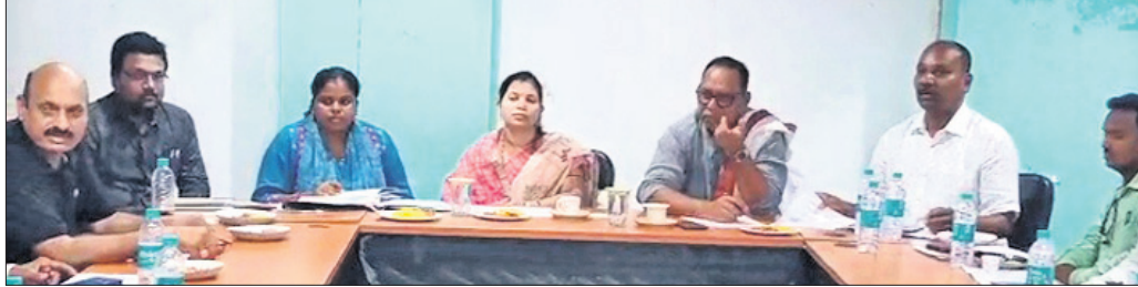
ପୌରପରିଷଦ ବୈଠକରେ ଆଲୋଚନା କରାଯାଇଛି।

ରାୟଗଡ଼ା ଜିଲ୍ଲା ରୁଣ୍ଡପୁର ପୌର ପରିଷଦର ଉପବୈଠକରୁ ପଞ୍ଚୁଆବର୍ଗ ଅନ୍ତର୍ଭୁକ୍ତ ହୋଇଯାଇଛି। ଅଧିକାରୀମାନେ ଆରମ୍ଭରେ ୧୨,୧୩,୧୪ ଓ ୧୫ ବାଉଁଶ ସାହି ଏବଂ ୧୬ ଓ ୧୭ ବିଭିନ୍ନ ଉନ୍ନୟନମୂଳକ କାର୍ଯ୍ୟ ଉପରେ ଆଲୋଚନା ହୋଇଥିଲା।