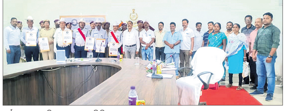
କାର୍ଯ୍ୟକ୍ରମରେ ସମ୍ମାନିତ ହୋଇଥିବା ବ୍ୟକ୍ତି ବିଶେଷ ।