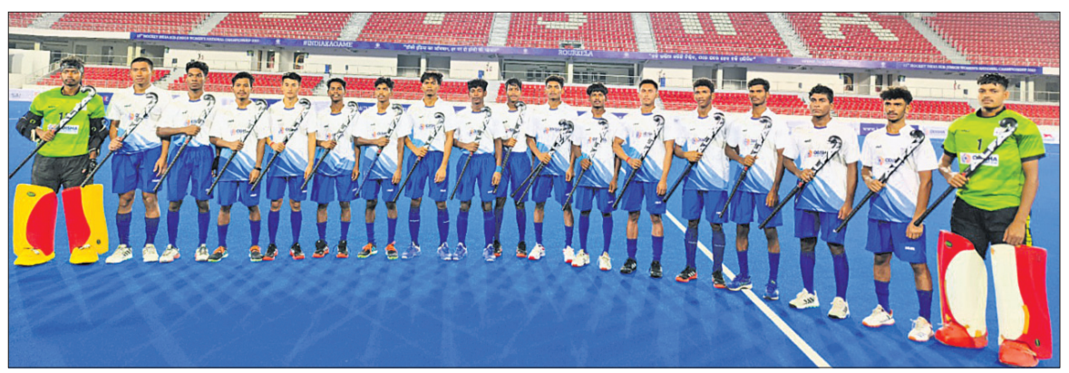
ଜାତୀୟ ସବ୍‌ଜୁନିୟର ପୁରୁଷ ହକି ପାଇଁ ମନୋନୀତ ଓଡ଼ିଶା ଦଳ।

ଭୁବନେଶ୍ୱର, ୧୭।୫ (କ୍ରୀଡ଼ା ପ୍ରତିନିଧି) ରାଉରକେଲାର ବିର୍ଦ୍ଧା ପୁଣ୍ଡା ଷ୍ଟାଡ଼ିୟମରେ ଜାତୀୟ ସବ୍‌ଜୁନିୟର ପୁରୁଷ ହକିର ୧୩ତମ ସଂସ୍କରଣ ଗୁରୁବାରଠାରୁ ଆରମ୍ଭ ହେବାକୁ ଯାଉଛି। ୧୧ ଦିନିଆ ଟୁର୍ନାମେଣ୍ଟରେ ମୋଟ ୨୮ଟି ଦଳ ଅଂଶଗ୍ରହଣ କରିବେ। ନବନିର୍ମିତ ବିଶ୍ୱପ୍ରଭାସ ବିର୍ଦ୍ଧା ପୁଣ୍ଡା ଷ୍ଟାଡ଼ିୟମରେ ଦେଶର ଯୁବ ଖେଳାଳିମାନେ ସେମାନଙ୍କ ପ୍ରତିଭା ପ୍ରଦର୍ଶନର ସୁଯୋଗ ପାଇବେ। ଚଳିତ ମାସ ୨୮ରେ ପ୍ରତିଯୋଗିତାର ଫାଇନାଲ ଅନୁଷ୍ଠିତ ହେବ। ପ୍ରତିଯୋଗିତାରେ ଭାରତୀୟ ଦଳକୁ ଯାଜ୍ଞାଦେବୀ କଲେଜରୁ ୮ଟି ପୁଲ୍‌ରେ ବିଭକ୍ତ କରାଯାଇଛି। ପୁଲ୍ 'ଏ'ରେ ଉତ୍ତର ପ୍ରଦେଶ, କର୍ନାଟକ, କେରଳ, ପୁଲ୍ 'ବି'ରେ ଝାଡ଼ଖଣ୍ଡ, କେନ୍ଦ୍ରଶାସିତା, ହିମାଚଳ ପ୍ରଦେଶ, ପୁଲ୍ 'ସି'ରେ ଓଡ଼ିଶା, ଉତ୍ତରାଖଣ୍ଡ, ମହାରାଷ୍ଟ୍ର ଏବଂ ପୁଲ୍ 'ଡି'ରେ ହରିୟାଣା, ଗୋଆ ଓ ଛତିଶଗଡ଼ ଗ୍ଲାନ ପାଇଛି। ସେହିପରି ପୁଲ୍ 'ଇ'ରେ ପଞ୍ଜାବ, ଦିଲ୍ଲୀ, ଆସାମ, ତ୍ରିପୁରା, ପୁଲ୍ 'ଏଫ'ରେ ଦାଦ୍ରା ଆଣ୍ଡ ନଗର ହାଭେଲି, ତାମିଲ ଆଣ୍ଡ ତିରୁ, ଆନ୍ଧ୍ର ପ୍ରଦେଶ, ଚାଣିଲନାଡୁ, ପୁଡୁଚେରୀ, ପୁଲ୍ 'ଜି'ରେ ବିହାର, ମଧ୍ୟପ୍ରଦେଶ, ମିଜୋରାମ, ତେଲଙ୍ଗାନା ଏବଂ ପୁଲ୍ 'ଏଚ୍'ରେ ଚଣ୍ଡିଗଡ଼, ଅରୁଣାଚଳ, ଗୁଜରାଟ ଓ ରାଜସ୍ଥାନ ଗ୍ଲାନ