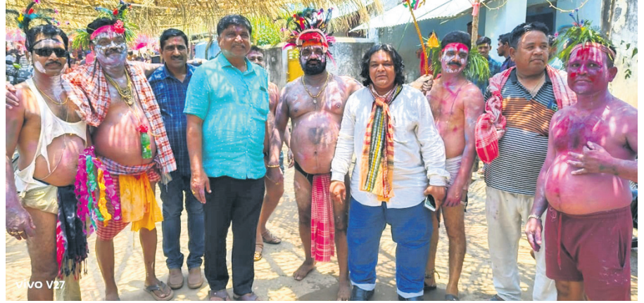
ଠାକୁରାଣୀ ଯାତ୍ରାରେ ଅତିଥିଙ୍କ ସହ ବିଭିନ୍ନ ବେଶଧାରୀ ।

ପଦ୍ମପୁର, ୧୭୫୫(ତି.ଏନ.ଏ.) ରାୟଗଡ଼ା ଜିଲ୍ଲାର ପଦ୍ମପୁର ବ୍ଲକ ଗୁଡ଼ିଆସ ପଞ୍ଚାୟତ ଜିରା ଗ୍ରାମରେ ଚାଲିଥିବା ଠାକୁରାଣୀ ଯାତ୍ରାର ରୂପବାର ଉଦ୍‌ଯାପନ ଉତ୍ସବ ଅନୁଷ୍ଠିତ ହୋଇଯାଇଛି ।