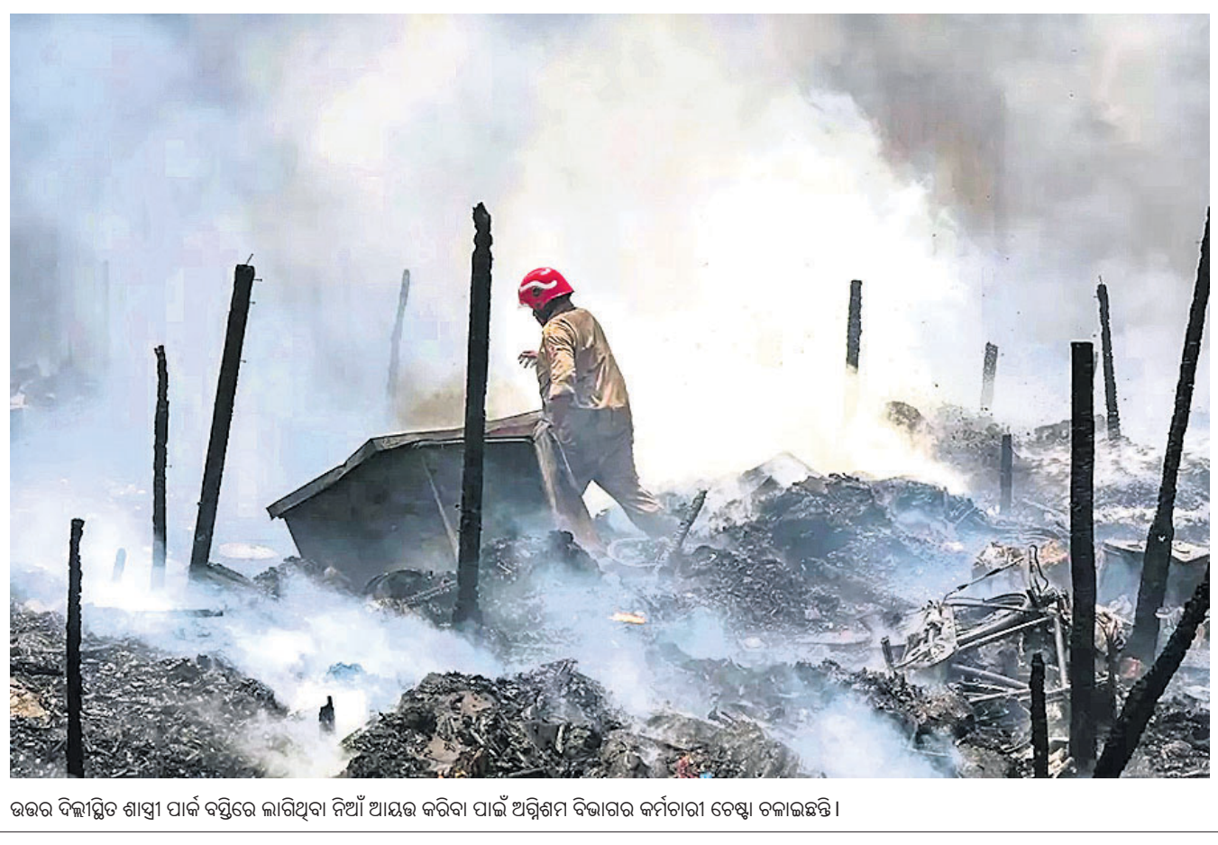
ଉତ୍ତର ଦିଲ୍ଲୀସ୍ଥିତ ଶାସ୍ତ୍ରୀ ପାର୍କ ବସ୍ଥିରେ ଲାଗିଥିବା ନିଆଁ ଆୟତ୍ତ କରିବା ପାଇଁ ଅଗ୍ନିଶମ ବିଭାଗର କର୍ମଚାରୀ ଚେଷ୍ଟା ବଳାଇଛନ୍ତି।

ନୂଆଦିଲ୍ଲୀ, ୧୭/୫: ଚର୍ଚ୍ଚିତ୍ର ଯୋଗୁ ଏୟାର ଲିନିଆର ଏଆଇଏମ୦୨ ବିମାନ ଦିଲ୍ଲୀରୁ ସିନ୍ଦ୍ରୀ ଅଭିଯୁକ୍ତ ଯାତ୍ରୀଙ୍କୁ ବେଳେ ସେଥିରେ ଥିବା ଅନେକ ଯାତ୍ରୀ ଆହତ ହୋଇଛନ୍ତି। ଦିଲ୍ଲୀ ବିମାନବନ୍ଦରରୁ ଚେକ୍‌ଅପ୍ କରିବା ପରେ ମଝି ଆକାଶରେ ବିମାନଟି ଭାଙ୍ଗି ଚର୍ଚ୍ଚିତ୍ରର ସମ୍ପୂର୍ଣ୍ଣ ଯୋଗୁ ହେବାକୁ ପଡ଼ିଥିଲା। କୌଣସି ଯାତ୍ରୀ ଗୁରୁତର ଆହତ ହୋଇ ନ ଥିବା ବିମାନ କର୍ତ୍ତୃପକ୍ଷ କହିଛନ୍ତି।