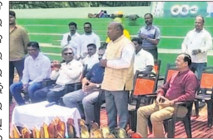
କାର୍ଯ୍ୟକ୍ରମରେ ଉପସ୍ଥିତ ଅତିଥିମାନେ।

ନବରଙ୍ଗପୁର, ୧୭୫(ଡି.ଏ.): ଆନ୍ତର୍ଜାତୀୟ ନିଲେଟ ବର୍ଷ ପାଳନ ଅବସରରେ ଜିଲ୍ଲା କୃଷି ବିଭାଗ ପକ୍ଷରୁ ନବରଙ୍ଗପୁର ମହାବିଦ୍ୟାଳୟରେ ମାଣ୍ଡିଆ ଖାଦ୍ୟ ଉତ୍ସବ ଅନୁଷ୍ଠିତ ହୋଇଛି।