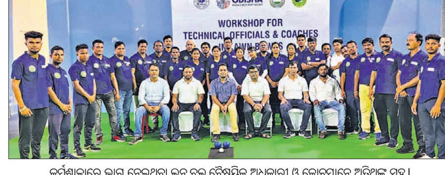
କର୍ମଶାଳାରେ ଭାରତୀୟ ଲନ୍ ବଲ୍ ସେମିନାର ଆଧିକାରୀ ଓ କୋଚ୍‌ମାନେ ଅତିଥିକ୍ ସହ।

ଭୁବନେଶ୍ୱର, ୧୭।୫ (କ୍ରୀଡ଼ା ପ୍ରତିନିଧି) ରାଜ୍ୟ ସରକାରଙ୍କ କ୍ରୀଡ଼ା ବିଭାଗ ଓ ଓଡ଼ିଶା ବୋଲିଂ ଆୟୋଗିଏସନ ଆନୁକୁଲ୍ୟରେ ନୟାପଲ୍ଲୀସ୍ଥିତ ଲନ୍ ବଲ୍ ହଲ୍‌ରେ ରୁଧିରା ଓଏଫ୍‌ସିର ଲନ୍ ବଲ୍ ସେମିନାର ଆରମ୍ଭ ହେବ।