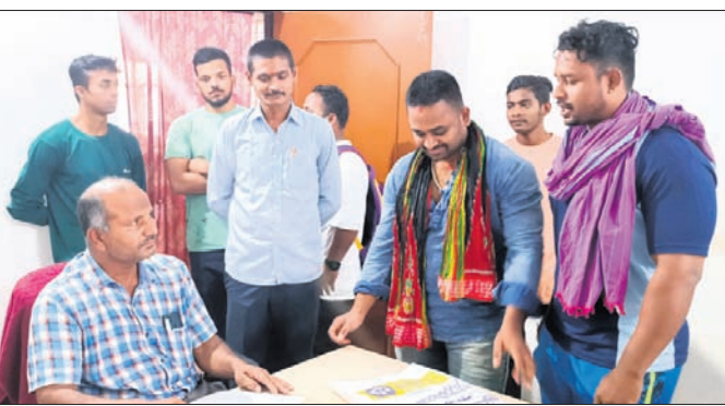
ଜିଲ୍ଲା ଜୁଡ଼ା ଅଧିକାରୀଙ୍କୁ ଦାବିପତ୍ର ପ୍ରଦାନ କରାଯାଇଛି ।

ପ୍ରକାଶ ନ କରିବା, ନିୟମାବଳୀରେ ବୟସ ଯୋଗ୍ୟତା ନ ଥିବା, ଲାଭପ୍ରାପ୍ତି ନେଇ କୌଣସି ସଂସଦରେ ନ ରଖିବା, ନିର୍ବାଚନ ଓ ଏହାର ପ୍ରକ୍ରିୟା ତଦାରଖ ତଥା ପରିଚାଳନା ପାଇଁ ନିର୍ବାଚନ ଅଧିକାରୀ ମନୋନୀତ ବଦଳରେ ନିଜେ ଜୁଡ଼ା ଅଧିକାରୀ ସମସ୍ତ ଦାୟିତ୍ୱ ନିର୍ବାହ କରୁଥିବା ଏବଂ ଜିଲ୍ଲାରେ ବହୁ ପଞ୍ଜୀକୃତ ଜୁଡ଼ା କମିଟି ଓ କ୍ଲବକୁ ସଦସ୍ୟତା ନ ଦେବାକୁ ନେଇ ଜିଲ୍ଲା ଜୁଡ଼ାବିତ୍ତମାନେ ବିରୋଧ କରି ଜିଲ୍ଲାପାଳଙ୍କ ଉଦ୍ଦେଶ୍ୟରେ ଦାବିପତ୍ର ଦେଇଛନ୍ତି ।