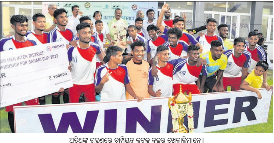
ଅତିଥିକ ଗହଣରେ ଚାମ୍ପିୟନ କଟକ ଦଳର ଖେଳାଳିମାନେ ।