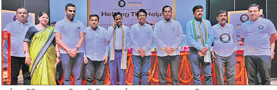
ଆର୍ଷ ଅଫ୍ ଗିଭିଙ୍ଗ ପକ୍ଷରୁ ଅନୁଷ୍ଠିତ ହେଲିଓ ଦି ହେଲୁ କାର୍ଯ୍ୟକ୍ରମରେ ଯୋଗଦେଇଥିବା ଅତିଥି ଓ ଅନ୍ୟମାନେ ।