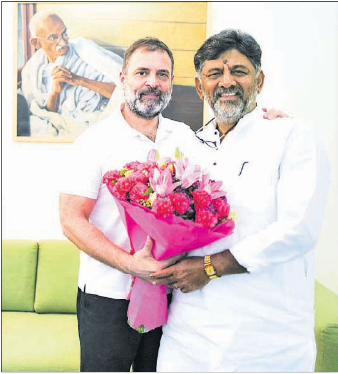
କଂଗ୍ରେସ ନେତା ରାହୁଲ ଗାନ୍ଧୀଙ୍କୁ ଗୁଧବାର ନୂଆଦିଲ୍ଲୀରେ ସାକ୍ଷାତ କରୁଛନ୍ତି ଡି.କେ.ଶିବକୁମାର।

କଂଗ୍ରେସ ନେତା ରାହୁଲ ଗାନ୍ଧୀଙ୍କୁ ଗୁଧବାର ନୂଆଦିଲ୍ଲୀରେ ସାକ୍ଷାତ କରୁଛନ୍ତି ଡି.କେ.ଶିବକୁମାର। ଡି.କେ.ଶିବକୁମାର ଉପ ହେବା ବିରୋଧରେ ପୋଲିସ୍ ଏସ୍‌ଆଇଙ୍କ ବିରୋଧରେ ବଳାଙ୍ଗୀର ମାମଲା ଚଳାଇଛନ୍ତି।