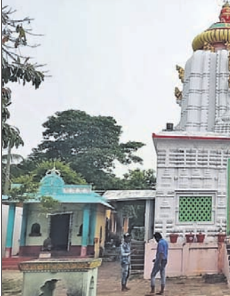
ଲକ୍ଷ୍ମୀବରାହ ଜୀଉ ମନ୍ଦିର ।

ଈଶାନ୍ତରାଣୀ ପଞ୍ଚାୟତରେ ଏକ କଲ୍ୟାଣ ମଞ୍ଚ ପ୍ରଦାନ କରାଯାଇଛି । ଏହାଛଡ଼ା ସେଠାରେ ଏକ କମ୍ୟୁନିଟି ସେଣ୍ଟର ନିର୍ମାଣ କରାଯାଇଛି ।