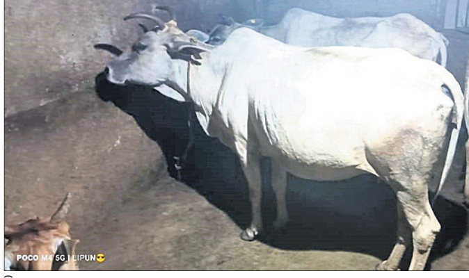
ବିଜ୍ଞାନପୁରୀ ଗୋ ସମ୍ପଦ ।

■ ଜାତୀୟ ମାନ୍ୟତା ମିଳିବାକୁ ୧୩ ବର୍ଷ ପୂରିଲା ■ ସରକାରୀ କଲର ପ୍ରୋତ୍ସାହନ ଅଭାବ