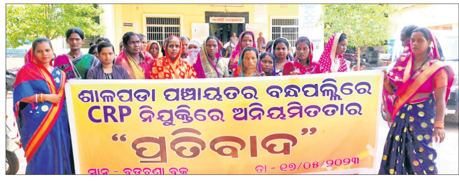
ରୁକ୍ମି କାର୍ଯ୍ୟାଳୟ ଆଗରେ ମହିଳାମାନେ ପ୍ରତିବାଦ କରୁଛନ୍ତି ।