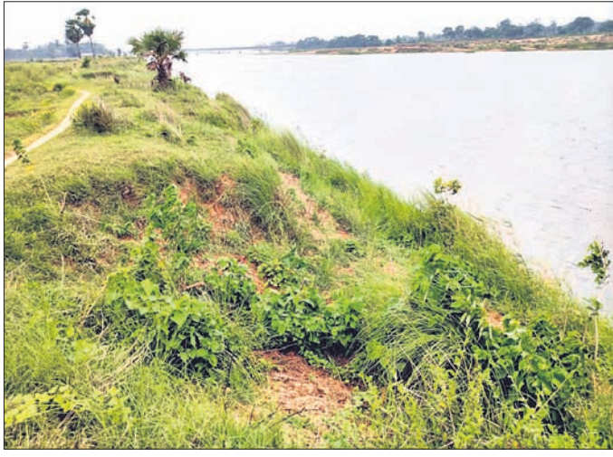
ନଦୀକୂଳରେ ଅତୀତ ଖସି ଗାତ ସୃଷ୍ଟି ହୋଇଛି ।

କରି ବିଭିନ୍ନ ବନ୍ଧର ରକ୍ଷଣାବେକ୍ଷଣ ନାଁରେ ଅର୍ଥ ବ୍ୟୟ କରୁଥିବା ଅଭିଯୋଗ ହେଉଛି । ପ୍ରକୃତ ସ୍ଥିତି ପଥର ପ୍ୟାକିଂ ବନ୍ଧ ନିର୍ମାଣ ପାଇଁ ଅର୍ଥ ବ୍ୟୟ କରୁଛି । ମାତ୍ର ସେଥିପ୍ରତି ବିଭାଗୀୟ କର୍ତ୍ତୃପକ୍ଷ ଅବହେଳା ପ୍ରଦର୍ଶନ