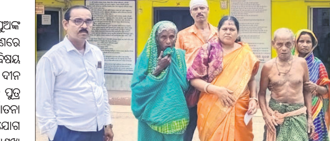
ବୃଦ୍ଧ ଦମ୍ପତି କୁଳଜା ଧାନା ନିର୍ଯ୍ୟାତନା କରିବାକୁ ଆସିଛନ୍ତି।

ବାର୍ଦ୍ଧକ୍ୟ ଅବସ୍ଥାରେ ମା'ବାପା ବୋହୂପୁଅଙ୍କ ସାହାଯ୍ୟ ନିଅନ୍ତି। ନାଗୁଣାନାଟିକ ଗହଣରେ ଅବସର ସମୟ ବିତାନ୍ତି।