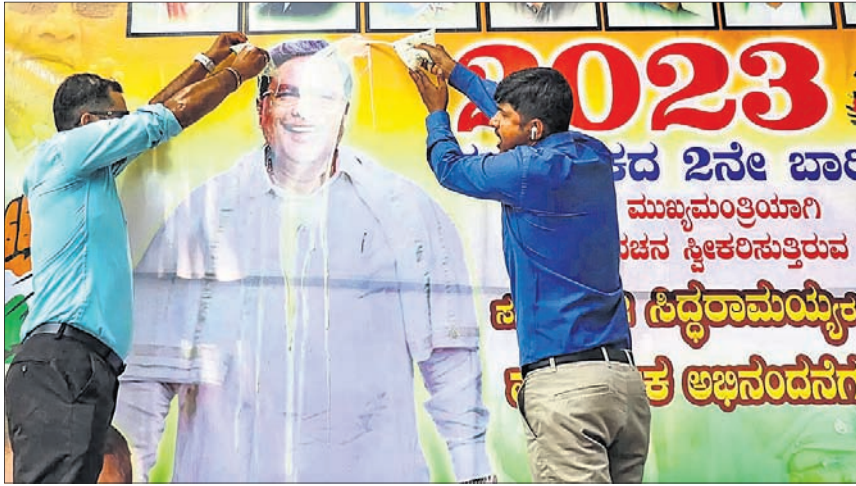
ବେଙ୍ଗାଲୁରୁରେ କଂଗ୍ରେସ ନେତା ସିଦ୍ଧାରାମାୟା ଓ ନୂଆଦିଲ୍ଲୀରେ କର୍ମଚର ରାଜ୍ୟ କଂଗ୍ରେସ ସଭାପତି ଡି.କେ. ଶିବକୁମାରଙ୍କ ସମର୍ଥକମାନେ ନିଜ ନେତାଙ୍କୁ ପୁଷ୍ୟମନ୍ତ୍ରୀ କରିବାକୁ ଦାବି ଜଣାଉଛନ୍ତି।

ସଂପର୍କ: ଏହି ପୃଷ୍ଠାରେ କେବଳ ନିଜ ପରିବାରରେ ଜନ୍ମଦିନ ଶୁଭେଚ୍ଛା ଲଗାନ୍ତୁ। ଫଟୋଗ୍ରାଫ ସହିତ ପ୍ରକାଶନ ତାରିଖର ୨ ଦିନ ପୂର୍ବରୁ କରନ୍ତୁ। ଧାରତ୍ରି, ପୃ-୨୬, ଉତ୍କଳନଗର ଶିଳ୍ପାଗର, ଭୁବନେଶ୍ୱର-୭୫୧୦୦୧ ଠିକଣାରେ ପଠାନ୍ତୁ।