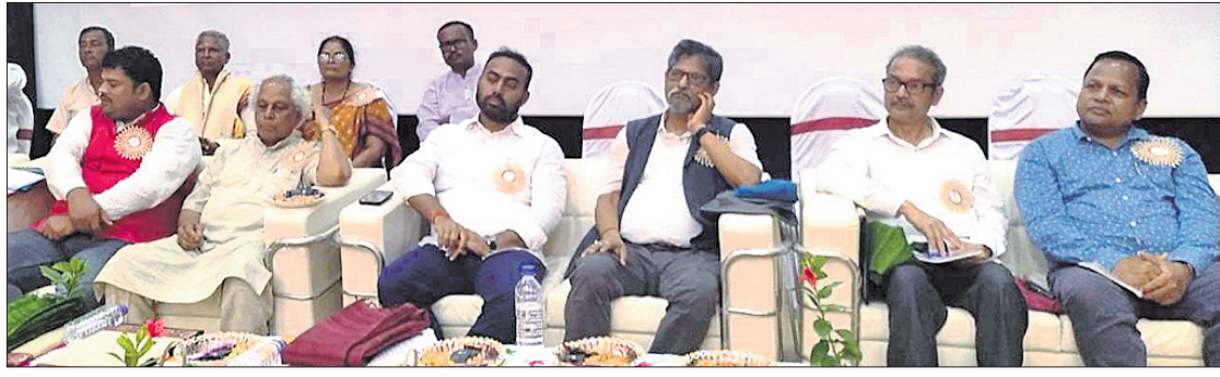
କାରିଗର ସମାବେଶରେ ଯୋଗଦେଇଥିବା ଅତିଥି ।