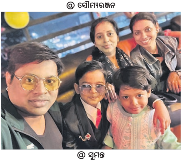
ସେଲ୍‌ଫି ପଠାଇବା ସମୟରେ ନିଜର ନାମ ଏବଂ ମୋବାଇଲ ନମ୍ବର ଦେବାକୁ ଭୁଲନ୍ତୁ ନାହିଁ । ଯୋଗ୍ୟବିବେଚିତ ଫଟୋ ପ୍ରକାଶ ପାଇବ ।