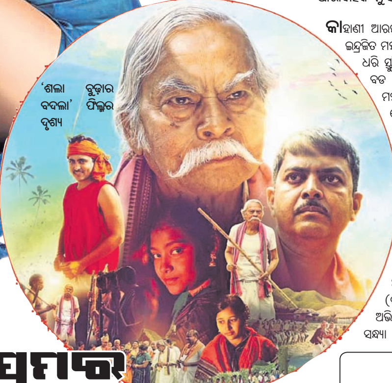
'ଶଲା ବୁଢ଼ାର ବଦଲା' ଚଳଚ୍ଚିତ୍ରର ପୁରସ୍କାର