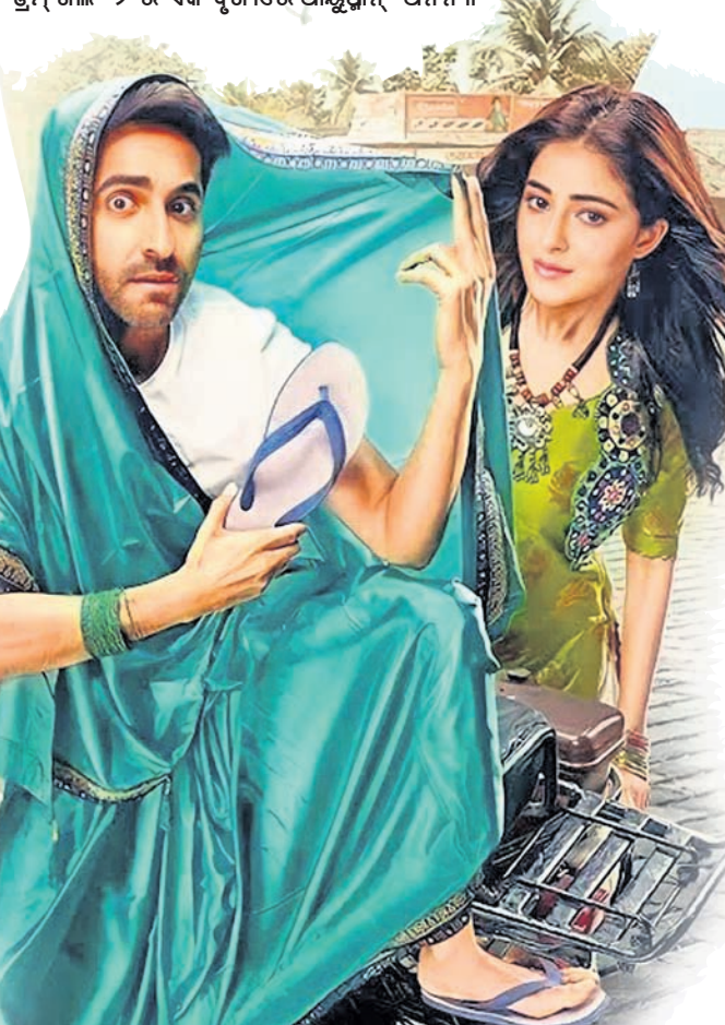
'ତ୍ରିମ୍ କାର୍ନୀ-୨'ର ଏକ ଦୃଶ୍ୟରେ ଆୟୁଷ୍ମାନ-ଅନ୍ୟମା