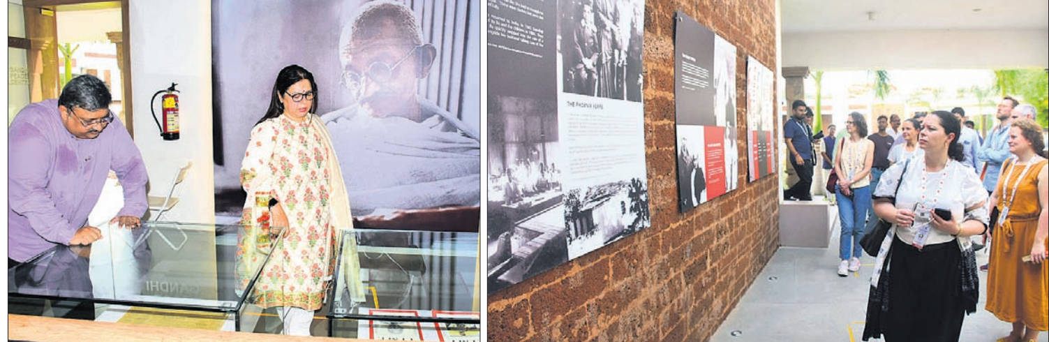
ଖଣ୍ଡଗିରିରୁ ଗାନ୍ଧୀ ଶାନ୍ତିକେନ୍ଦ୍ରକୁ କେନ୍ଦ୍ର ବୈଦେଶିକ ବ୍ୟାପାର ଓ ସଂସ୍କୃତି ରାଷ୍ଟ୍ରମନ୍ତ୍ରୀ ମାନାକ୍ଷୀ ଏବଂ ବିଦେଶୀ ଅତିଥିମାନେ ବୁଲି ଦେଖୁଛନ୍ତି।

ଆୟୋଜନକୁ ନେଇ ସେ ସ୍ତୁତିସମ୍ପନ୍ନ କରିଥିଲେ। ପରେ ବିଦେଶାଗତ ଅତିଥିମାନେ ଉଦ୍‌ଘାଟନୀ ଗୁମ୍ଫା ଓ ଗାନ୍ଧୀ ଶାନ୍ତି କେନ୍ଦ୍ର ବୁଲି ଦେଖୁଥିଲେ। ଏହି ଦିନେ ସମଗ୍ର ପାଇଁ ଏକ ଖାନ ବିନାୟ ଅନୁଭୂତି ଥିଲା ବୋଲି କେନ୍ଦ୍ରମନ୍ତ୍ରୀ କହିଥିଲେ। ପ୍ରାଚୀନ କାଳର କଳାସ୍ଥାପତ୍ୟ ଏବଂ ଓଡ଼ିଶାର ସଂସ୍କୃତିକୁ ଦେଖି ମନ୍ତ୍ରୀ ଓ ଅତିଥି ଅଭିଭୂତ ହୋଇଯାଇଥିଲେ। ଏଥିସହ ଜି-୨୦ ସଂସ୍କୃତି କାର୍ଯ୍ୟଗୋଷ୍ଠୀର ଏହି ଦ୍ୱିତୀୟ ଦିନେ ବିଧିବଦ୍ଧ ଭାବେ ଶେଷ ହୋଇଛି। ଦ୍ୱିତୀୟ ଦିନରେ ୨୦ ସଦସ୍ୟ ରାଷ୍ଟ୍ର ନିମନ୍ତ୍ରଣ ରାଷ୍ଟ୍ର ଏବଂ ବିଭିନ୍ନ ଅନ୍ତର୍ଜାତୀୟ ସଂଗଠନର ପ୍ରତିନିଧିମାନେ ବିଭିନ୍ନ କାର୍ଯ୍ୟକ୍ରମରେ ସାମିଲ ହେବା ସହ ସଂସ୍କୃତି କ୍ଷେତ୍ରରେ ଦେଖାଦେଇଥିବା ବିଭିନ୍ନ ସମସ୍ୟାର ସମାଧାନ ପାଇଁ ଏକ ବାସ୍ତବବାଦୀ ତଥା କାର୍ଯ୍ୟ ଉନ୍ନତୀ ସୁପାରିସ କରିବା ଲାଗି ବ୍ୟାପକ ଆଲୋଚନା ଓ ବିଚାରବିମର୍ଶ କରିଥିଲେ। ୨ ଦିନରେ ୬ଟି ଅଧିବେଶନରେ ଆଲୋଚନା ହୋଇଥିଲା। ଭାରତର ଜି-୨୦ ଅଧ୍ୟକ୍ଷତା ଅଧୀନରେ ୪ଟି ପ୍ରାଥମିକତା କ୍ଷେତ୍ର: ସଂସ୍କୃତିକ ସମ୍ପର୍କ ସଂରକ୍ଷଣ ଓ ପୁନଃପ୍ରତିଷ୍ଠା, ଦୀର୍ଘସ୍ଥାୟୀ ଭବିଷ୍ୟତ ପାଇଁ ଜୀବନ୍ତ ଐତିହ୍ୟର ଉପଯୋଗ, ସଂସ୍କୃତି ଓ ସୃଜନଶୀଳ ଉଦ୍ୟୋଗ ଓ ଅର୍ଥ ବ୍ୟବସ୍ଥାର ପ୍ରୋତ୍ସାହନ ଏବଂ ସଂସ୍କୃତିର ପୁରସ୍କାର ଓ ସଂରକ୍ଷଣ ପାଇଁ ଡିଜିଟାଲ ପ୍ରଯୁକ୍ତିର ଉପଯୋଗ ଉପରେ ଆଲୋଚନା କରାଯାଇଥିଲା। ଦ୍ୱିତୀୟ ଅଂଶବିଶେଷ ସ୍ୱରୂପ ‘ସଂସ୍କୃତି: ଦ କ୍ରାଫ୍ଟ ଇଡିଅର୍ସ’ ଶୀର୍ଷକ ପ୍ରଦର୍ଶନୀ କଳାଭୂମି ନିକସରରେ ଆୟୋଜନ କରାଯାଇଥିଲା। ସେହିପରି ‘ସଂସ୍କୃତି ସମଗ୍ରକୁ ଏକତ୍ର କରିଥାଏ’ ଶୀର୍ଷକ ବାର୍ତ୍ତା ନେଇ ପୁରୀ ବେଳାଭୂମିରେ ବାଲୁକା ଶିଳ୍ପୀ ପଦ୍ମଶ୍ରୀ ସୁବର୍ଣ୍ଣନ ପଟ୍ଟନାୟକ ଏକ ବାଲୁକା କଳା ପ୍ରଦର୍ଶନ କରିଥିଲେ।