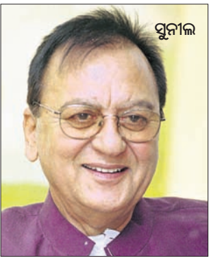
ରିନିଜ୍ ଥାଉଁରେକର୍ଡର ଅତୁଲ୍ଲ କରାଯାଇଥିଲା।

ବଲିଉଡର ଅନ୍ୟତମ ଲୋକପ୍ରିୟ ଅଭିନେତା ହେଉଛନ୍ତି ସୁନୀଲ ଦତ୍ତ। ଯେ କୌଣସି ଭୂମିକା ହେଉ, ତାହାକୁ ସୁଗୁରୁତ୍ୱେ ତୁଚ୍ଛକାରୀ ସେ ଥିଲେ ମାହିର। ୧୯୭୪ରେ ନିର୍ମିତ ହୋଇଥିଲା ଏକ ବର୍ତ୍ତମାନଙ୍କ (ନ୍ୟାରେଟିଭ୍) ଫିଲ୍ମ 'ୟାଦେଁ'। ଏଥିରେ ମାତ୍ର ଅଳ୍ପ କଳାକାର ଅଭିନୟ କରିଥିଲେ ଆଉ ପୁଣ୍ୟ ଭୂମିକାରେ ଥିଲେ ସୁନୀଲ। ଏହି ଫିଲ୍ମର ଅବଧୂ ଥିଲା ମାତ୍ର ୧୧୩ ମିନିଟ୍। କମ୍ ସଂଖ୍ୟକ କଳାକାରଙ୍କୁ ନେଇ ନିର୍ମିତ ଏହି ସମ୍ପଦ ଅବଧୂଶିଷ୍ଟ ଫିଲ୍ମଟିକୁ