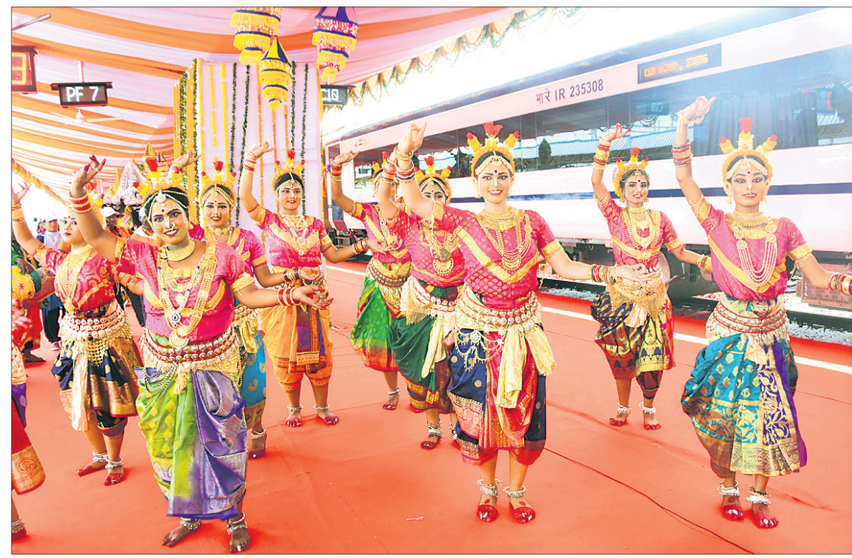
ପୁରୀ ରେଳ ଷ୍ଟେସନରେ ବନ୍ଦେ ଭାରତ ଏକ୍ସପ୍ରେସ୍ ଉଦ୍‌ଘାଟନ ଉତ୍ସବକୁ ନୃତ୍ୟଶିଳ୍ପୀମାନେ ନୃତ୍ୟକଳାରେ ସ୍ୱାଗତ କରୁଛନ୍ତି ।