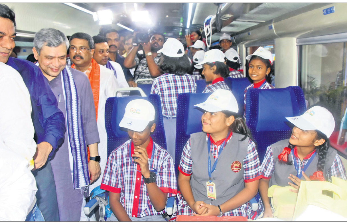
ବନ୍ଦେ ଭାରତ ଏକ୍ସପ୍ରେସ୍‌ରେ ଯାତ୍ରା କରୁଥିବା ଛାତ୍ରାଛାତ୍ରୀଙ୍କ ସହ ରେଳ ମନ୍ତ୍ରୀ ଅଶ୍ୱିନୀ ଦେବସିଂହ ଆଲୋଚନା କରୁଛନ୍ତି ।