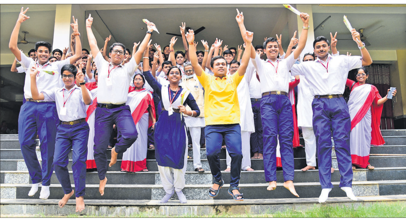
ମାଟ୍ରିକ ପରୀକ୍ଷାପୂର୍ଣ୍ଣ ଛାତ୍ରୀଙ୍କ ପ୍ରକାଶ ପାଇବା ପରେ ଭୁବନେଶ୍ୱର ସୁନିର୍ମିତ ସରସ୍ୱତୀ ଶିଶୁ ବିଦ୍ୟାଳୟର ଉତ୍ତୀର୍ଣ୍ଣ ଛାତ୍ରୀମାନେ ଖୁସି ମନାଉଛନ୍ତି।