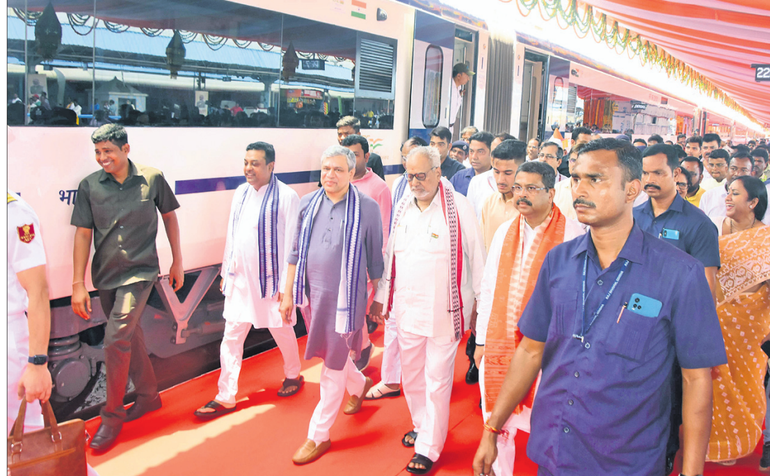
ପୁରୀ ରେଳ ଷ୍ଟେସନରେ ଥିବା ବନ୍ଦେ ଭାରତ ଏକ୍ସପ୍ରେସ୍‌କୁ ଅତିଥିମାନେ ଭୁଲି ଦେଖୁଛନ୍ତି ।