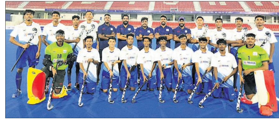
ଓଡ଼ିଶା ସର୍ବନିୟମର ପୁରୁଷ ହକି ଦଳ ।

ଭୁବନେଶ୍ୱର, ୧୮।୫ (ସ୍ପୋର୍ଟ୍ସ ଟୁଡ଼େ) ରାଉରକେଲାର ବିର୍ସାପୁଣ୍ଡା ଅନ୍ତର୍ଜାତୀୟ ହକି ଷ୍ଟାଡ଼ିୟମରେ ଅନୁଷ୍ଠିତ ୧୩ ତମ ଜାତୀୟ ସର୍ବ ନିୟମର ପୁରୁଷ ହକି ଚୁନାବଳୀ ଗୁରୁବାର ଆରମ୍ଭ ହୋଇଛି । ଭୁବନେଶ୍ୱର, ୧୮।୫ (ସ୍ପୋର୍ଟ୍ସ ଟୁଡ଼େ) ରାଉରକେଲାର ବିର୍ସାପୁଣ୍ଡା ଅନ୍ତର୍ଜାତୀୟ ହକି ଷ୍ଟାଡ଼ିୟମରେ ଅନୁଷ୍ଠିତ ୧୩ ତମ ଜାତୀୟ ସର୍ବ ନିୟମର ପୁରୁଷ ହକି ଚୁନାବଳୀ ଗୁରୁବାର ଆରମ୍ଭ ହୋଇଛି ।