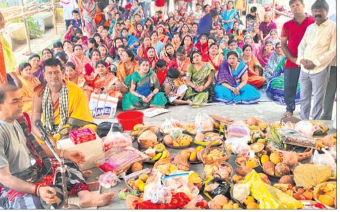
ବୈକୁଣ୍ଠ ନଗର ବୃତ୍ତୀୟ ଲାଲନରେ ଥିବା ପାର୍କିଂରେ ମହିଳାଙ୍କ ସାମୂହିକ ସାବିତ୍ରୀ ବ୍ରତ ପାଳନ।

ରେଖମା ସହରର ବିଭିନ୍ନ ସାହି ଓ ମନ୍ଦିରରେ ମହିଳାମାନେ ସାବିତ୍ରୀ ବ୍ରତ ଲାଗି ଭିଡ଼ ଜମାଇଥିଲେ। ବୈକୁଣ୍ଠ ନଗର, ବ୍ରଜନଗର, ଅମିଳା ନଗର, ରେବେକାର, ଗାନ୍ଧୀନଗର ସମେତ ପ୍ରତ୍ୟେକ ସାହିରେ ଓ ମନ୍ଦିରକୁଳିକରେ ସାମୂହିକ ଭାବେ ସାବିତ୍ରୀ ବ୍ରତ ପାଳିତ ହୋଇଥିଲା।