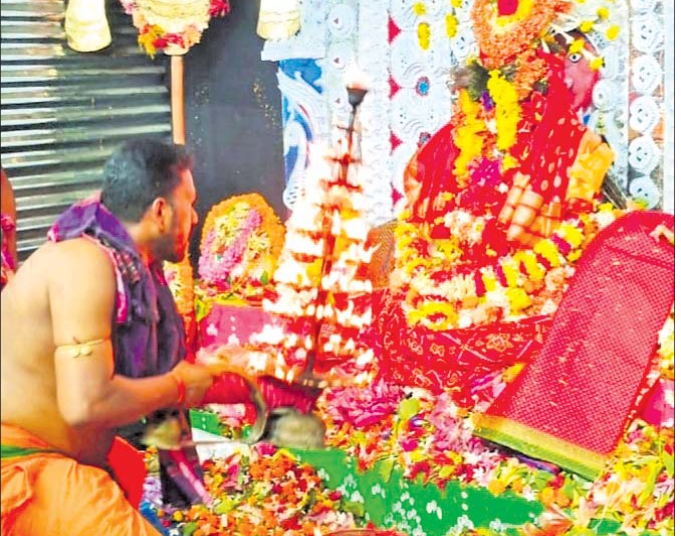
ପୂଜାମଣ୍ଡପରେ ମା' ତାରା ଦେବୀ।