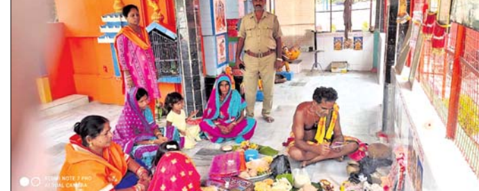
ଆସିକା, ୧୯୮୫ (ଡି.ଏନ.ଏ.):

ଜେଲ ସଂକଳ୍ପ ହନୁମାନ ମନ୍ଦିରରେ ଅନ୍ତେବାସୀ ମହିଳା ଏହି ପୂଜା କରିଥିଲେ। ଜେଲ ପ୍ରଶାସନ ପକ୍ଷରୁ ମହିଳାମାନଙ୍କୁ ଶାଢ଼ୀ, ଚୁଡ଼ି, ସିନ୍ଦୂର ସାଙ୍ଗକୁ ବିଭିନ୍ନ ଫଳ ଓ ପାକନ କରିଛନ୍ତି। ଆସିକା ସନ୍ତେକରେ ବିଚାରାଧୀନ ବନ୍ଦୀ ଭାବେ ରହିଥିବା ୪ଜଣ ମହିଳା ମଧ୍ୟ ଏହି ବ୍ରତ ପାଳନ କରିଛନ୍ତି।