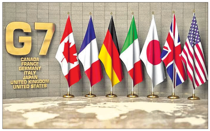
ଜି୭ ରାଷ୍ଟ୍ରମୁଖ୍ୟମାନେ ସମର୍ଥନ କରିଛନ୍ତି। ବିଶ୍ୱନେତାମାନେ ୧୯୪୫ ଅଗଷ୍ଟ ୬ରେ ପ୍ରଥମ ବିଶ୍ୱଯୁଦ୍ଧ ବେଳେ ଆମେରିକା ପକ୍ଷରୁ ହିରୋଶିମାରେ

ବିଶ୍ୱର ସବୁଠାରୁ ପ୍ରଭାବଶାଳୀ ରାଜତନ୍ତ୍ରଗୁଡ଼ିକର ନେତାମାନେ ଶୁକ୍ରବାର କାପାନର ହିରୋଶିମା ସହରରେ ଏକାଠି ହୋଇଛନ୍ତି। ଯୁକ୍ତମୁଖ୍ୟ ଉପରେ ୧୫ ମାସ ଧରି ଆକ୍ରମଣ କରି ରଖିଥିବା ରୁଷିଆକୁ ଦଣ୍ଡିତ କରିବା ପାଇଁ କିଛି ସମୟ ରାଷ୍ଟ୍ର ନେତୃତ୍ୱ ସମ୍ମିଳନୀର ପ୍ରଥମ ଦିନ ନୂଆ ରଣନୀତି ଘୋଷଣା କରାଯାଇଛି। ଯୁକ୍ତମୁଖ୍ୟ ରୁଷିଆ ରାଷ୍ଟ୍ରପତି ଭାବେ ପୂର୍ବତନ ଆଣବିକ ଆକ୍ରମଣ ଧନକ ସାଜକୁ ଉତ୍ତର କୋରିଆର ମାଧ୍ୟାଧିକ କାଳ କ୍ଷେପଣାସ୍ତ୍ର ପରୀକ୍ଷଣ ଏବଂ ଚାନ୍ସା ନୁହେଁ ବୋଲି ବିସ୍ତାର କରିବାକୁ ନିଷ୍ପତ୍ତି ନେଇଛନ୍ତି। ପୂର୍ବତନ ରାଷ୍ଟ୍ରପତି ଭାବେ ପୂର୍ବତନ ଆଣବିକ ନିରସ୍ତ୍ରୀକରଣ ଅଭିଯାନକୁ