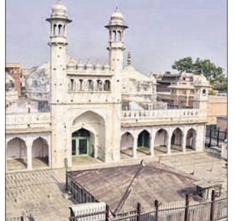
ତାହା କାଶୀବା ପାଇଁ କାର୍ବନ ଡେଟିଂ ନିମନ୍ତେ ଆଲୋଚନା ହୋଇଥିବା ସୁପ୍ରିମକୋର୍ଟ ନିର୍ଦ୍ଦେଶ ଦେଇଥିଲେ। ଭାରତର ପ୍ରଧାନ ବିଚାରପତି (ସିଜେଆଇ)

ବାରାଣସୀର ଜ୍ଞାନବାପୀ ମସଜିଦ୍-କାଶୀ ବିଶ୍ୱନାଥ କବିତର ମଧ୍ୟରେ ରହିଥିବା ଶିବଲିଙ୍ଗର କାର୍ବନ ଡେଟିଂକୁ ପରବର୍ତ୍ତୀ ଶୁଣାଣି ପର୍ଯ୍ୟନ୍ତ ସ୍ଥଗିତ ରଖିବା ପାଇଁ ସୁପ୍ରିମକୋର୍ଟ ଶୁକ୍ରବାର ଭାରତର ପ୍ରତ୍ୟେକ ସର୍ବୋଚ୍ଚ ସଂସ୍ଥା (ଏଏସ୍ଆଇ)କୁ ନିର୍ଦ୍ଦେଶ ଦେଇଛନ୍ତି। ଗତବର୍ଷ ଡିସେମ୍ବର ୧୯ରେ କେବଳ ଜ୍ଞାନବାପି କମ୍ପ୍ଲେକ୍ସ ପରିସରକୁ ଶିବଲିଙ୍ଗ ଭଳି ଏକ ବିବାଦୀୟ ଢାଞ୍ଚା ମିଳିଥିଲା। ତାହା ଶିବଲିଙ୍ଗ କି ନୁହେଁ ଏବଂ କେବେଠାକୁ ସେଠାରେ ରହିଛି,