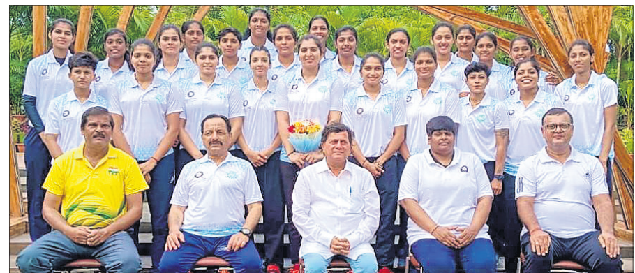
କୋଚ୍ ଓ କର୍ମଚାରୀଙ୍କ ସହ ଭାରତୀୟ ମହିଳା ଭଲିବଲ୍ ଦଳ।

ଭୁବନେଶ୍ୱର, ୧୯୮୫ (କ୍ରୀଡ଼ା ପ୍ରତିନିଧି) ସେଣ୍ଟାଲ ଏସିଆନ ଭଲିବଲ୍ ଆସୋସିଏସନ (କାଭା) ଚ୍ୟାଲେଞ୍ଜ୍ କପ୍ ମହିଳା ଭଲିବଲ୍ ଚାମ୍ପିୟନଶିପ୍ ଦେପାଳର କାଠମାଣ୍ଡୁରେ ଚଳିତ ମାସ ୨୨ରୁ ୨୮ ପର୍ଯ୍ୟନ୍ତ ଅନୁଷ୍ଠିତ ହେବ। ଏଥିପାଇଁ ଶୁକ୍ରବାର ଭାରତୀୟ ମହିଳା ଭଲିବଲ୍ ଦଳ ଯୋଷିତ କରାଯାଇଛି। ଏଥିରେ କେରଳରୁ ୬, ରେଲଫ୍ରେଡୁ ୫ ଏବଂ