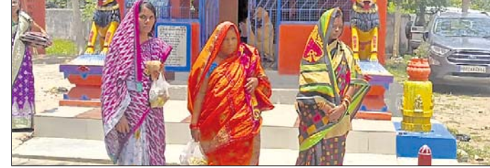
ମନ୍ଦିରକୁ ପୂଜା କରିବାକୁ ଆସିଥିବା ଅନ୍ତେବାସୀନୀ।

କୋଦଳା ଉପ କାରାଗାରରେ ବନ୍ଦୀ ଜୀବନ କାଉଥିବା ମହିଳା ଶୁକ୍ରବାର ସାବିତ୍ରୀ ବ୍ରତ ପାଳନ କରିଛନ୍ତି। ବିଭିନ୍ନ ଅପରାଧରେ ଜେଲ୍ରେ ରହିଥିବା ୩ ମହିଳାଙ୍କୁ ସାବିତ୍ରୀ ବ୍ରତ ପାଳନ କରିବା ପାଇଁ