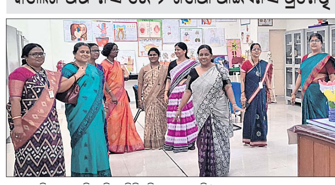
ଆଇଏନସିର ଦୁଇ ଜଣିଆ ଟିମ ଭିଡିଭିମି ଯାଞ୍ଚ କରୁଛନ୍ତି।

ଦୁଇଜଣ ଦୁଇଜଣ ଉପସ୍ଥିତ ନାହିଁ ଆଇଏନସି ସମସ୍ତ ଚାହାର ଯାଞ୍ଚ କରାଯାଇଛି।