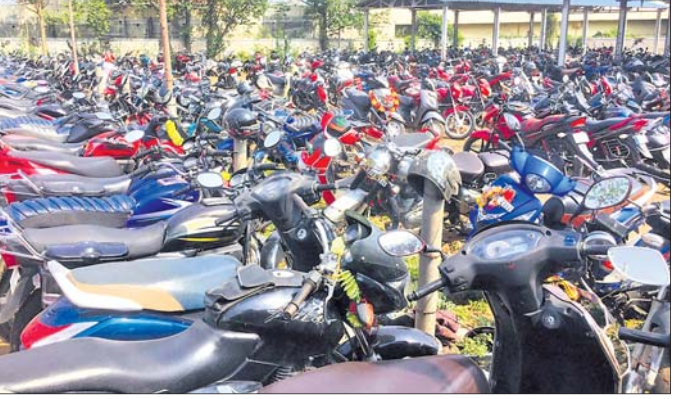
୪ ନଂ ପ୍ଲାଟଫର୍ମରେ ରହିଥିବା ପାର୍କିଂ ଷ୍ଟାଣ୍ଡ।

ବ୍ରହ୍ମପୁର ରେଳଓ୍ଵେ ଷ୍ଟେଶନରୁ ଦୈନିକ ପ୍ରାୟ ୧୦ ହଜାର ଯାତ୍ରୀଙ୍କ ଯାତାୟତ ରହିଥାଏ। ପ୍ରତିଦିନ ଏହି ଷ୍ଟେଶନ ଦେଇ ପାଞ୍ଚୋଟିରୁ ଏକପ୍ରକାର ଓ ଯୁଗପାଞ୍ଚ ଏକପ୍ରକାର ପିଣ୍ଡାଳ ୬୦ଟି ଟ୍ରେନ ଯାତାୟତ କରିଥାଏ।