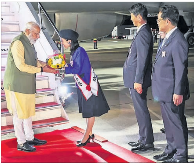
କିଛି ସମ୍ମିଳନୀରେ ଯୋଗଦେବା ପାଇଁ ଯାଇଥିବା ପ୍ରଧାନମନ୍ତ୍ରୀ ନରେନ୍ଦ୍ର ମୋଦିଙ୍କୁ ହିରୋଶିମାରେ ସ୍ଵାଗତ କରାଯାଇଛି।