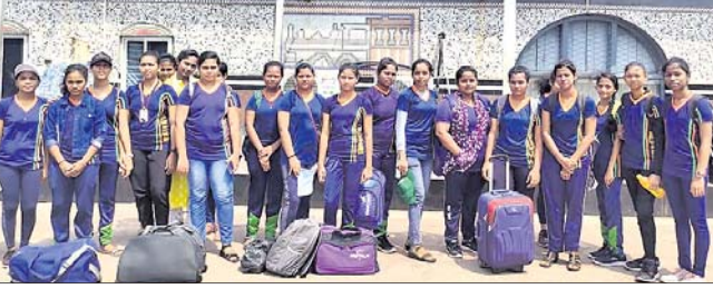
ଚେନ୍ନାଇ ଗସ୍ତ କରିଥିବା ଆଇଟିଆଇ ଛାତ୍ରୀ।

ବ୍ରହ୍ମପୁର ଆଇଟିଆଇର ୨୦ଜଣ ଛାତ୍ରୀ ଚେନ୍ନାଇସ୍ଥିତ ଜନସନ ଲିମିଟେଡ଼ କମ୍ପାନୀକୁ ନିମ୍ନଲିଖିତ କର୍ମରେ ଯୋଗ ଦେଇ ଚେନ୍ନାଇ ଗସ୍ତ କରିଛନ୍ତି।