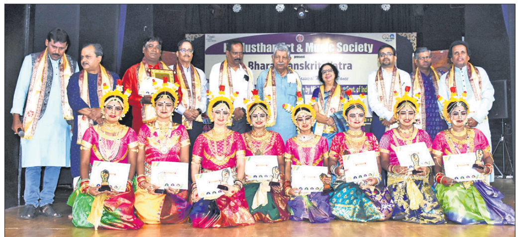
କୋଲକାତାର ହିନ୍ଦୁସ୍ଥାନ ଆର୍ଟ ଆଣ୍ଡ ମ୍ୟୁଜିକ୍ ସୋସାଇଟି ଓ ଭୁବନେଶ୍ୱରର ତ୍ରିଧାରା ଅନୁଷ୍ଠାନ ପକ୍ଷରୁ ଭୁବନେଶ୍ୱର ଭଞ୍ଜକଳା ମଣ୍ଡପରେ ଶନିବାର ଉଦ୍ଘାଟିତ 'ଭାରତ ସଂସ୍କୃତି ଯାତ୍ରା' କାର୍ଯ୍ୟକ୍ରମରେ ଅତିଥିଙ୍କ ଗହଣରେ ପୁରସ୍କୃତ ନୃତ୍ୟଶିଳ୍ପୀମାନେ।