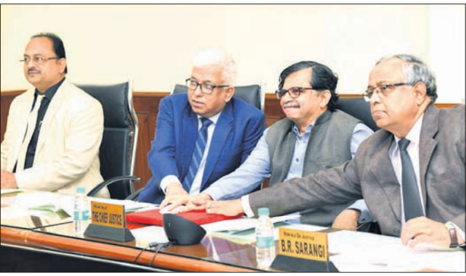
ହାଇକୋର୍ଟ ମୁଖ୍ୟ ବିଚାରପତି ଏସ୍. ମୁରଲୀଧର ହାଇକୋର୍ଟର କୋର୍ଟରୁ ଉଦ୍ଘାଟନ କରୁଛନ୍ତି।

ମହିଳା କୋର୍ଟର ବିଭାଗୀୟ ଅଧିକାରୀଙ୍କୁ ହାଇକୋର୍ଟ ମୁଖ୍ୟ ବିଚାରପତି ଅଭିନନ୍ଦନ ଜଣାଇଥିଲେ। ଉଦ୍ଘାଟନ ହୋଇଥିବା କୋର୍ଟରୁ