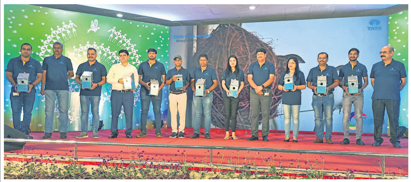
ଗାମା ସ୍ୱିଲ୍ ମାଲିନ୍ ଲିମିଟେଡ୍ ପକ୍ଷରୁ ନିକଟରେ ଲବ୍ଧ ଥିବା କାର୍ଯ୍ୟକ୍ରମର ଆୟୋଜନ କରାଯାଇଥିଲା । ଏହି ପରିପ୍ରେକ୍ଷାରେ କମ୍ପାନୀ ପକ୍ଷରୁ ସ୍ୱତନ୍ତ୍ର ଭାବେ ନିର୍ଦ୍ଦିତ କୃତ୍ରିମ ଚଢ଼େଇ ବସା ଉଚ୍ଚ କାର୍ଯ୍ୟକ୍ରମର ଅଂଶଗ୍ରହଣକାରୀମାନଙ୍କୁ ବର୍ଷର କରାଯାଇଥିଲା । ବିଶେଷକରି ଘର, କାର୍ଯ୍ୟାଳୟ ଓ ସାବିଜନୀନ ଗ୍ରାମରେ ଉଚ୍ଚ ବସାକୁ ଗ୍ରହଣ କରିବା ସହ ଚଢ଼େଇମାନଙ୍କ ବଂଶବୃଦ୍ଧି ଲାଗି ଏକ ଅନୁକୂଳ ପରିବେଶ ସୃଷ୍ଟି କରିବା ପାଇଁ ଏକାଧିକ ଏକ ପଦକ୍ଷେପ ଗ୍ରହଣ କରାଯାଇଛି । ଉଲ୍ଲେଖଯୋଗ୍ୟ, କମ୍ପାନୀର ସୁକିର୍ତ୍ତା ଗ୍ରୋପାଲର୍ ଖଣି ପରିସର ଅଞ୍ଚଳରେ ଘରଟିଆମାନଙ୍କ ପୁରଣା ଓ ସଂରକ୍ଷଣ ପାଇଁ ଅନେକ କୃତ୍ରିମ ଚଢ଼େଇ ବସା ଗ୍ରହଣ କରାଯାଇଛି ।