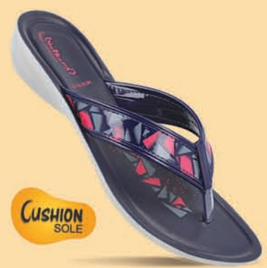
[WL7122 | ₹ 269.00*]