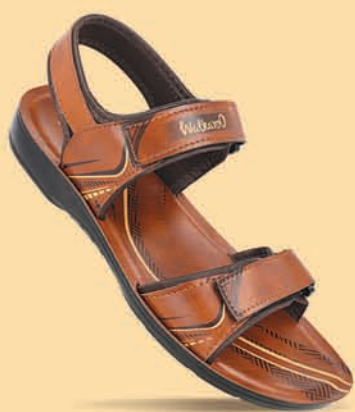
[WG5901 | ₹ 339.00*]