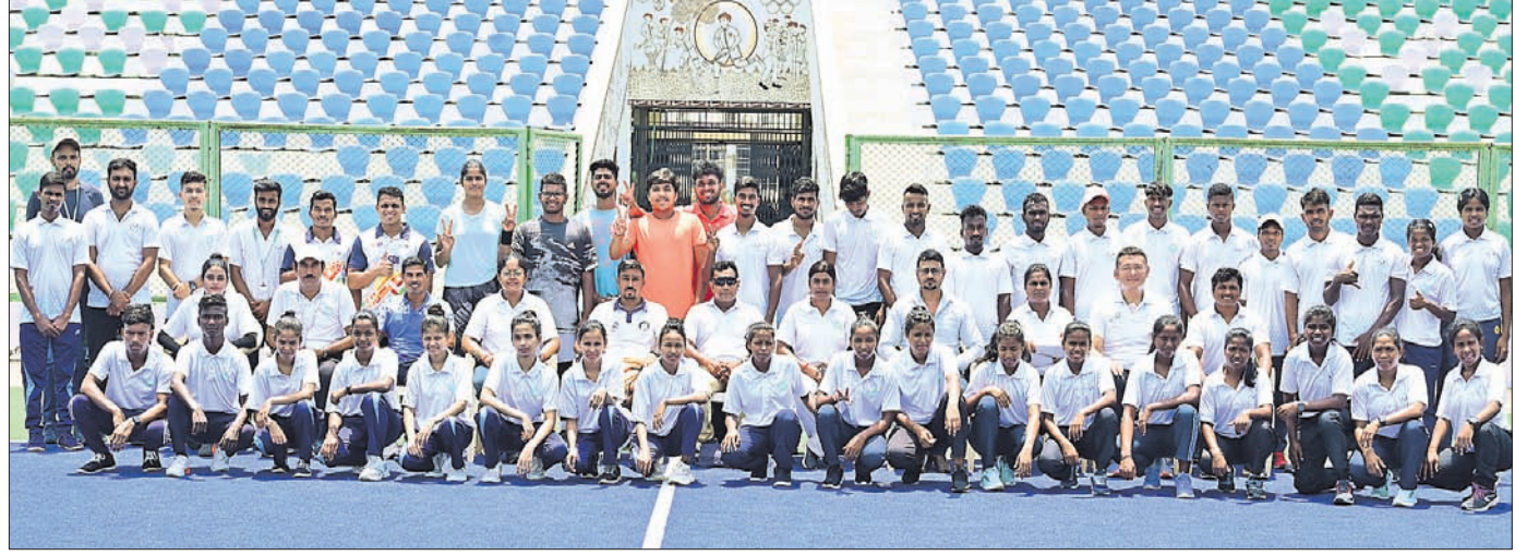
ଭରତ ପ୍ରଦେଶରେ ହେବାକୁ ଯାଉଥିବା ଖେଳୋ ଇଣ୍ଡିଆ ବିଶ୍ୱବିଦ୍ୟାଳୟ କ୍ରୀଡ଼ାରେ କିଟ୍‌ରୁ ପ୍ରତିନିଧିତ୍ୱ କରିବାକୁ ଯାଉଥିବା ଖେଳାଳି ଓ ଅଧିକାରୀମାନେ ।

ଭୁବନେଶ୍ୱର, ୨୦୧୫ (ଜ୍ଞାତା ପ୍ରତିନିଧି) ସ୍ନୋର୍ଡ୍ ଅଧିକାରୀ ଅଫ୍ ଇଣ୍ଡିଆ (ସାଲ) ଓ ଆସୋସିଏଟିଭ୍ ଅଫ୍ ଇଣ୍ଡିଆନ ସ୍ନୋର୍ଡ୍ ଅଧିକାରୀ (ଏଆଇସ୍) ଆନୁକୁଲ୍ୟରେ ଭରତ ପ୍ରଦେଶର ବିଭିନ୍ନ ସହରରେ ଖେଳୋ ଇଣ୍ଡିଆ ବିଶ୍ୱବିଦ୍ୟାଳୟ କ୍ରୀଡ଼ା ଚଳାଇ ସଂସ୍କରଣ ଚଳିତ ମାସ ୨୫ରୁ ଆରମ୍ଭ ହେବାକୁ ଯାଉଛି । ଏହା କ୍ରମେ ପର୍ଯ୍ୟନ୍ତ ଚାଲିବ । ଏହି ପ୍ରତିଯୋଗିତାରେ ଓଡ଼ିଶାରୁ ମୋଟ ୧୪୧ ପ୍ରତିନିଧି ଦଳ ଅଂଶଗ୍ରହଣ କରିବେ । ସେଥିରେ କେବଳ କିଟ୍ ବିଶ୍ୱବିଦ୍ୟାଳୟର ୭୧ ଜଣ ସାମିଲ । ଅଂଶଗ୍ରହଣକାରୀ ୧୪୧ ଜଣଙ୍କ ମଧ୍ୟରେ ୧୧୯ ଆଧିକାରୀ