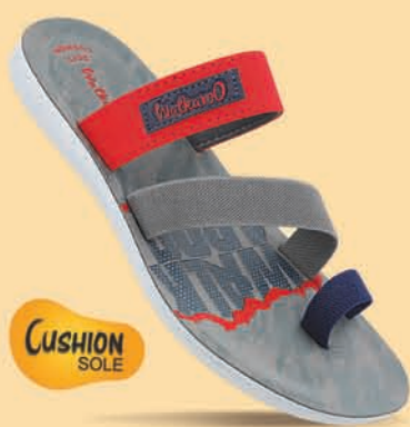
[WG5459 | ₹ 309.00*]