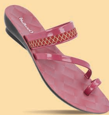
[WL7475 | ₹ 219.00*]