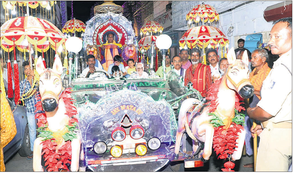
ବାଲୁକେଶ୍ୱର ବାବାଙ୍କ ପତରପେଣ୍ଡି ଶୋଭାଯାତ୍ରା।

ତେଣୁ ଛାତ୍ରଛାତ୍ରୀ ବିଭାଗୀୟ ଅଧିକାରୀଙ୍କୁ ଫୋନ୍ରେ ଯୋଗାଯୋଗ କରିଥିଲେ ମଧ୍ୟ ସେ ବ୍ୟକ୍ତିଗତ କାମ କରି ପରୀକ୍ଷା ହଲ୍ରେ ଥିବା ନ ଥିଲେ। ଏହାକୁ ନେଇ ପରୀକ୍ଷା ହଲ୍ରେ ଭଡେଜନା ପ୍ରକାଶ ପାଇଥିଲା। ପରେ ୧୨ଟା ୩୦ରେ ପରୀକ୍ଷା ଆରମ୍ଭ ହୋଇଥିଲା। ପିଲାଙ୍କ କହିବା କଥା, ପରୀକ୍ଷା ପୂର୍ବରୁ କଲେଜରେ ପାଠ୍ୟକ୍ରମ ଶେଷ କରାଯାଇ ନାହିଁ। ଛାତ୍ରଛାତ୍ରୀ ଅଭିଯୋଗ କଲେ ବାକି ଥିବା ପାଠ୍ୟକ୍ରମ ଯୁକ୍ତରୂପେ ପଢ଼ିବା ପାଇଁ ଅଧିକାରୀଙ୍କୁ କହିଛନ୍ତି। ଏନେଇ କଲେଜ ପ୍ରିନ୍ସିପାଲଙ୍କ ପ୍ରତିକ୍ରିୟା ମିଳିପାରି ନାହିଁ।