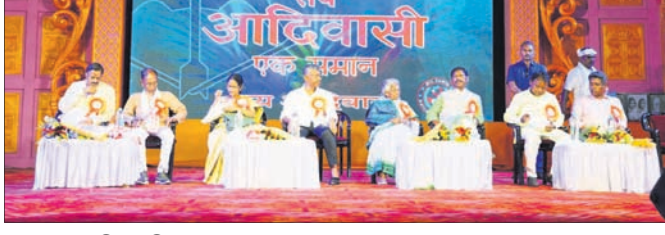
ମଞ୍ଚରେ ଉପସ୍ଥିତ ଅତିଥିମାନେ ।