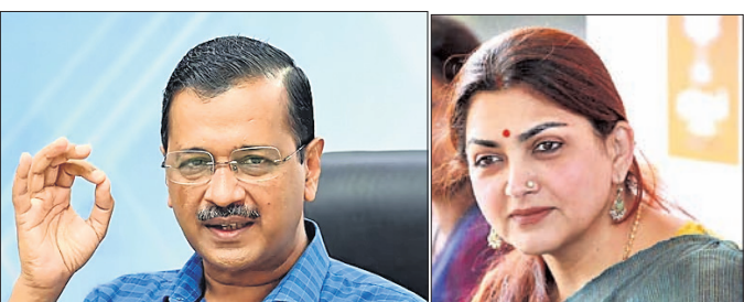
ଅଧିକ କେଜରିୱାଲ ଖୁସୀ ହୁଅନ୍ତୁ

କର୍ମେତାଙ୍କୁ ହିତ କରାଇବା ପାଇଁ କେଜରିୱାଲଙ୍କ ଭଲ ଅହଙ୍କାର ହୋଇପାରେ: ଭଜପା