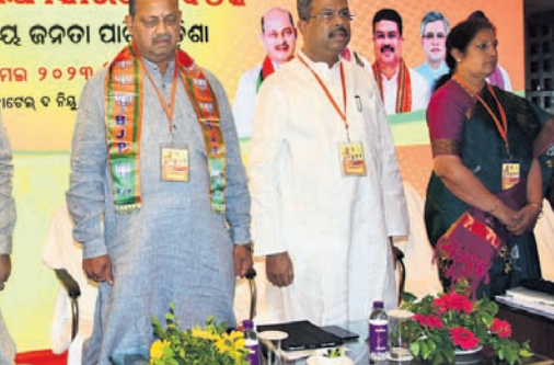
ଭୁବନେଶ୍ୱର ଏକ ହୋଟେଲରେ ଶନିବାର ଆୟୋଜିତ ଭଜପା କାର୍ଯ୍ୟକାରୀତା ବୈଠକରେ ଉପସ୍ଥିତ ବନ୍ଦୁକାରୀ ନେତୃତ୍ୱ