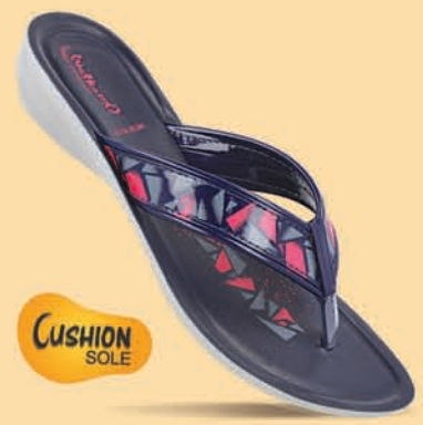
[ WL7122 | ₹ 269.00* ]