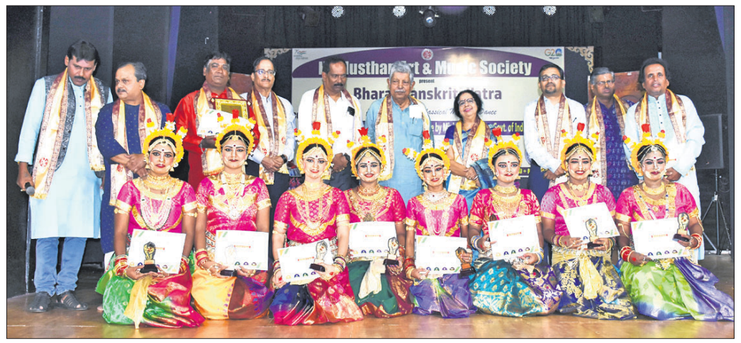
କୋଲକାତାର ହିନ୍ଦୁସ୍ଥାନ ଆର୍ଟ୍ ଆଣ୍ଡ୍ ମ୍ୟୁଜିକ୍ ସୋସାଇଟି ଓ ଭୁବନେଶ୍ୱରର ତ୍ରିଧାରା ଅନୁଷ୍ଠାନ ପକ୍ଷରୁ ଭୁବନେଶ୍ୱର ଭଞ୍ଜକଳା ମଞ୍ଚରେ ଶନିବାର ଉଦ୍ଘାଟିତ 'ଭାରତ ସଂସ୍କୃତି ଯାତ୍ରା' କାର୍ଯ୍ୟକ୍ରମରେ ଅତିଥିକ ଗହଣରେ ପୁରସ୍କୃତ ନୃତ୍ୟଶିଳ୍ପୀମାନେ।