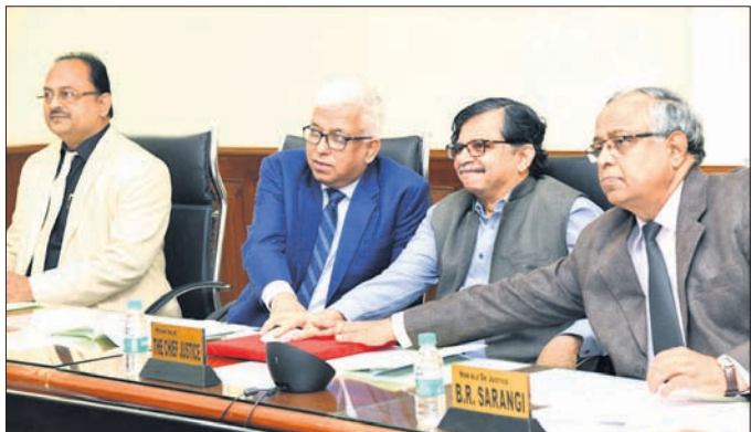
ହାଇକୋର୍ଟ ମୁଖ୍ୟ ବିଚାରପତି ଏସ୍. ମୁରଲୀଧର ହାଇକୋର୍ଟର କୋର୍ଟରୁ ଉଦ୍ଘାଟନ କରୁଛନ୍ତି।

ମହିଳା କୋର୍ଟର ବିଚାର ବିଭାଗୀୟ ଅଧିକାରୀଙ୍କୁ ହାଇକୋର୍ଟ ମୁଖ୍ୟ ବିଚାରପତି ଅଭିନନ୍ଦନ ଜଣାଇଥିଲେ। ଉଦ୍ଘାଟନ ହୋଇଥିବା କୋର୍ଟରୁ