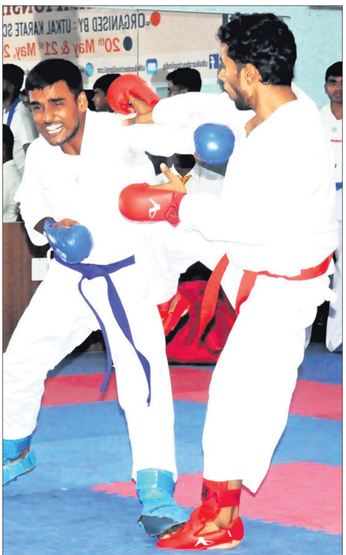
ପ୍ରଥମ ଦିବସ ଶନିବାର ଦୁଇ କରାଟେକାଙ୍କ ମଧ୍ୟରେ ପାଇଲ୍।