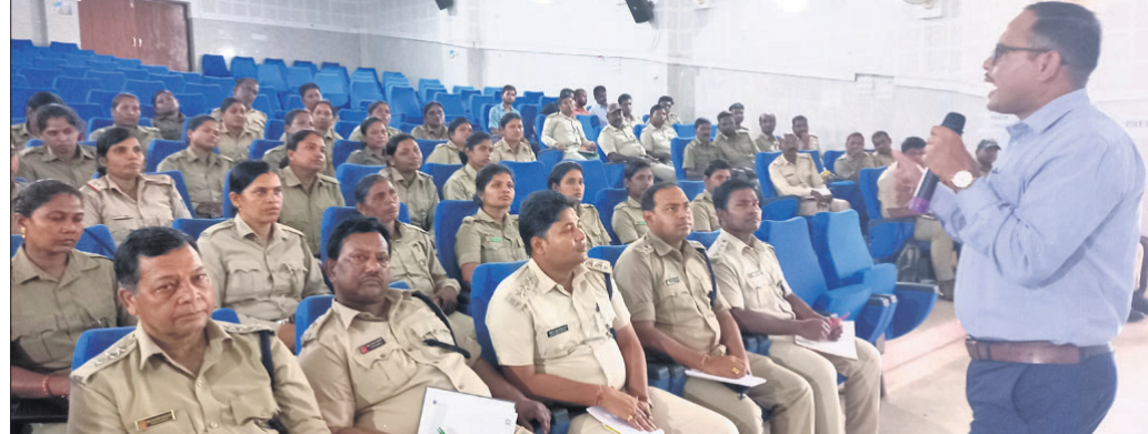
ବନ କର୍ମଚାରୀମାନେ ପ୍ରଶିକ୍ଷଣ ନେଉଛନ୍ତି ।

କେନ୍ଦୁଝର, ୨୦୧୫(ସ୍ୱ.ପ୍ର.)- ଜଙ୍ଗଲ ପରିବେଶ ଓ ଜଳବାୟୁ ପରିବର୍ତ୍ତନ ବିଭାଗ ପକ୍ଷରୁ ଶନିବାର ସଂସ୍କୃତି ଭବନରେ ଦକ୍ଷତା ବିକାଶ ପାଇଁ ଏକ ତାଲିମ ଶିବିର ଅନୁଷ୍ଠିତ ହୋଇଯାଇଛି । ଶିବିରରେ କେନ୍ଦୁଝର ଡିଭିଜନର ୭ ଟି ରେଞ୍ଜ ଯଥା ତେଲକୋଇ, ଭୂୟାଁ କୁଆଙ୍ଗ ପାଡ଼, ଚମ୍ପୁଆ, ବଡ଼ବିଲ, ସଦର, ଘଟଗାଁ, ପାଟଣା ରେଞ୍ଜର ଫରୋଷ୍ଟର ଏବଂ ଫରୋଷ୍ଟ ଗାଡ଼ମାନେ ଉପସ୍ଥିତ ରହି ତାଲିମ ନେଇଥିଲେ । କାର୍ଯ୍ୟକ୍ରମକୁ ଡିଏଫଓ