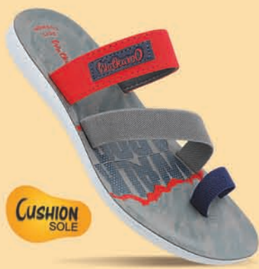
[ WG5459 | ₹ 309.00* ]