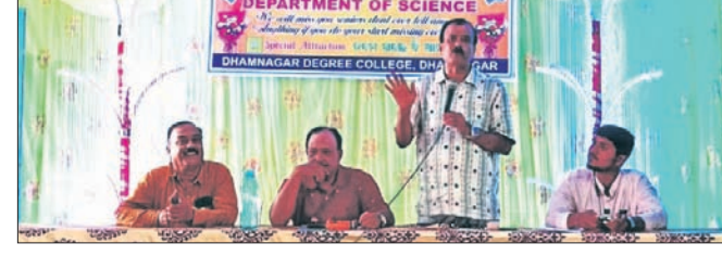
ବିଦାୟ ଉତ୍ସବରେ ଉପସ୍ଥିତ ଅତିଥି ।