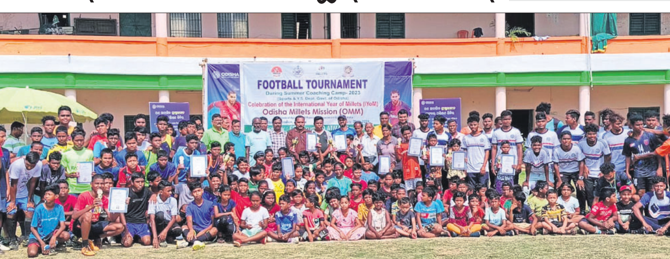
ସୁବ କ୍ରୀଡ଼ାବିତଙ୍କ ସହ ଅଧିକାରୀ ଓ ଲୋକ ପ୍ରତିନିଧିମାନେ ।