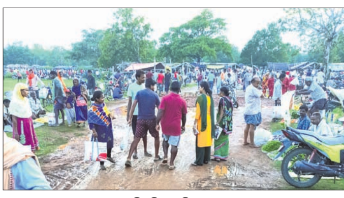
ତାହାବଡ଼ି ସାପ୍ତାହିକ ହାଟ ।

ମୟୂରଭଞ୍ଜ ଜିଲାର ବୈଶିଙ୍ଗା ଅଞ୍ଚଳରେ ବୁଡ଼ାବଳଙ୍ଗ ଓ ଗଜାହାର ନଦୀ ଅବବାହିକାରେ ପ୍ରଭୁର ପରିମାଣରେ ପରିପରିବା ଗଣ କରାଯାଇଥାଏ । ଚଳିତ ବର୍ଷ ମଧ୍ୟ କହି, ବାଲଗଣ, ବିଲାଡି, କାକୁଡି, ପୋଟଳ, ଲଙ୍କା, ଖୁଡ଼ା ଆଦିର ଉତ୍ପାଦନ ଭଲ ହୋଇଛି । ମାତ୍ର ପ୍ରବଳ ଖରା ଓ ଗରମରୁ ଦୈନିକ କୁଳୁଣ୍ଡାଲରୁ ଉର୍ଦ୍ଧ୍ୱ ପରିବା ପତି ନଷ୍ଟ ହୋଇଯାଉଥିବା ପାଟଳାପୁରୀ, ଶାଳଗାଁ, ନାଖରା, ଚେପୌଦା, ଦେପାଡ଼ା, ଦାରିହା, ପ୍ରତିପାଦେଇପୁର, ମାଣଗ୍ରା, ଚନ୍ଦନପୁର, ମାନଗୋବିନ୍ଦପୁର ଆଦି ଅଞ୍ଚଳର ଗଣାମାନେ କହିଛନ୍ତି । ଶୀତଳଭଣ୍ଡାର ଥିଲେ ଉତ୍ପାଦିତ ଫସଲ ଦାମ୍ ଦିନ ସଂରକ୍ଷିତ ରଖି କଟକ, ଭୁବନେଶ୍ୱର ସମେତ ରାଜ୍ୟର ବିଭିନ୍ନ ଅଞ୍ଚଳକୁ ଯୋଗାଇ ହୋଇପାରନ୍ତା ବୋଲି କହିଛନ୍ତି । ପ୍ରକାଶ ଯେ, ବୈଶିଙ୍ଗା, ମାଣଗ୍ରା, ବେତନଟା ଆଦି ପରିବା ପାକେଟରେ ଦର ମାତ୍ରାଧିକ ହୁଏ ଯାହା