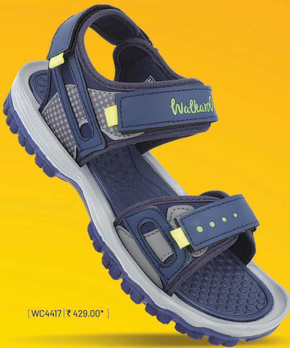
[ WC4417 | ₹ 429.00* ]