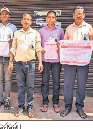
କଳାବ୍ୟାଜ୍ ପରିଧାନ କରିଥିବା ଅମଳା ସଂଘର କର୍ମଚାରୀ।