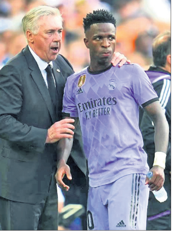
କୋର୍ କାଲୋ ଆଡ୍ରେଲୋକି ସହ ଭିନିସିୟସ୍ କୁନିୟର ।

ଲିଗ୍ ଭାବରେ ପ୍ରସିଦ୍ଧ ଅର୍ଜନ କରିଥିଲା ତାହା ବର୍ତ୍ତମାନ ଜାତିଆଣ ବାଦାଳି ଲିଗ୍ ପାଇଁ ବୋଲି ସେ ଅଭିଯୋଗ କରିଥିଲେ । ୨ ବର୍ଷୀୟ ଭିନିସିୟସ୍ ୫ ବର୍ଷ ତଳେ ସାନିସ୍ ଲିଗ୍ ଖେଳିବା ପାଇଁ ସେନକୁ ସ୍ଥାନାନ୍ତରିତ ହୋଇଥିଲେ । ଦର୍ଶକ ମାନେ ଭିନିସିୟସ୍ଙ୍କୁ ମାଙ୍କଟ ବୋଲି ସଂସ୍ଥାପନ କରିଥିବା ବେଳେ ଏହାକୁ ନେଇ ରିୟଲ ମାଡ୍ରିଡ୍ କୋର୍ କାଲୋ ଆଡ୍ରେଲୋକି ଅସନ୍ତୋଷ ପ୍ରକାଶ କରିଛନ୍ତି । ଏହି ଘଟଣା ପରେ କୋର୍ ଭିନିସିୟସ୍ଙ୍କୁ ପଡିଆରୁ ବାହାରକୁ ନେଇଥିଲେ । ପଡିଆରୁ ବାହାରକୁ ଯିବା ସମୟରେ ଭିନିସିୟସ୍ ଭାଲେନ୍ସିଆ ଦର୍ଶକଙ୍କ ଆଡକୁ ମଝି ଆକୁଳି ଦେଖାଇଥିଲେ, ଯାହାକୁ ଅନେକ ଖେଳାଳି ବିରୋଧ କରିଛନ୍ତି । ଭିନିସିୟସ୍ଙ୍କୁ ସମର୍ଥନ ଦମର୍ଥକଙ୍କୁ ସମା ମାରିବା ଉଚିତ୍ ବୋଲି କହିଛନ୍ତି ଭାଲେନ୍ସିଆ କୋର୍ । ତେବେ ଏହି ମାମଲାରେ ବ୍ରାଜିଲର ରାଷ୍ଟ୍ରପତି ଜୁଇଜ୍ ଜାନାଇକୋ ଲୁଲ୍ଡା ଡି ସିଲ୍ଭା ଓ ଫିଫା ବିଶ୍ୱକପ୍ରେ ଗୋଲ୍ଡେନ୍ ବୁଲ୍ ବିଜେତା ତଥା ପ୍ୟାରିସ୍ ସେଣ୍ଟ ଜର୍ମେନ୍ ଷ୍ଟାଡିୟମ କିଲିଆନ୍ ଏମ୍ବାପେ ଭିନିସିୟସ୍ଙ୍କୁ ସମର୍ଥନ କରିଛନ୍ତି । ଏମ୍ବାପେ ଏକ ଚିଠି ଲେଖିବା ସହିତ ଏହି ଲଢେଇରେ ତୁମେ ଏକତ୍ର ଆମେ ଆମେ ତୁମ ସହିତ ଅଛୁ ବୋଲି ଲେଖାଯାଇଛି ।