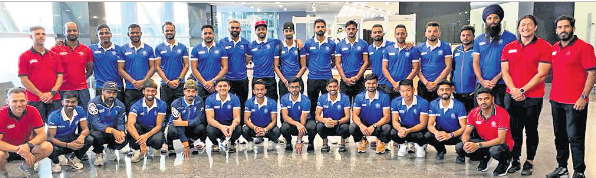
ଏସିଆନ ଗେମ୍ସ ପ୍ରତି ଲାଗି ଖେଳିବାକୁ ସୁରୋପ ଗପ୍ତ କରିଥିବା ଭାରତୀୟ ହକି ଦଳ ।

ବେଙ୍ଗାଳୁରୁ, ୨୨।୫ ସୁରୋପରେ ଏସିଆନ ଗେମ୍ସ ପ୍ରତି ଲାଗି ଖେଳିବାପାଇଁ ଭାରତୀୟ ହକି ଦଳ ଯୋଗଦାନ କରିଛି । ମେ ୨୨ରୁ ଆରମ୍ଭ ହେଉଥିବା ଏହି ଗପ୍ତରେ ଭାରତୀୟ ଦଳ ପ୍ରଥମ ପର୍ଯ୍ୟାୟରେ ଅଲିମ୍ପିକ୍ ଚାମ୍ପିୟନ ବେଲଜିୟମ ଏବଂ ଆୟୋଜକ ଗ୍ରେଟ୍ ବ୍ରିଟେନକୁ ଭେଟିବ । ବେଲଜିୟମ ବିପକ୍ଷରେ ୨୬ ଓ ଲୁକ୍ ୨ରେ ଏବଂ ବ୍ରିଟେନ ବିପକ୍ଷରେ ମେ ୨୭ ଓ ଲୁକ୍ ୩ରେ ମ୍ୟାଚ ଅନୁଷ୍ଠିତ ହେବ । ଏହାପରେ