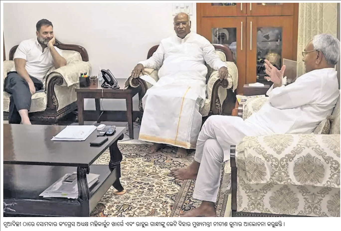
ରୂପାଦିକା ଠାରେ ସୋମବାର କଂଗ୍ରେସ ଅଧକ୍ଷ ମଲ୍ଲିକାର୍ଜୁନ ଖାର୍ଜେ ଏବଂ ରାଜୁଲ ଗାନ୍ଧୀଙ୍କୁ ଭେଟି ବିହାର ମୁଖ୍ୟମନ୍ତ୍ରୀ ନୀତୀଶ କୁମାର ଆଲୋଚନା କରୁଛନ୍ତି ।