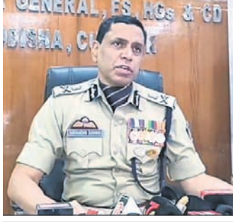
୬ ମାସରେ ଅଗ୍ନିଶମ ବିଭାଗରେ ନିଯୁକ୍ତି ହେବେ ୧୧୦୦ କର୍ମଚାରୀ

ସେ ଆହୁରି କହିଛନ୍ତି, ୨୦୦୦ରେ ରାଜ୍ୟରେ ୧୧୨ ଦମକଳ କେନ୍ଦ୍ର ଥିଲା । ଏବେ ଏହା ୩ ଗୁଣ ବୃଦ୍ଧି ପାଇ ୩୪୫ରେ ପହଞ୍ଚିଲାଣି । ଏହି କେନ୍ଦ୍ରଗୁଡ଼ିକ କେବଳ ଆଗ୍ନେୟ ବୃଦ୍ଧି ଯୋଗୁଁ ଆଉ ନିର୍ବାପନ କାର୍ଯ୍ୟ କରୁନାହିଁ ବରଂ ବୃଦ୍ଧିଗଣା, ପ୍ରାକୃତିକ ବିପର୍ଯ୍ୟୟ ସମୟରେ ପ୍ରଥମ ରେସ୍ପୋନ୍ସ ଭାବେ କାମ କରୁଛି । ଓଡ଼ିଶାର ପ୍ରାକୃତିକ ବିପର୍ଯ୍ୟୟ ପରିଚାଳନା ଦେଶ ଓ ବିଦେଶରେ ସୁନାମ ଆଣିଛି । ଏବେ ରାଜ୍ୟରେ ଆଗଭଳି ଚାଳ ଛପର ଘର ନାହିଁ କି ଆଗ ଭଳି ଘରପୋଡ଼ି ଆଉ ହେଉ ନାହିଁ । କିନ୍ତୁ ଉଚ୍ଚ ଏବଂ ଅତି ଉଚ୍ଚ ଅତୀତା ଗଢ଼ି ଉଠିବାର ଲାଗିଛି । ସାଗ୍ନା, ଶିଖା, ଶିଳ୍ପ ଆଦି ବିଭିନ୍ନ କ୍ଷେତ୍ରରେ ରହିଥିବା ଉଚ୍ଚ ଅତୀତାଗୁଡ଼ିକରେ ଆଗ୍ନେୟ ବୃଦ୍ଧିଗଣର ଆଘାତ ରହିଛି । ସେଥିପାଇଁ ଅଗ୍ନିଶମ ବିଭାଗ ପ୍ରସ୍ତୁତ ରହିଛି । ବଳିତବର୍ଷ ଅଗ୍ନିଶମ ବିଭାଗର ଆଧୁନିକୀକରଣ ଓ ସାମର୍ଥ୍ୟ ବୃଦ୍ଧି ପାଇଁ ୨୪୦ କୋଟି ଟଙ୍କା ଅଧିକ ଅନୁଦାନ ଦେବା ପାଇଁ ଆଲୋଚନା ଚାଲିଛି । ଏହାଛଡ଼ା ଆଗାମୀ ୬ ମାସ ମଧ୍ୟରେ ଅଗ୍ନିଶମ ସଂସ୍ଥାରେ ୧,୧୦୦ ନୂଆ କର୍ମଚାରୀଙ୍କୁ ନିଯୁକ୍ତି ଦେବା ପାଇଁ ରାଜ୍ୟ ସରକାରଙ୍କ ଅନୁମତି ମିଳିଯାଉଛି । ଏଥିପାଇଁ ନିଯୁକ୍ତି ପ୍ରକ୍ରିୟା ମଧ୍ୟ ଆରମ୍ଭ ହୋଇଛି । ଅପରପକ୍ଷରେ ରାଜ୍ୟରେ ବର୍ତ୍ତମାନ ୧୫,୯୧୮ ଗୁରୁତ୍ୱପୂର୍ଣ୍ଣ କାର୍ଯ୍ୟରେ ଅଛନ୍ତି । ସେମାନଙ୍କ ସମସ୍ୟା ସମାଧାନ ଦିଗରେ ଦୃଷ୍ଟି ଦିଆଯିବ । ଆଶା କରିବି ସେମାନେ ବକ୍ଷତା ଓ ନିଷ୍ଠାର ସହ ସେବା ପ୍ରଦାନ କରି ଲୋକଙ୍କ ଆତ୍ମାଭୀତ ହେବେ । ଆଗାମୀ ଦିନରେ ରାଜ୍ୟ ଅଗ୍ନିଶମ ଓ ଗୁରୁତ୍ୱପୂର୍ଣ୍ଣ ସଂସ୍ଥା ନିଜର ସମ୍ମାନ ଓ ପରିଚୟ ଦେଖିବିଦେଶରେ ବଜାୟ ରଖିବାକୁ ଯତ୍ନବାଦୀ ହେବ ବୋଲି ସେ କହିଛନ୍ତି ।