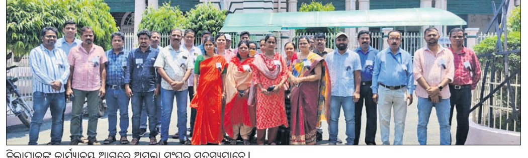
ଜିଲ୍ଲାପାଳଙ୍କ କାର୍ଯ୍ୟାଳୟ ଆଗରେ ଅମଳା ସଂଘର ସଦସ୍ୟମାନେ।

ଏକମାତ୍ର ଦାବି ସ୍ୱୀକୃତି ଶିକ୍ଷାଗତ ଯୋଗ୍ୟତା ଭିତ୍ତିରେ ଜିଲ୍ଲାସ୍ତରୀୟ କନିଷ୍ଠ ଅମଳାମାନଙ୍କର ମୂଳ ଦରମା ୯୩୦୦ ଟଙ୍କା ସହ ଗ୍ରେଡ୍ ଯେ ୪୨୦୦ ଟଙ୍କା ବା ଲେଭଲ-୯ ଅନୁଯାୟୀ ଦରମା ପ୍ରଦାନ କରାଯାଉ। ମେ ୩୧ ସରକାର କୌଣସି ସଦକ୍ଷେପ ନ ନେବାକୁ ସୋମବାରଠାରୁ ଧାମନଗର ତହସିଲ ଓ ବ୍ଲକ୍ରେ କାର୍ଯ୍ୟବଦ୍ଧ ଅମଳାମାନେ କଳାବ୍ୟାଜ୍ ପରିଧାନ କରି କାର୍ଯ୍ୟ କରୁଛନ୍ତି। ଆସନ୍ତା ୩୧ ତାରିଖ ପର୍ଯ୍ୟନ୍ତ ଏଭଳି କାରି ରହିବ। ଜିଲ୍ଲାରେ ବିଭିନ୍ନ ବିଭାଗରେ ଅମଳାମାନଙ୍କର