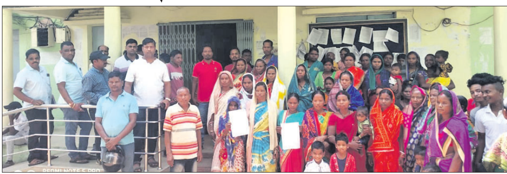
ଦାବିପତ୍ର ଦେବାକୁ ଆସିଥିବା ଗ୍ରାମବାସୀ।

ସୋମବାର ସଦର ବ୍ଲକ୍ ଉତ୍ତର ଅଧିକାରୀଙ୍କୁ ଦାବିପତ୍ର ପ୍ରଦାନ କରିଛନ୍ତି। ଲୋକଙ୍କ ସେବା ଓ ଉତ୍ତର ମୂଳକ କାମରେ ଉକ୍ତ ବ୍ଲକ୍ ଅଧିକାରୀ ସହଯୋଗ କରୁ ନ ଥିବା ସରପଞ୍ଚ ଅଭିଯୋଗ କରିଛନ୍ତି। ଫଳରେ କୌଣସି ଜନକଲ୍ୟାଣ କାମ ହୋଇ ପାରୁନାହିଁ। ଏଣୁ ଲୋକଙ୍କ ଅସନ୍ତୋଷ ବଢ଼ିଛି। ଆଗକୁ ଚାଷ କାର୍ଯ୍ୟ ଆରମ୍ଭ ହେବାକୁ ଥିବାରୁ ସେମାନଙ୍କୁ ବଦଳି କରା ନ ଗଲେ କାର୍ଯ୍ୟ ବ୍ୟାହତ ହେବା ସହ ଅସନ୍ତୋଷ ବଢ଼ିବ ବୋଲି ଦାବିପତ୍ରରେ ଉଲ୍ଲେଖ କରାଯାଇଛି।