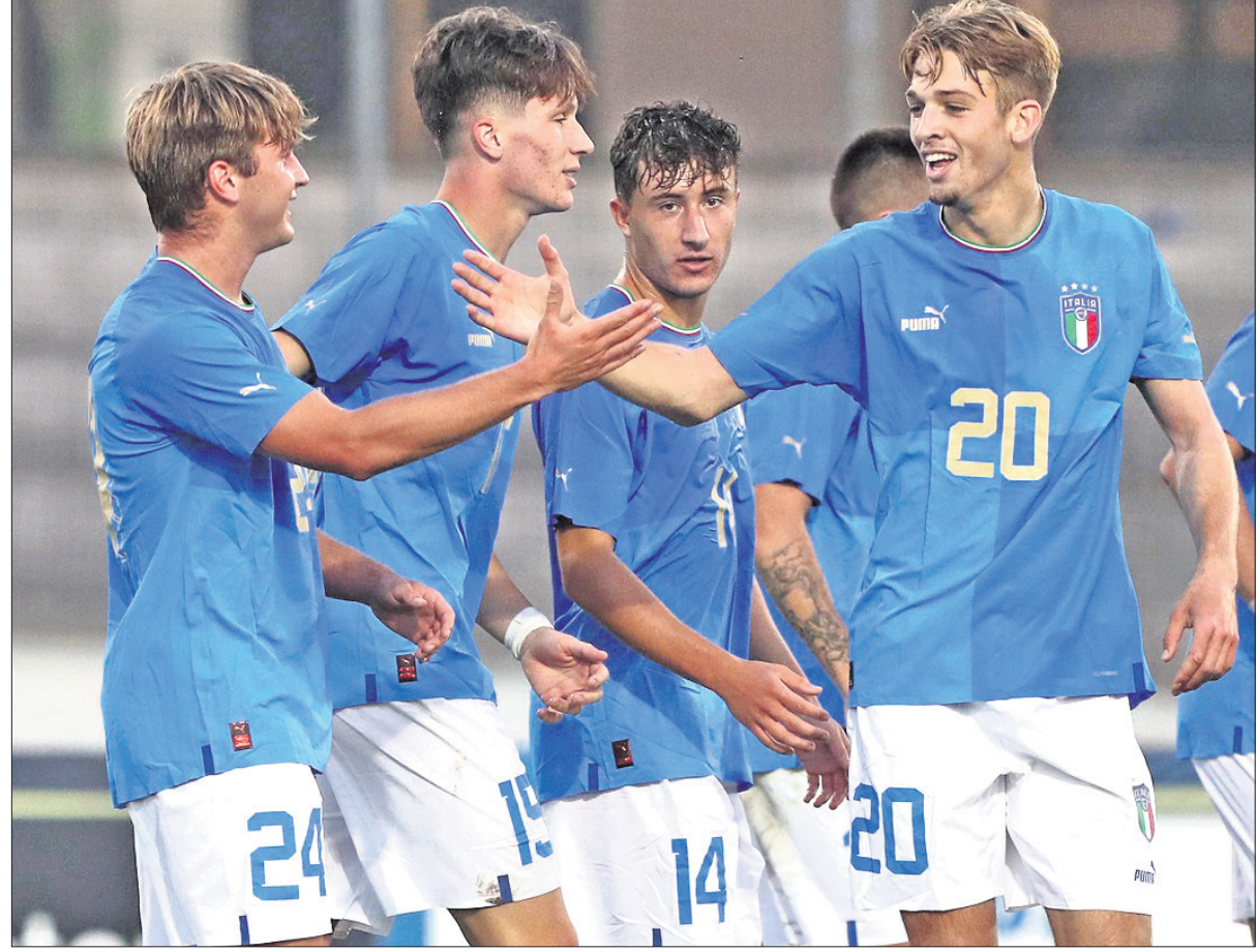
୨୦ ବର୍ଷରୁ କମ୍ ପୁରୁବଳ ବିଶ୍ୱକପରେ ସେନେଗାଲକୁ ହରାଇବାପରେ ଉଲ୍ଲସିତ ଜାପାନ ଦଳର ଖେଳାଳି ।