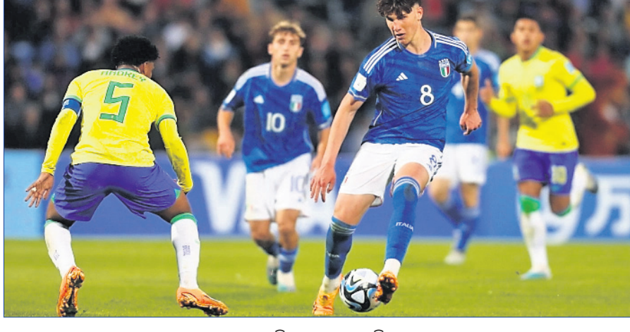
ଇଟାଲୀ ଓ ବ୍ରାଜିଲ ମଧ୍ୟରେ ଅନୁଷ୍ଠିତ ମ୍ୟାଚ ।