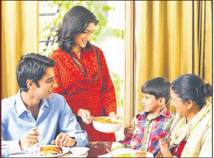
ଏମାନେ କ'ଣ କରନ୍ତି

ଆଗ କ୍ୟାରିୟର ତା'ପରେ ବାହାଘର। ଏମିତି ଏକ ଲକ୍ଷ୍ୟ ନେଇ ନିଜକୁ ପ୍ରସ୍ତୁତ କରୁଛନ୍ତି ଆଜିର ଉଚ୍ଚଶିକ୍ଷିତା ଯୁବତୀ। କିନ୍ତୁ ବେଳେବେଳେ ଚାକିରି କରିବା ପୂର୍ବରୁ ବିବାହ ହୋଇଯାଉଛି। ସେମିତି କ୍ଷେତ୍ରରେ ଏବେ ଦେଖିବାକୁ ମିଳୁଛି ଶାଶୁଘର ଲୋକ ବି ଝିଅଟିର ସ୍ୱପ୍ନ ପୂରା କରିବାକୁ ସହଯୋଗର ହାତ ବଢ଼ାଉଛନ୍ତି।