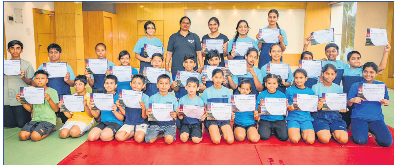
କଳିଙ୍ଗ ଷ୍ଟାଡ଼ିୟମରେ ସୋନବାର ଶେଷ ହୋଇଥିବା ଏକାଧିକ କ୍ରୀଡ଼ାର ସମର କ୍ୟାମ୍ପରେ ଅଂଶଗ୍ରହଣ କରିଥିବା କୁଡ଼ୋ ଓ ଭାରୋଲୋକନ ପ୍ରଶିକ୍ଷାର୍ଥୀମାନେ ପ୍ରମାଣପତ୍ର ପ୍ରଦର୍ଶନ କରୁଛନ୍ତି ।