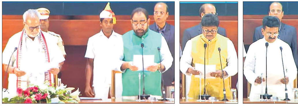
ସୋମବାର ରାଜ୍ୟପାଳ ପ୍ରଫେସର ରାମକୃଷ୍ଣା ଲାଲ ୩ ନୂଆ ମନ୍ତ୍ରୀଙ୍କୁ ଶପଥପାଠ କରାଉଛନ୍ତି।

ଭୁବନେଶ୍ୱର, ୨୨୧୫ (ଝୁମରୋ) ପୁଣ୍ୟମନ୍ତ୍ରୀ ନବୀନ ପଟ୍ଟନାୟକ ୩ ପୂର୍ବତନ ମନ୍ତ୍ରୀଙ୍କୁ ପୁଣିଥରେ ନିଜ କ୍ୟାବିନେଟରେ ଦାୟିତ୍ୱ ଦେଇଛନ୍ତି। ଏହାପରେ ସେମାନଙ୍କୁ ପଦ ଓ ଗୋପନୀୟତା ଶପଥ ପାଠ କରାଇଛନ୍ତି।