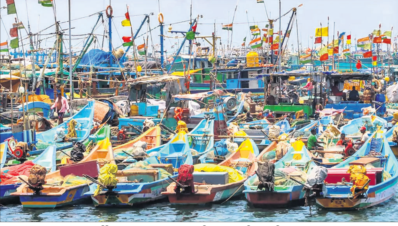
ସମୁଦ୍ରରେ ୨୧ ଦିନିଆ ମାଛଧରା କରକଣା ଯୋଗୁ ଚେରାଇ କାସିମେଡୁ ପୋତାଗୁଡ଼ିକ ନିକଟରେ ଲାଗିଥିବା ମାଛଧରା ବୋର୍ଡ।