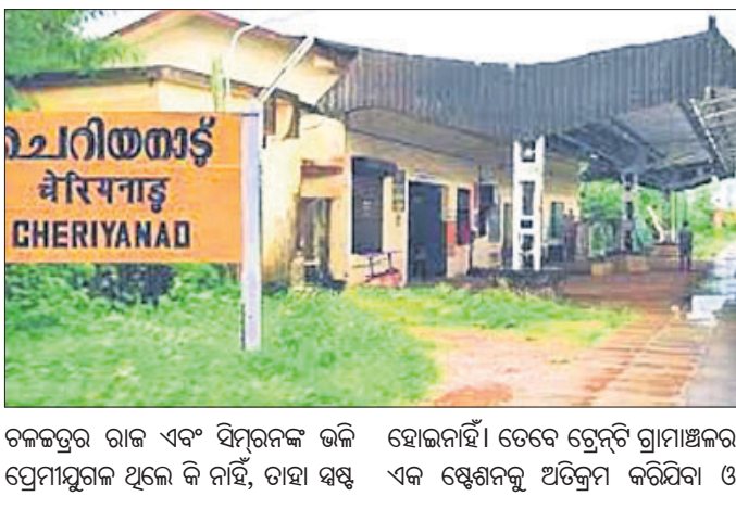
ଚକଟରୁ ରାଜ ଏବଂ ସିପୁରନଙ୍କ ଭଳି ହୋଇନାହିଁ। ତେବେ ଟ୍ରେନ୍ଟି ଗ୍ରାମାଞ୍ଚଳର ଏକ ଷ୍ଟେଶନକୁ ଅତିକ୍ରମ କରିଥିବା ଓ

ଯାତ୍ରୀଙ୍କୁ ଉଠାଇବା ପାଇଁ ପୁଣିଥରେ ପଛକୁ ଫେରିବା ଦିଲ୍ଲୀରେ ଦୁଇଦିନିଆ ଲେ କାରେକେ ନାଟକୀୟ ଦୁଶ୍ୟଠାରୁ କର୍ମ ହୋଇଛି। ଅଭିଭାବକଗୁଡ଼ିକ ଯାଉଥିବା ପୂର୍ବଦିଗକୁ ଦୃଷ୍ଟି କରି ଟ୍ରେନ୍ ଟାଳି ଚାଲି ଯିବାକୁ ନିଷ୍ପତ୍ତି ନେଇଛନ୍ତି। ଟ୍ରେନ୍ ଟାଳି ଚାଲି ଯିବାକୁ ନିଷ୍ପତ୍ତି ନେଇଛନ୍ତି। ଟ୍ରେନ୍ ଟାଳି ଚାଲି ଯିବାକୁ ନିଷ୍ପତ୍ତି ନେଇଛନ୍ତି।