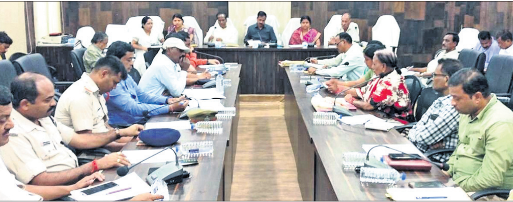
ବୈଠକରେ ଏମ୍ପି, ଜିଲା ପରିଷଦ ସଭାନେତ୍ରୀ, ପୌରାଧିକାରୀ, ଜିଲାପାଳଙ୍କ ସମେତ ଅନ୍ୟମାନେ।

ଦେଈନାଳ ଅଫିସ, ୨୬।୫: ଦେଈନାଳର ପ୍ରସିଦ୍ଧ ରଥଯାତ୍ରାକୁ ଶୁଖିଳିତ କରିବା ନିମନ୍ତେ ଜିଲା କାର୍ଯ୍ୟାଳୟ ସଦ୍‌ଭାବନା ଗୃହରେ ଶୁକ୍ରବାର ପୂର୍ବାହ୍ନ ୧୦ଟାରେ ପ୍ରସ୍ତୁତି ବୈଠକ ଅନୁଷ୍ଠିତ ହୋଇଯାଇଛି। ମହାପ୍ରଭୁ ଶ୍ରୀଜଗନ୍ନାଥଙ୍କ ପବିତ୍ର ଯୋଗଯାତ୍ରା ସମୟରେ ସହରରେ ଆମିଷ ଓ ମଦ ଦୋକାନ ବନ୍ଦ ରହିବ। ଆପରାଧକୁ କାର୍ଯ୍ୟକଳାପ ରୋକିବା ଲାଗି ଗୁରୁତ୍ୱପୂର୍ଣ୍ଣ ସ୍ଥାନରେ ସିପିଡିଇ କ୍ୟାମେରା ଲଗାଯିବ। ଖାଦ୍ୟପଦାର୍ଥ ଯାଞ୍ଚ କଡ଼ାକଡ଼ି କରାଯିବ ବୋଲି ନିଷ୍ପତ୍ତି ହୋଇଛି।