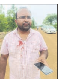
ଆକ୍ରମଣର ଶିକାର ତହସିଲଦାର।

■ ଚଢ଼ାଇ ବେଳେ ମାଟିଆଙ୍କ ଆତଙ୍କରାଜ ■ ଗୋଡ଼ାଇ ପିଟିଲେ, ବର୍ତ୍ତମାନ ଆରମ୍ଭ ■ ୭ ଅଭିଯୁକ୍ତ ଗିରଫ ପୋଲିସର ତନାଘନା