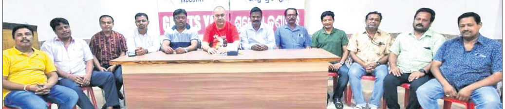
ରକ୍ତଦାନ ଶିବିର ପାଇଁ ଅନୁଷ୍ଠିତ ପ୍ରସ୍ତୁତି ବୈଠକରେ ବାଣିଜ୍ୟ ଓ ଶିଳ୍ପ ପ୍ରତିଷ୍ଠାନର କାର୍ଯ୍ୟକର୍ମୀମାନେ।