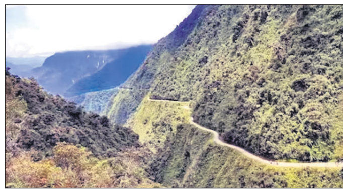
ସଂଯୋଗ କରେ। ୨୦୦୬ ପର୍ଯ୍ୟନ୍ତ ଏହା ଥିଲା। ଖରାପ ପାଗରେ ଲୋକମାନେ ଦୁଇ ସହର ମଧ୍ୟରେ ଏକମାତ୍ର ରାସ୍ତା ଏହି ରାସ୍ତାରେ ବାହାରକୁ ଯାଆନ୍ତି ନାହିଁ।

ବଲିଉଡରେ ରହିଛନ୍ତି ବିଶ୍ୱର ସବୁଠାରୁ ବିପଦଜନକ ରାସ୍ତା। ଏହି ରାସ୍ତାରେ ଗାଡ଼ି ଚଳାଇବା କଣକ ପାଇଁ ଶେଷ ଭ୍ରାତୃଭାବ ହୋଇପାରେ।