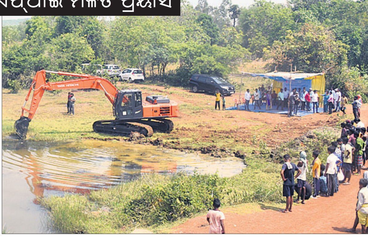
ଧରତ୍ରୀ ଏବଂ ଇଏଫଆଇ ମିଳିତ ସହଯୋଗରେ ଶନିବାର ଆୟୋଜିତ ଖୋର୍ଦ୍ଧା ଜିଲ୍ଲା ମେଣ୍ଟାଣାଳ ପଞ୍ଚାୟତ ଅଧିକାରୀଙ୍କ ସମ୍ମାନ ପୂର୍ବକ ପୂର୍ଣ୍ଣରୂପରେ ଉପସ୍ଥିତ ଅତିଥିଙ୍କୁ।