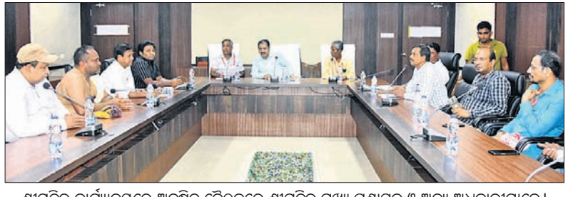
ଶ୍ରୀମନ୍ଦିର କାର୍ଯ୍ୟକ୍ରମରେ ଅନୁଷ୍ଠିତ ହେଉଥିବା ଶ୍ରୀମନ୍ଦିର ମୁଖ୍ୟ ପ୍ରଶାସକ ଓ ଅନ୍ୟ ଅଧିକାରୀମାନେ।

ଶ୍ରୀମନ୍ଦିର ସିଂହଦ୍ୱାର କବାଟ ରୁପା ଛାଉଣି ହେବାକୁ ଯାଉଛି। ଏଥିସହ ମହାପ୍ରଭୁଙ୍କ ଗଜବନ୍ଧ ପଲଙ୍କ ବା ରତ୍ନ ପଲଙ୍କର ମରାମତି ସହ ନୂତନ ପଲଙ୍କ ନିର୍ମାଣ କରାଯିବ।