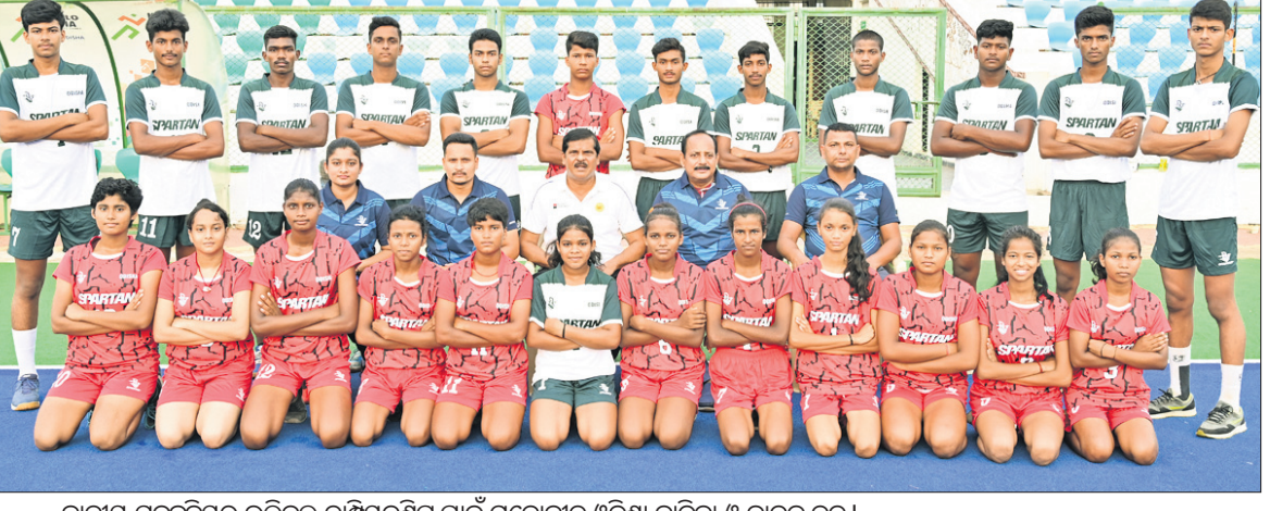
ଜାତୀୟ ସର୍ବଜୁନିୟର ଭଲିବଲ ଚାମ୍ପିୟନଶିପ୍ ପାଇଁ ମନୋନୀତ ଓଡ଼ିଶା ବାଳିକା ଓ ବାଳକ ଦଳ।