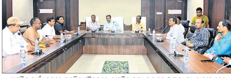
ଶ୍ରୀମନ୍ଦିର କାର୍ଯ୍ୟକ୍ରମରେ ଅନୁଷ୍ଠିତ ବୈଠକରେ ଶ୍ରୀମନ୍ଦିର ମୁଖ୍ୟ ପ୍ରଶାସକ ଓ ଅନ୍ୟ ଅଧିକାରୀମାନେ ।

ଶ୍ରୀମନ୍ଦିର ସିଂହଦ୍ୱାର କବାଟ ରୁପା ଛାଉଣି ହେବାକୁ ଯାଉଛି । ଏଥିପାଇଁ ମହାପ୍ରଭୁଙ୍କ ଉଚ୍ଚବନ୍ଦ ପଲଙ୍କ ବା ରତ୍ନ ପଲଙ୍କର ମରାମତି ସହ ନୂତନ ପଲଙ୍କ ନିର୍ମାଣ କରାଯିବ ।