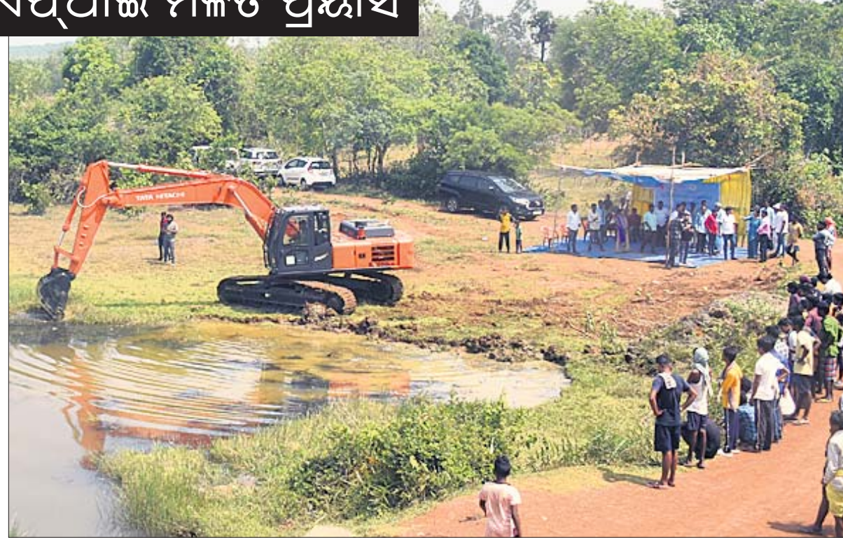
ଧରତ୍ରୀ ଏବଂ ଇଏଫଆଇ ମିଳିତ ସହଯୋଗରେ ଶନିବାର ଆୟୋଜିତ ଖୋର୍ଦ୍ଧା ଜିଲା ମେଣ୍ଟାଣାଳ ପଞ୍ଚାୟତ ଅଧୀନ ହରିଡ଼ାମହା ପୋଖରୀ ପୁନରୁଦ୍ଧାର କାର୍ଯ୍ୟକ୍ରମରେ ଉପସ୍ଥିତ ଅତିଥିମଣ୍ଡଳୀ