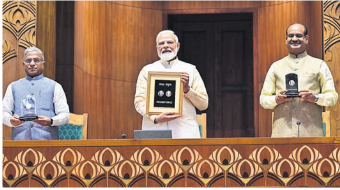
ନୂଆ ସଂସଦ ଭବନ ଉଦ୍ଘାଟନ ଅବସରରେ ପ୍ରଧାନମନ୍ତ୍ରୀ ନରେନ୍ଦ୍ର ମୋଦି ୭୫ ଟଙ୍କିଆ ପୁତ୍ରୀକୁ ଉଦ୍ଘାଟନ କରୁଛନ୍ତି। ନିକଟରେ ଅଛନ୍ତି ଲୋକ ସଭା ବାଚସ୍ପତି ଓମ୍ ବିର୍ଲା ଏବଂ ରାଜ୍ୟସଭା ଉପାଧ୍ୟକ୍ଷ ହରିବଂଶ ନାରାୟଣ ସିଂ।

ପ୍ରତିପଳିତ ହୋଇଥିବାରୁ ପ୍ରଧାନମନ୍ତ୍ରୀ ଏହାର ଭୂୟସୀ ପ୍ରଶଂସା କରିଥିଲେ। ନୂତନ ଭାରତ ଉପନିବେଶୀୟ ମାନସିକତା ଖୋଲିବା ନୂଆ ଯାତ୍ରା ଆରମ୍ଭ କରିଛି। ଆଗାମୀ ୨୫ ବର୍ଷରେ ଅର୍ଥାତ୍ ୨୦୪୭ରେ ଭାରତ ସ୍ୱାଧୀନତାର ଶହେ ବର୍ଷ ପୂର୍ତ୍ତିପାଳନ କରିବ। ୧୯୨୨ରେ ଶେଷ ହୋଇଥିବା ମହାତ୍ମା ଗାନ୍ଧୀଙ୍କ ଅସହଯୋଗ ଆନ୍ଦୋଳନ ଏବଂ ଦେଶର ସ୍ୱାଧୀନତା ମଧ୍ୟରେ ୨୫ ବର୍ଷର ଅନ୍ତ ଥିଲା। ଗାନ୍ଧିଜୀଙ୍କ ଆନ୍ଦୋଳନ ଦେଶବାସୀଙ୍କ ମଧ୍ୟରେ ନୂତନ ଚେତନା