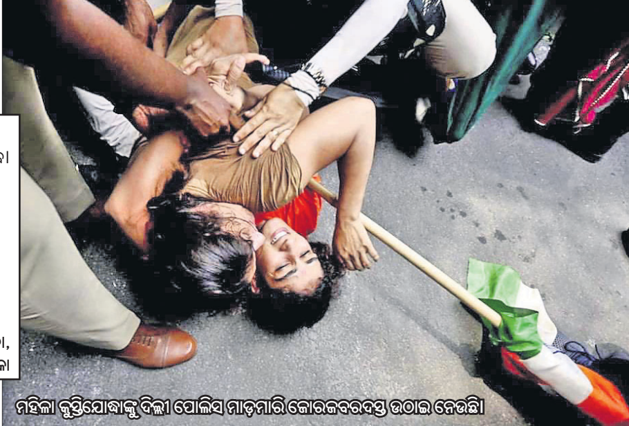
ମହିଳା କୁସ୍ତିଯୋଦ୍ଧାଙ୍କୁ ଦିଲ୍ଲୀ ପୋଲିସ୍ ମାଡ଼ମାରି ଜୋରଜବରଦସ୍ତ ଉଠାଇ ନେଉଛି।

ଖେଳାଳିଙ୍କ ଛାତିରେ ଥିବା ମେଡାଲ ଆମ ଦେଶର ଗୌରବ। କିନ୍ତୁ ଭାଜପା ସରକାରର ଅହଂକାର ଏତେ ବଡ଼ିଯାଇଛି ଯେ ମହିଳା ଖେଳାଳିଙ୍କ ସ୍ୱରକୁ ନିର୍ମମ ଭାବେ ବୁଦ୍ଧି ତଳେ ଦଳି ଦିଆଯାଇଛି। ସାରା ଦେଶ ସରକାରଙ୍କ ଅହଂକାର ଓ ଅନ୍ୟାୟକୁ ଦେଖୁଛି। -ପ୍ରିୟଙ୍କା ଗାନ୍ଧୀ ଭଦ୍ରା, କଂଗ୍ରେସ୍ ସାଧାରଣ ସମ୍ପାଦିକା