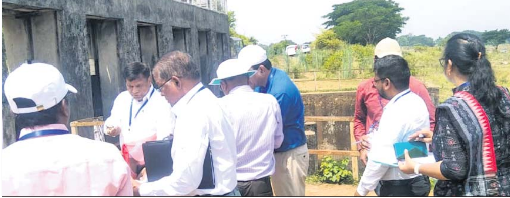
ବାଳକାଟୀସ୍ଥିତ ସାଇଫନ ନିକଟରେ ସ୍ଥିତି ପରଖିଛି ତ୍ରିଭୁବନାଳ ଟିମ୍ ।