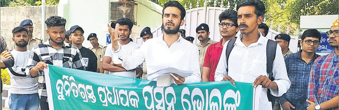
ରାଉରକେଲା ଇସ୍ତାଫା ଦାଖଲ ପାଇଁ ଲୋକମାନଙ୍କର ଜଣେ ଅଧ୍ୟାପକ ଛାତ୍ରାଳୟ ମାନସିକ ନିର୍ଯାତନା ଦେବା ସହ ବ୍ୟାପକ ଦୁର୍ନୀତିରେ ସମ୍ପୂର୍ଣ୍ଣ ଥିବା ଅଭିଯୋଗ ଆଣି ଛାତ୍ରାଳୟମାନେ ରବିବାର ଭୁବନେଶ୍ୱରସ୍ଥିତ ଉଚ୍ଚଶିକ୍ଷା ମନ୍ତ୍ରୀ ରୋହିତ ପୂଜାରୀଙ୍କ ସରକାରୀ ବାସଭବନ ସମ୍ମୁଖରେ ବିକ୍ଷୋଭ ପ୍ରଦର୍ଶନ କରୁଛନ୍ତି ।