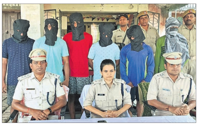
ଗିରଫ ଅଭିଯୁକ୍ତ ।