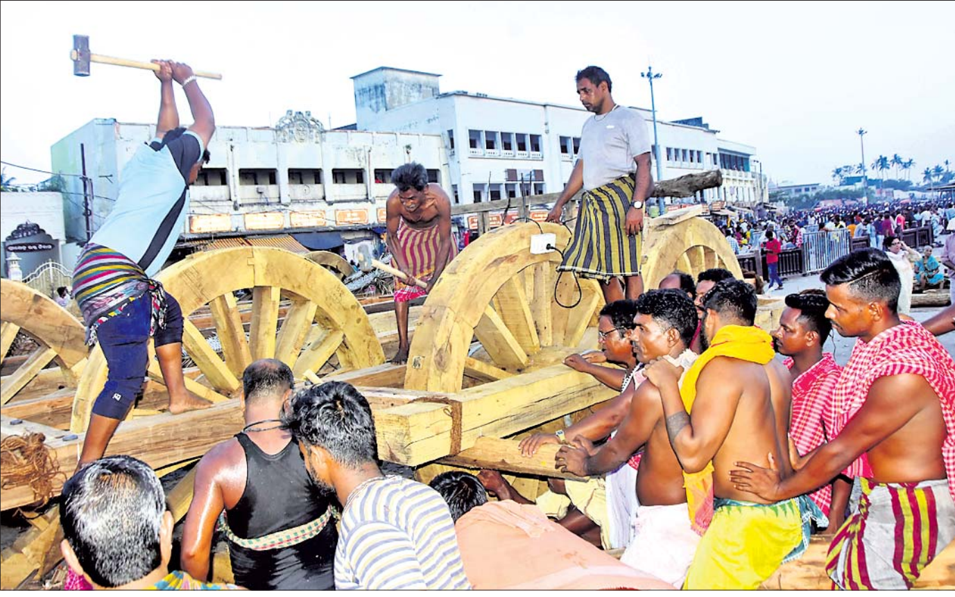
ମହାପ୍ରଭୁଙ୍କ ବିଶ୍ୱପ୍ରସିଦ୍ଧ ଯୋଗଯାତ୍ରା ପାଇଁ ସମ୍ପ୍ରତି ପୁରୀର ଅଗାଧ ରଥଖଳାରେ ତିନି ରଥର ନିର୍ମାଣ କାର୍ଯ୍ୟ ଜାରି ରହିଛି । ରବିବାର ରଥରେ ଦଣ୍ଡାକଣ୍ଠା ପିଟାଯାଇଛି ।