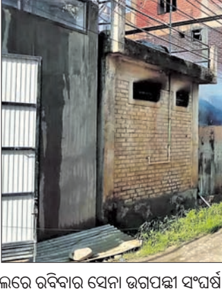
ଇମ୍ଫାଲରେ ରବିବାର ସେନା ଉଗ୍ରପକ୍ଷୀ ସଂଘର୍ଷ ବେଳେ ଲାଗିଥିବା ନିଆଁକୁ ଲୋକେ ଲିଭାଇଛନ୍ତି।

ଅନୁସୂଚିତ ଜନଜାତି ମାନ୍ୟତା ଦେବା ନିଷ୍ପତ୍ତି ବିରୋଧ କରି କୁଳ ଆଦିବାସୀ ସମ୍ପ୍ରଦାୟ ବିରୋଧ କରିବାକୁ ହିଂସା ଚଳାଇଛନ୍ତି।