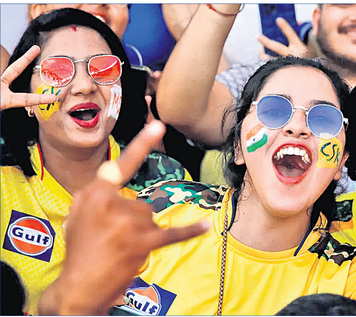
ଚେନାଇ ସୁପର କିଙ୍ଗ୍ସ ଦୁଇ ମହିଳା ସମର୍ଥକ।