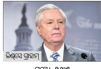
ଲିଙ୍କ୍ସେ ଗ୍ରାହମ୍ ମସ୍କୋ, ୨୯:୫୫

ଆମେରିକା ସିନେଟର ଲିଙ୍କ୍ସେ ଗ୍ରାହମ୍ ରୁଷିଆ ଗୃହମନ୍ତ୍ରଣାଳୟ ଖୁଣ୍ଟିତ ଚାଲିକାରେ ରହିଛନ୍ତି। ଗତ ଶୁକ୍ରବାର ଗ୍ରାହମ୍ ଯୁକ୍ତରାଷ୍ଟ୍ର ରାଷ୍ଟ୍ରପତି ଭେଲୋଡିନିଙ୍କୁ ଟେକିଥିଲେ।