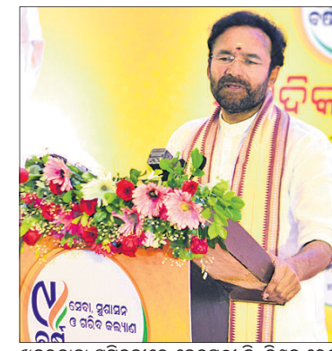
ଖବରଦାତା ସମ୍ମିଳନୀରେ କେନ୍ଦ୍ରମନ୍ତ୍ରୀ ଜି. କିଶନ ରେଡ୍ଡି।

ପ୍ରଧାନମନ୍ତ୍ରୀ ନରେନ୍ଦ୍ର ମୋଦିଙ୍କ ନେତୃତ୍ୱରେ ଗତ ୯ ବର୍ଷ ଧରି ଦେଶରେ ଏକ ଭ୍ରଷ୍ଟାଚାର ମୁକ୍ତ ସରକାର ଘୋଷଣା କରିବା ସହ ବିକାଶର ଅନେକ ମାପଦଣ୍ଡରେ ବେଶକୁ ଆଣିବାରେ ସକ୍ଷମ ହୋଇଛନ୍ତି।