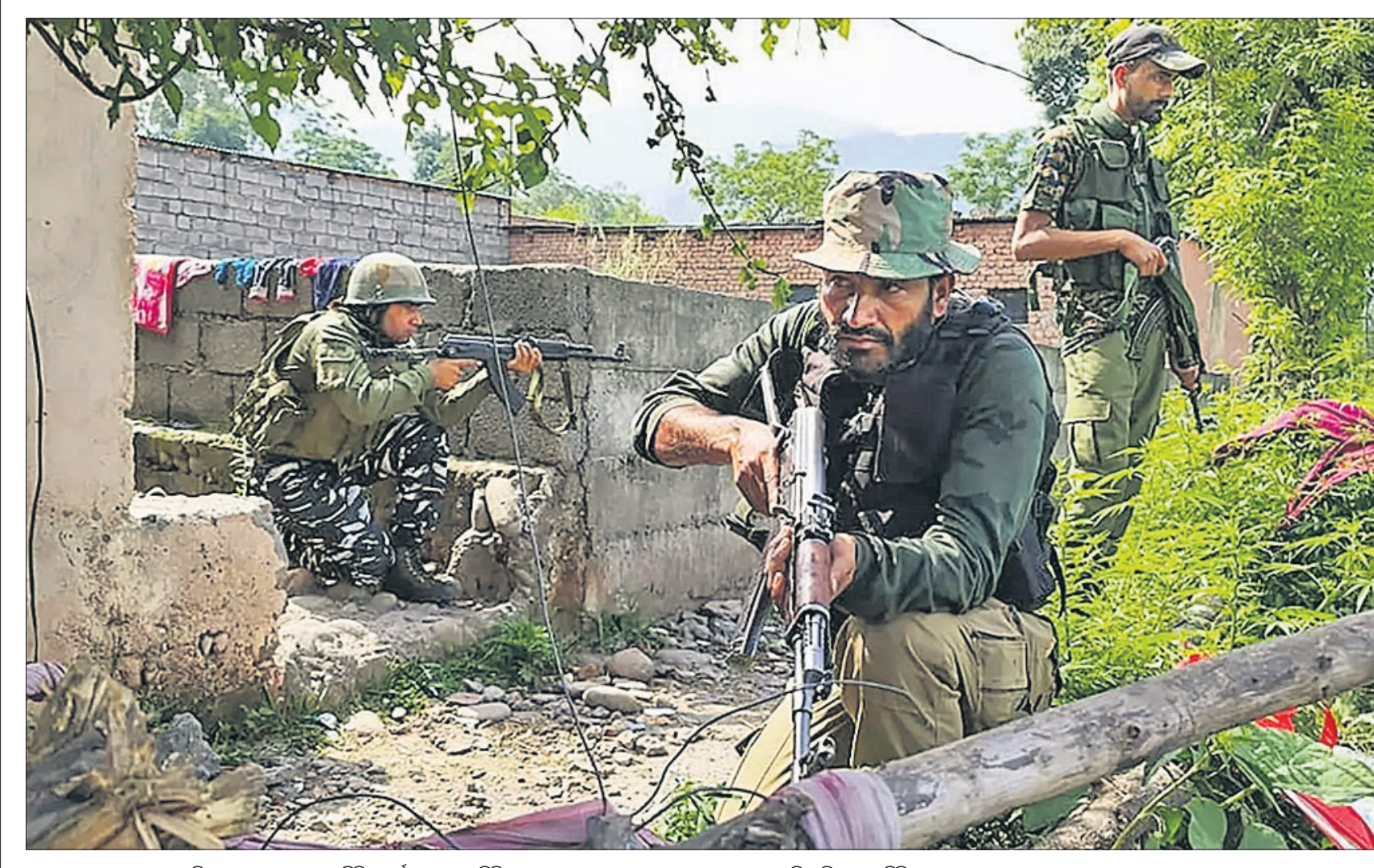
ଜଣ୍ଟ-କଣ୍ଟ୍ରୋଲର ପୁଞ୍ଜର ସହିତ ଆତଙ୍କବାଦୀଙ୍କ ଉପରୁ ସମ୍ପର୍କରେ ସୂଚନା ମିଳିବା ପରେ ସୁରକ୍ଷା ବଳ ପକ୍ଷରୁ ସାମାଜିକ ଚଳାଣି ଅଭିଯାନ ଚାଲିଛି।