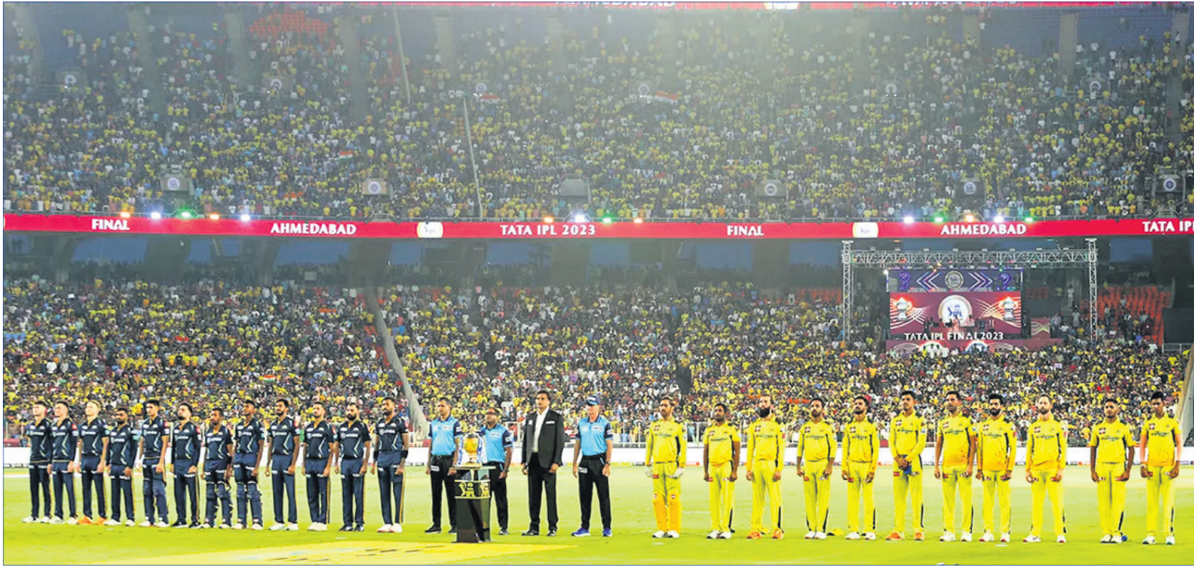
ଷ୍ଟାଡ଼ିୟମରେ ଭରପୂର ଦର୍ଶକଙ୍କ ଉପସ୍ଥିତିରେ ମ୍ୟାଚ ଆରମ୍ଭ ପୂର୍ବରୁ ଦୁଇ ଦଳର ଖେଳାଳି ଓ ଅଫିସିଆଲ।