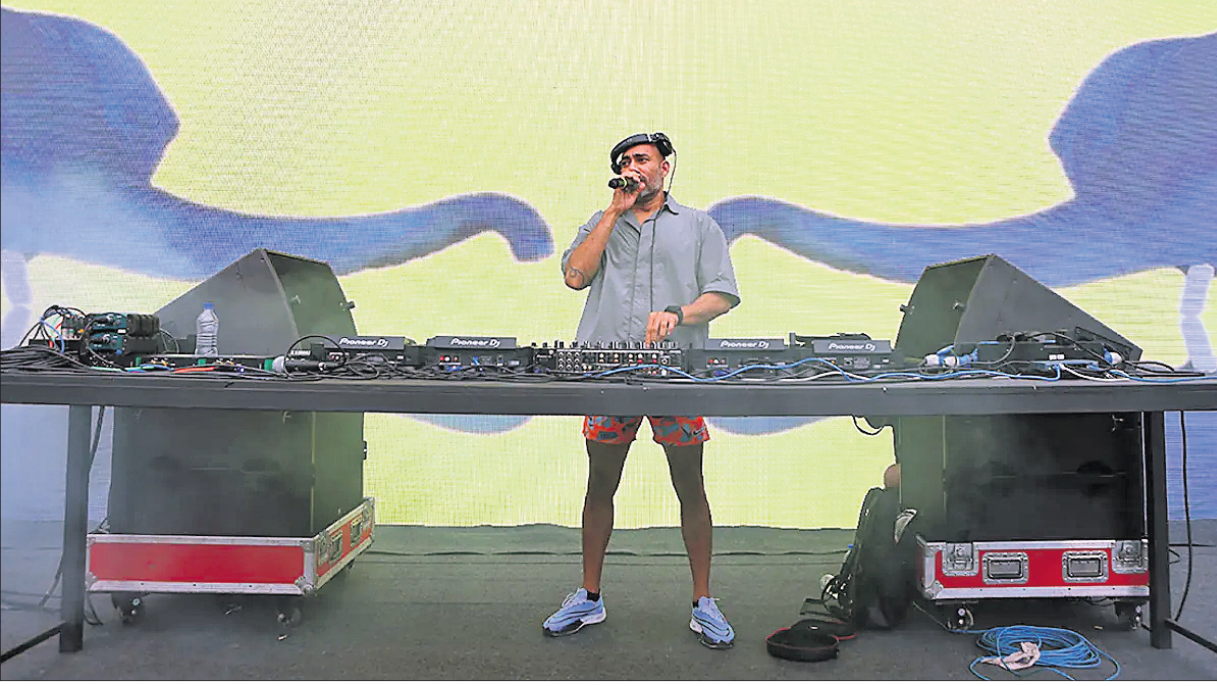
ଆଇପିଏଲ୍ ଉତ୍ସାହୀନୀ ଉତ୍ସବରେ କାର୍ଯ୍ୟକ୍ରମ ପରିବେଷଣ କରୁଛନ୍ତି ତିନେ ନ୍ୟୁକ୍ଲେୟା ଓ ରାପର କିଙ୍ଗ୍।