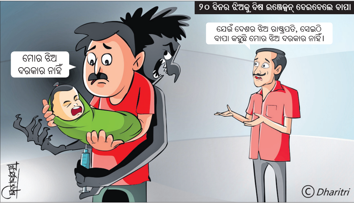
୨୦ ଦିନର ଝିଅକୁ ଦିଶ ଇଞ୍ଜେକ୍ସନ୍ ଦେଇଦେଲେ ବାପା