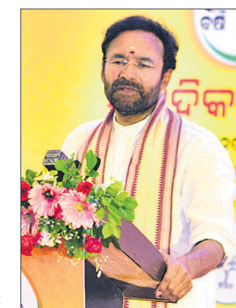
ଖବରଦାତା ସମ୍ମିଳନୀରେ କେନ୍ଦ୍ରମନ୍ତ୍ରୀ କି. କିଶନ ରେଞ୍ଜୀ ।

ପାଇଁ ବୋଲି ସେ ତଥ୍ୟ ଦେଖାଇଛନ୍ତି । ପ୍ରଧାନମନ୍ତ୍ରୀ ମୋଦିଙ୍କ ଶାସନ ୯ ବର୍ଷ ପୂରଣ କରିଥିବାରୁ କଂଗ୍ରେସ ଗତ ସପ୍ତାହରେ ମୂଲ୍ୟବୃଦ୍ଧି, ବେକାର ସଂଖ୍ୟା ପତନୀ ଇତ୍ୟାଦି ସହିତ ଏହି ସମୟ ମଧ୍ୟରେ