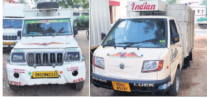
ଜବତ ହୋଇଥିବା ଗୋରୁ ବୋହେଇ ତୁଳ ଗାଡ଼ି।

ବେଗୁନିଆ, ୨୯୫୫(ଡି.ଏନ୍.ଏ.): ଗତ କିଛିଦିନ ବ୍ୟବଧାନ ପରେ ପୁଣି ବେଗୁନିଆ ଥାନା ଅଞ୍ଚଳରେ ପୁଣି ଗୋଗାଳାଶକାରୀ ସକ୍ରିୟ ହୋଇଛନ୍ତି।