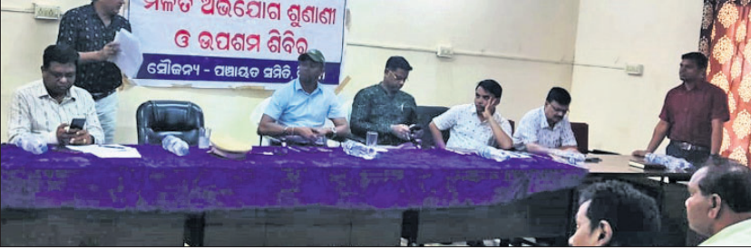
ଜନଶୁଣାଣି ଶିବିରରେ ଉପସ୍ଥିତ ଅଧିକାରୀ ଏବଂ ଅନ୍ୟମାନେ।