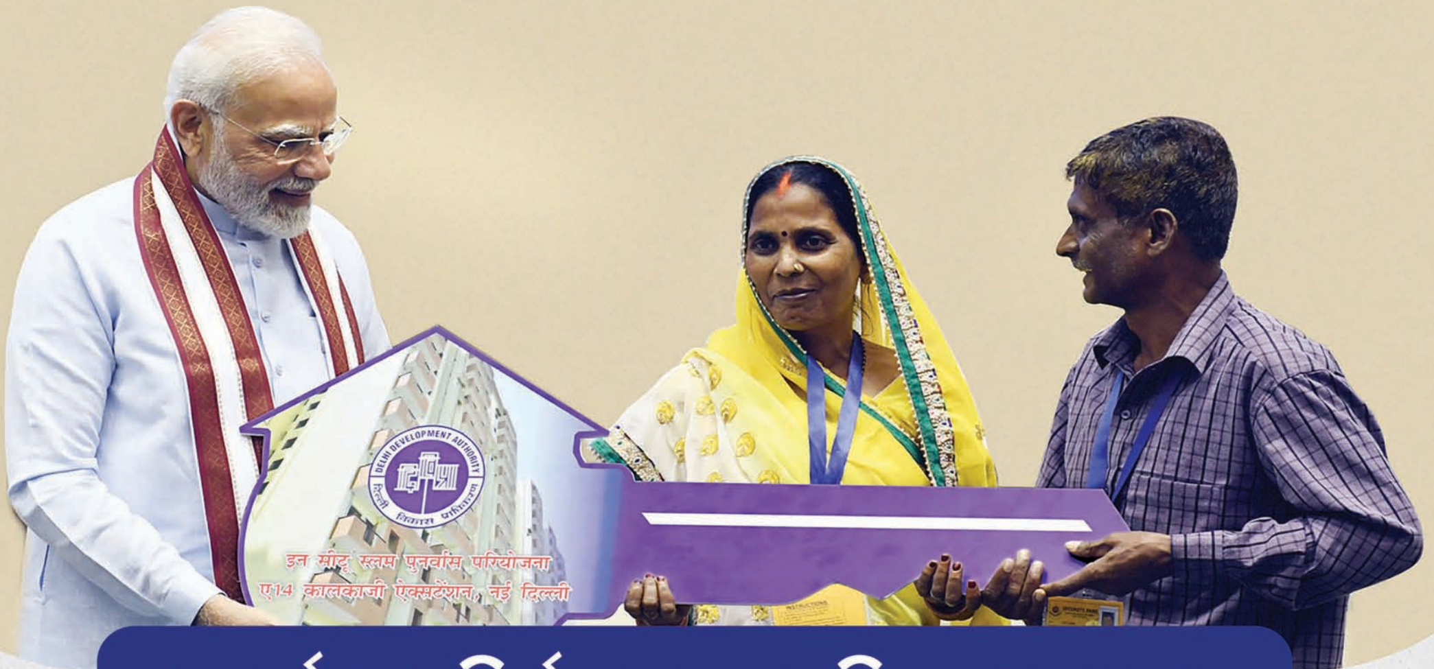
उन साहू स्वल्प पुनर्वासि परियोजना ए-14 कालकाजी एक्सप्रेसवे, नई दिल्ली