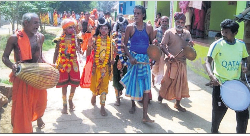
ବୋଲଗଡ଼: ଠେଣାପଲ୍ଲୀରେ ମଙ୍ଗଳା ମନ୍ଦିର ପ୍ରତିଷ୍ଠା ଉତ୍ସବ ଅବସରରେ ଅନୁଷ୍ଠିତ କଳ୍ପ ଶୋଭାଯାତ୍ରା।