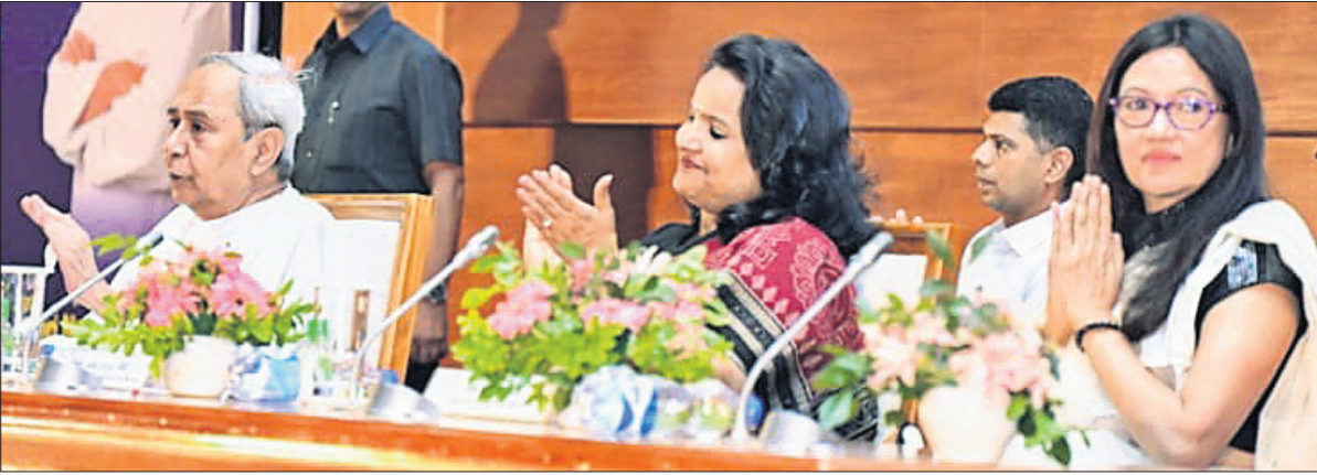
'ଓଡ଼ିଶା ଫର୍ ଏଆଇ, ଏଆଇ ଫର୍ ମୁଥ୍' କାର୍ଯ୍ୟକ୍ରମ ଉଦ୍ଘାଟନ ଅବସରରେ ପୁଖ୍ୟମନ୍ତ୍ରୀ ନବୀନ ପଟ୍ଟନାୟକ ଓ ଅନ୍ୟମାନେ।

ଭୁବନେଶ୍ୱର, ୨୯୮୫(ବୁଧବେଳା) କୃତ୍ରିମ ବୁଦ୍ଧିବାଦୀ ବା ଆର୍ଟିଫିସିଆଲ୍ ଇଣ୍ଟେଲିଜେନ୍ସ (ଏଆଇ) କ୍ଷେତ୍ରରେ ଓଡ଼ିଶା ବଡ଼ ପଦକ୍ଷେପ ନେଇଛି।